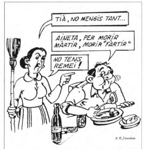
Els que no se saben retenir, prest o tard paguen les conseqüències

És evident que la institució familiar, en general, per tot arreu, perd crèdit. A Montuïri i tot de cada dia hi ha més joves que prefereixen estar