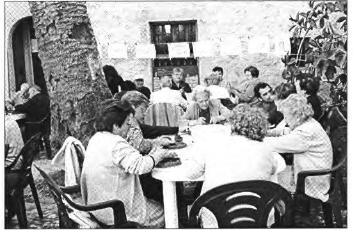
El taller de talaiots entretingué les persones de Tercera Edat