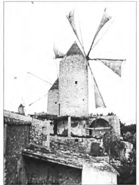
Molí den Perons (1920)

Aquell cor musti ja medra, ja no plora com primer, sols record de l'amor té ja es sortit d'aquella veda.