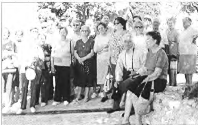
Dia 6 els participants a l'assemblea del Patronat ja es lamentaren L'excursió cultural de Gent Gran a Capdepera fou interessant