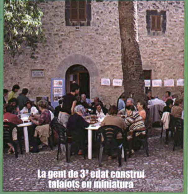
La gent de 3ª edat construí talaiots en miniatura