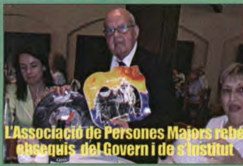
L'Associació de Persones Majors rebé obsequis del Govern i de s'Institut