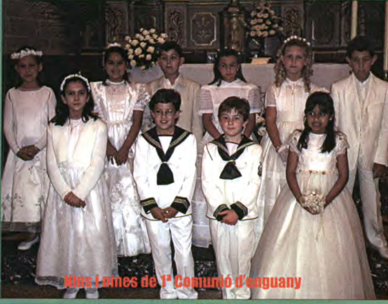
Niños i nines de 1ª Comunió d'enguany