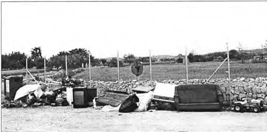
Panorama que ofería s'Amarador un dels dilluns de maig passat