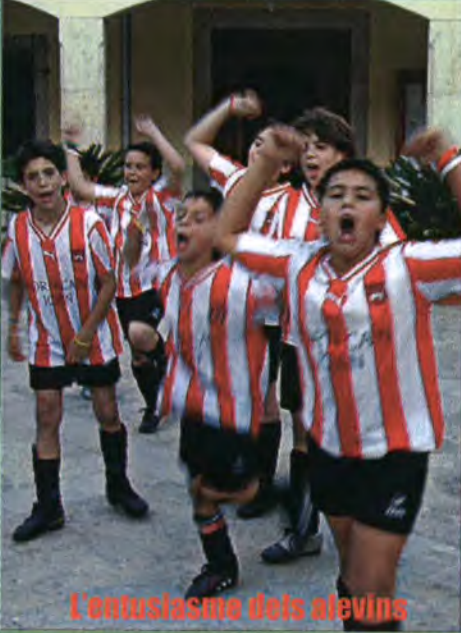
L'entusiasme dels atleves