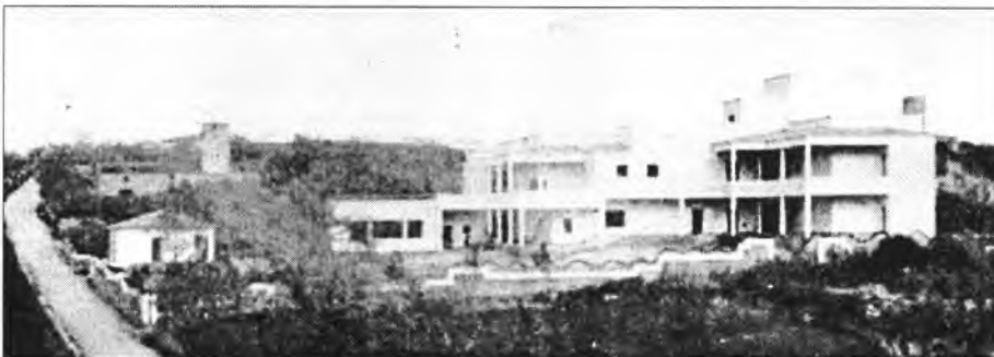
Mostra d'arquitectura racionalista (Foto dels dies de la inauguració)