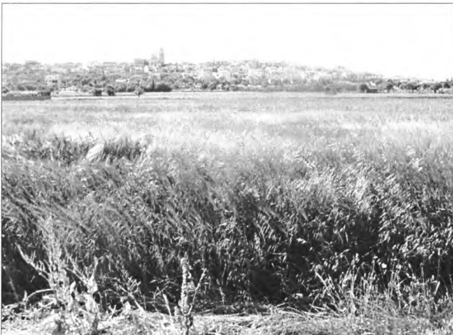
Pels voltants de la vila ja comencen a collir ordi i al dir dels pagesos ha granat bé

El fet és que d'enrere va ploure bastant i el terreny està amarant.