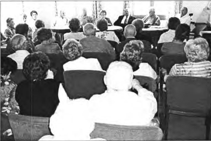
L'Assemblea de Persones Majors fou interessant