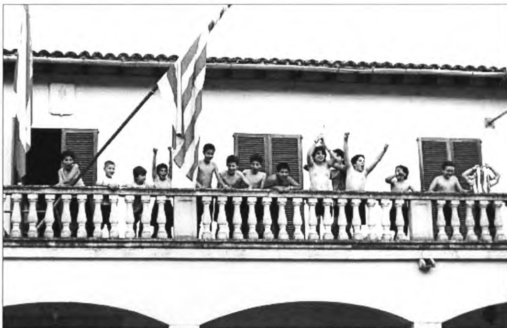
Una vegada haver-se proclamat campions de grup, els alevins de futbol 7 pujaren a la balconada de l'ajuntament de d'on exterioritzaren el seu goig

amb els millors dels altres grups i posteriorment de