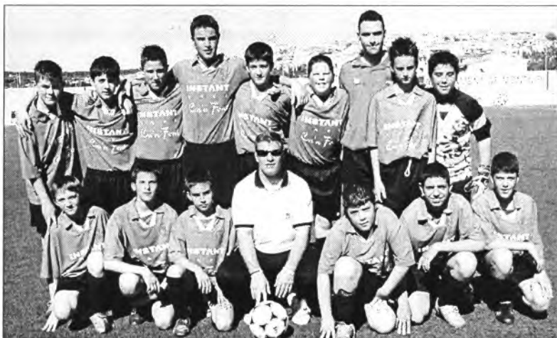
L'infantil Petra amb els montuïrers un dia del mes passat que jugava en Es Revolt

Després d'aquest partit el Montuïri aleví assolia el campionat del seu grup i a la setmana següent començava la fase final de Mallorca i de la Comunitat.