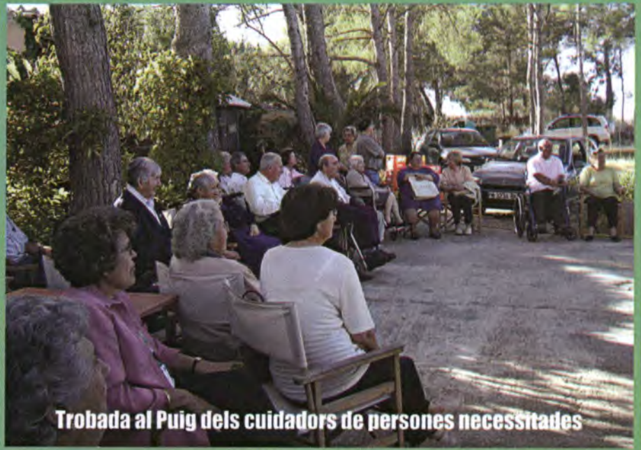
Trobada al Puig dels cuidadors de persones necessitades