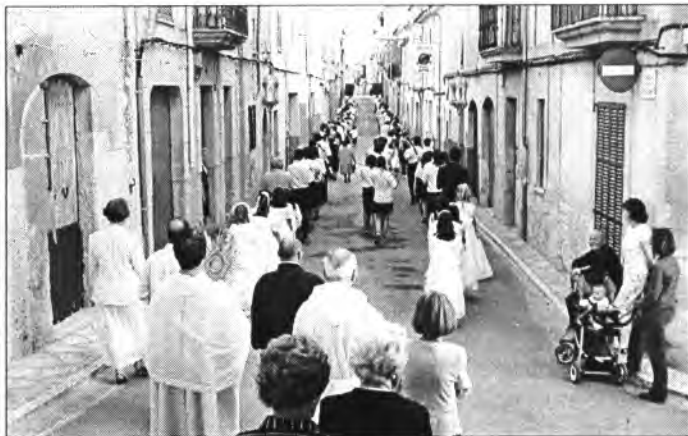
La processó del Corpus, enguany fou una vegada més expressió del sentit cristià del poble