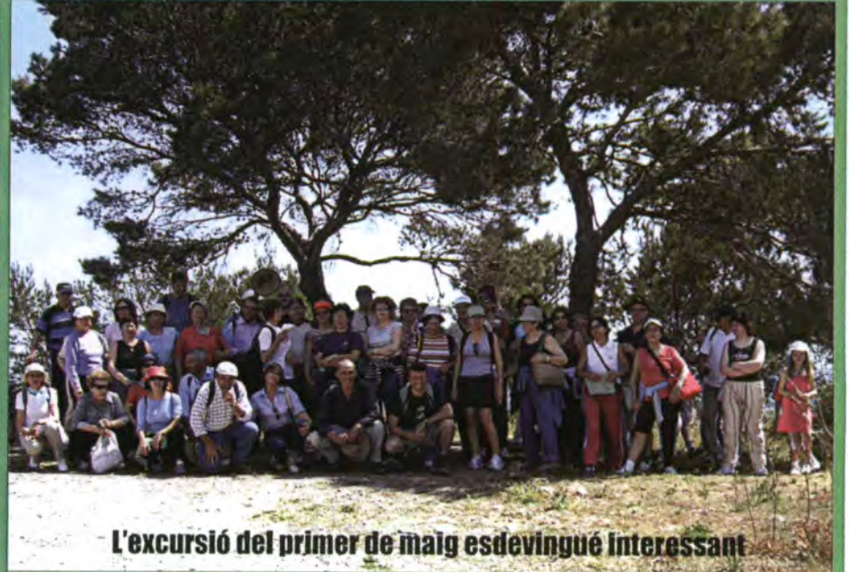
L'excursió del primer de maig esdevingué interessant