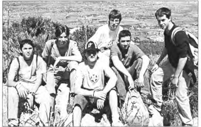
Grup de joves que participà a l'excursió del 1r de maig

Coincidint en la festa dels Museus, l'Ajuntament de Montuïri conjuntament amb els responsables del Museu des Fraret varen realitzar una jornada de portes obertes, la qual es va veure ampliada amb un taller de fang duit a terme davant ca s'Escola. Aquest acte que va tenir lloc el dimecres 18 de maig i va comptar amb la participació d'unes cinquanta persones majors