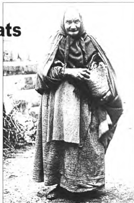
Dona montuïrera de principis del segle passat amb vestimenta de l'època

Les dones: gipó d'estam torçut o de cotonet, mànegues, calces, xochins o sabates, falces d'indiana, rebosillo de filadís i seda amb randa que podia esser blanc, enagos (enagües), davantal, etc.