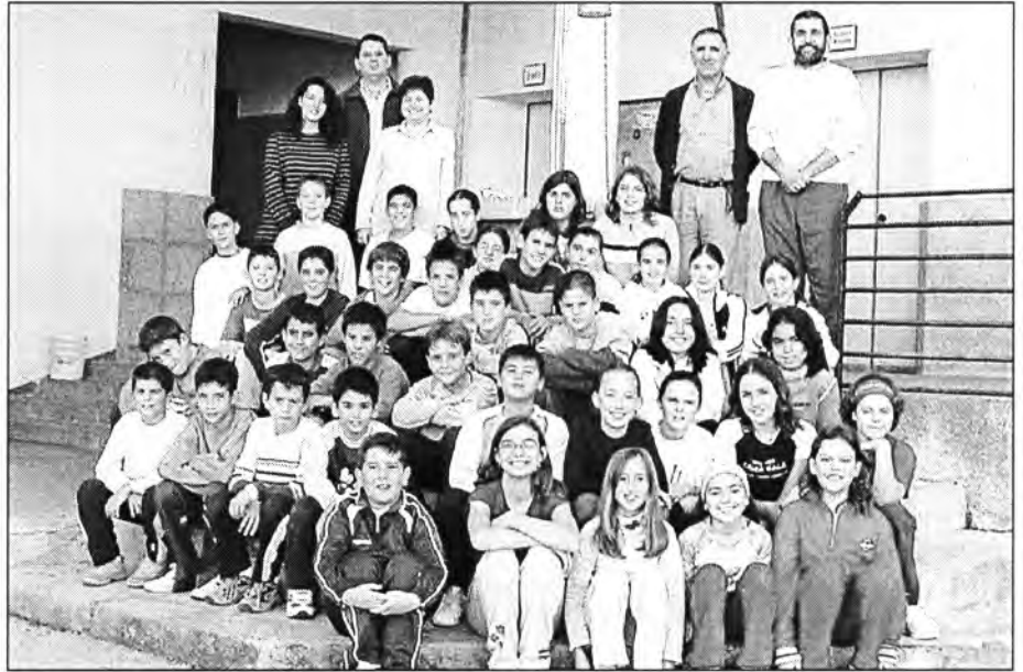
Alumnes que enguany han cursat el tercer cicle en el Col·legi Joan Mas i Verd, dels quals els de 6è el pròxim curs aniran a un altre centre