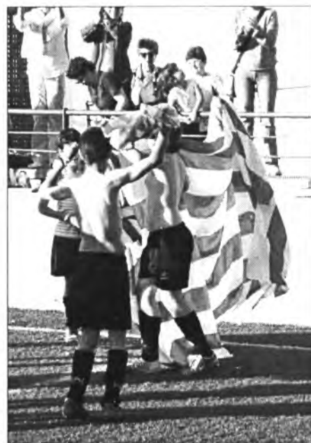
L'alegria fou desbordant quan els alevins assoliren el campionat

En el poema hi podem esbrinar alguns detalls preciosos. Fixau-vos en la primera estrofa: parla del porter que ha encaixat el gol i de la seva desolació. I del toquet a l'esquena del company que vol que tot d'una reaccionï pel bé de l'equip ja que "li descobreix els ulls tots plens de llàgrimes". La restauració de l'harmonia interna i de grup és bàsica per-