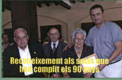
Reconeixement als socis que han complert els 90 anys