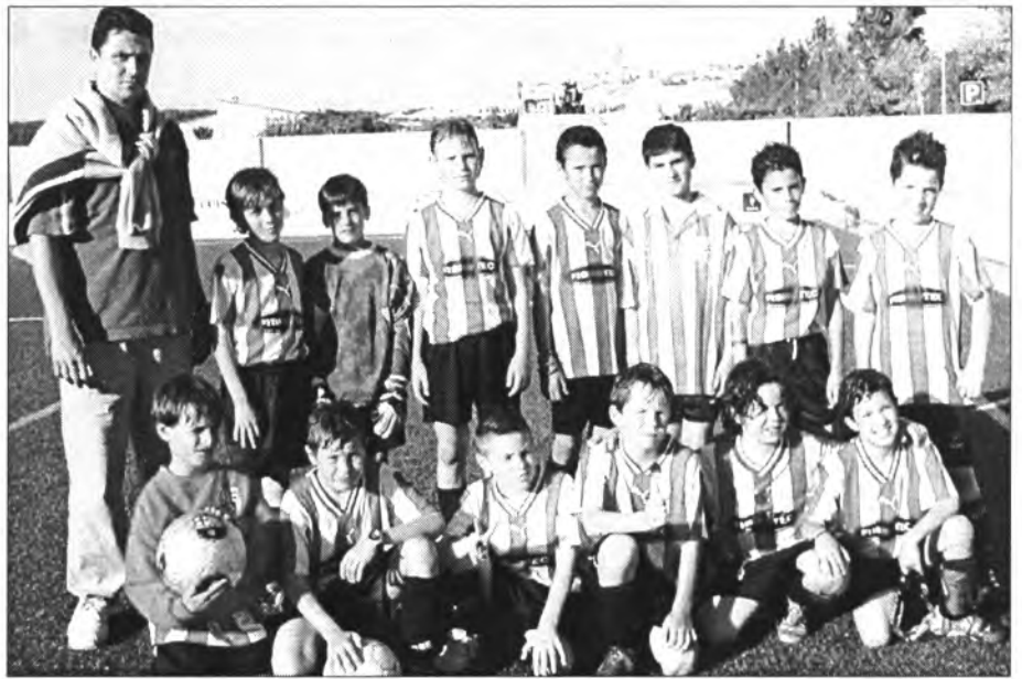
El Montuïri Benjamí amb el seu entrenador

Després que el Montuïri obtingués una avantatge de 0-2 encara es va veure remuntat pel Manacor a la mitja hora de la primera part, si bé ja fou en el darrer minut del partit quan el resultat assolí el 4-2 definitiu.