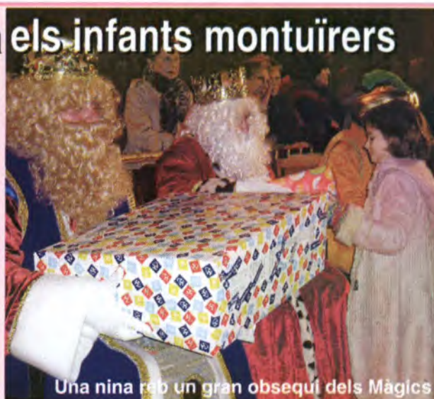
Una nina reb un gran obsequi dels Màgics