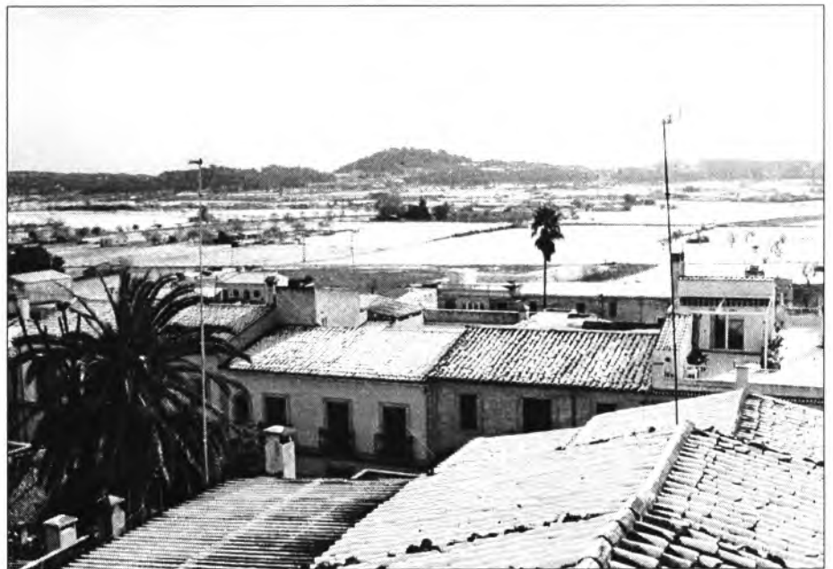
Així es veien els camps entre Montuiri i el Puig de Sant Miquel dia 26 de gener passat