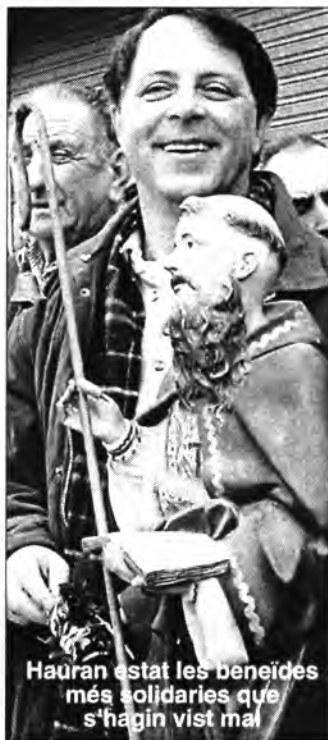
Hauran estat les beneïdes més solidaries que s'hagin vist mai

Aquesta climatologia i ben estar contrasta amb el que han passat pel sud-est asiàtic, amb el violent terratrèmol o tsumani . Hem pogut veure per TV la gran destrossa que ha causat en un ampli radi d'acció. Es contenen