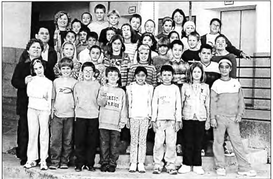
Alumnes del Col·legi "Joan Mas i Verd" del curs 2004-2005, amb els seus professors, corresponents al segon cicle de Primària