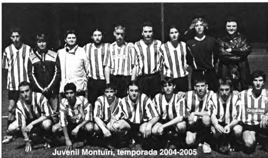
Juvenil Montuïri, temporada 2004-2005