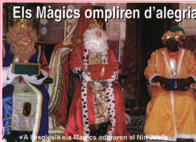
A l'església els Màgics adoraren al Nin Jesús