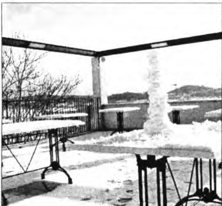
Fins i tot monejats de neu es féren a la terrassa de can Xorri!

El director de Bona Pau en va fer 80 i n'hi haurien de quedar 80 més.