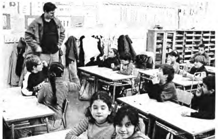
Nins amb el regidor de Medi Ambient exposant-li la seva visió