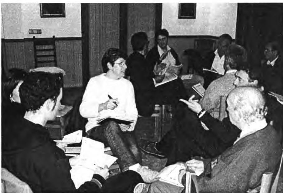
En el Forum ciutadà es pretén identificar la majoria dels punts febles el poble

Però com que no hi ha un problema que no en dugui un altre, veurem com la cosa no acaba aquí. Els esmentats veïnats de la zona s'han reunit, darrerament, amb el batlle per solucionar aquest problema, que més que problema ho podríem anomenar infraacció , a veure si així, aquest assumpte, pren un to més seriós. Sembla, però, que el primer representant del nostre poble té molta feina i no pot estar pels nostres veïnats de la mateixa manera que ho fa amb altres, això es tradueix en