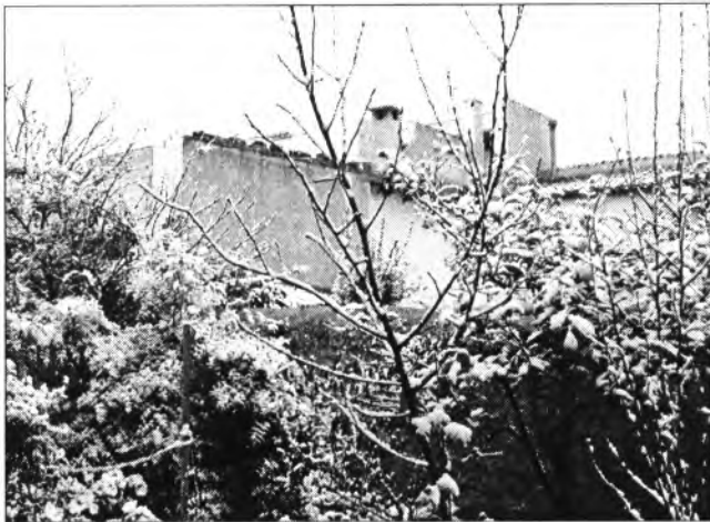
Panorama nevat que contemplàvem des d'on feim Bona Pau ↑ i aspecte que oferia la Plaça de les Tres Creus en el moment que estava nevant dia 26 →