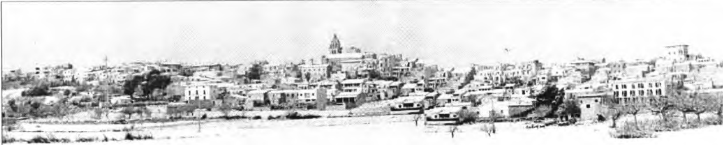
Aspecte que oferia Montuïri nevat, dia 26 de gener de 2005