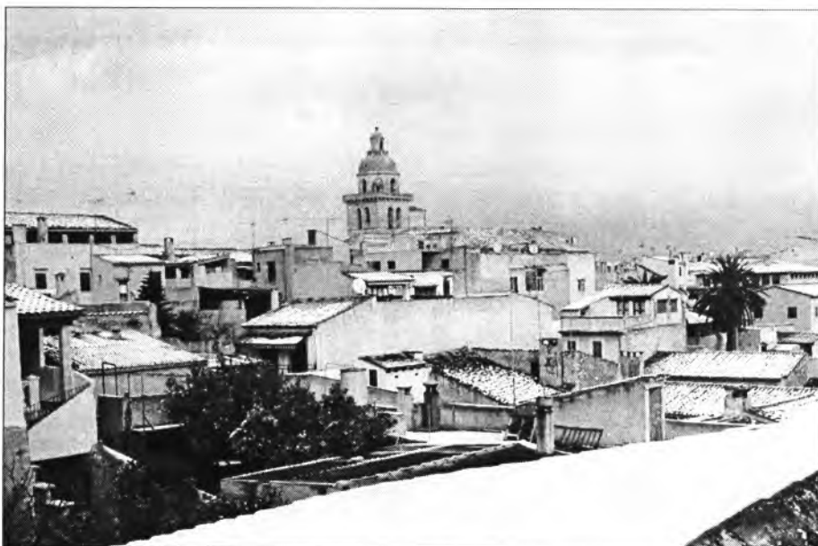
Montuïri nevat, dia 27 de gener de 2005

5- Es DAU sempre ha servir per jugar i practicar El JOC. No tothom practica un esport regulat, està federat, ni tampoc pertany a un club esportiu per poder fer ús de les instal·lacions esportives de Es REVOLT.