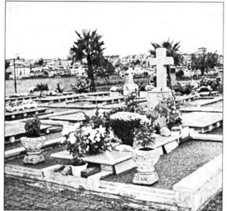
Montuïri se'n recorda dels seus difunts. Una de les tombes del cementiri nou