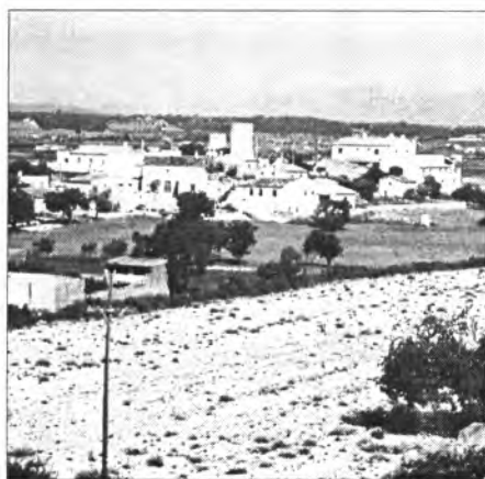
Els voltants del Molí den Gospet solen ser terres bones tant de seca com de reguiu. Però enguany les tempestes

Ara potser els preus apugin, però els hortolans no en trauran profit ja que fins d'aquí a uns mesos poca cosa tindran per vendre.