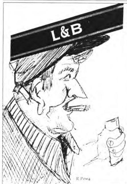
En Franco de Montuïri

10 partits ha aconseguit 4 gols, els alevins en 4 partits n'han fet 28. I ja es parla de permutar els entrenadors!