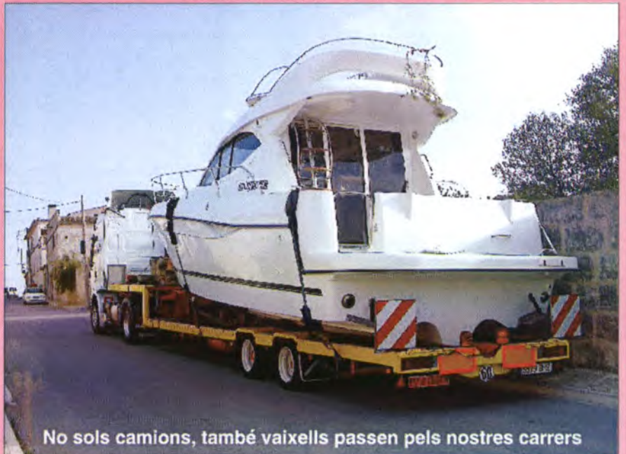
No sols camions, també vaixells passen pels nostres carrers