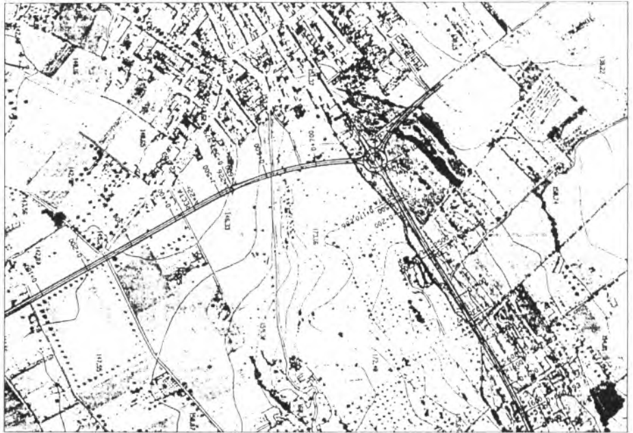
↑ Els tècnics del Consell de Mallorca han redactat el plànol de l'avantprojecte del que seria la futura ronda de circumval·lació que solucionaria el pas de vehicles pesats per dins el casc urbà