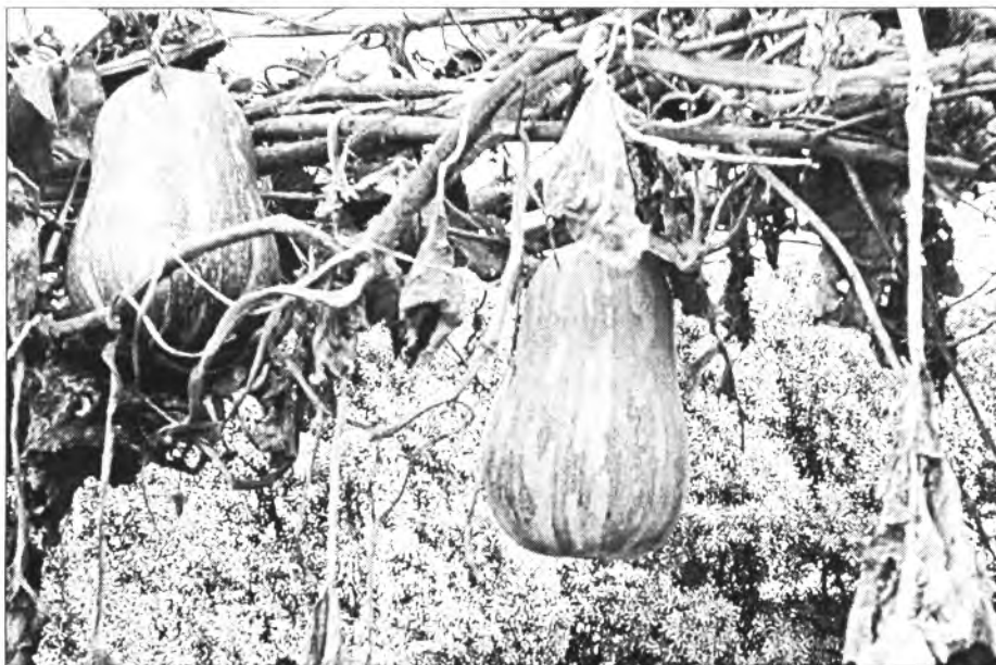
La carabassera enfilada

Aquest fet durant els mesos d'agost i setembre bastants d'any passa el mateix. El motiu; ens trobam a la plena de les recollides de melons síndries, tomaques, pebres, mongeta tendra i altres verdures, i clar si n'aboquen a balquena els