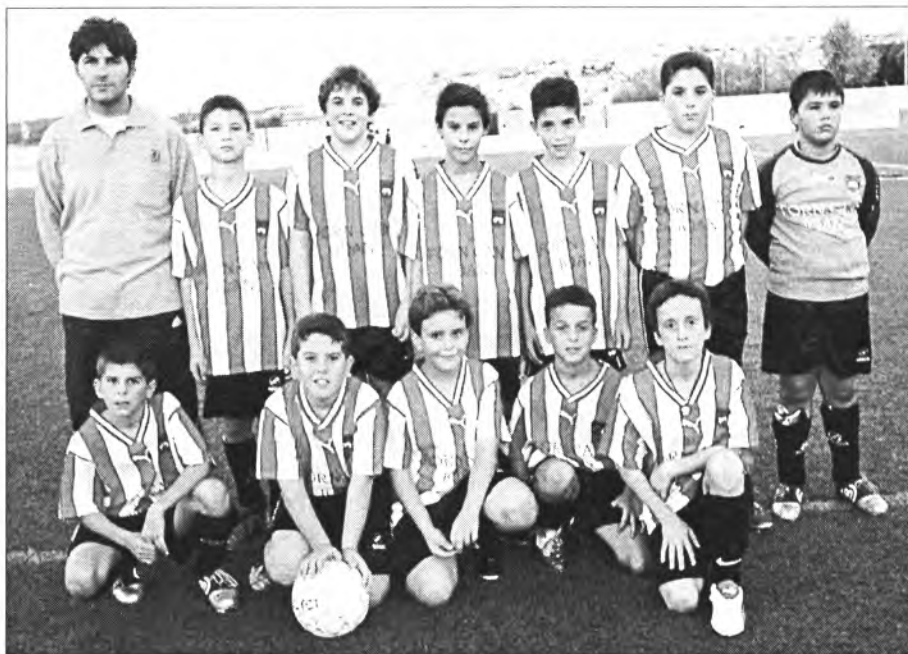
L'equip d'Alevins d'aquesta temporada. Quatre partits, quatre victòries

El Montuïri lluità amb el desig de fer-se amb el partit però els de Sóller es mostraren millors dins el camp amb un bon joc. Els sollerics marcaren primer i al minut d'haver aconseguit l'empat, el Montuïri, els sollerics ja tornaren avançar-se i poc després el tercer gol resolva definitivament l'encontre.