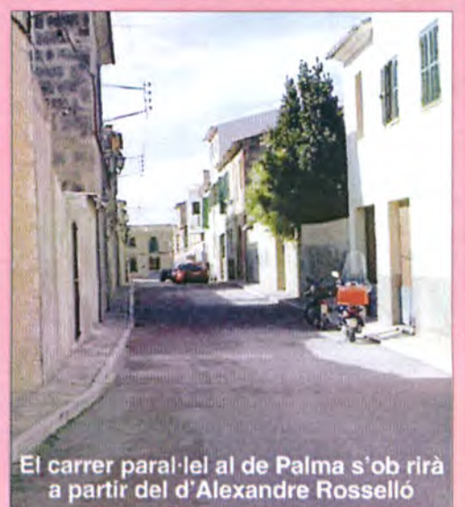
El carrer paral·lel al de Palma s'obrirà a partir del d'Alexandre Rosselló