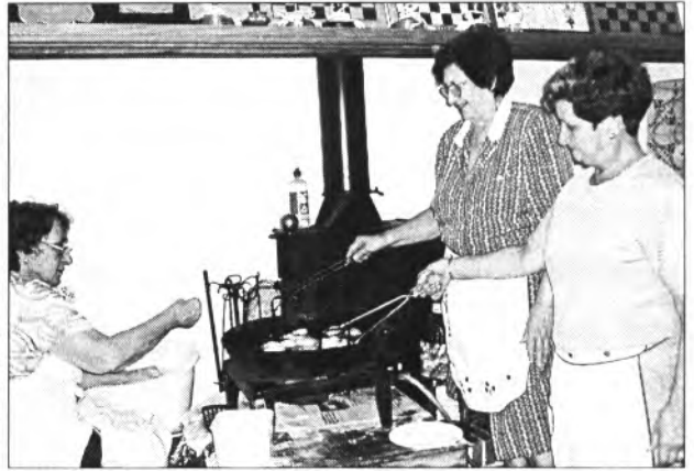
Les tres bunyoleres de la nit de Verges en el Club de Majors →