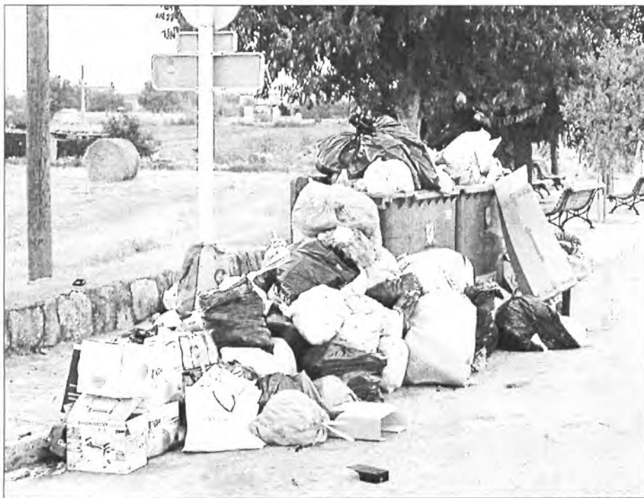
Imatge que oferia als voltants del Pou del Rei el 25 d'agost passat, dilluns de Sant Bartomeu, damunt les dues del migdia