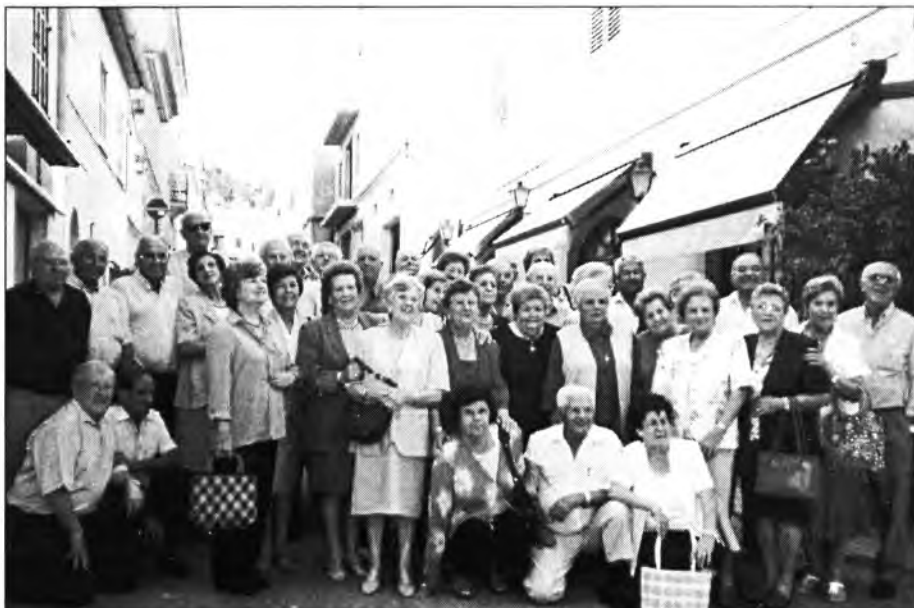
Els montuïrers que enguany compleixen els setanta anys ho volgueren celebrar efusivament dia 10 del passat octubre. Sols en mancaren 4 i 6 que ja ens han deixat