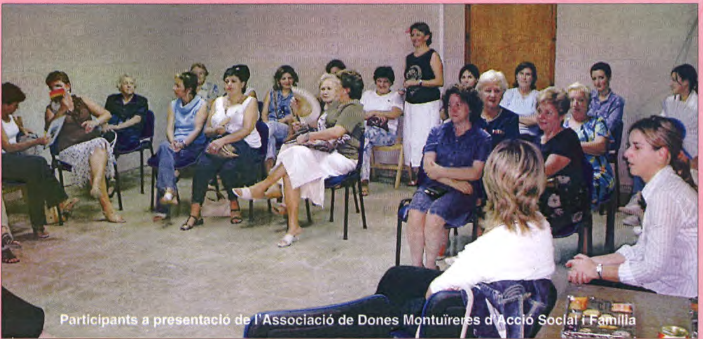
Participants a presentació de l'Associació de Dones Montuïeres d'Acció Social i Família