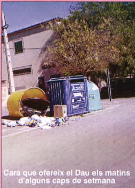
Cara que ofereix el Dau els matins d'alguns caps de setmana