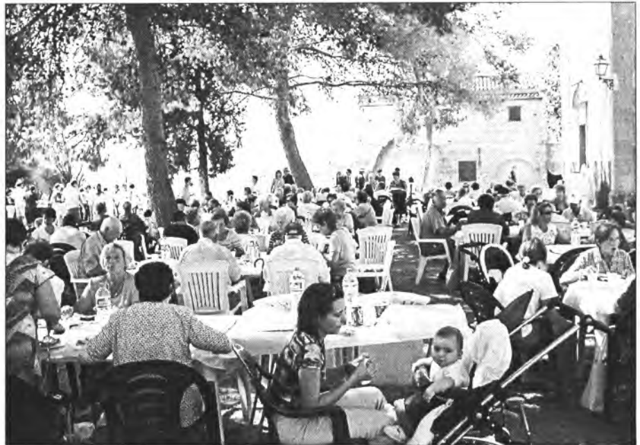
Foren moltes les persones que dia 3 d'octubre al Puig varen participar al dinar solidari a benefici de les obres de la parròquia