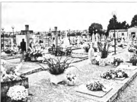
La missa de l'horabaixa de Tots Sants, degut al mal temps, enguany fou a l'església

La festivitat de Santa Cecília d'aquest any serà el diumenge dia 21. Com cada any l'Eucaristia serà a les 11'00h per després escoltar el petit concert musical organitzat pel Patronat de Música.