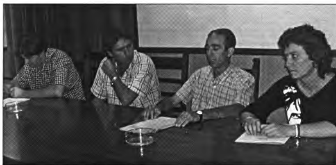
A l'esquerra podem contemplar efectes de la calabruixada a una vinya de Montuïri. I a damunt, el tinent de batle, batle i ponents a la convocatòria de petits empresaris de Montuïri