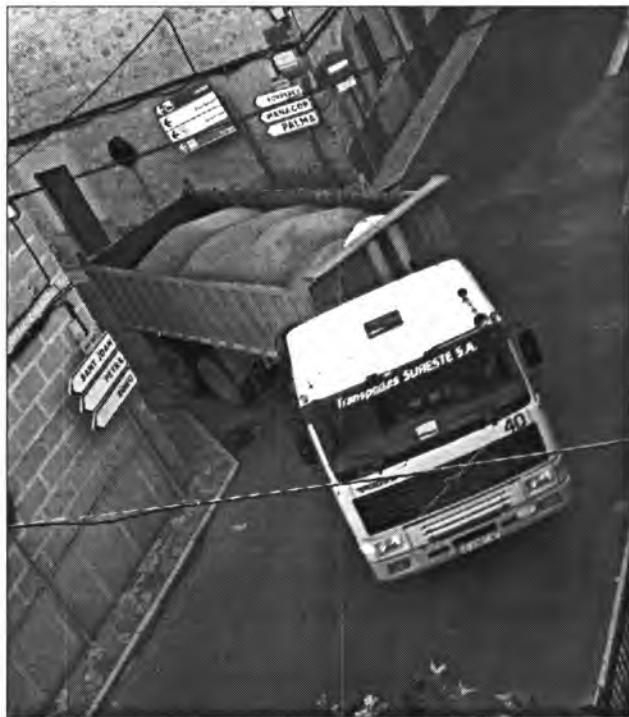
Amb molta dificultat i perill els camions que van a Sant Joan surten del carrer Ramon Llull per agafar el d'Emili Pou