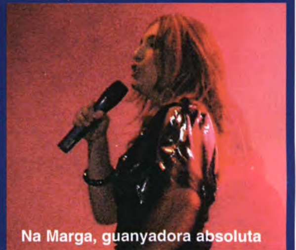
Na Marga, guanyadora absoluta