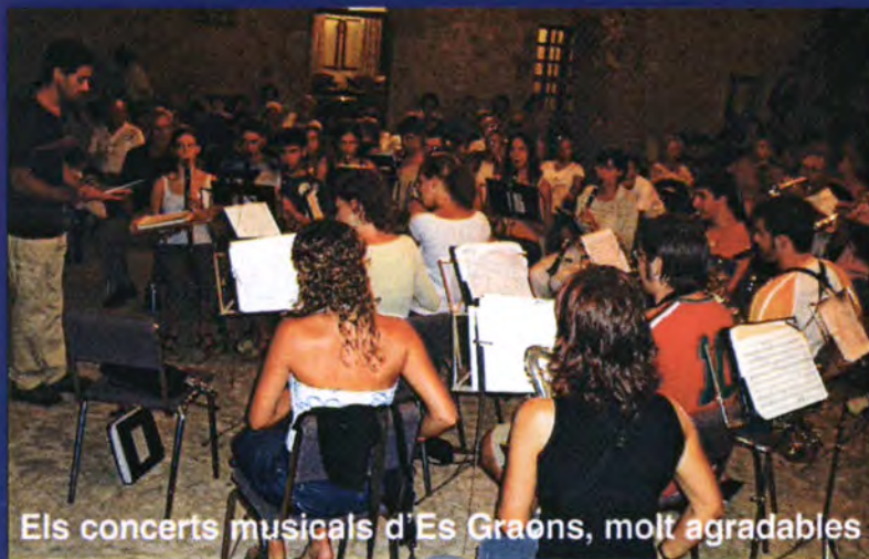
Els concerts musicals d'Es Graons, molt agradables