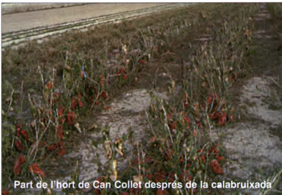
Part de l'hort de Can Collet després de la calabruixada