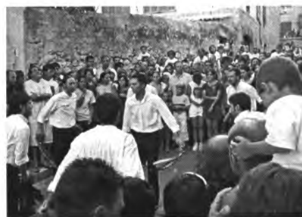
"Les festes de Sant Bartomeu són úniques"

– M'és difícil contestar aquesta pregunta, però... fixant-nos amb el que passa a prop i enfora. La gent gasta molt en coses supèrflues i no tenim en compte, per exemple, les necessitats del tercer món, els sofriments dels països pobres, de la gent que es mor de fam. Existeix la solidaritat? Sí, però no amb la mesura que tocaria existir. Per molts només és una frase.