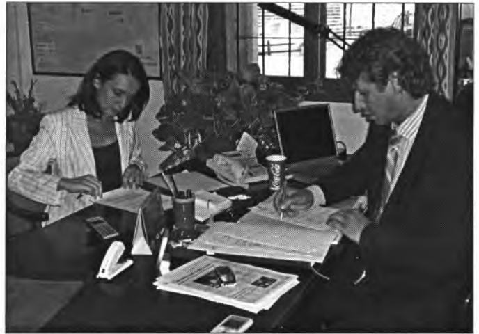
La Consellera de Presidència i el Batlle firmaren el conveni

Una sensible millora per a Montuïri encara que s'hagin hagut d'aportar els terrenys, ja que a més de disposar en el nostre poble d'una qualifi-