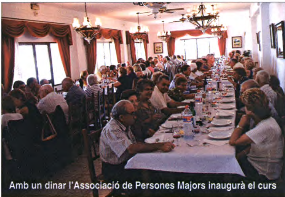
Amb un dinar l'Associació de Persones Majors inaugurarà el curs