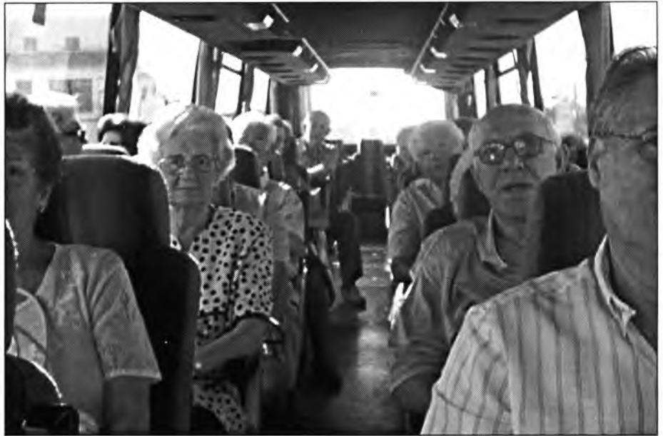
La gent major va anar a passejar i fins i tot, com els infants, volgueren pujar a un trenet, amb el qual pogueren contemplar un meravellós paisatge