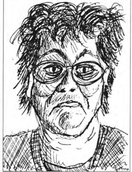
Bel Sa madona de Can Gospet

tes ajudes per rescabalar-se dels danys de la calabruixada de dia 15. Però... hores d'ara encara no hi ha res segur. A esperar!