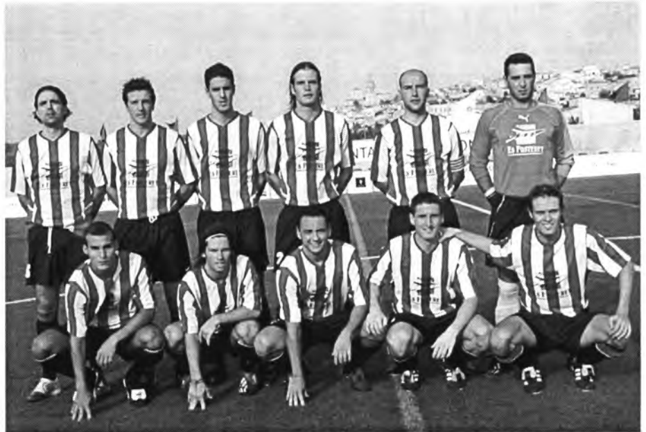
El Montuïri de 3ª divisió nacional inaugura la temporada a la vila contra s'Arenal

Amb un Montuïri molt combatiu i també incisiu davant la porteria de l'Alaior, i quan semblava que l'empat o la victòria s'inclinaria de part dels visitants, no fou així. Durant la primera meitat els montuïrers tiraren