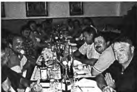
A la clausura del curs, l'Ajuntament va oferir un dinar als voluntaris de Protecció Civil

Per sis vots a favor (PP), 1 abstenció (PSOE) i 4 en contra (PSM) fou aprovat sol·licitar la inclusió del projecte turístic "Ecomuseu El Molinar" de Montuïri dins la convocatòria d'ajudes urgents per pal·liar la desestacionalització turística de la Conselleria de Turisme del Govern Balear amb