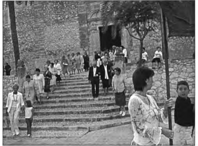
Enguany la processó del Corpus tornà ser molt participada

La col·lecta que els infants de Primera Comunió d'aquest curs han fet a favor de les nines d'Hondures ha estat de 570 euros (94.840 pessetes) Agraïm la seva generositat i la seva solidaritat. Creim que aquest gest és una petita mostra de fer possible una vida més digne per a tothom, sobretot pels més pobres. Probablement aquesta quantitat és veurà augmenta-