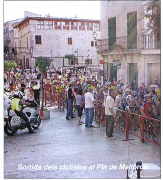
Sortida dels ciclistes al Pla de Mallorca