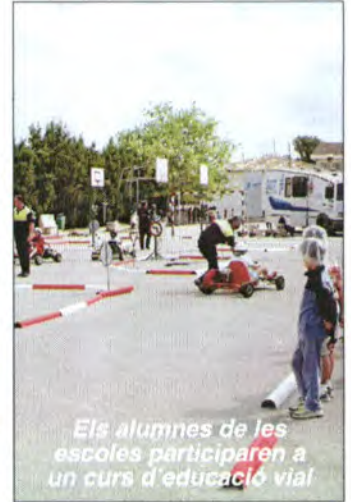
Els alumnes de les escoles participaren a un curs d'educació vial