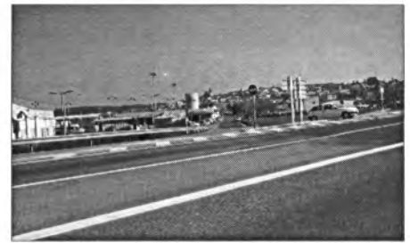
Amb les rotondes que es projecten construir s'evitaran greus accidents