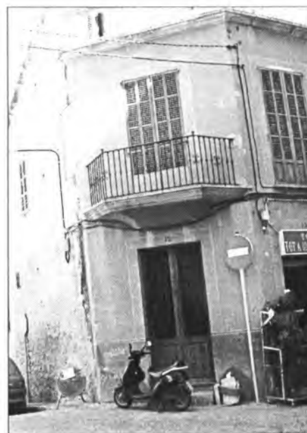
Es va parlar molt de la Sala Mariana com a projecte cultural "estrella"

Cada vegada que hi ha un esdeveniment puntual com són les pre-