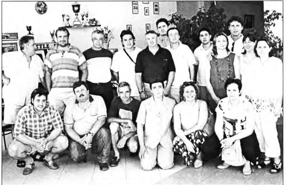
Grup dels 21 montuïrers, juntament amb membres de l'equip de govern municipal, que participaren en el curs de voluntaris de protecció civil el passat mes de juny

sanitàries i cinegètiques que posteriorment seran cedides a les societats de caçadors que gestionen terrenys de caça, com és el cas de la de Montuïri.