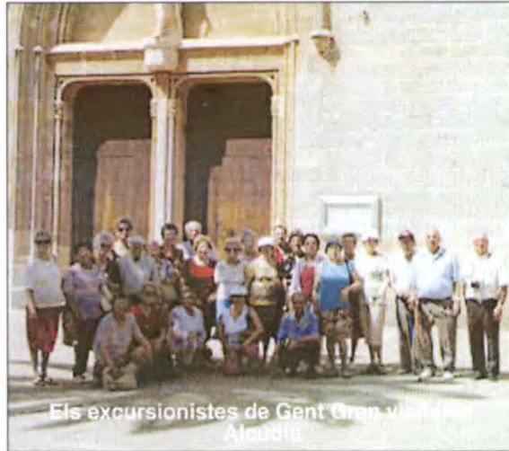
Els excursionistes de Gent Gran visitant l'Alcaldia