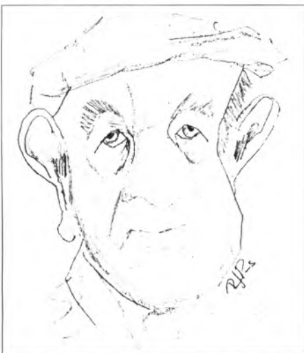
En Sion "Gran", el qui més sap de fora vila perquè és el qui més l'escodrina