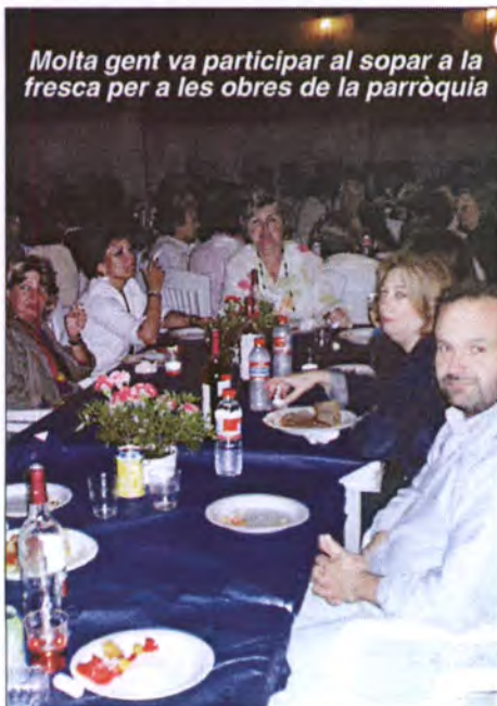
Molta gent va participar al sopar a la fresca per a les obres de la parròquia