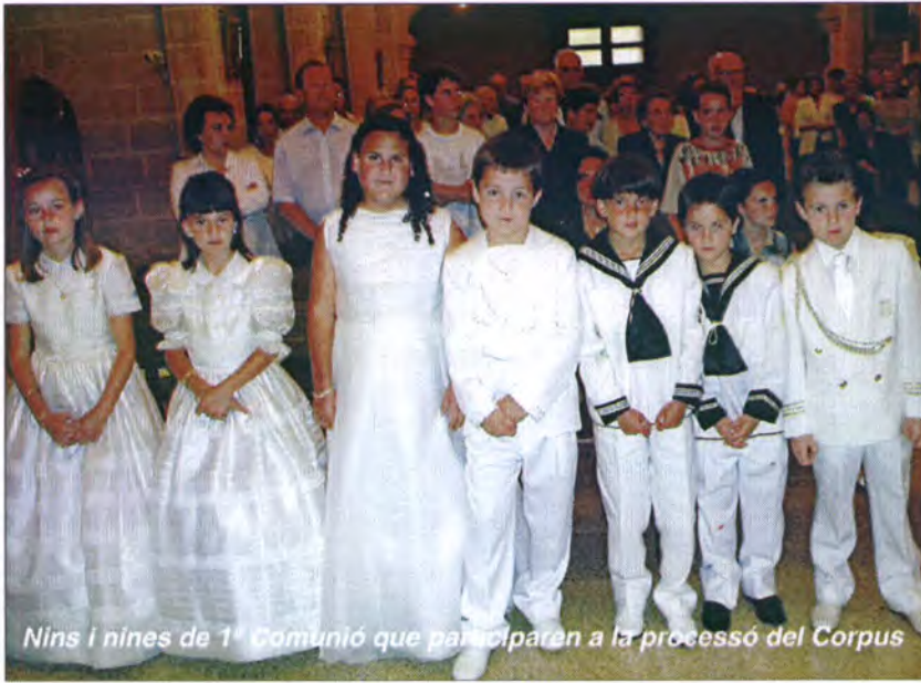
Nins i nines de 1ª Comunió que participaren a la processó del Corpus