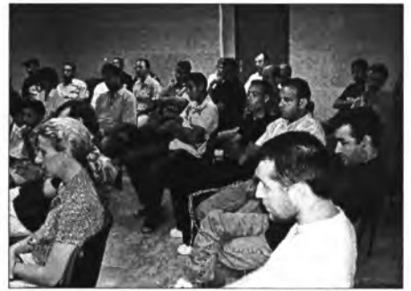
Participants a la conferència sobre Al-Magreb

Com ja és costum de cada any, dia 27 en Es Puig es concentraren persones majors de 75 anys i impe-