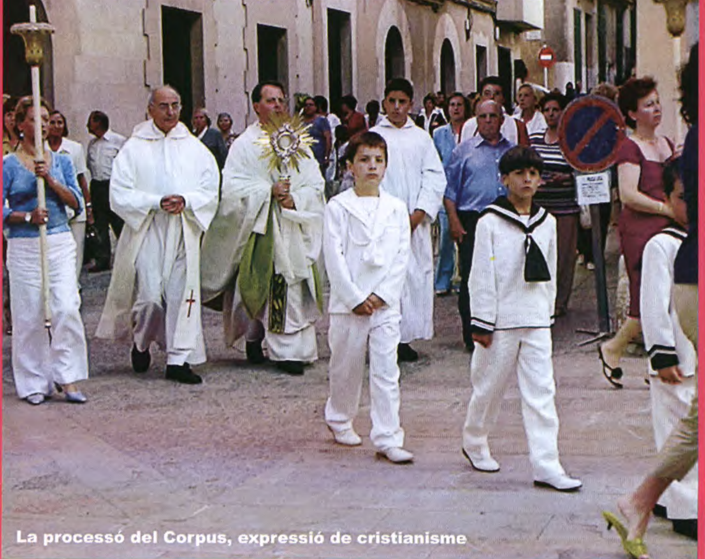
La processó del Corpus, expressió de cristianisme