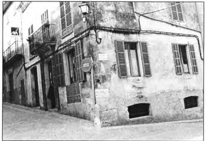
Al carrer Pujol nº 2 era la casa pairal de Can Papió