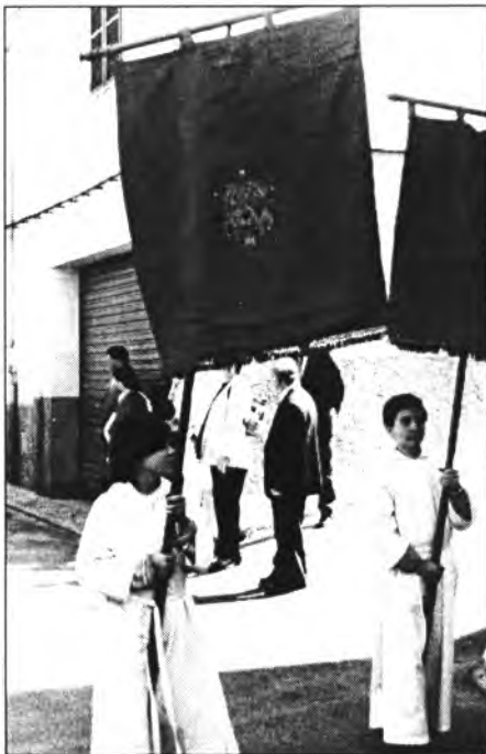
Pasqua: Goig, exultació, gaubança...

Bones festes i benaurada Pasqua de Resurrecció!