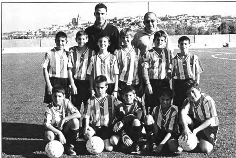
Els alevins de Montuïri porten a terme una acceptable temporada