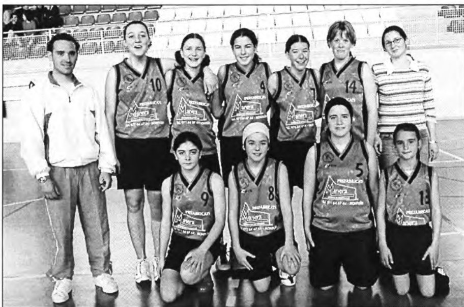
L'equip de bàsquet infantil femení de Montuïri d'aquesta temporada ↑ Les nines de minibàsquet a punt de començar un partit ↓