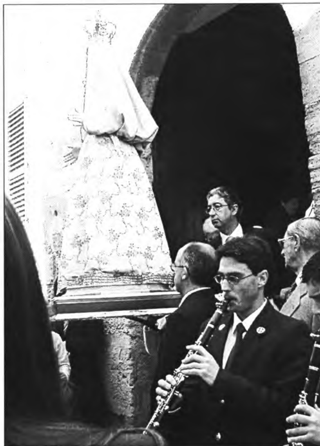
Davant el portal de Can Socies anualment té lloc l'encontre, com el que veiem el darrer any

és, pensada per realitzar l'encontre, disposa d'un mecanisme que li per-