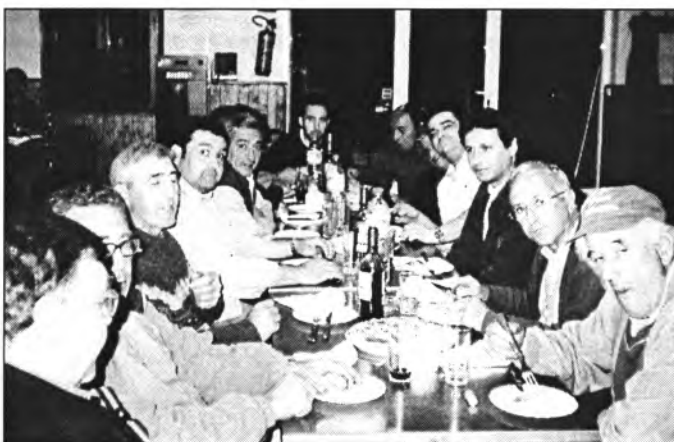
Alguns dels convidats a la inauguració de la pizzeria "Sami"