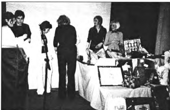
En el sopar contra el càncer els sorteigs de regals foren intrigants