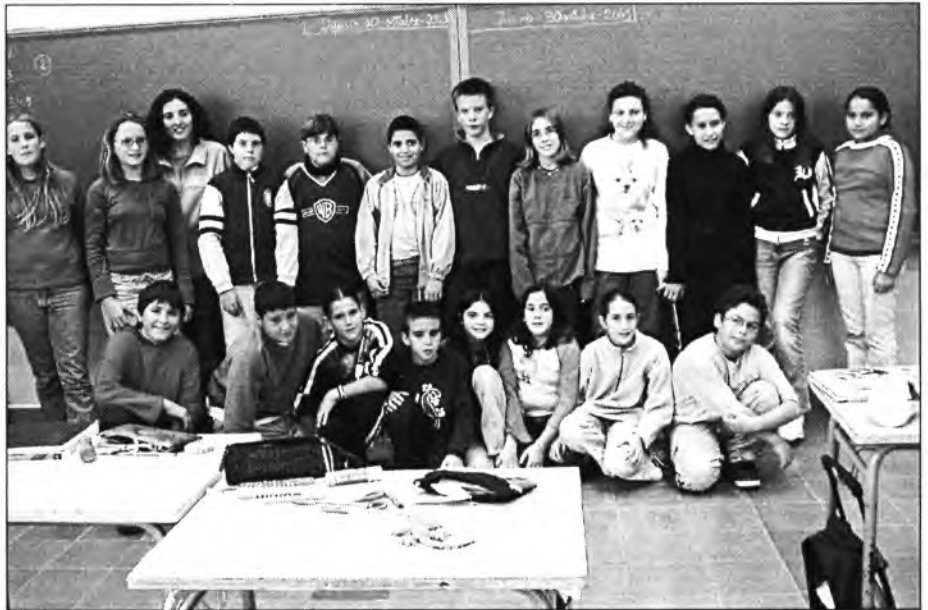
Són els alumnes de 6è de primària del Col·legi "Joan Mas i Verd", els qui els proper curs començaran un altre cicle i hauran de deixar aquest centre escolar

mateix temps que s'emet el programa, al telèfon 971 16 15 17.