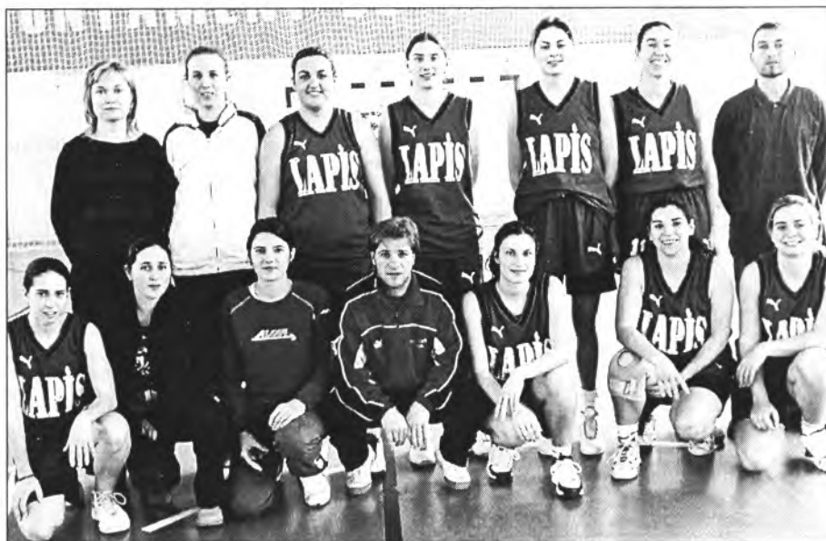
Bàsquet femení Montuïri de Primera Autonòmica

Malgrat el que digui el resultat, el Montuïri hagués pogut golejar el Sta.Ponça. Una bona primera part amb dos gols, un de Nebot i un altre del montuïrer Gomila, va estar contrastada per un penosa segona part. Al final, els montuïrers varen acabar patint però s'endugueren els tres