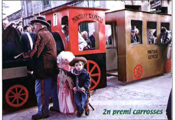
2n premi carrosses