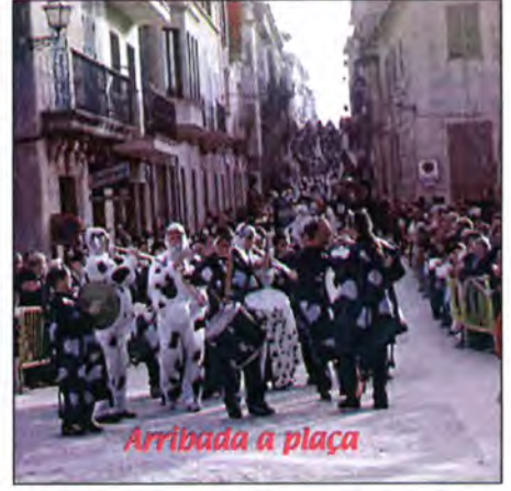
Arribada a plaça