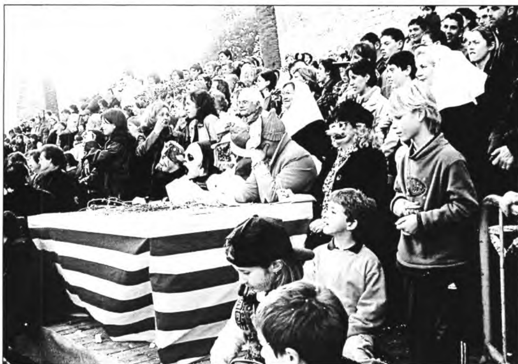
Molt de públic es va concentrar en es graons per contemplar Sa Rua. En primer terme, el jurat qualificador, pertant també màscara, com els qui anaven disfressats, per no esser identificat