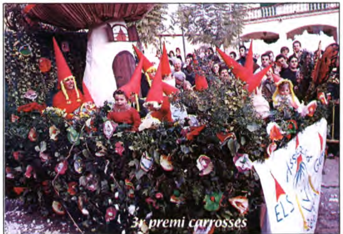
3r premi carrosses