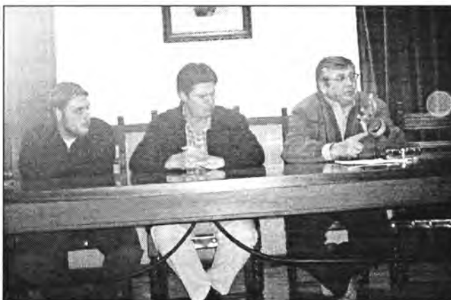
El responsable de Protecció Civil de la nostra Comunitat va impartir una conferència i va animar els presents a formar-hi part i a constituir una agrupació de voluntaris a Montuïri. És el de la dreta en un moment de la seva intervenció

Amb la intenció de difondre el coneixement de la prehistòria de Mallorca a través de les tasques que a la nostra illa es van realitzant, des de començament de febrer es possible seguir a través d'Internet els avanços que es van produint en els treballs a l'entorn del poblat arqueològic de Son Fornés. A la següent