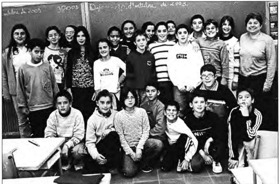
Com es pot veure, varen estar molt satisfets els alumnes de 5è de primària del Col·legi Joan Mas i Verd de poder sortir en aquestes pàgines