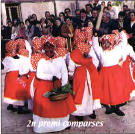
2n premi comparses