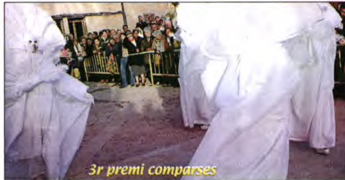
3r premi comparses