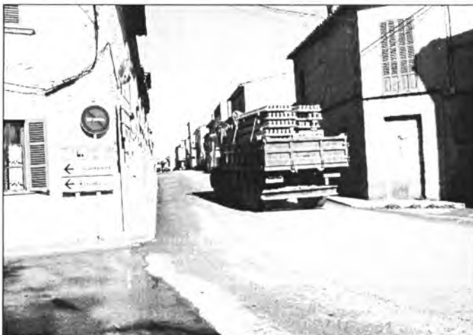
La circulació pel carrer Ramon Llull de cada dia és més difícil