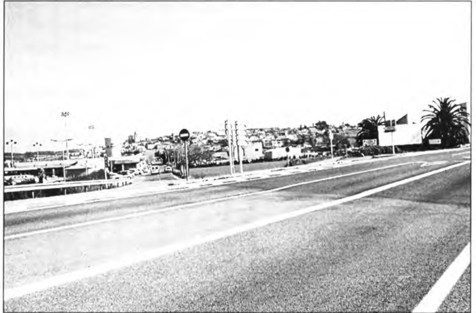
De no fer-se un pas elevat s’haurà de travessar la carretera per la macrorotonda que es vol fer al Revolt

Són ja massa els montuïrers que han perdut la vida circulant o travessant la carretera. Per això qualsevol proposta raonable per a la seva mi-