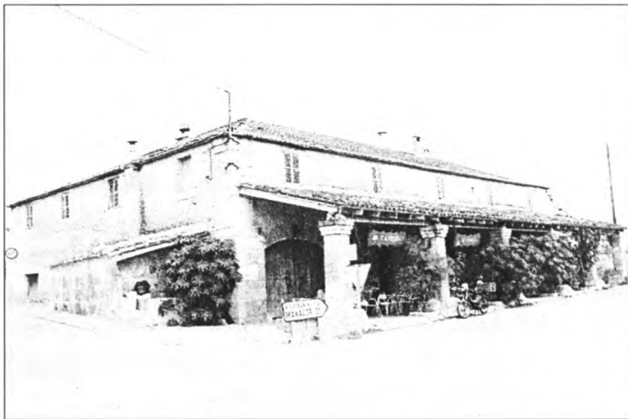
La primera central elèctrica de Montuïri s'instal·là el 1914 a s'Hostal