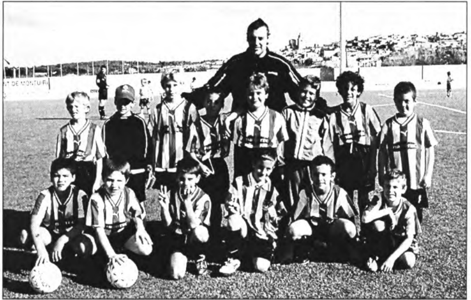
L'equip de Benjamins del Montuïri d'aqueta temporada

És evident que des de la venguda del nou tècnic l'equip, en general, s'ha espavilat i juga amb un interès i unes ganes que haurien d'haver estat la tònica de tota la temporada. El darrer partit d'aquest passat febrer, jugat amb el Constància d'Inca, podria haver-se guanyat o, al manco, empatat, però la veterania i encert dels locals trencaren la bona ratxa del Montuïri mancant el gol de la victòria ja en temps de descompte.