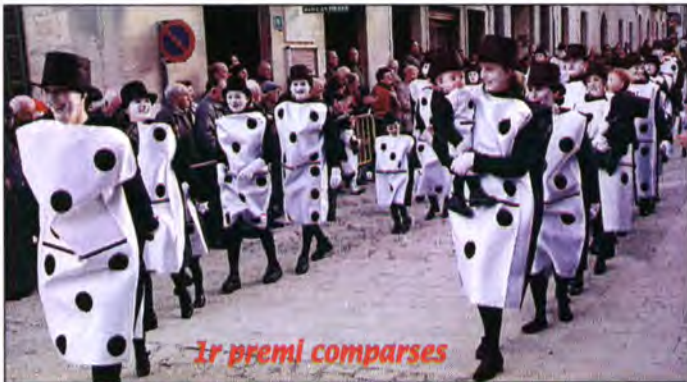
1r premi comparses