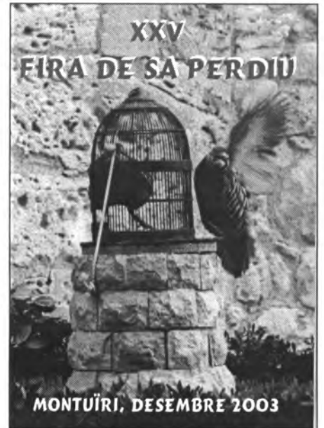
Portada del programa de la fira d'enguany

A les 12h. A l'església: Missa dominical.