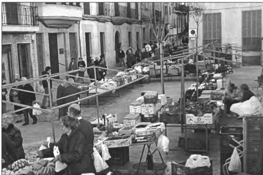
Encara que no hi hagi molts de venedors, en el mercat dels dilluns a Montuïri cada setmana hi abunden llocs de venda d'hortalisses i fruita i altres productes

Personalment crec que la pujada ve condicionada a l'oferta i demanda, ja que amb el productes agraris, quan hi ha escassetat, no es poden fer al moment. No és el mateix que fabricar rajoles, per posar exemples, que tenint matèria prima i maquinària es poden