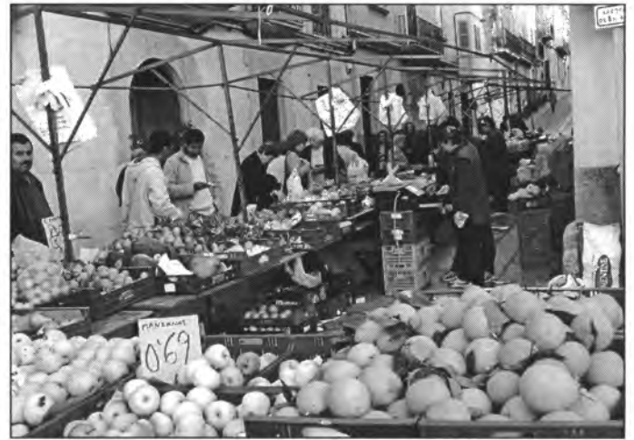
En el mercat s'hi pot trobar tota casta de fruita a preus assequibles

Tot i així confiem que aquesta mesura de doble etiquetatge almenys faci un poc de vergonya i freni aquest tan alt marge comercial i surti beneficiat tant productor com consumidor. De fet, segons he llegit a un diari, hi ha un hiper que ha dit que si els preus d'origen baixen també baixarà els de