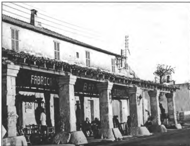
Encara que aquesta foto de s'Hostal sigui antiga, la referència que en fa l'Arxiduc és de molt abans, ja que diu que "hi ha un nou hostel molt gran amb sis columnes davant".

restes del seu trespol (de l'església), ja que s'ajusta amb el testimoni de l'historiador local Jeroni Cloquell i Mateu, prevere, el qual especificava més, encara, i deia que aquesta troballa havia tengut lloc a veïnat de can Nofre, al Molinar. Pel que fa la possibilitat que aquesta església del Molinar hagués estat anteriorment una mesquita pot ésser molt bé. De fet era freqüent que el repobladors catalans del segle XIII erigissin les esglésies en el mateix emplaçament de les antigues mesquites. En tenim un bon exemple amb la mateixa catedral de Palma.