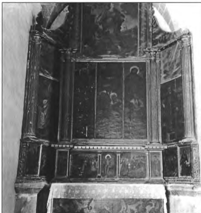
Capella anomenada de Sant Pere amb les pintures de Mateu López a què fa referència l'Arxiduc i que segons diu aquest era l'antic altar major de la nostra església. Avui, ja totalment restaurat, ha canviat de fesomia

molí de can Rebut o d'en Serra, molí de can Joan Hermano (esbucat), molí de cas Potecari vei o de can Ferrando, molí de can Rovegó (esbucat), molí de can Calvet, molí de can Tomeu Andreu, molí de can Rafel