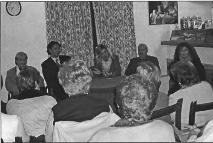
El nou equip directiu regional de Gent Gran visità les dues associacions de 3 a edat de Montuïri