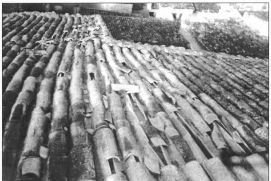
Així de deteriorada està la teulada de l'església parroquial de Montuïri