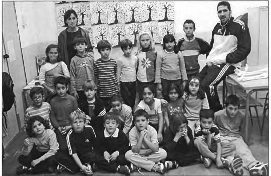
Els alumnes de 2n curs de primària que enguany assisteixen al Col·legi "Joan Mas i Verd"