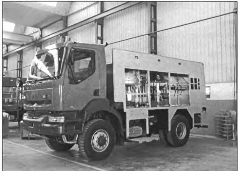
Una de les autobombes, en procés de muntatge

El pla de modernització preveu també la compra de 3 unitats de prefectura de comandament (vehicles lleugers tot terreny per a desplaçar-se als sinistres el comandament que coordinarà les actuacions necessàries), 2 unitats de transport mixt lleuger (vehicles capaços de desplaçar 5 persones i una caixa oberta, amb un equip de descarceració per a actuar en accidents de trànsit) i un furgó d'utils diversos (vehicle tot terreny, tracció 4x4, amb un ge-