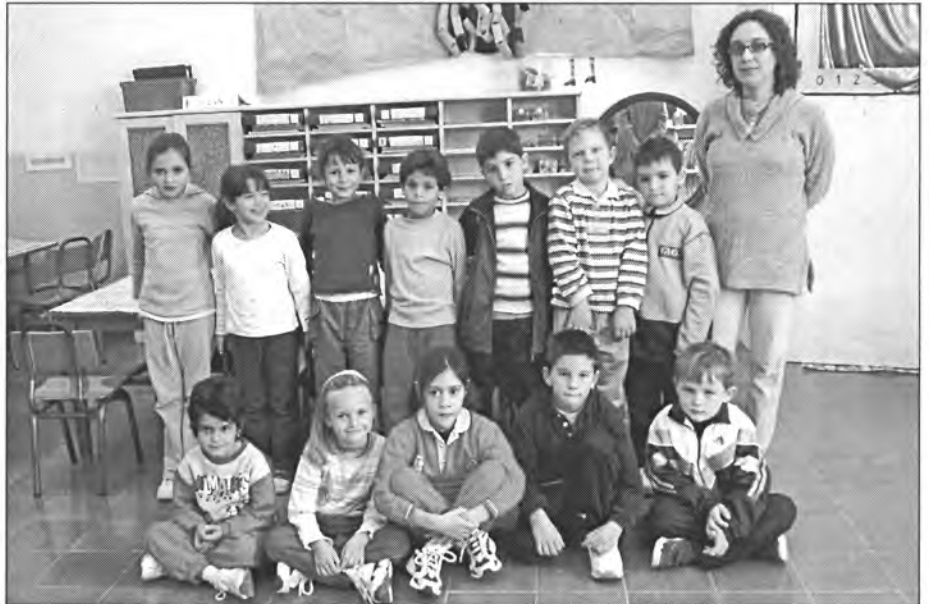
Els alumnes de 1r curs de Primària que acudeixen al Col·legi Públic Joan Mas i Verd. És el segon grup de 1r ja que l'altre sortí el passat mes a la portada