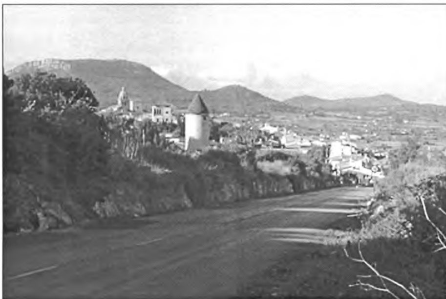
Vista de Montuïri avui, des d'aproximadament se suposa que fou captada la del Llibre de l'Arxiduc que figura més amunt

(De Les Balears , de l'Arx. Lluís Salvador)