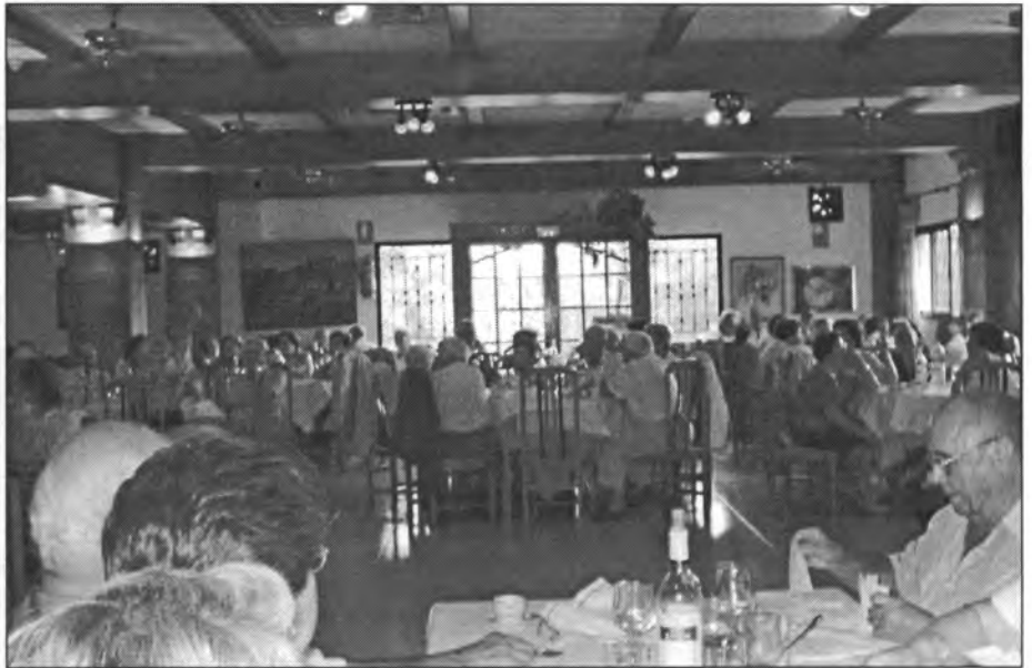
L'Associació de Persones Majors celebrà el començament de curs amb un dinar

Aquest mes passat han començat de ple les activitats de les dues associacions de tercera edat de la vila. A