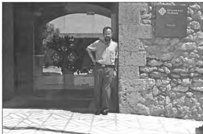
A l'entrada de la Universitat

– No sabem encara si ampliar-la o construir-ne una altra. També ens hem plantejat fer una residència dins Palma. L'equip anterior havia parlat de Sa Gerreria i el Govern passat ens va oferir la possibilitat de fer-la a Es Molinar. Hem de veure si mantenen l'oferta. Actualment ens manquen places i ja el curs passat alguns alumnes varen haver de cercar pisos, i no és gens fàcil.