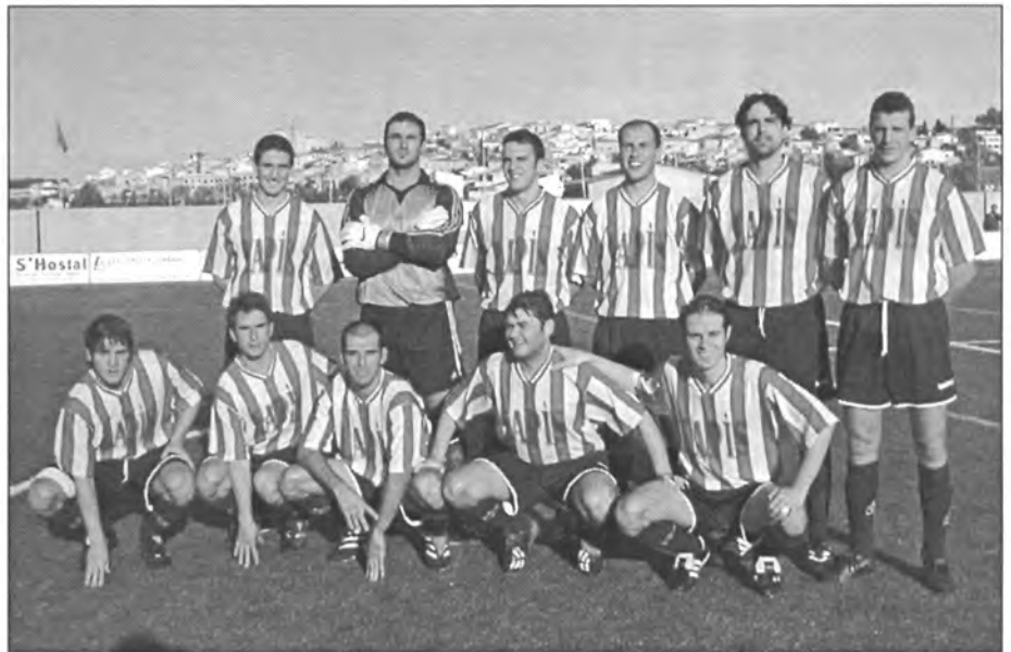
En els dos darrers partits d'octubre el Montuïri d'III Nacional va demostrar que aquesta temporada pot aspirar a una bona classificació

La primera part va ser molt igualada i el Montuïri va controlar, però no va poder encetar el marcador i anar-se'n al descans amb avantatge al marca-