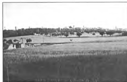
Girant la vista cap enrere tenim una bella imatge de Montuïri amb els seus molins

Més enllà de Montuïri hi ha un nou hostel molt gran amb sis columnes davant. La carretera discorre per la planura, es veuen alguns molins de vent aïllats. A la dreta deixam un camí que va cap a Porreres i a l'esquerra un altre