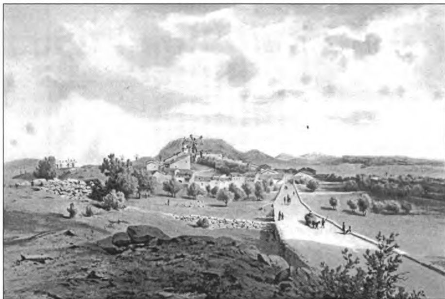
Gravat de Montuïri que figura en el llibre "Les Balears" de l'Arxiduc Lluís Salvador

nexos. La senzilla església té una espadanya ogival i un portal d'arc rebaijat amb lluneta i rosetó; entre aquests dos hi ha un rellotge de sol. Té un interior modest, una galeria part damunt l'entrada, una capella a cada banda, però sense altar, i un presbiteri en forma de nínxol. A l'altar major hi ha la imatge de Nostra Senyora de la Bona Pau, amb sant Miquel a la dreta i sant Joan Baptista a l'esquerra. Diferents exvots pengen de les parets. A l'esquerra, adossada a l'església, hi ha una casa doble amb dues portes, que formen a davant un pati obert, les cambres superiors de les quals estaven destinades al donat i formaven una espècie d'hostatgeria; però habitualment el lloc està abandonat, i només els diumenges hi puja la gent; la clau és a Montuïri, cosa que sens dubte és molt incòmode per als visitants de pas. Però des de fa algun temps hi habiten alguns ermitans de l'ermita de Sant Honorat del Puig de Randa, que tenen cura de l'oratori. A la dreta de l'església hi ha una construcció adossada i una cisterna amb un frontó ogival de coll de pou octogonal. Una mica més enllà hi ha un aljub de carrer, un magraner, una olivera i figueres de moro. Des d'aquesta elevació hi ha una bella vista sobre el puig de Randa i els suaus pujols fins a Montis-sion de Porreres i sobre aquest darrer poble, a més sobre el grup de Sant Salvador fins a Llodrà, amb les elevacions de Bonany i Ferrutx al fons. A l'altra banda es domina el pla de l'illa amb Montuïri allà prop, el campanar