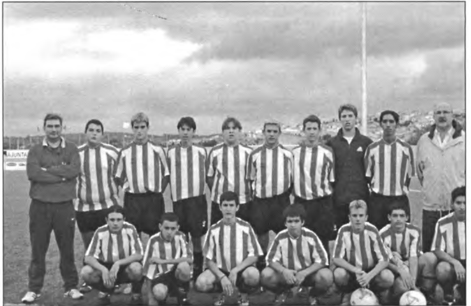
L'equip de Cadets de Montuïri encara no està acoblat del tot, però l'interès i esforç no minven gens

Drac Bàsquet Pla, 71 - Lapis Montuïri, 70 Lapis Montuïri, 48 - Sa Pobla-