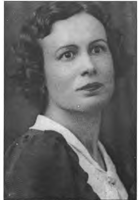
Així d'esvelta era la nostra centenària quan tenia una vintena d'anys

– Sí. Record amb molt de gust la festa del Puig, les de Sant Bartomeu, tot quan és de Montuiri m'agrada molt. Tenc uns records molt agrada-