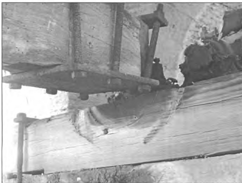
Així de deteriorades romanen actualment les campanes de l'església