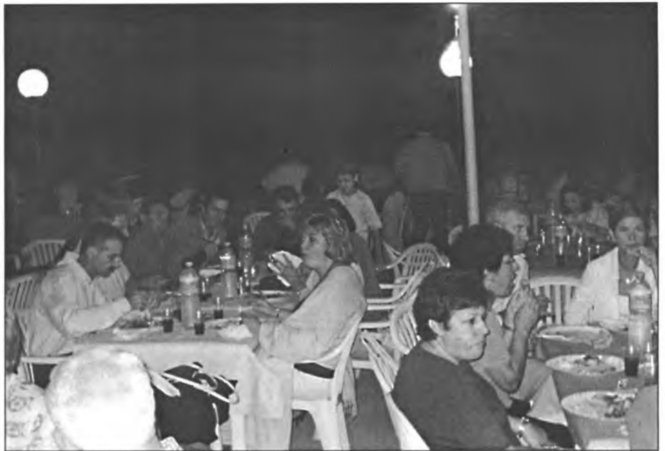
Al sopar a la fresca a benefici del Patronat de Música hi assistí molta gent

Dia 11 de setembre l'Associació de Gent Gran va organitzar una excursió al Port de Manacor i a S'Illot. Els participants tornaren satisfets no sols per dita excursió i pel dinar, sinó també pel