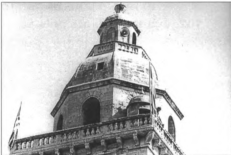
El campanar dies abans de Sant Bartomeu de 1983. Ara, transcorreguts 20 anys, les baranes encara estan molt més deteriorades degut a la multitud de coloms que amb les seves deposicions l'espenyen de cada dia més. La solució es fa necessària com més prest millor

Amb el lema "Amb Maria cridats a la Missió" dia 19 d'Octubre es celebrarà la jornada del Domund. La col·lecta que es farà aquest diumenge serà destinada íntegrament als missioners i missioneres que treballen arreu del món anunciant la Bona Nova de Jesús. Els que vulgueu col·laborar d'una manera especial ho podeu fer-ho ingressant els vostres donatius als comptes bancaris o passar per la rectoria.