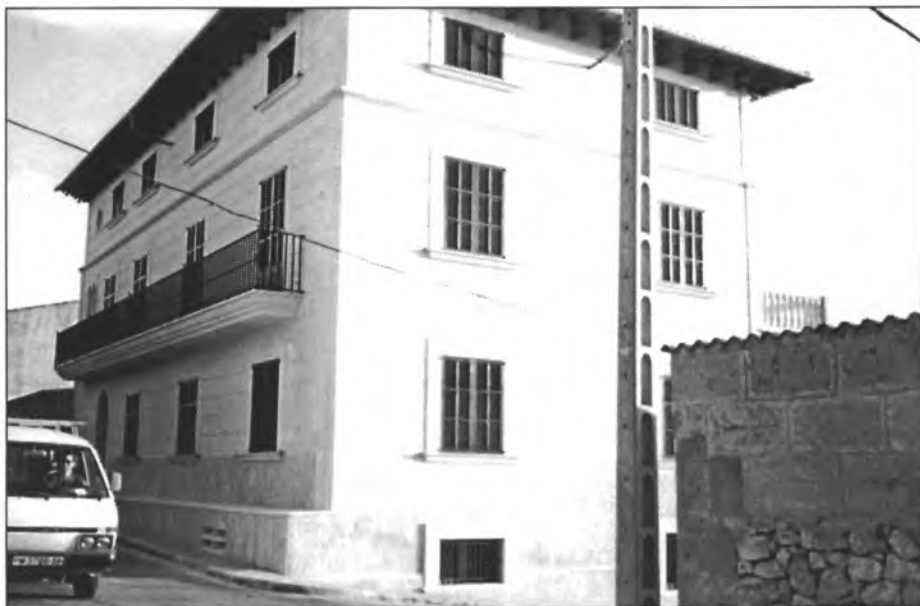
No totes les façanes de la vila estan tacades. Se'n poden contemplar amb molt bon estat, com aquesta de Can Silis

Si algun dia a les coves de Son Toni Coll, dels Rafals o de Ses Rotes, aparequés una "pintura rupestre" anc que tengui simbologia fàl·lica, com la d'Es Dau, la podeu indultar; seré el primer en anar a visitar-la.