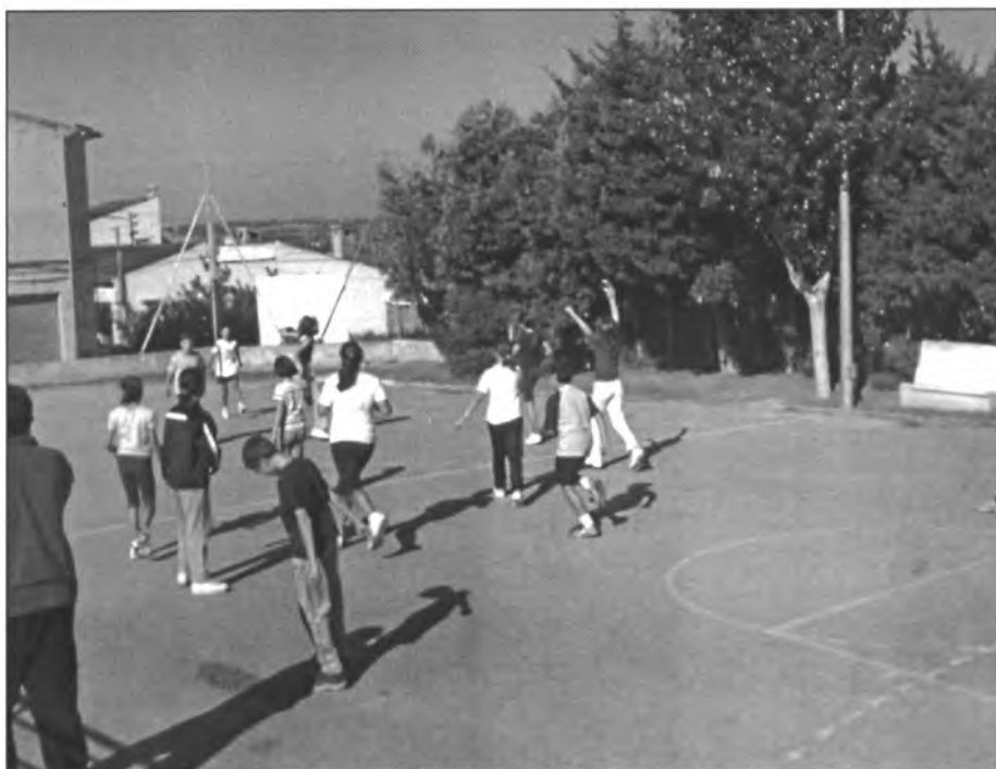
Des de començament de curs, es poden veure nins emprant el pati de les escoles per a la gimnàstica i per als jocs escolars

Aquest setembre ha estat una mica difícil començar bé i tenir-ho tot a punt, a causa de les obres realitzades durant l'estiu a l'edifici escolar. Es tracta d'unes millores dissenyades i finançades per la Conselleria d'Educació i Cultura i contractades per l'Ajuntament. Després d'avaluar les necessitats, es va decidir canviar les velles persianes de fusta per unes noves d'alumini, fer una cuina nova i canviar la majoria d'aparells ja molt vells, col·locar una barana a la pista de bàsquet i canalitzar les aigües pluvials procedents de Sa Torre. Per tal d'aconseguir una cuina renovada i en