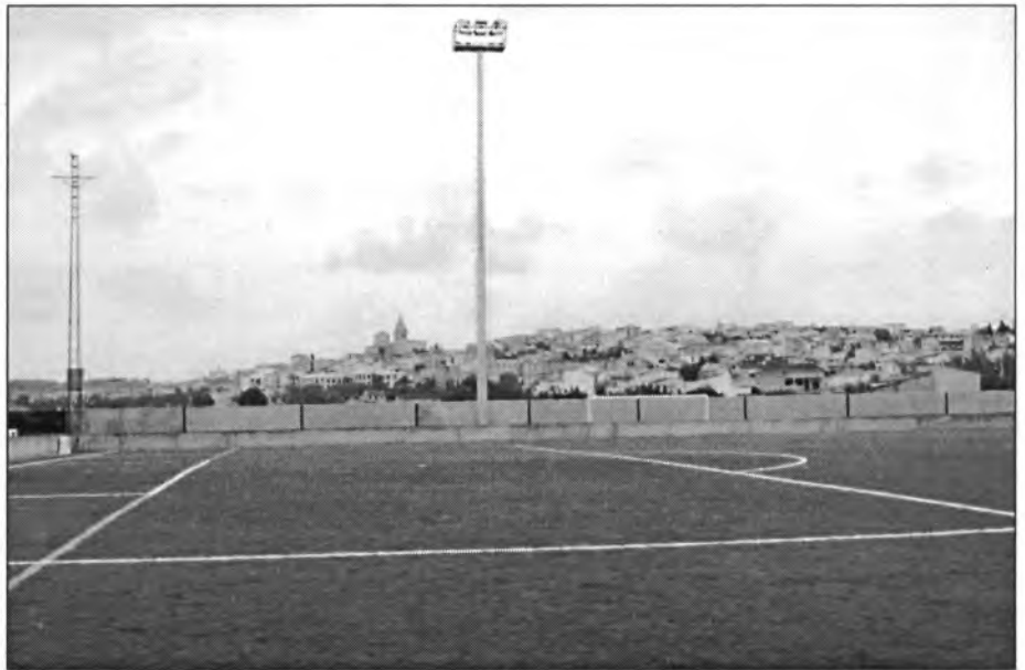
Bella panoràmica de Montuïri que ara poden observar els espectadors des de les grades del camp de futbol