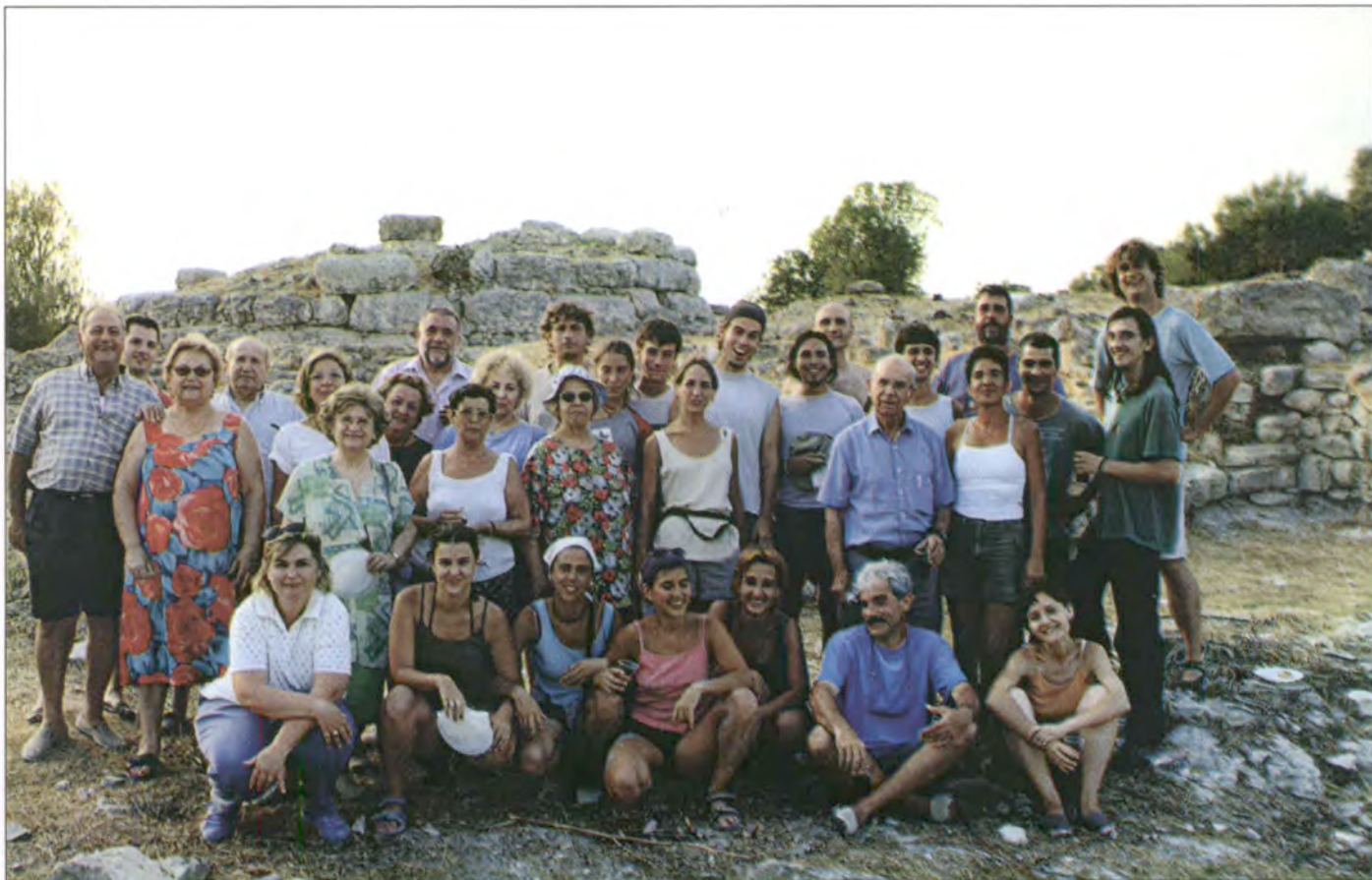
Un bon grapat dels integrants de l'Associació d'Amics de Son Fornés es reunien el 9 de juliol passat al costat dels talaiots. Allà, després d'explicar-los l'actual situació i darreres troballes, gaudiren d'un bon berenar, del qual en feren participants als qui treballaven a les excavacions