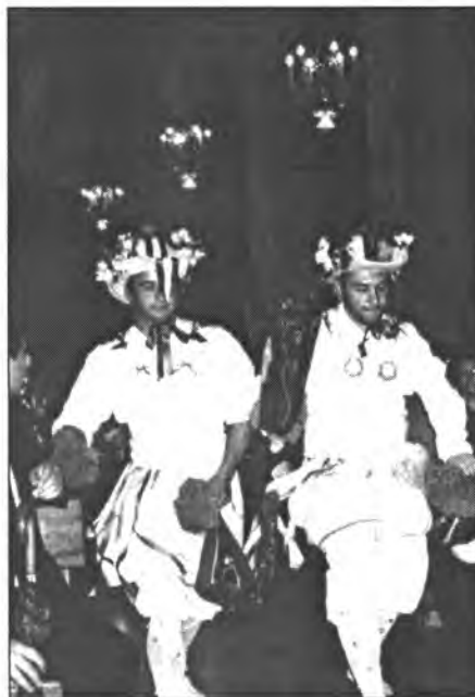
Com es tradició, l'any passat els Cossiers interpretaren el ball de l'oferta amb la pulcritud que el és característica. Foto amb la qual Bona Pau desitja bones festes a tots els lectors