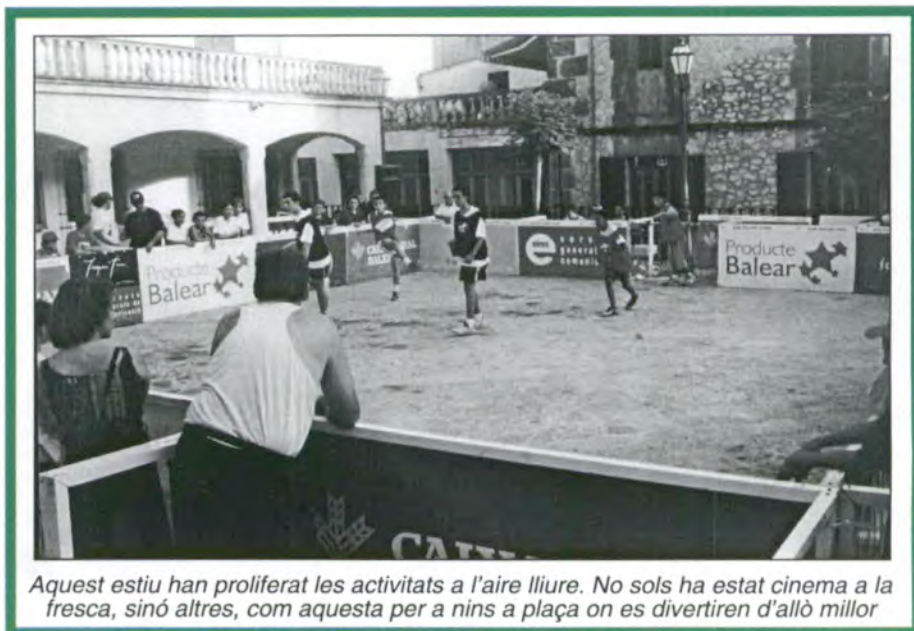
Aquest estiu han proliferat les activitats a l'aire lliure. No sols ha estat cinema a la fresca, sinó altres, com aquesta per a nins a plaça on es divertiren d'allò millor

era fins el segle VII. De moment s'espera continuar el proper estiu.