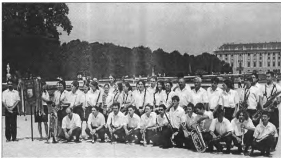
La Banda de Montuïri després del concert a Schönbrunn (Àustria)

Als voltants de les 16h començarem per Pest una visita amb guia local, jardins, els voltants del parlament, plaça