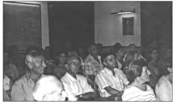
Un públic interessat va assistir a les conferències