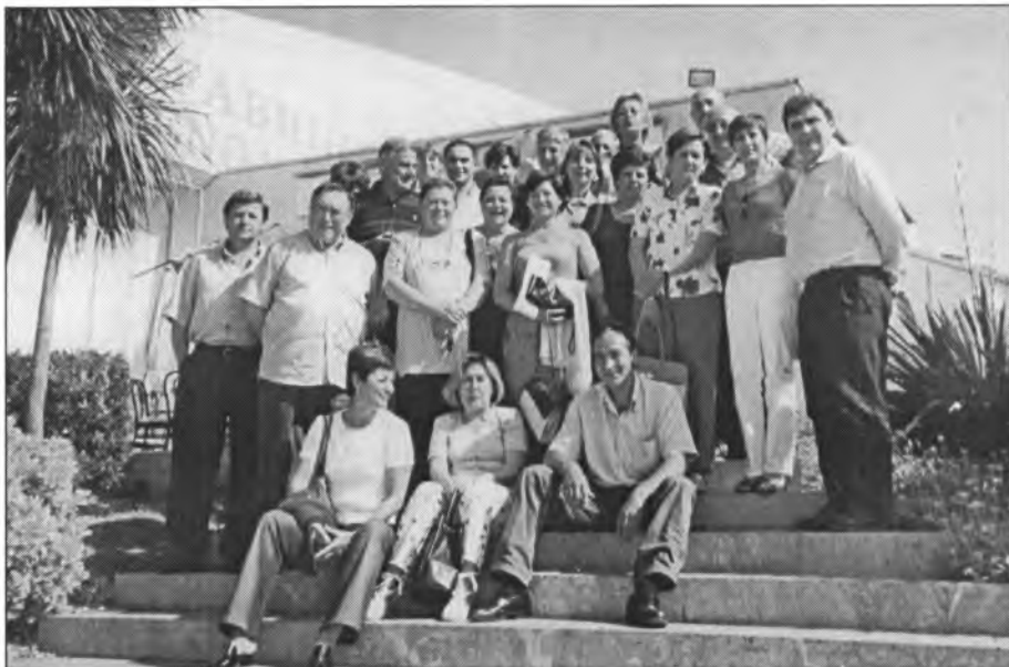
Els "quintos" de Montuïri nascuts el 1953 el passat 30 de maig es reuniren en un dinar de companyonia i tots satisfets així en deixaren constància

El grup d'Esplai Es Turonet ha organitzat un campament d'estiu a la Colònia de Sant Pere, des del 28 de