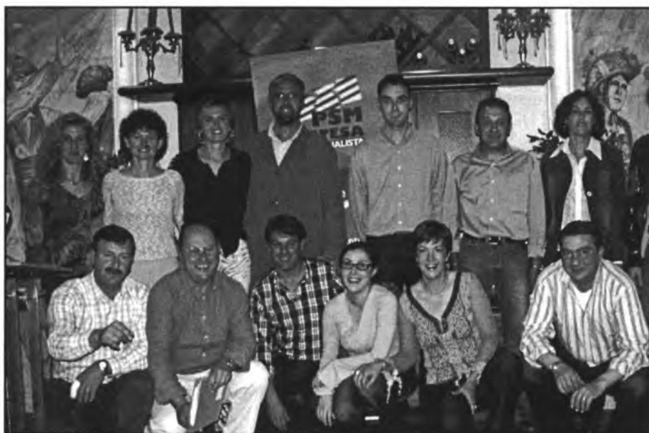
L'animació entre els candidats del PSM és féu patent el dia de la presentació

- La situació econòmica de l'Ajuntament, conseqüència dels darrers 16 anys de gestió del PP, és crítica com ho demostra l'informe de Secretaria, el qual fa tres anys ja indicava la necessitat de contenir la despesa amb un pla de sanejament financer. En documentació datada en l'actual 2003 s'han reconegut els 150 milions de pessetes de deute als bancs, el dèficit anual de 70 milions i un endarreriment en pagaments que en alguns moments pot rondar els 140 milions. A aquestes dades s'hi han d'afegir dos informes tècnics del Consell Insular on s'explica que aquesta situació econòmica és insostenible i per això s'ha obligat a l'Ajuntament a aprovar un pla de sanejament. Ara, en aquests moments,