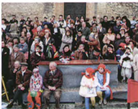
Gent des nostro poble