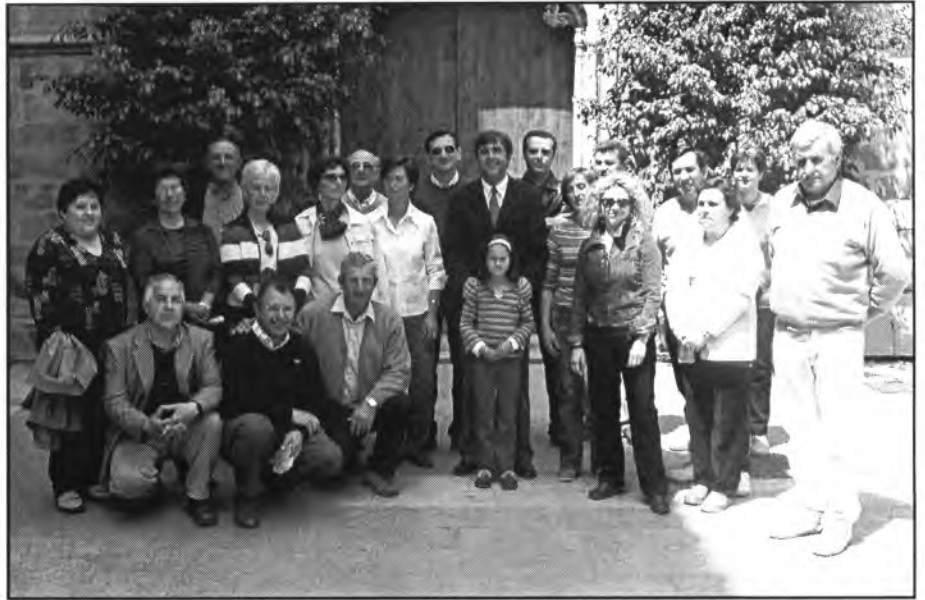
El President Antich va rebre el passat 26 d'abril un grup de S'Esbart de Pla que féu una visita al Museu de Mallorca i al Consolat de Mar

El Consell Social de la llengua catalana perfila un Avantprojecte de Llei del català al comerç i un pla general de normalització. Per tal motiu el passat 28 de març, es va celebrar la segona sessió plenària del Consell