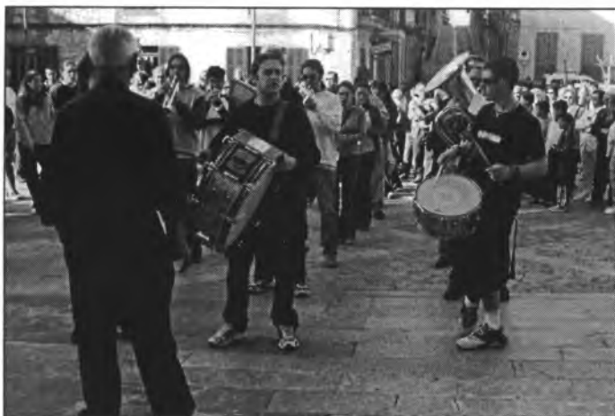
A plaça, la banda de música abans de partir cap al Puig interpretà una de les seves peces tradicionals