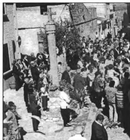
La benedicció de rams enguany fou a la plaça de Ses Tres Creus