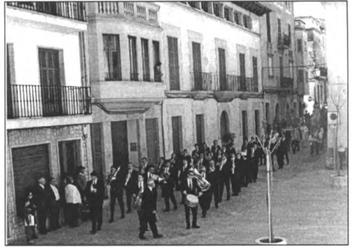
També fou notícia la banda: El Dijous Sant, enguany estrenà nou uniforme