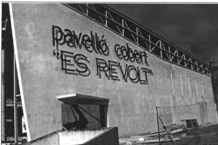
La inauguració del nou pavelló esportiu haurà estat una de les darreres obres municipals d'aquesta legislatura

– Sí. Aquesta legislatura hem tramitat dos aspectes essencials de les Normes Subsidiàries: l'econòmic, amb l'aprovació del Polígon Comercial, Industrial i de Serveis i el cultural i medi ambiental, amb l'aprovació del Catàleg de Protecció del Patrimoni històric de Montuïri. Actualment, els tècnics estan finalitzant la feina per l'aprovació definitiva de les Normes Subsidiàries, perquè siguin actualitzades a fi que ens permetin obrir nous carrers i solars, millorar així l'oferta de sòl disponible i abaratint