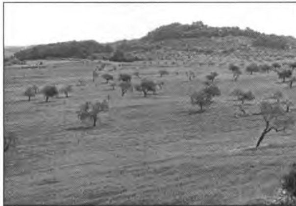
Bella panoràmica dels fèrtils camps de Meià

Actualment ni es troben dones per herbejar i si se'n trobassin amb els actuals preus dels cereals no bastaria tota la collita per pagar tants de jornals així com tampoc es poden pagar missatges com antany, ni fa falta. La mecanització per realitzar les feines juntament amb herbicides per llevar les males herbes ha suplít la manca de ma d'obra. Tot i així, a vegades, per alleugerir-se de les moltes feines que comporta el conrear un centenar de quarterades, lloguen jornalers i en temps d'excequellar, des de fa uns quant anys, tenen a càrrec el fer aquesta especial feina dos coneguts excequelladors i podadors professionals. L'amo en Joan de Ruberts que fa colla amb l'amo en Nadal de Lloret, ara han acabat amb les les figueres i aquesta setmana es posaren a arranjar els garrovers que encara estam a temps. Per la recollida d'ametlles també lloguen gent.