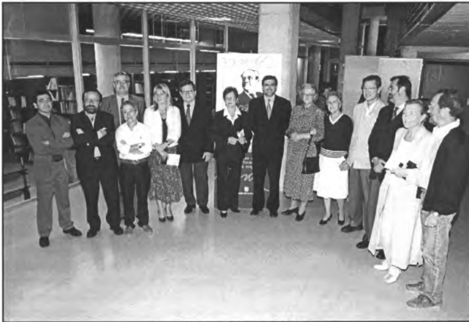
La inauguració de l'Any Moll