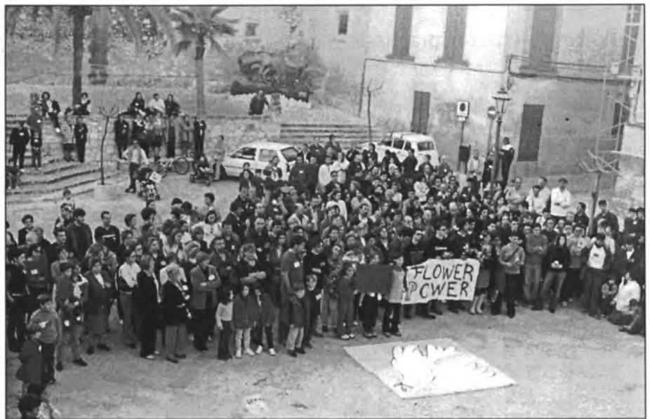
↑ La gent que va participar a la manifestació per dir no a la guerra, es va concentrar a plaça on es va llegir el manifest

Dia 12 horabaixa poc més de 400 persones participaren a una manifestació, precedida de flabiol, tamborers i pancartes amb el lema "Montuïri diu no a la guerra", la qual va discórrer des del Dau, pel carrer de Sa Trona, Major i fins a Plaça on es va llegir el manifest que publicam a un altre lloc. S'encengueren candeles, s'amollaren coloms i la banda de música va interpretar l'himne de Montuïri. La manifestació estava convocada per les següents entitats: Patronat de Música, Club de Tennis, Gent Gran, Club de Bàsquet, PSM, Consell Parroquial, Esplai, Es Turonet, AMIPA, Bona Pau, PSOE, Futbol Sala Fibrotec, Banda de Música, UM, Club Columbòfil, Associació lluita contra el Càncer, S'Esbart des Pla, Club de Futbol, Club Atletisme, Associació Caçadors, Coral Mont-Lliri, PP, Associació de Persones Majors i Claustre de Professors del Col·legi Joan Mas i Verd.