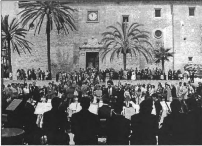
Després de l'encontre i de l'ofici del dia de Pasqua, la banda a plaça interpretà un gradable concert