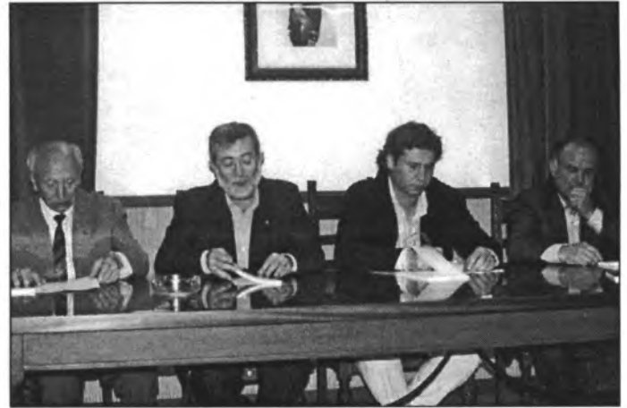
La presidència de l'acte de presentació de llibre del contes guanyadors del darrer concurs