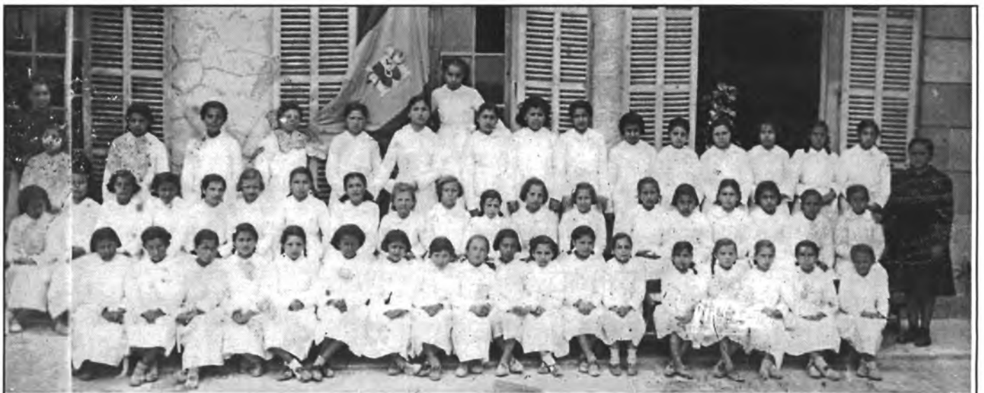
El grup de nines que l'any 1926 anava a classe a Ca ses Monges era molt nombrós. I per altra part són tan poques les que hem pogut destriar que hem optat per no posar cap nom