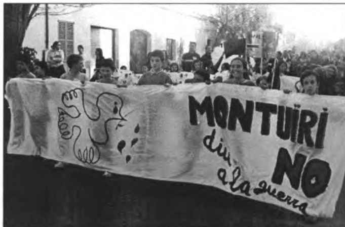
A Montuïri s'organitzà una manifestació dia 12 d'abril passat per dir "no a la guerra"

No hem d'oblidar la lliçó. Hem de comunicar-la als més joves perquè la vida sigui sempre possible per a tots, perquè la pena que ara sentim i aquest clam contra la guerra es transformin en esperança.