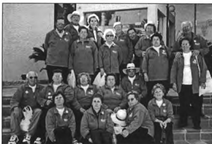
Grup de montuïrers que participaren en els segons jocs soci-culturals i esportius de la Mediterrània