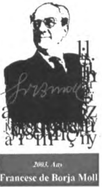
2003, Any Francesc de Borja Moll

L'any 1956, Moll estava pronunciant una altra conferència a la Universitat de Barcelona quan, de cop, es varen presentar dos policies amb l'ordre d'acabar-la en castellà. Mentre Moll continuava parlant, els organitzadors varen intentar raonar amb els policies. Els varen dir que era absurd que una conferència començàs en un idioma i acabàs en un altre. No tenia sentit. Els policies ho varen entendre i varen cridar el governador civil per demanar instruccions, però aquest es va encaparroter en l'ordre. Així que varen passar un paperet a Moll, que era dalt de la tribuna. Moll es va aturar i només va dir: "El delegado gubernativo