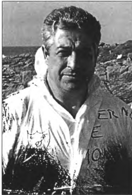
En Bernat a Galícia, amb vestit de feina

brós grup que assistia a les classes del centre escolar del nostre poble.