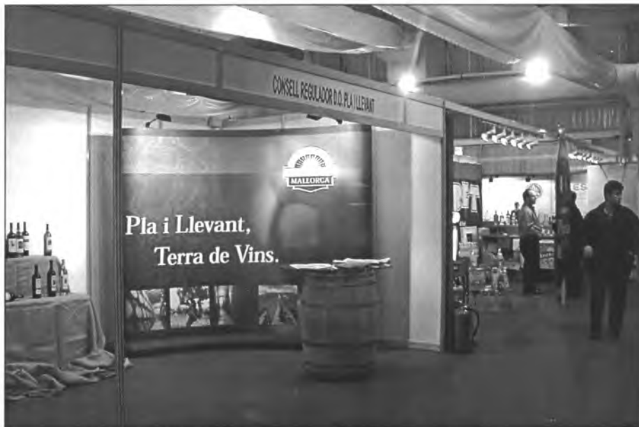
Amb la denominació d'origen es revaloritzaran els productes illencs

De les múltiples activitats que es varen dur a terme a Agroalimentària, la presentació de la Denominació d'Origen Oli de Mallorca va tenir una importància cabdal. A partir d'ara, amb aquest segell de qualitat oficial, el consumidor reconeixerà els olis d'oliva de la classe extra elaborats a l'illa de