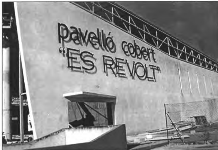
El pavelló cobert gairebé ja està acabat