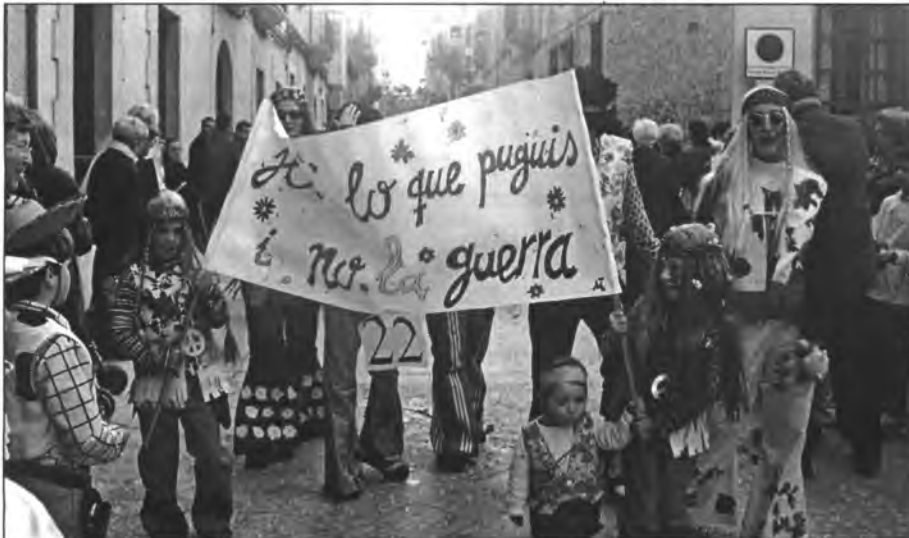
A la rua del carnaval també es féu patent el no a la guerra