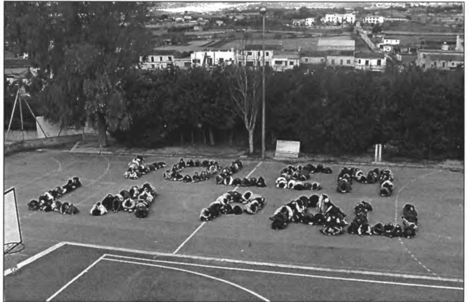
D'aquesta manera es col·locaren els alumnes en el pati de l'escola per demanar la pau

I - El compromís de tots els governants del món a resoldre els conflictes