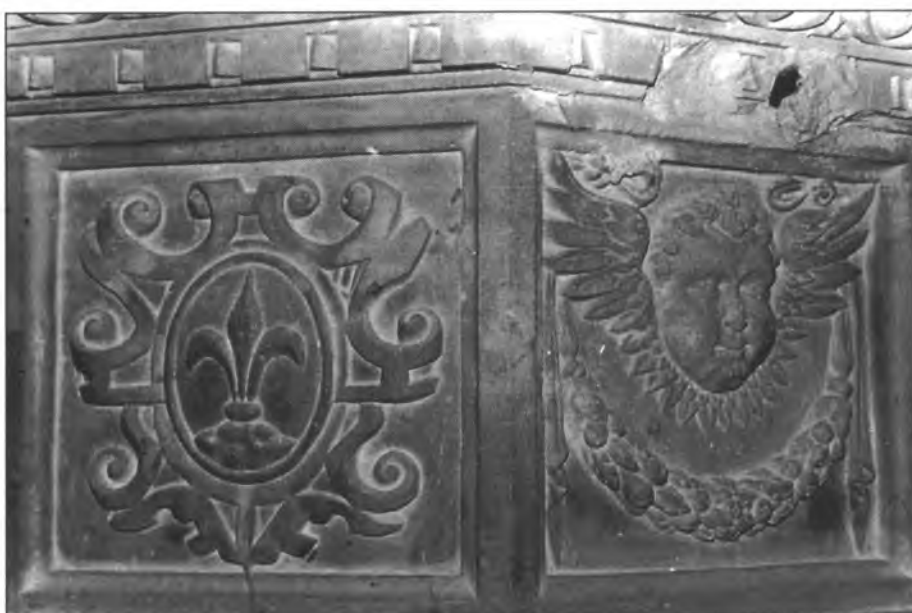
Detall ben eloqüent de la pila baptismal de la nostra església, on es destria a més de la cara d'un àngel, l'escut de Montuïri en relleu

Seguint amb el calendari establert a principi de curs, el dijous dia 20 a les 20'30h reunió de formació a la rectoria amb els pares i mares dels infants de la catequesi de primer i segon curs. Vendrà a compartir la formació na Bàrbara Mayol, mare de família i res-