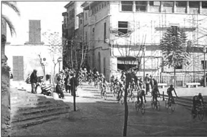
Moment en què els corredors de la volta ciclista a Mallorca passaven per la plaça de Montuïri