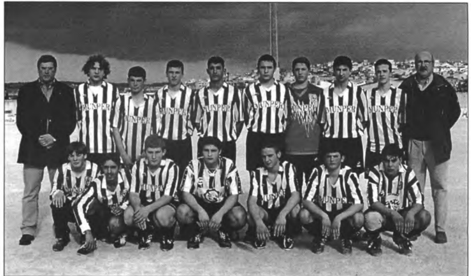
L'equip de juvenils de Montuïri de la temporada 2002-2003

Lapis Montuïri, 35 - Sa Pobla, 48 Drac Pla, 65 - Lapis Montuïri, 53 Lapis Montuïri, 35 - Sant Josep, 70