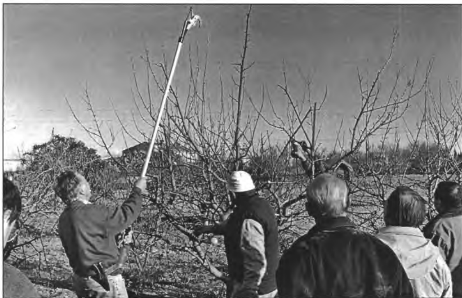
La poda mecanitzada va complaure els assistents

A la vinya també, segons el sistema de plantada i la varietat de raïm, s'han de podar de diferent manera. Si esta emparallada, si són raïms de taula es deixen els caps més clars que als destinats a vinificació i dins aquests encara hi influeix si són d'una casta o altra. Si estan en forma de vas també s'ha de formar el cep posant esment