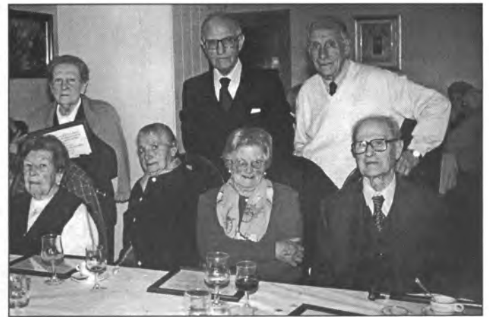
L'Associació de Persones Majors va nomenar socis d'honor als socis majors de 90 anys