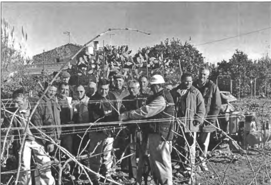
Les lliçons pràctiques del curs d'exsecallar foren ben ateses pels aprenents