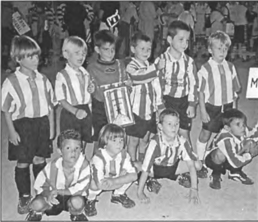
L'equip de futbole en el Torneig de sa Llum