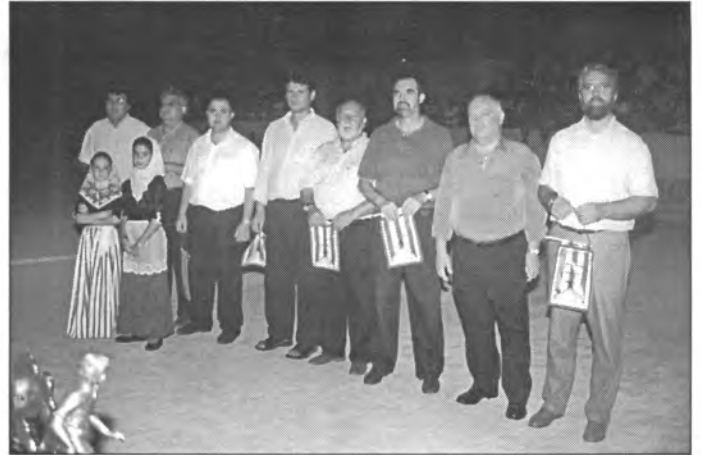
Autoritats i directius presidiren la inauguració del Torneig