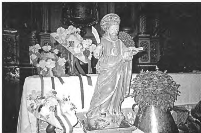
Enguany a l'Altar Major a més de la imatge de Sant Bartomeu s'hi col·locaren alguns capells de cossiers adornats amb flors