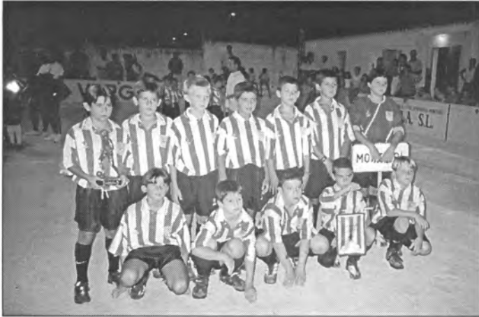
L'equip d'alevins en el Torneig de sa Llum