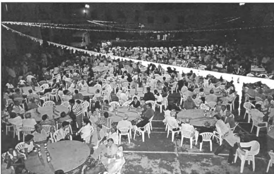
Els matrimonis que enguany compleixen les noces d'or (a d'alt) foren homenajats El sopar de la lluita contra el càncer (a baix) va reunir molta gent