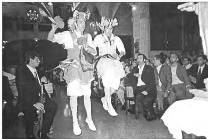
Els cossiers possiblement ballaren l'oferta amb més impuls que anys anteriors. I reberen més aplaudiments