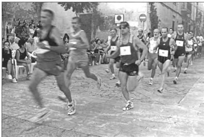
La cursa popular de St. Bartomeu a 2 milles fou molt participada