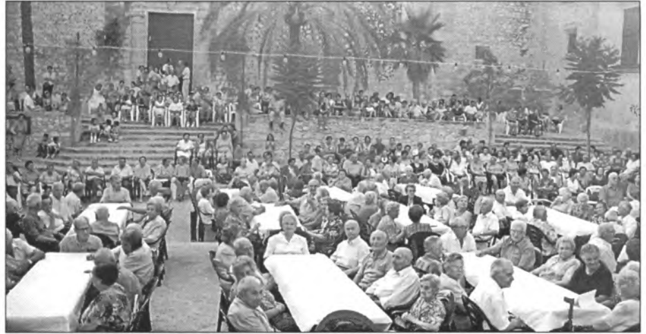
La festa de la gent de 3 a Edat fou molt participada i satisfactòria pels homenajats

Nota.- Bona part d'aquesta entrevista s'ha extret d'una altra publicada a la revista "Ressò de Campos", firmada per Antònia Sitjar Valls.