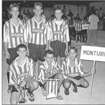
Els Infantils F-7