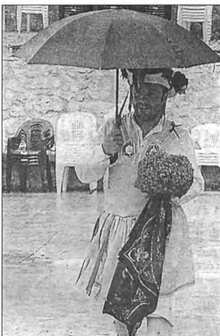
En mig de la pluja, un cossier amb paraigua es dirigeix a l'església