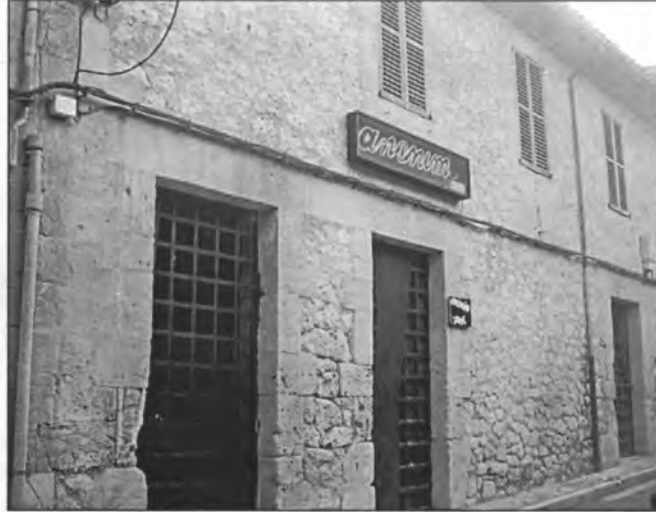
En el carrer de Baix, damunt allà on ara hi ha l'"Anònim," s'hi va instal·lar la delegació de l'Obra Cultural Balear

També a la mateixa reunió es parla sobre les crítiques sofertes per la delegació des de diferents sectors del municipi i la postura dels membres de l'Obra respecte a aquests atacs: " Davant unes fortes crítiques que s'han fet a l'Obra aquest estiu 4 (massa politització, atacs de ser comunistes, catalanització, retreure vells odis, homenatge a Joan Mas Verd –Collet-, xafarderies de que cobram dels partits i que ens posen multes, etc.)