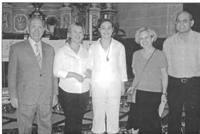
El jurat qualificador dels concursos de conte curt d'enguany