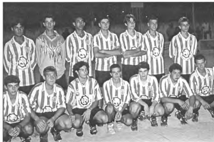
Els equips de Benjamins (esquerra) i Juvenils que en el Torneig de sa Llum aconseguiren esser campions dels seus grups