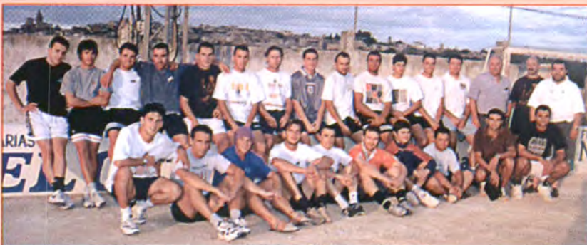
14 montuïrers dins la plantilla de 3ª divisió

Descobert un tercer talaiot a Son Fornés i averiguada la situació d'un quart