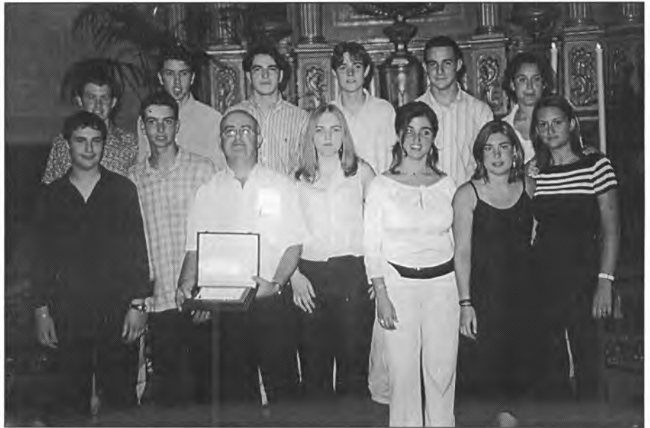
Els 12 joves montuïrers amb el seu catequista que el passat 13 de juliol reberen el sagrament de la confirmació

"Hem va saber molt de greu no poder-hi assistir. Per això ara vull transmetre un reconeixement a tota la feina que està fent Bona Pau , perquè un poble que es vol sentir lliure ha de tenir tot quan necessita, i és precisament a rel d'aquest mitjà de comunicació com es