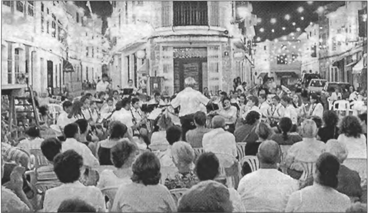
L'actuació de la banda de música de Montuïri a Es Mercadal va despertar una gran expectació