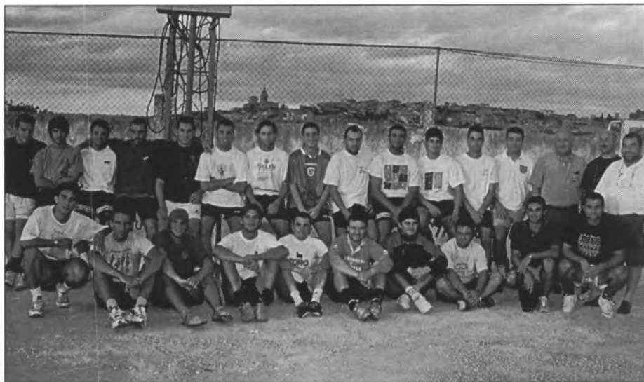
El passat 26 de juliol es féu la presentació de l'equip de 3ª divisió en Es Revolt