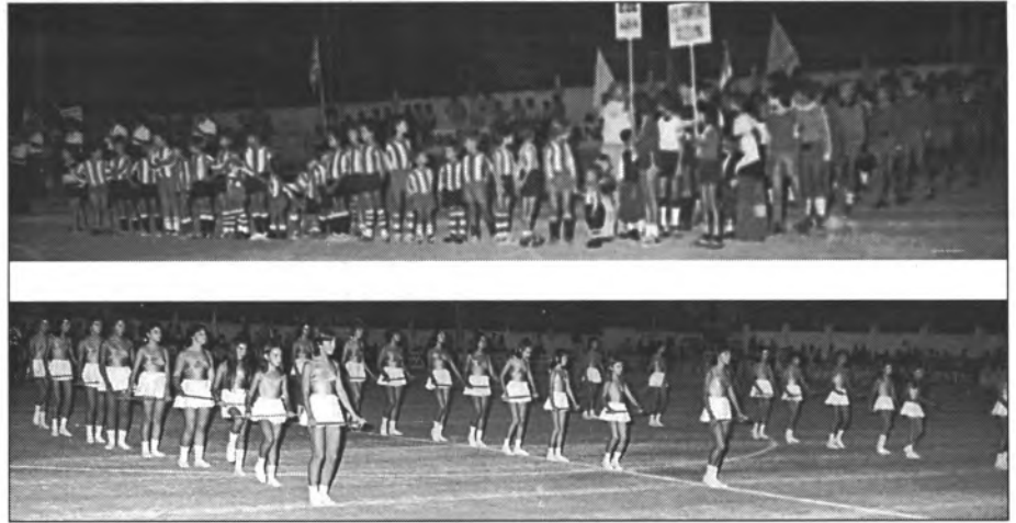
Dos moments de la presentació del X Torneig de sa Llum, de 1982. Han passat 20 anys i naturalment els protagonistes ja en tenen 20 més

23'30h: Lliurament de trofeus i cloenda.