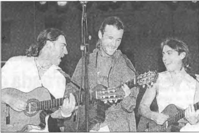
El conjunt de rock "Café Quijano" va presentar a Montuïri "La taberna del Buda"