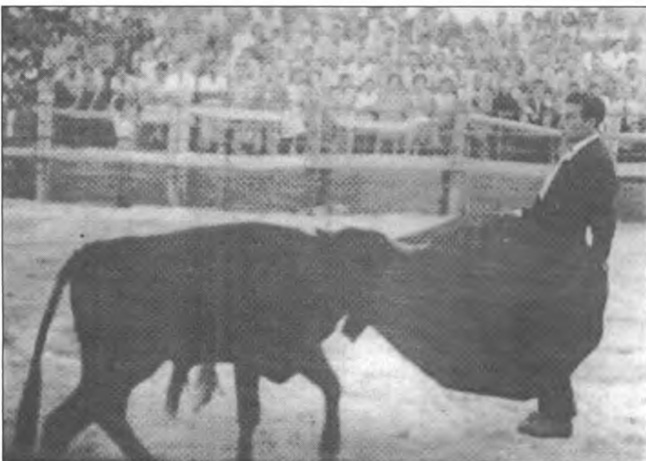
L'actuació del "Niño de la Palma" a Montuïri fou molt aplaudida el 23 d'agost de 1952 pel nombrós públic que es destria presenciant la "corrida"