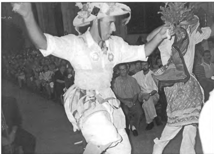
El ball de l'oferta dels Cossiers, deu anys enrere

Dia 24, festa de Sant Bartomeu, l'Eucaristia serà a les 11'30 hores.