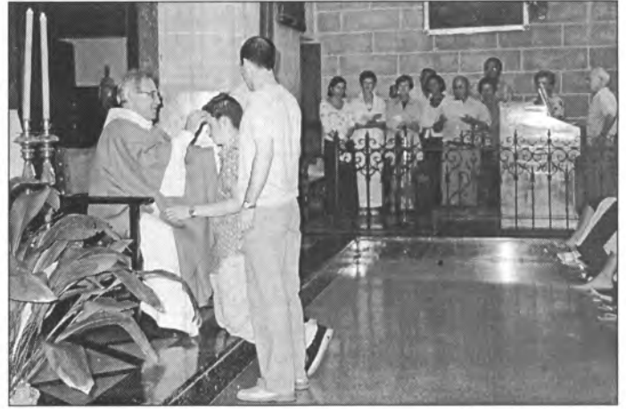
El Vicari Episcopal va impartir del sagrament de la confirmació a 12 joves montuïreres