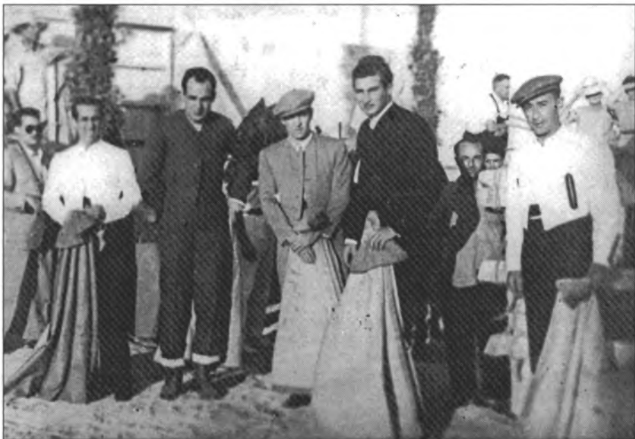
La "quadrilla" dels toreros que varen inaugurar la plaça de Montuïri. Els dos totalment d'obscurs són en "El Niño de la Palma" i Pepe Bienvenida

Vaig sentir alguns aficionats que havien vingut de Porreres i no se'n podien