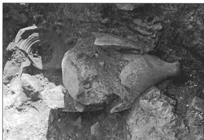
Al talaiot 2 (a l'esquerra) no s'han aturat d'excavar-lo i netejar-lo totalment. A la dreta veim una àmfora romana en part rompuda i enterrada, però encara sense haver-la tocada del lloc on es va descobrir

cases d'aquest barri industrial no són vivendes, si no més aviat tallers on no hi manca el forn per coure ceràmica".