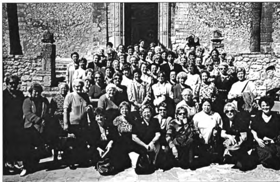
Grup de l'Associació "Dones d'Empenta" de Ciutat que dia 21 de març passat vengueren a visitar Montuïri i foren rebudes pel batle i obsequiades, cadascuna d'elles, amb un "pin" del capell de "Sa Dama" dels Cossiers