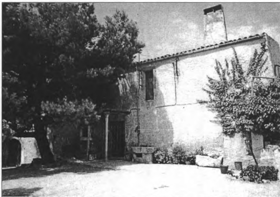
La possessió de Galiana en el segle XVI ja disposava de bones terrers per al conreu

Al llarg del segle XVI la major part de la població montuïrera vivia de l'agricultura. Els cereals, la vinya i la figuera eren els cultius predominants. El blat entrava en una rotació de cultius amb l'ordi i la civada. També es cultivaven a una