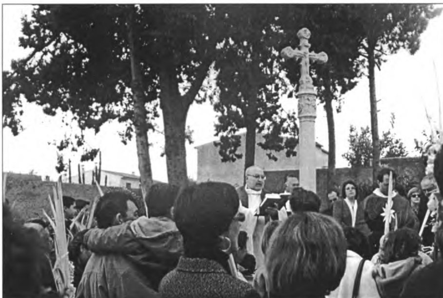
La processó del dia del Ram enguany va començar a la Creu de Son Rafel Mas. Fou la primera vegada des que està instal·lada a la placeta del Pou des Dau

Fa uns mesos que el Sr. Bisbe du a terme la seva visita pastoral als diversos arxiprestat de l'Església de Mallorca. A mitjans d'abril començarà a visitar les comunitats de l'arxiprestat del pla. Està previst que la visita a la comunitat parroquial de Montuïri sigui el dia 1 de Maig . Convidam tota la comunitat cristiana a participar de l'Eucaristia que es celebrarà a les 20'00. Ens agradaria que aquesta visita pastoral fos el màxim profitosa per a tota la comunitat.