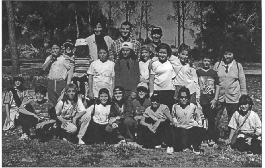
A dalt, els alumnes participants a la "Diada de la Natura" i a baix, moment de la sembra d'un dels pins, amb el batle i el regidor de deportes i joventut

Una primera diada de la natura organitzada per l'Ajuntament, la qual deixa les portes obertes per a properes edicions i de la què particularment tant els alumnes com els responsables en romangueren ben satisfets.