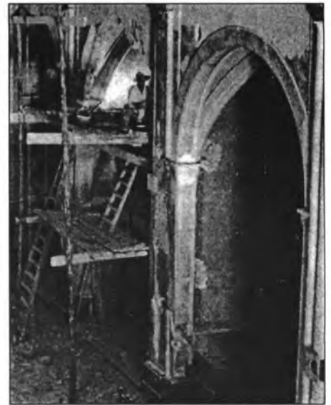
Encara podem veure els bastiments quan havien de començar a descloscar la que avui és capella de Sant Pere