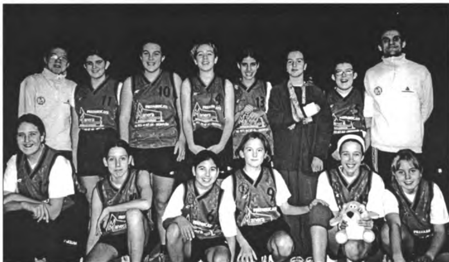
Equip de bàsquet femení Montuïri Manera

Cal afegir, també, que ocupà el 4t lloc d'Espanya a la prova dels 200metres llisos "indoor", establint una marca de 28 segons i 97 centèsimes.