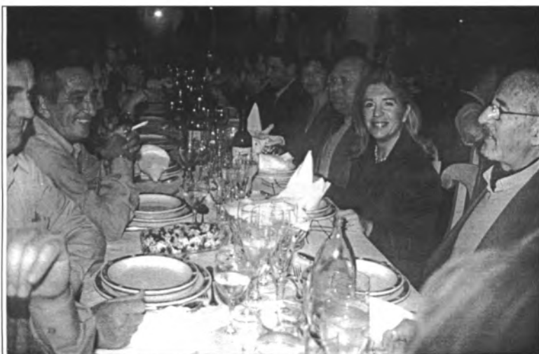
El sopar a benefici de la lluita contra el càncer fou un èxit