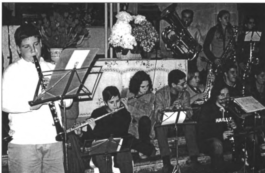
El dia des Puig l'aiguada va impedir que els balls es fessin a l'esplanada. Així i tot la banda va tocar a l'interior de la capella i allà mateix s'improvisà una ballada