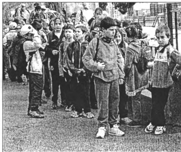
Els nins de les Escoles anaren al mercat de Sineu