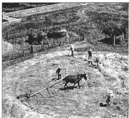
Fins fa 50 anys encara es batia damunt l'era

destacava la fertilitat de les terres i esmentava que anualment es recollien 11.000 quarteres de blat, 7.500 d'ordi i 5.500 de civada. També s'hi cultivava molta vinya, que es localitzava sobretot a la zona sud del municipi. Pel que fa al bestiar el 1585 hi havia 1360 caps d'oví, 151 de porquí, 131 d'equí i 58 de boví. Els ramats es concentraven majoritàriament a les grans possessions de la contrada.