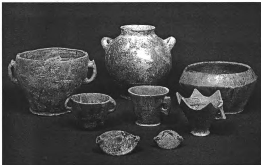
Entre la ceràmica descoberta a Son Fornés s'hi troben àmfores romanes