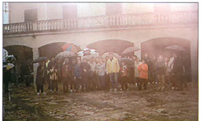
La pluja no fou obstacle perquè un bon grapat de persones es concentràs a plaça per partir cap el puig el dia de la festa