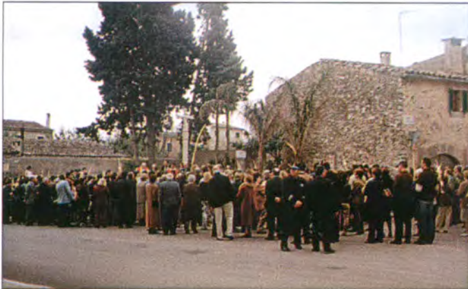
Molta gent es concentrà davant la Creu de Son Rafel Mas per assistir a la processó del dia del Ram