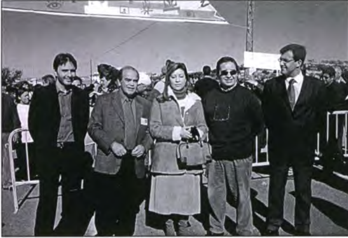
La presidenta del Consell de Mallorca amb dirigents del departament de Medi Ambient i Natura