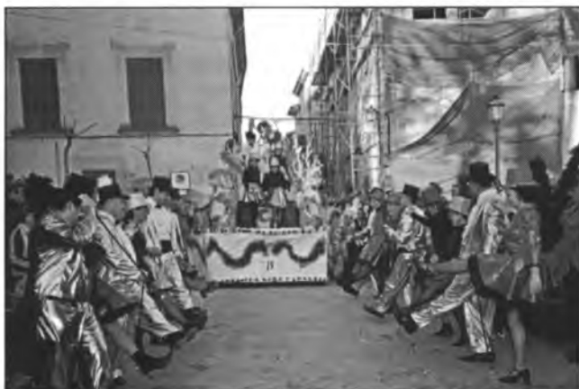
Les manifestacions culturals o lúdiques sempre tendran cabuda a Bona Pau