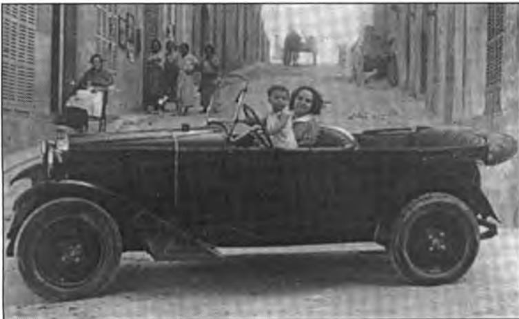
Un dels primers cotxes que hi hagué a Montuïri, del que en parla l'autor