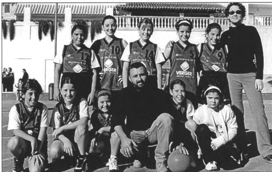
Equip de bàsquet mini femení Montuïri Verger