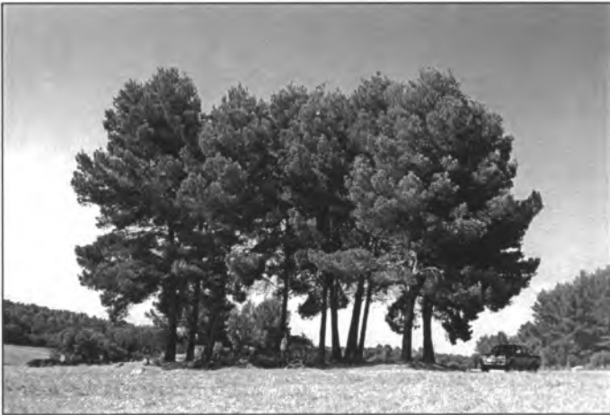
Pins del sementer al costat de Sa Maimona, descrits en un poema de Lluís Servera