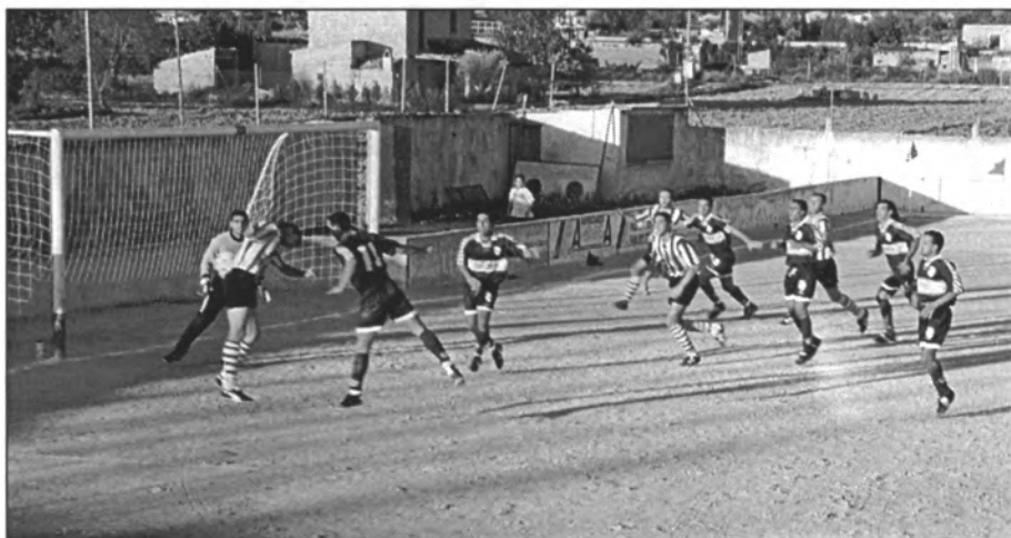
Llançament d'un córner en un dels primers partits d'aquesta temporada, en Es Revolt