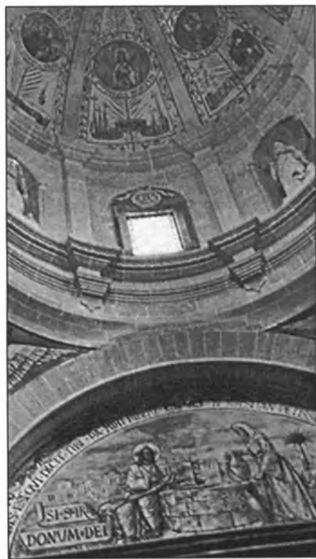
Detall de la part superior del Roser