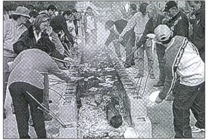
A l'hora del dinar, una multitud s'arremolinava a l'entorn del foc per torrar els ingredients que havien de menjar