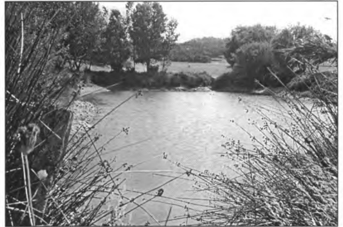
Llac d'Alcoraia. Al fons, Montuiri, encara que en aquesta vista no es destriï