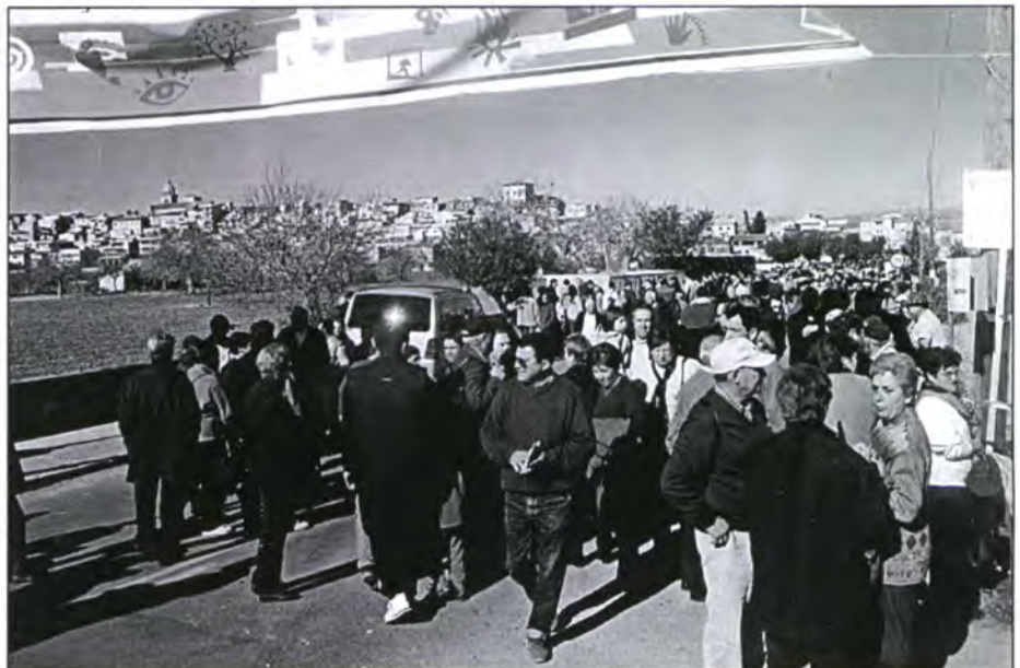
Des del cementeri fins a la vila, la carretera estava plena de gom a gom