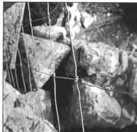
"Ses tres fites", pedra triangular que indica el límits dels termes de Montuïri, Algaida i Lluçmajor

Començam el recorregut a camp a través i ens dirigim cap el llac. El trobam abans d'arribar al sementer de les figueres o figueral i l'ametlerar. Éstam en lloc ombrívol, fresc, plaent, i ple de vida; on l'oratge és anònim i l'alegria intensa . Certament hi trobam oratge, fresca ombra i l'alegria que hi dóna la flora i fauna que