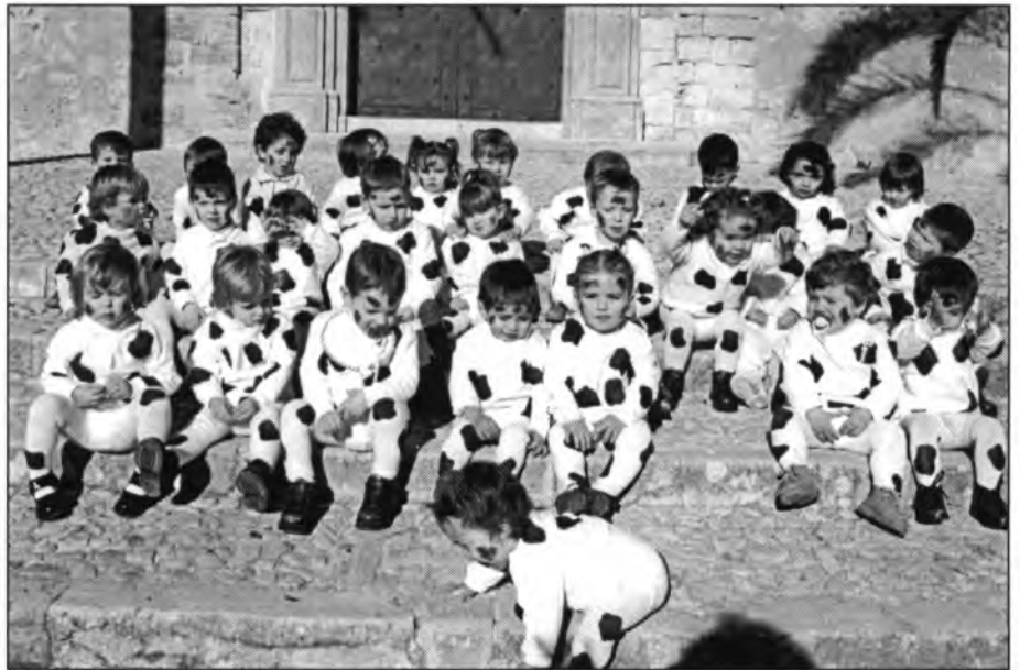
Els petits de l'escoleta "Molinet de Vent" el dijous llader, dia 7 de febrer, així disfressats es fotografiaren a l'escalonada d'es Graons