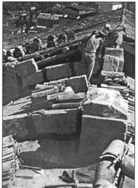
Encara es destria un dels obrers que treballava a la teulada de l'església

Després d'una curta estada, començaren les obres en el Roser. El seu estat era tam-