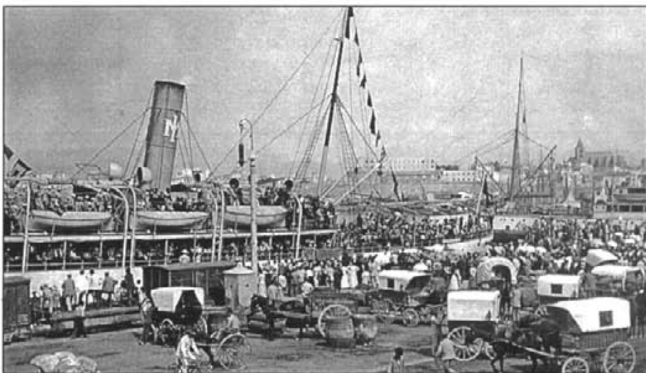
Sortida d'emigrants del port de Palma l'any 1913

Plaça Rector Rubí, 3 Tlf. 971 552 614 Fax 971 462036 07500 Manacor