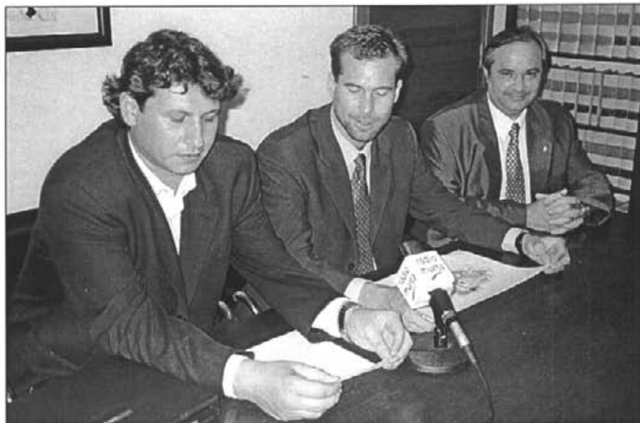
El batlle i el primer tinent de batlle de l'Ajuntament amb la propietat dels terrenys de Son Fornés en el moment de la firma de la cessió

L'Ajuntament ha posat en funcionament el servei de Tanatori o Sala de Vetlla al recinte del Cementiri municipal de Montuïri, lloc destinat a vetllar els difunts per part dels seus familiars i públic en general, el qual ha estat dotat d'aire condicional. Per a la utilització d'aquest servei s'ha de seguir el següent procediment: En cas de defunció a Montuïri o a