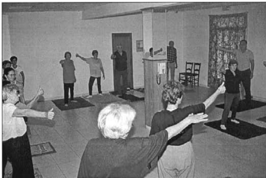
Aquest passat octubre ha començat un curs de ioga amb la participació de persones de Tercera Edat

Nota: Les opinions aparegudes en els articles firmats, sols són atribuïbles als seus autors.