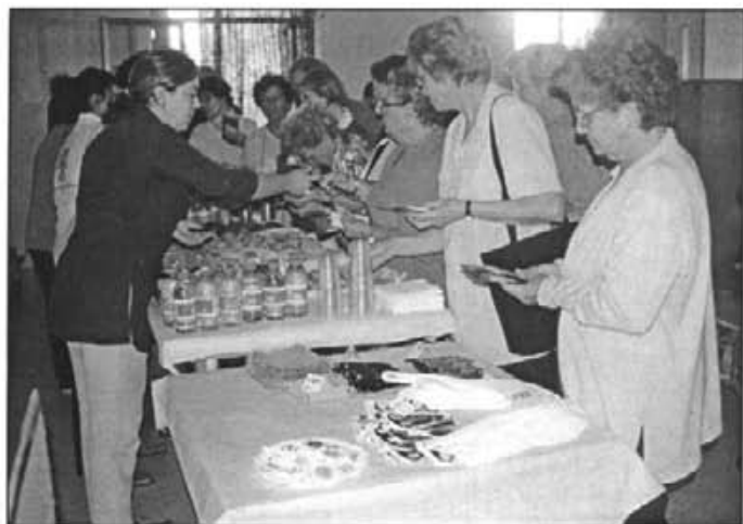
A la xerrada sobre l'Euro es pogueren adquirir objectes