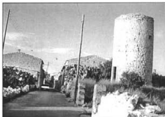
Per aquests indrets del carrer del Molinar possiblement s'hi construïren les primeres cases de la que seria vila de Montuïri