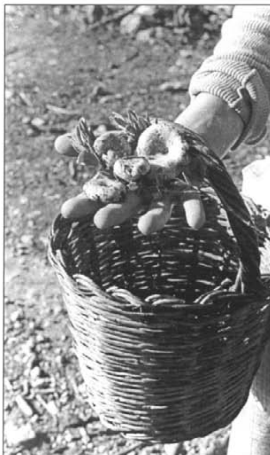
Paner amb esclata-sangs trobats a Montuiri fa uns quants anys