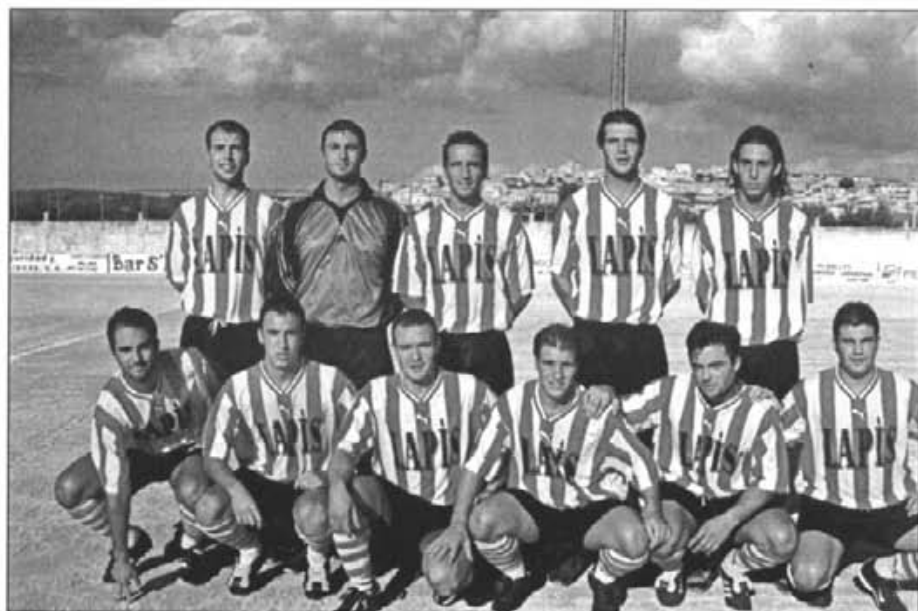
El Montuïri de 3ª divisió nacional a l'inici de la temporada 2001-2002

Després d'una primera part amb total domini del Montuïri, en la que es perde-