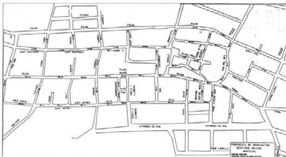
Proposta d'ordenació de sentits únics dels carrers de Montuïri