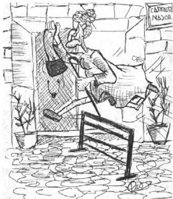
Dibuix de Rafael Pons