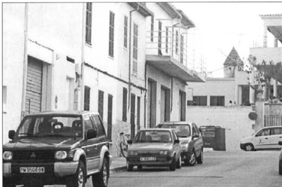
El carrer de Mestre Porcel, anant cap a les Escoles, és d'una amplària adequada. I si a més al fons hi guaita el Moli des Fraret, dins Montuïri se l'ha de considerar encertat

Segons unes declaracions del batlle, l'assumpte de Son Fornés està solucionat. "Hem firmat un conveni –digué– mitjançant el qual dels 100.000 metres de terreny l'empresa ens cedeix les cases de possessió on s'hi podran edificar dos estatges unifamiliars. Hi farem a més un