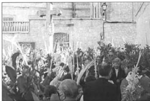
Amb la benedicció de rams, davant Ca ses Monges, començaven les celebracions de Setmana Santa

col·laboració de tanta gent que en les passades festes de Setmana Santa ens ajudaren a fer més participatives i més dinàmiques les nostres celebracions. Estam ben convençuts que això no és cosa d'una persona, sinó d'un bon grapat... Tant de bo que l'experiència d'aquest any la puguem repetir l'any vinent i que disposem de més gent que col·labori amb la parroquia.