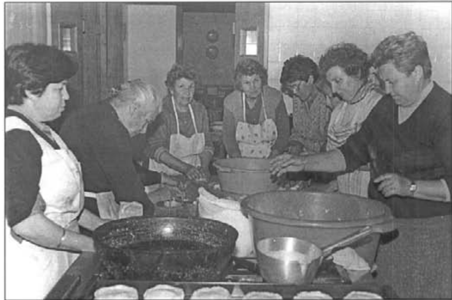
Han passat 14 anys des que aquestes dones de 3ª edat preparaven les panades. Moltes d'elles en sabien i en contaven, de vells adagis pagesos

Febreret curt, pitjor que turc. Si la Mare de Déu plora, s'hivern es fora; si la Mare de Déu riu, lluny és s'estiu. Si tenc calor p'es febrer, per Pasqua tremolaré. Ja mai ha passat febrer, sense vestir s'ametler. Des mes de febrer ses aigos, fems estalvien a l'amo. Sant Macià, s'oronella ve i es tort se'n va. Flor de febrer, omple es graner.