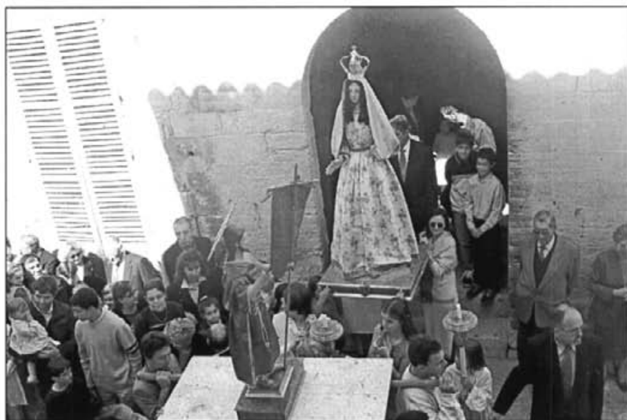
La processó de l'encontre no va desmerèixer de la d'anys anteriors

La Banda de Música, la setmana dels 6 al 13 de juliol realitzarà un circuit per Itàlia. Està previst que dia 10 oferisqui a Roma un concert a la plaça del Partenon (davant el teatre romà) i dia 13 sia rebuda pel Papa en el Vaticà, amb possibilitat que s'executi un peça, i en aquest cas seria