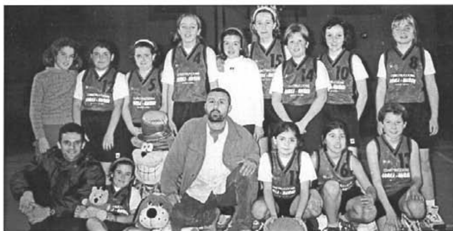
Equip de minibàsquet

Enhorabona, per tant, a la família esportiva del Montuïri: entrenador, jugadors, directiva, socis i simpatitzants.