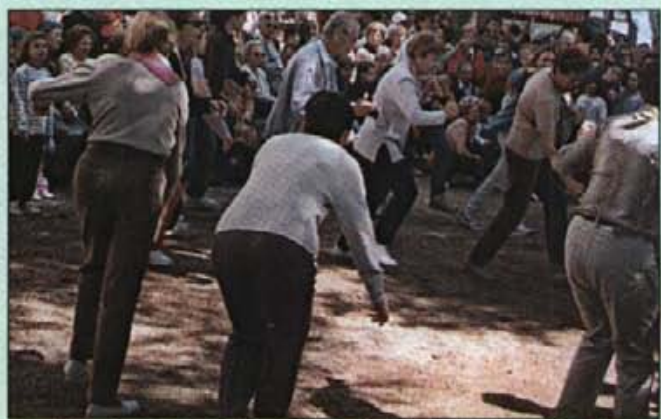
Nombrosa participació als balls de bot en el Puig