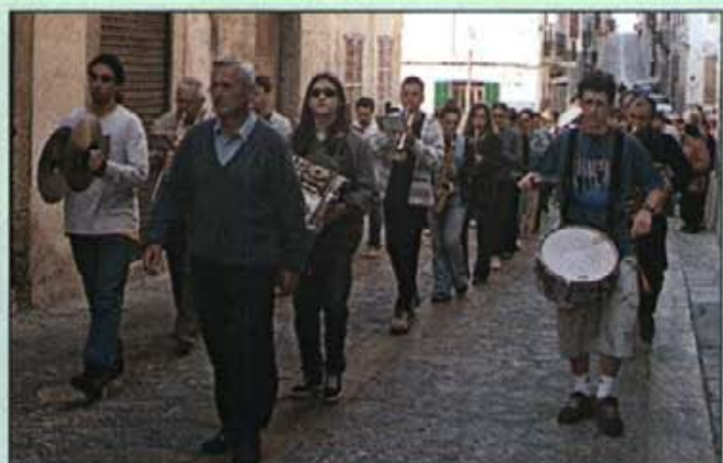
La banda obre la marxa cap al Puig de Sant Miquel