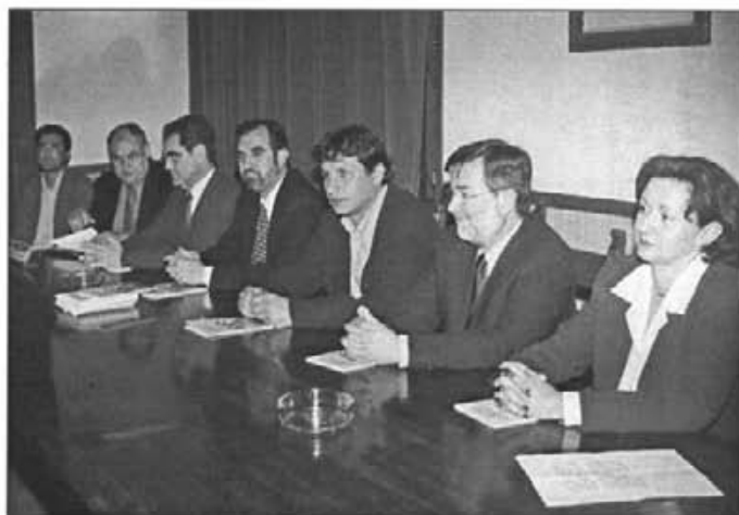
Durant el mes d'abril es presentaren 4 llibres nous. Fet inaudit a Montuïri. I encara se n'haurà presentat un altre dia 3 de maig. Moment de la presentació del llibre dels Contes Curts guanyadors del darrer concurs

Dia 7 el Patronat de Música celebrà l'assemblea anual. (Els lectors en trobaran informació completa a una altra pàgina).