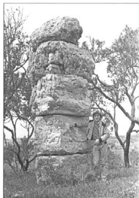
Es Campanar des Moros, dins el poblat talaiòtic de Sabor

4.- Àngel Poveda Sánchez.- Repertori de Toponímia arabo- musulmana de Mayurca segons la documentació dels arxius de la