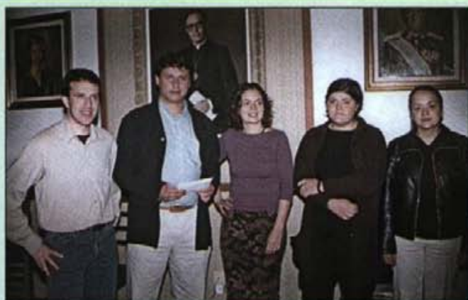
Els guanyadors del concurs d'investigació, amb el batle

Un acte simpàtic, digne d'una obra que haurà de tenir un lloc preeminent dins la història i cultura del nostre poble.