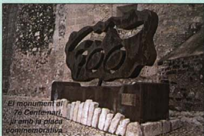
El monument al 70è Centenari, ja amb la placa commemorativa