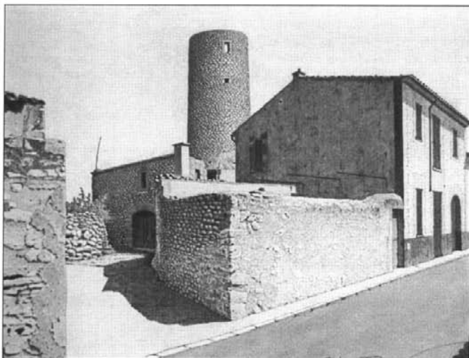
Molí fariner del Molinar, dibuix a plomí de Bernat Colomar

l'anterior. Suposem el cas d'una persona a qui li agrada en grau summe la pintura, però no posseeix l'habilitat de l'artista; pot adquirir aquesta habilitat i dedicar-se a aquest art mitjançant els estudis?