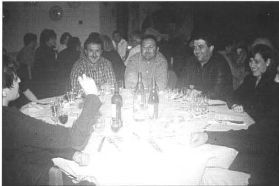
En el sopar a benefici de la Lluita contra el Càncer no hi mancaren joves, els quals s'ho passaren molt divertits

Per no haver-se pogut celebrar el disabte dia 24 a causa del mal temps, el dia següent, diumenge dia 25 al matí tengué lloc la rua del Carnaval. Des de s'Hostal i cap a Plaça va discórrer la cavalcada. Carrosses, comparses i indivi-