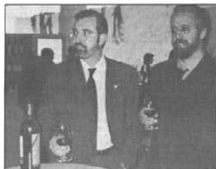
Fins i tot polítics autonòmics montuïrers tastaren vi de denominació d'origen mallorquí a la mostra en el Saló del Vino a Madrid a mitjan febrer passat.

Aquell home sembrà vinya, va fer vi i a la gent que topava la convidava a anar a ca seva a tastar el vi de la seva vinya i només pel fet de donar a tastar el seu vi aviat va tenir molts i bons amics.