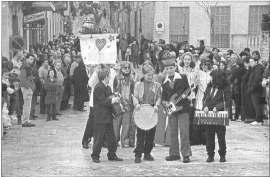
Una comparsa d'al·lots a la rua volgueren imitar els Beatles i se'n desferen bé

duals omplien tot el carrer en mig d'una extraordinària animació i expectació. Tot seguit davant l'Ajuntament s'entregaren els premis als guanyadors.