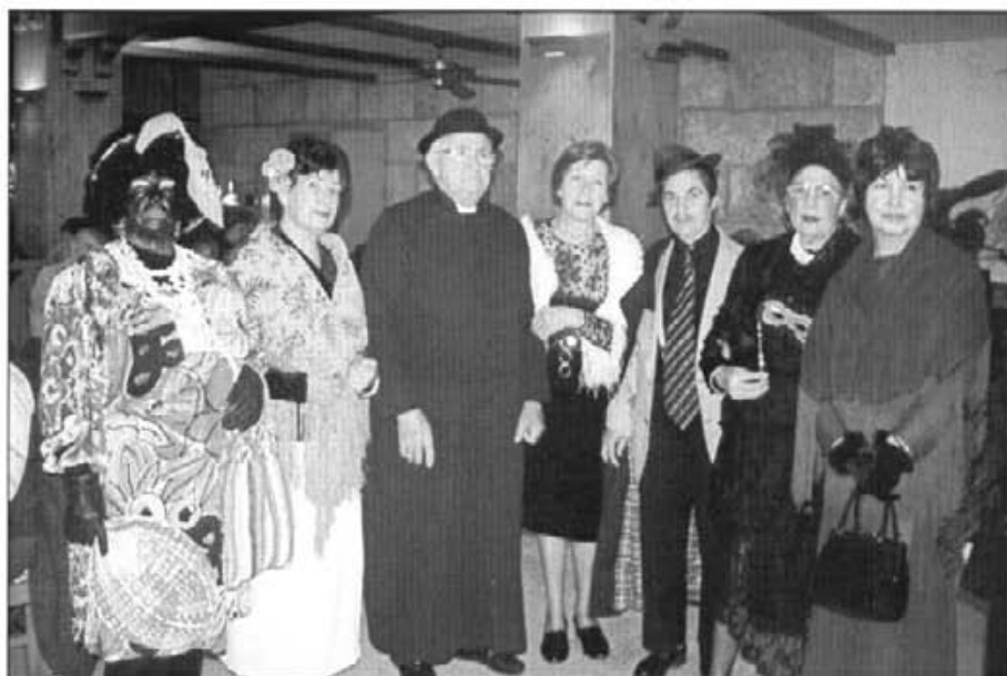
Algunes persones d'edat de la vila encara gaudiren a les passades festes de Carnaval: Així anaren disfressades al dinar de Persones Majors

Nota: Les opinions aparegudes en els articles firmats, sols són atribuïbles als seus autors.