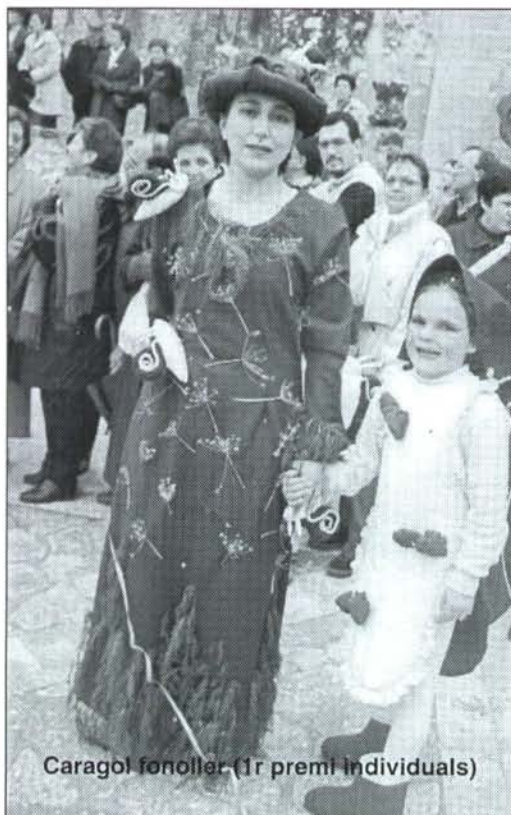
Caragol fonoller (1r premi individuals)