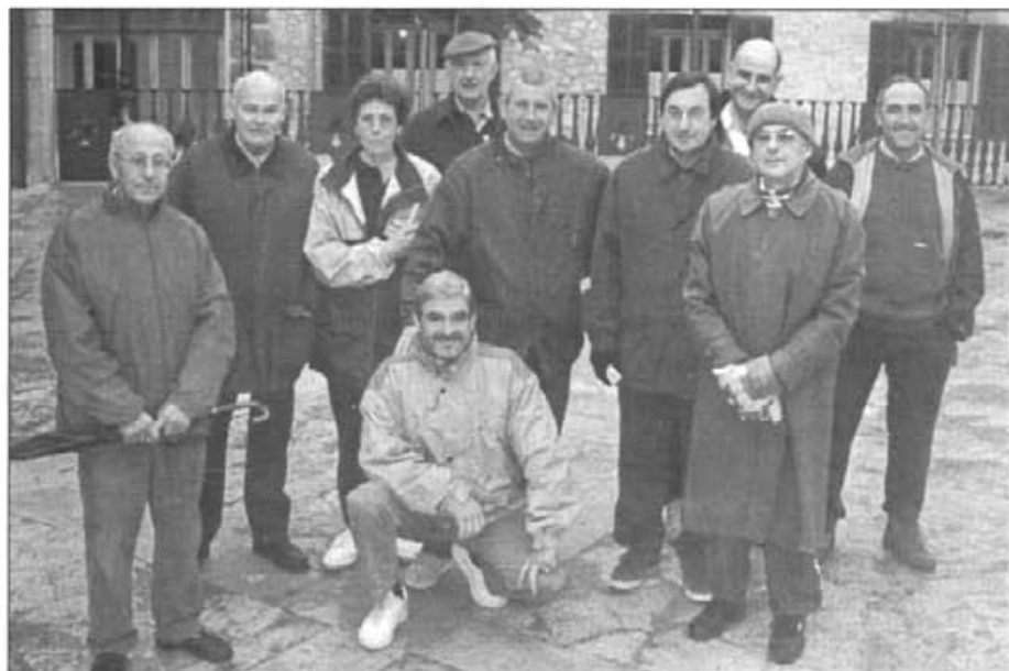
A l'hora de partir cap als Sons Maiols, sols aquests es presentaren. La resta es feu por del mal temps

La pluja va perjudicar el 7è itinerari. La sortida era a les 10 h des de la Plaça. De 39 participants apuntats ens ens presentàrem 8. Per unanimitat decidírem tornar intentar una altra sortida a les 11 h si el temps ho permetia. Del contrari ens veuríem a les 13'30 a Son Mut d'en Guillem "Perons" on celebraríem un dinar de companyonia obert a tots els participants.