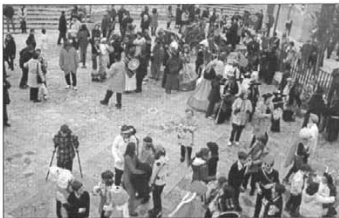
Davant l'Ajuntament, els participants esperaven els premis

Des de l'Ajuntament volem agrair l'excel·lent participació, tant als que van prendre part a la desfilada com a tot el públic en general que va ésser present