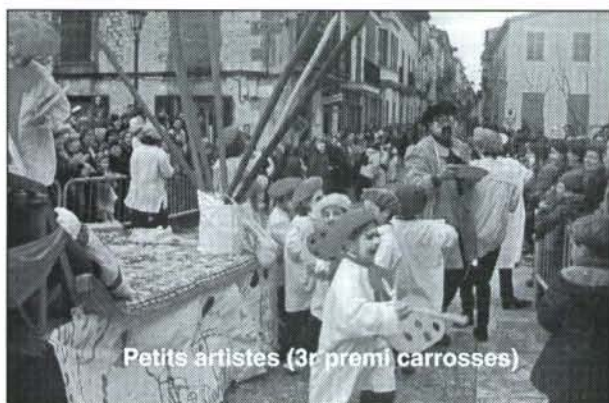
Petits artistes (3r premi carrosses)