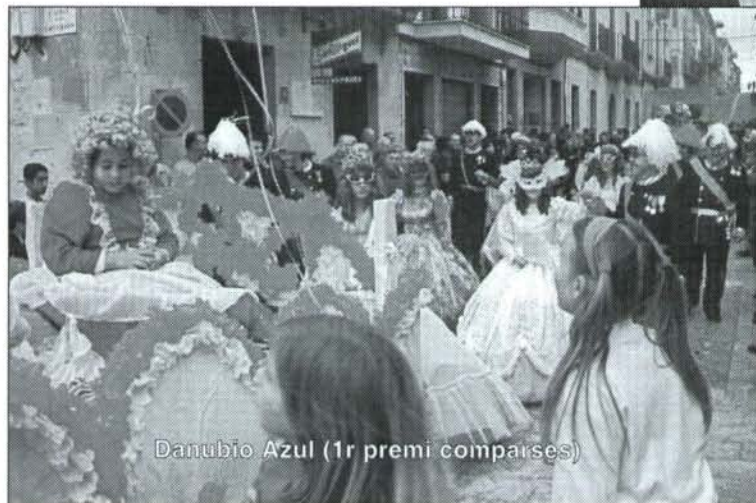
Danubio Azul (1r premi comparses)