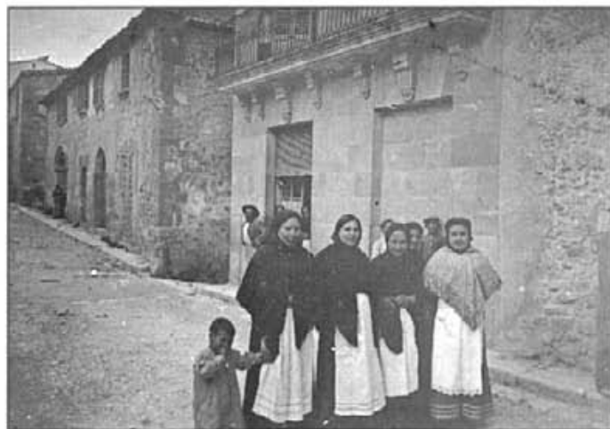
Dones montuïreres a principis del segle XX, amb davantal blanc. Darrere elles, Can Pieres i l’antiga casa de la vila

A propòsit d’impressions de viatge, supòs en voltros es desig que vos conti ses des meu; però la; filletes!, no és s’anada lo interessant, sinó ses seves causes. No és lo vist per terres desconegudes