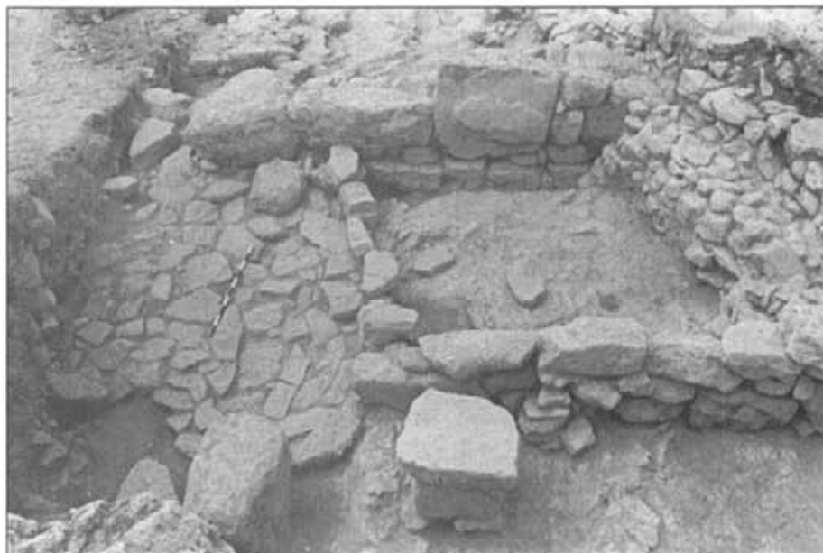
Vista parcial de la casa post-talaiòtica

En el context d'aquesta època, es va fundar a Son Fornés un nou assentament damunt les ruïnes de l'anterior. Fins ara no s'han documentat grans estructures arquitectòniques corresponents al nou poblat. Aquest estava format per diferents vivendes de grandària i contingut diferents, entre les quals s'obrien amples espais a l'aire lliure. L'anomenada "Casa Postalaiòtica 1" és la construcció millor conservada (reproduïda en el gravat). La porta, orientada al sud-est, dona accés a una escala que condueix a una primera habitació de grandària reduïda. Just darrera hi trobam un espai més ample on hi havia una llar envoltada per dife-