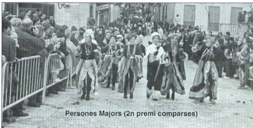
Persones Majors (2n premi comparses)