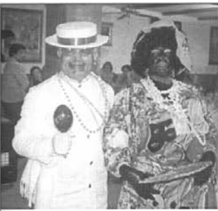
No importa demanar qui eren aquests dos populars disfressats