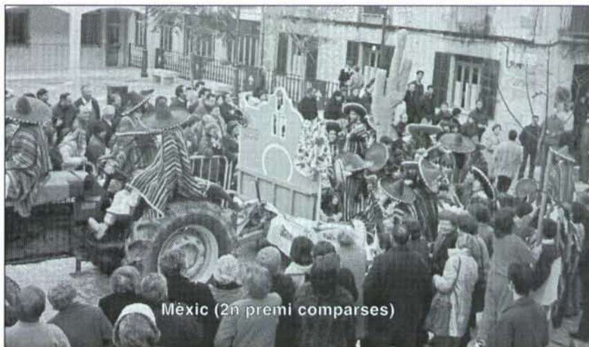
Mèxic (2n premi comparses)