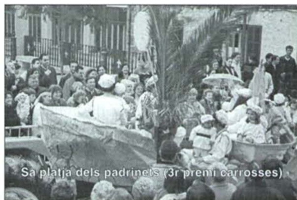
Sa platja dels padrinetes (3r premi carrosses)