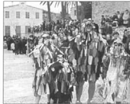
Aqueixa va de caps buits

Sense cap tipus de dubte hem de felicitar als "quintos" i "quintes" del 82, ja que durant aquest any que han realitzat les activitats que els hi pertocaven han sabut estar a l'altura de les circumstàncies. Sense anar més enfora en la Festa de les Beneïdes foren, juntament amb l'Ajuntament i l'Església Parroquial un dels tres pilars que feren possible que aquest acte es pogués celebrar amb tot l'esplendor que li pertoca. Però, sempre hi ha un però. En el tema de les bormes el dia dels innocents, varen confondre les bormes amb els temes personals i, això es molt delicat, perquè com el gepertut, que s'en reia del gep dels altres i no se veia el seu. Es una cosa a tenir en compte per futures generacions de "quintos i quintes", "tant per lo bo com per lo dolent".