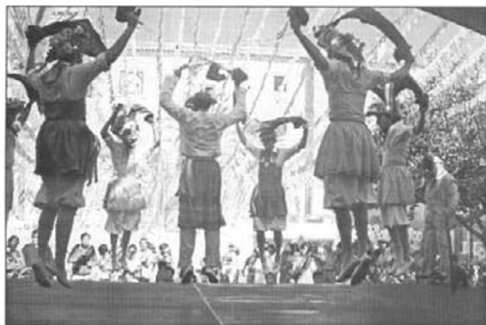
Fora de Montuïri el Cossiers perden tot el seu encant i la seva identitat