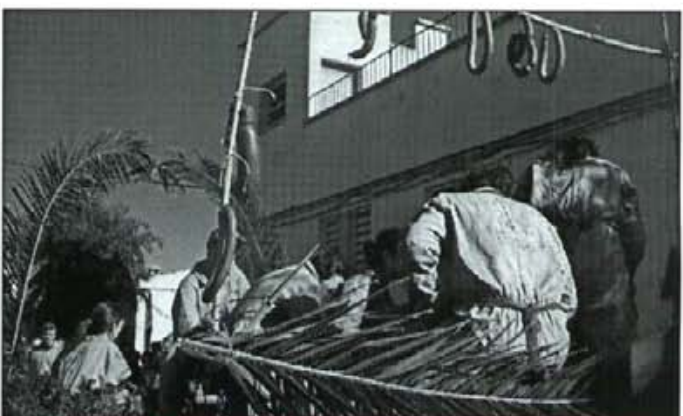
Els "quintos" enguany no desmeresqueren a les beneïdes