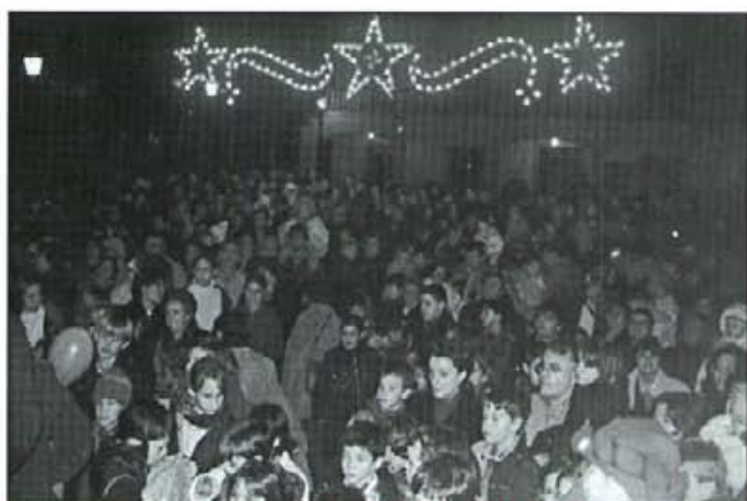
Plaça a l'arribada dels Reis Màgics