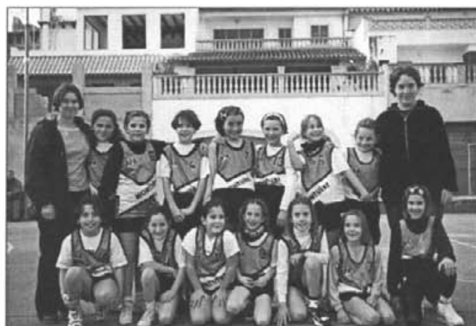
Les nines que componen l'equip de bàsquet escolar