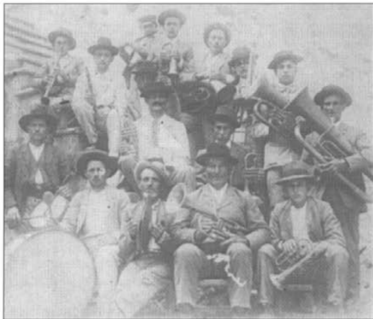
Banda de Música de l'Infern, a la primeria del segle XX