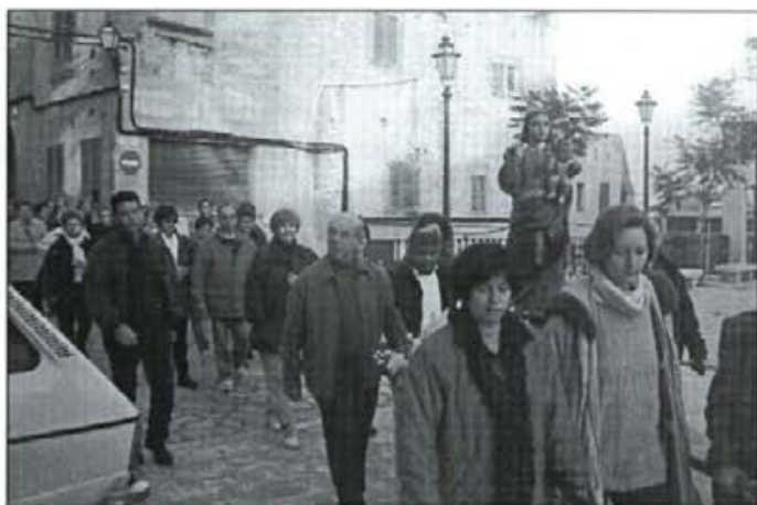
La Mare de Déu de la Bona Pau fou davallada al poble dia 27