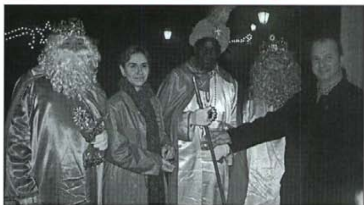
El batle en funcions entregà la vara als Reis Màgics