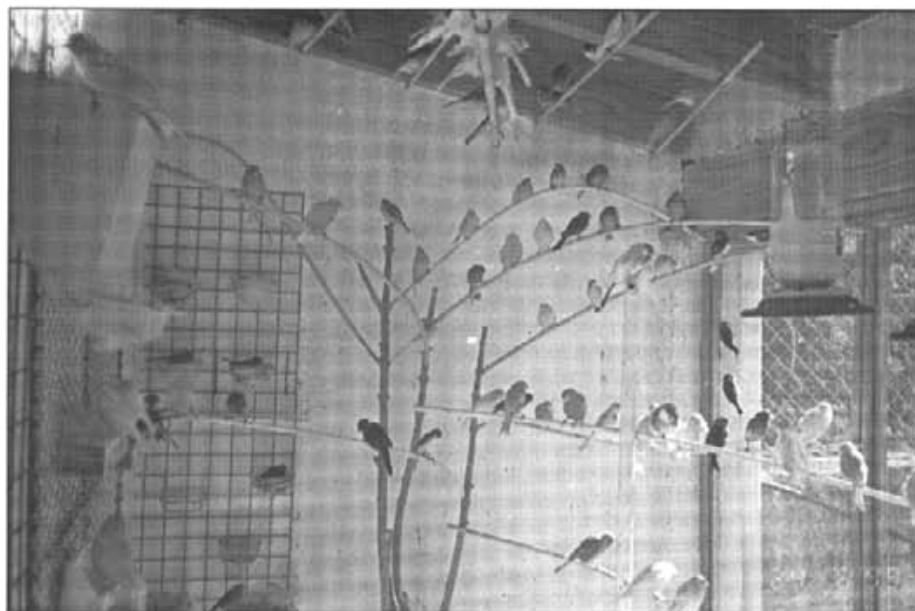
Un esbart dels canaris de Miquel Trias

– Es pot reproduir amb les cadernerres, verderols, verderolins, passarells i amb el