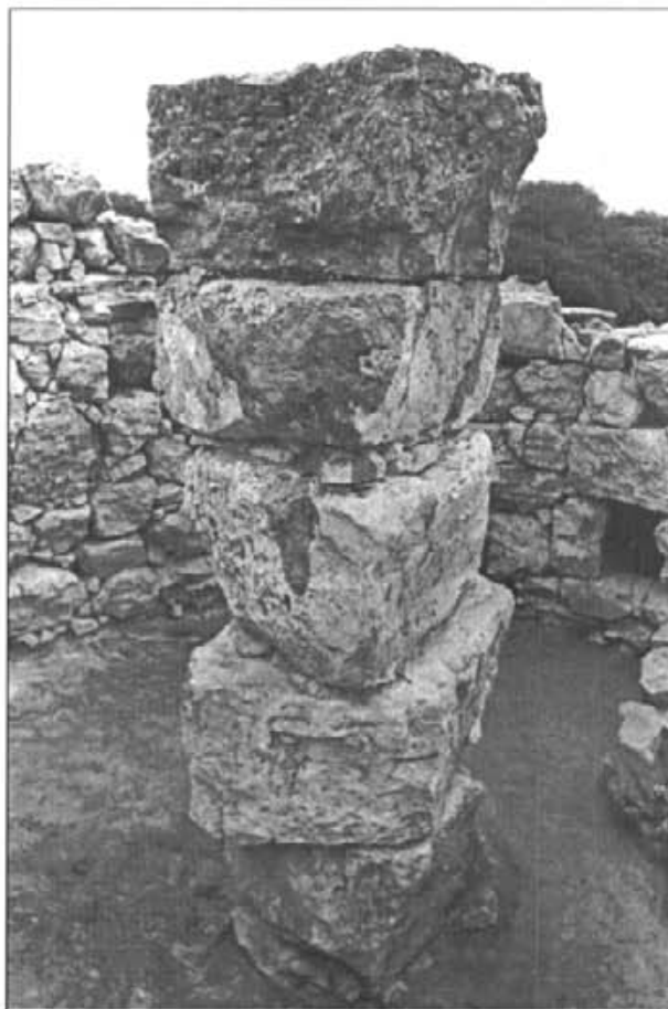
A l'interior del talaiot 1 s'observen els cinc tambors de la columna central i el parament intern

En resum, la societat talaiòtica duia una economia de subsistència on la ramaderia desenvolupava un paper fonamental complementat amb la collita de plantes silvestres i una agricultura de secà a escala moderada. Cada unitat domèstica era en gran mesura econòmicament autosuficient, i la divisió social de treball s'articulava bàsicament a l'entorn dels condicionants del sexe i edat. Així i tot la comunitat participava