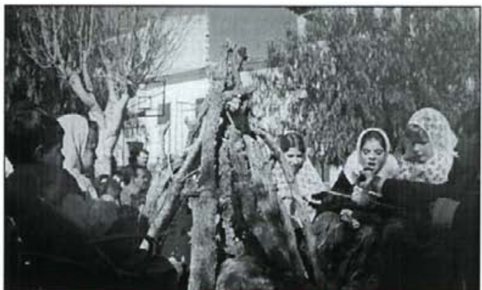
Els nins també cantaren gloses a Sant Antoni