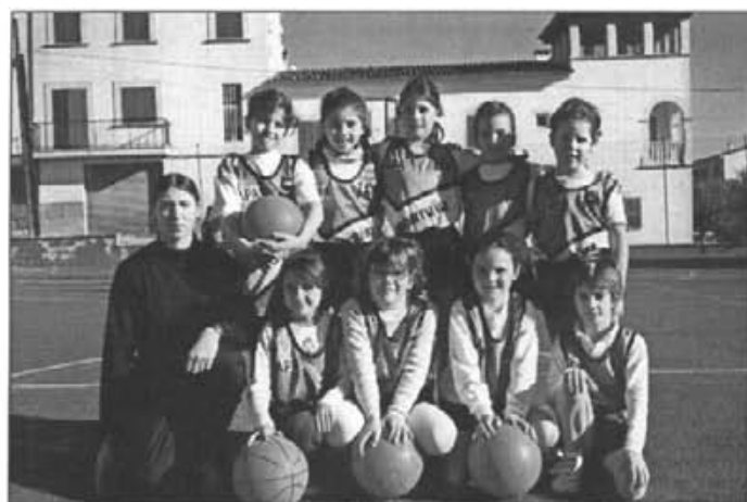
Equip de bàsquet femení iniciació escolar