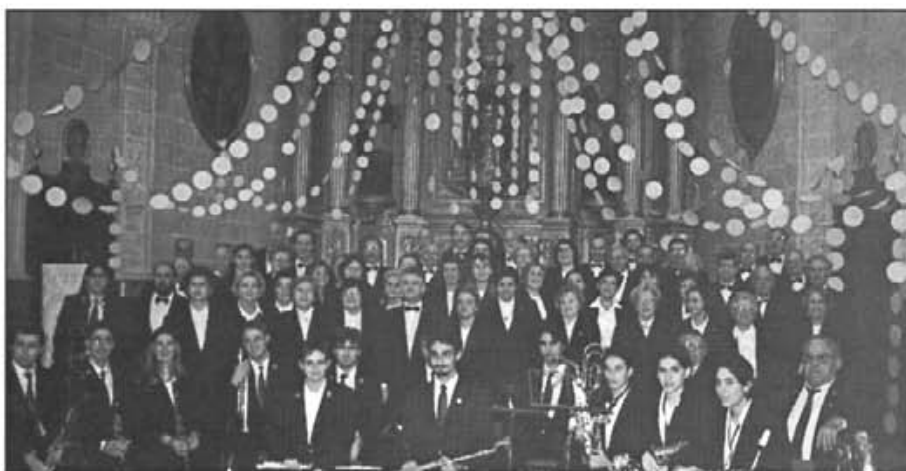
Els components de la Coral Mont-Lliri, de la dels Antics Blavets i del Conjunt Instrumental "Gabriel Miralles" després del concert de dia 7

Els dies 27 i 28 els Cossiers ballaren a Vic (Tarragona) en el marc d'una mostra cultural autòctona que allà se celebra cada deu anys. (N'oferirem més informació al pròxim número).