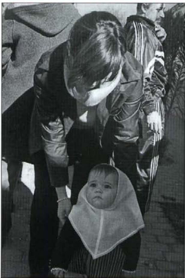
Nins i nines participaren a les beneïdes de Sant Antoni