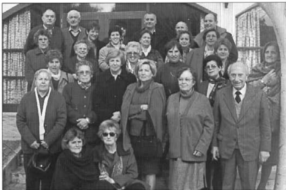
Un any més, era el 27 de gener passat, els redactors, col·laboradors i personal de distribució de Bona Pau celebràrem el 49è aniversari amb un bon dinar

Nota: Les opinions aparegudes en els articles firmats, sols són atribuïbles als seus autors.