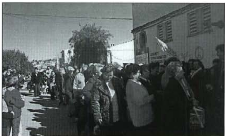
Molta gent de tercera edat va rebre la benedicció de Sant Antoni