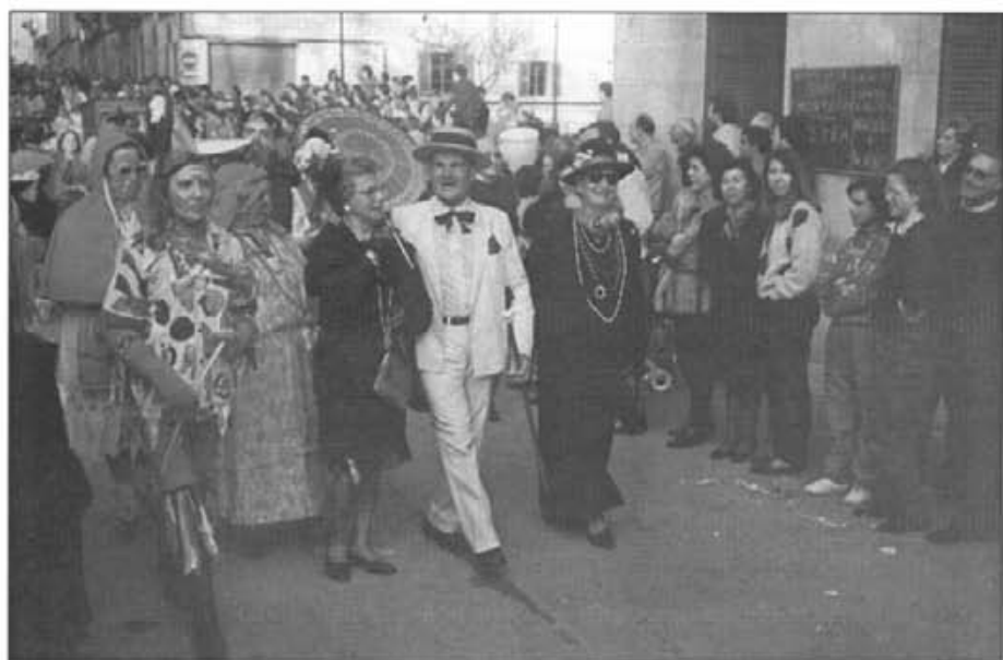
Era un dels primers carnivals al començament de la democràcia

Els joves d'avui ignoren el que havien de fer els nostres padrins en l'aspecte alimentari durant el temps de Quaresma. El qui som de la dècada prodigiosa, els nins i allots dels anys 60, encara ho hem viscut. Durant els quaranta dies que anaven del Dimecres de Cendra fins al dia del Ram i, també durant la Setmana Santa, no es podia menjar carn. “Als darrers dies es menjava es potó des porc i les xulles amb molta alegria. Si no s'acabaven la xulla o la cosa des porc, llavors el dimarts anterior, al comença-