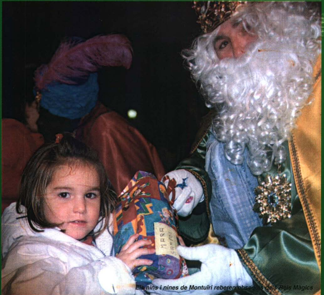
Els nins i nines de Montuïri reberen obsequis dels Reis Màgics

Nº. 576 - Any XLIX - MONTUÏRI - FEBRER - 2001