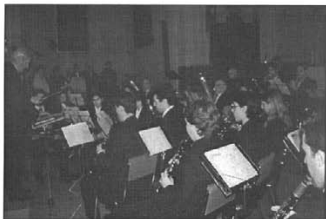
L'homenatge als músics majors i jubilats fou molt emotiu