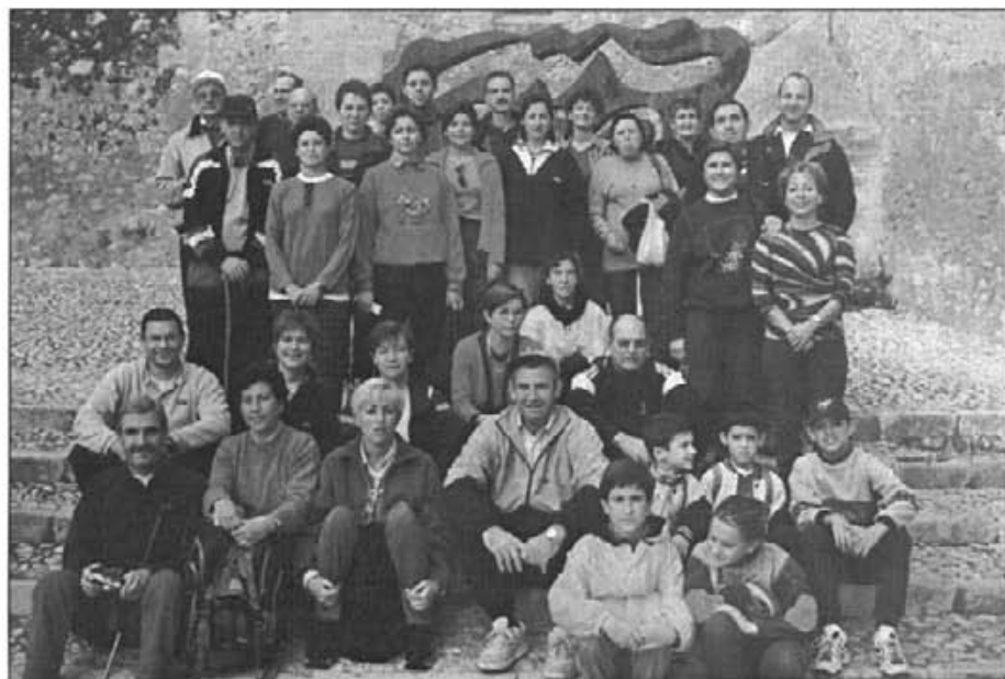
Davant l'anagrama del 7è centenari romangué el testimoni gràfic dels participants

Uns 40 excursionistes de totes les edats, a les deu del matí del diumenge 26 de novembre del 2000 partíem de la plaça de la Vila després d'haver posat per a la foto de família.