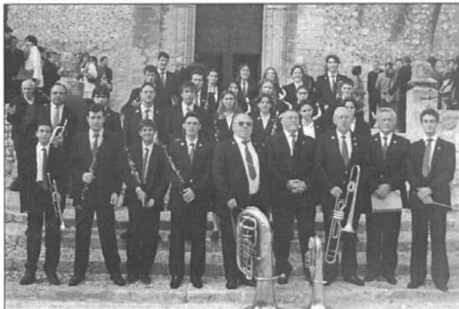
En l'actualitat, a la banda predomina la joventud

L'acte central de la festa d'enguany fou l'homenatge que es va dedicar als músics i a les músiques, majors de 50 anys, que han estat membres de la Banda de Música.