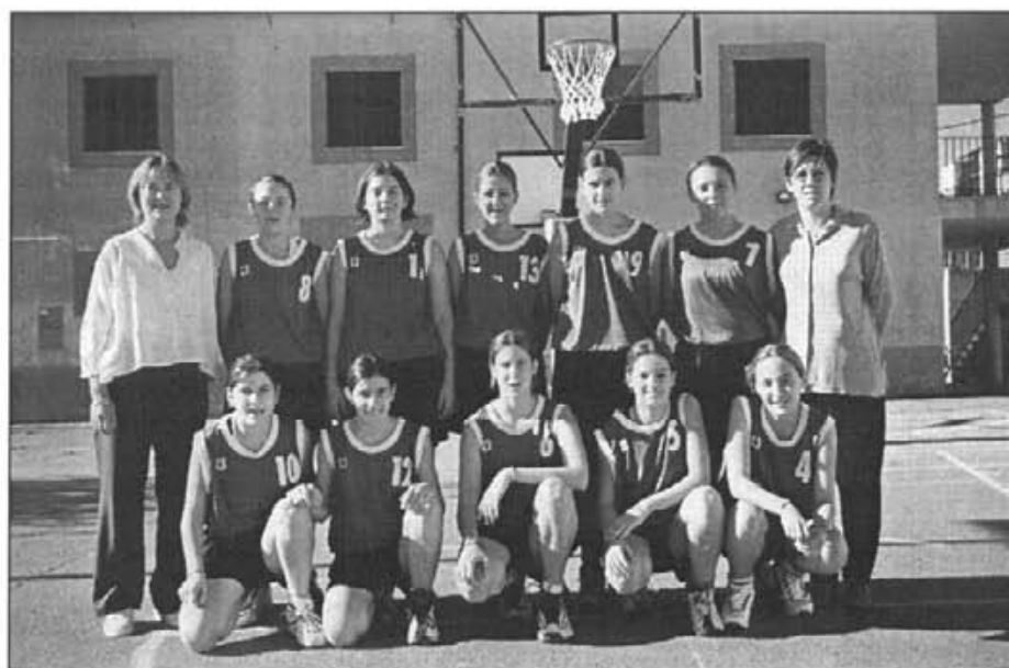
L'equip de bàsquet cadet femení, primer de la fase classificatòria

El mes passat començaren l'activitat comarcal els equips de futbol sala. L'escola presenta dos equips a categoria iniciació. L'equip A juga amb Espanya de Lluçmajor, Algaida, Cala d'Or, Escola Nova de Porreres, Sant Alfons A de Felanitx, Santa Eugènia i Petra A mentre que els rivals de l'equip B són Lloret, Sant Joan, Santanyí, Sant Alfons B i Petra B. La competició es disputa pel sistema lliga i acaba per Pasqua. Després faran les habitual trobades comarcals.