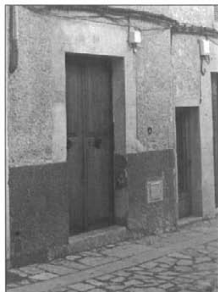
Casa del carrer Major on actualment es troba l'arxiu municipal

Mostrarem a més una sèrie de llibres de talles o impostos municipals directes; llibre de Cadastre municipal; llibres de deixes pies i almoines, i altra documentació com ara Bans i edictes de l'Ajuntament i que es refereixen a Montuïri, principalment dels segles XVIII-XIX; així com també mapes i plànols referents a edificis emblemàtics de la localitat; padrons d'habitants de la vila, així com una selecció de documents de