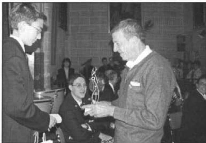
Amb motiu de la patrona Santa Cecília, els músics majors reberen un merescut homenatge

D'aquí a un any Bona Pau complirà el 50 aniversari. Tant de bo que aquests fets serveixin per millorar i per actuar en positiu. La millor celebració serà mantenir i millorar la seva qualitat i la incorporació de saba nova.