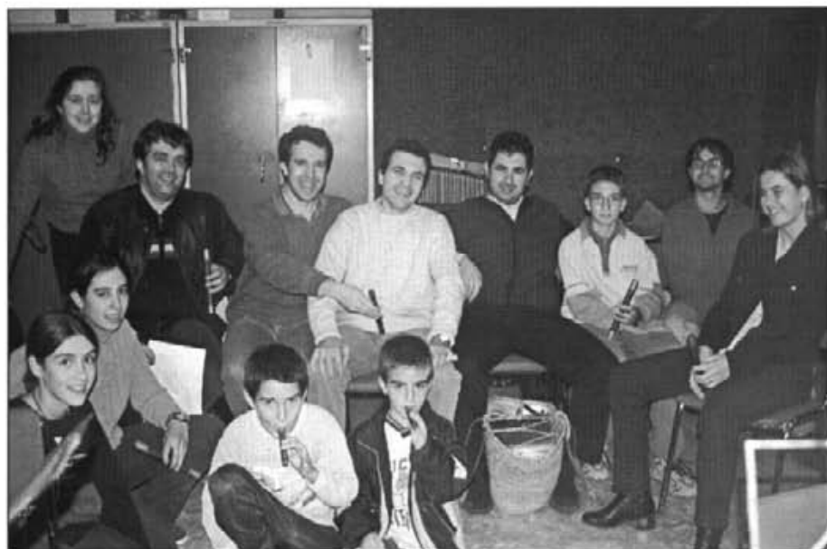
El curs de flabiol i tamborí que va començar el mes passat ha tengut bona acceptació