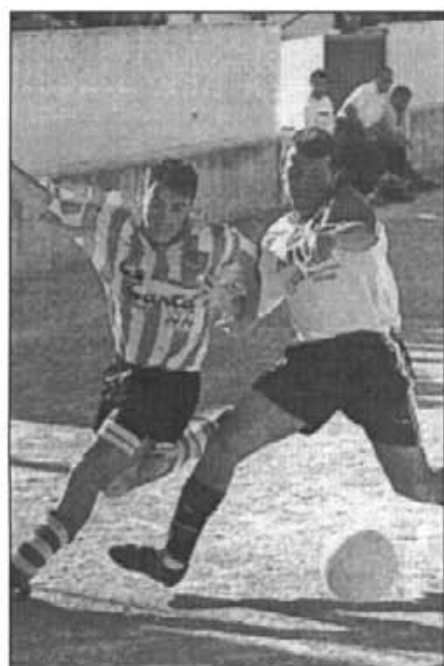
Instantània d'un dels darrers partits de futbol jugats en Es Revolt on el dos contendents s'esforcen per fer-se amb el control del balon