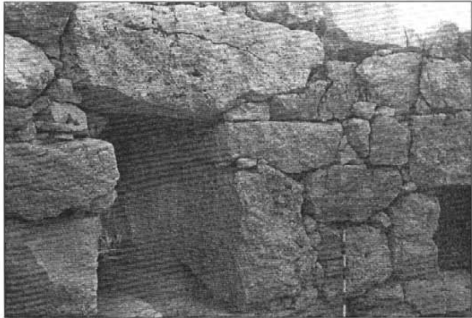
Corredor d'accés vist des de l'interior del talaiot. A la dreta s'observa l'obertura d'entrada a la petita cambra empratada dins del mur

Com bé saben quasi tots els nostres lectors, aquest jaciment arqueològic està situat a uns dos quilòmetres i mig del casc urbà de la vila, dins la mateixa possessió de Son Fornés, exactament en el punt geogràfic 39° 35' 3" latitud i 2° 58' 13" longitud. I a l'actualitat la superfície delimitada per la presència visible de restes arqueològiques d'un o altre tipus sobrepasa les tres hectàrees. Podem dir, per altra part, que aquest jaciment ocupa una posició central en el pla de l'illa de Mallorca, circumstància que podria explicar la importància de les troballes do-