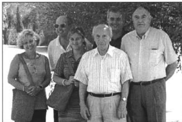
El jurat qualificador amb el representant d'Assegurances Gomila

Els premis del V Concurs Juvenil, patrocinats per l'Ajuntament de Montuïri, es concediren a: