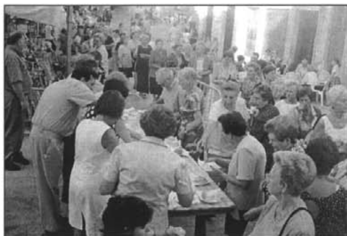
Molta gent participà a la gelatada per a les missions d'Hondures El batlle féu entrega de 600.000 pessetes al missioner montuïrer