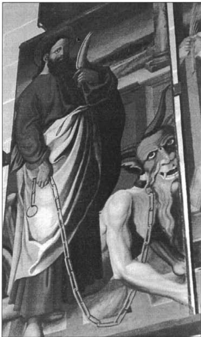
Sant Bartomeu i el dimoni, un dels quadres del retaule