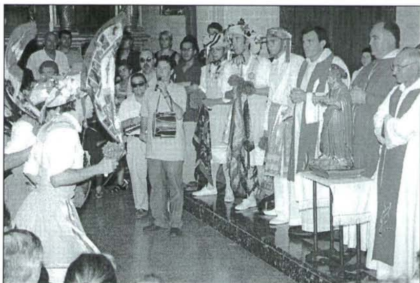
Imatges de Sant Bartomeu 2000