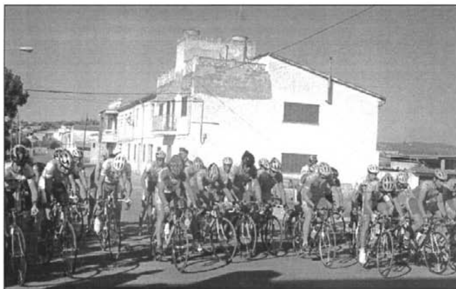
La segona prova ciclista fou molt disputada. Aquesta fou la partida