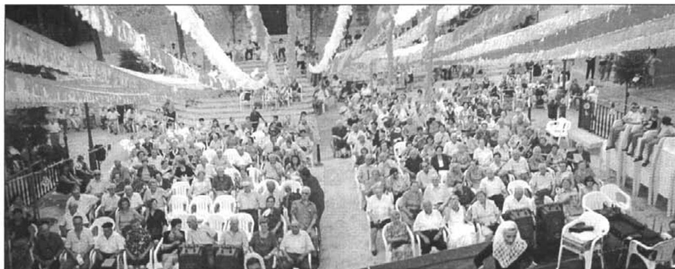
L'homenatge als majors de 80 anys fou molt concorregut