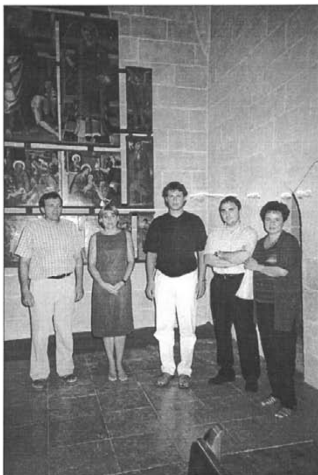
El Rector, la Vicepresidenta del Consell de Mallorca, el Batle i dos representants de les entitats bancàries, el dia de la inauguració