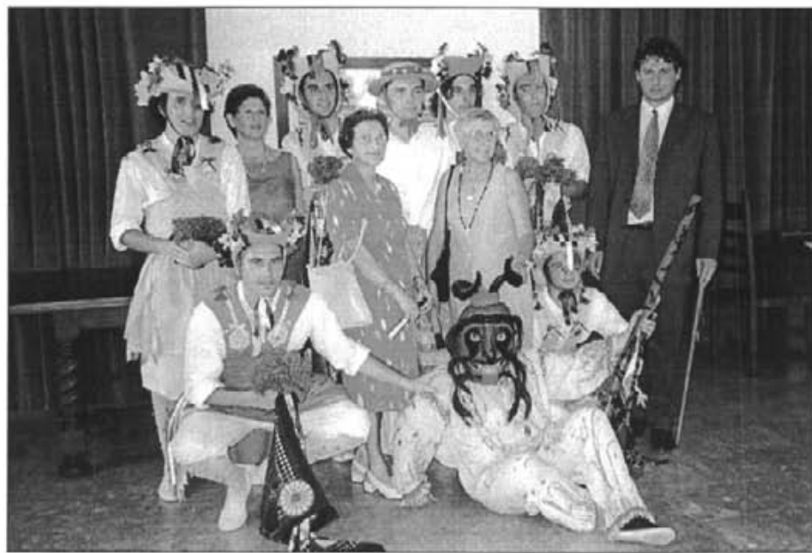
Amb els cossiers i el batle es fotografiaren les tres cosidores dels nous vestits