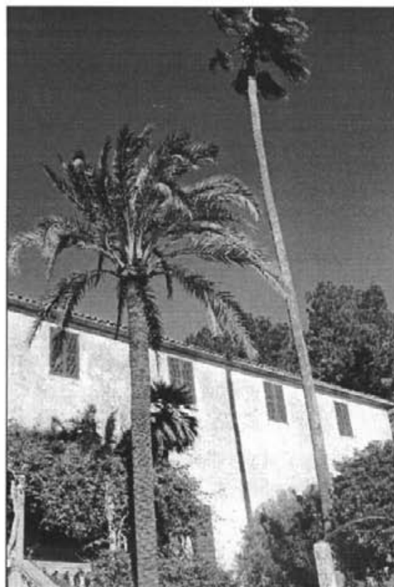
A les possessions, com San Comelles, sempre tenien els cans ben tancats durant la nit

Art. 99. El qui fes mal sense necessitat a un animal domèstic o destinat a la guarda de qualque heretat, hort, era o bestiar, serà castigat amb la multa de 2 a 5 pessetes. El qui es veiés envestit tendrà, pel contrari, no sols el dret de ferir, sinó de matar l'animal sense perjudi-