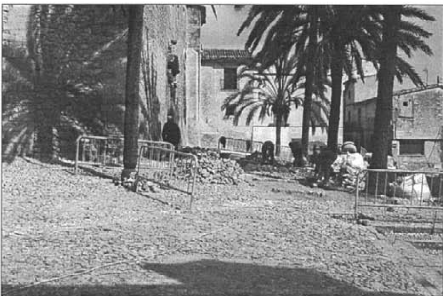
Encara que lentament, les obres de restauració dels graons, avancen dia a dia, tot i que a finals del mes de febrer no havien arribat a la meitat