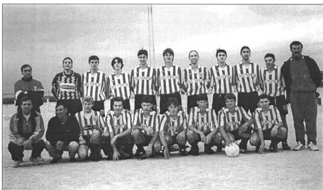
El Montuïri juvenil de la temporada 1996-97

Montuïri, 4 - Murense, 1 S'Horta, 3 - Montuïri, 1 Peguera, 1 - Montuïri, 4