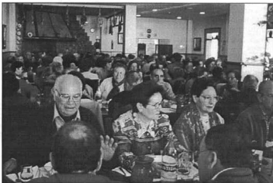
Foren uns 150 els participants al dinar de darrers dies de les Persones Majors

El darrer dissabte de carnaval, dia 8, com ja és tradicional, tengué lloc la desfilarada pels carrers del Pujol, Plaça i carrer Major fins al Dau. Hi participaren 5 carrosses, 9 comparses i 20 disfresses. Els 3 primers premis concedits a cada modalitat foren aquests: Individuals: 1 er , Sol i Lluna; 2 on , Cossier i Dimoni, i 3 er , Ses Viudetes. Comparses: 1 er , Club beisbol Montuïri; 2 on , Parxis i Bolos (compartit); i 3 er , Els indiots. Carrosses: 1 er , Fantasia mora; 2 on , La fruitera gegant, i 3 er , La tribu del Sioux i El circ de les estrelles (compartit). El premi especial a la simpa-