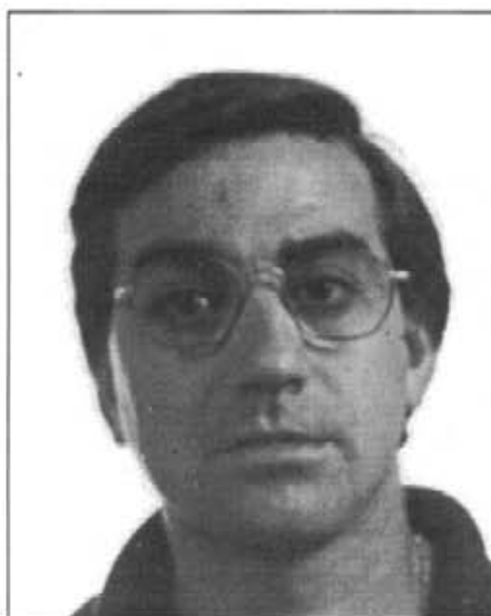
Prado algun temps fou el segon entrenador de la selecció de juvenils de Balears

- Pel que fa als avantatges, tenim el fet que si un jugador et falla per lesió o per no haver acudit als entrenaments, sem-