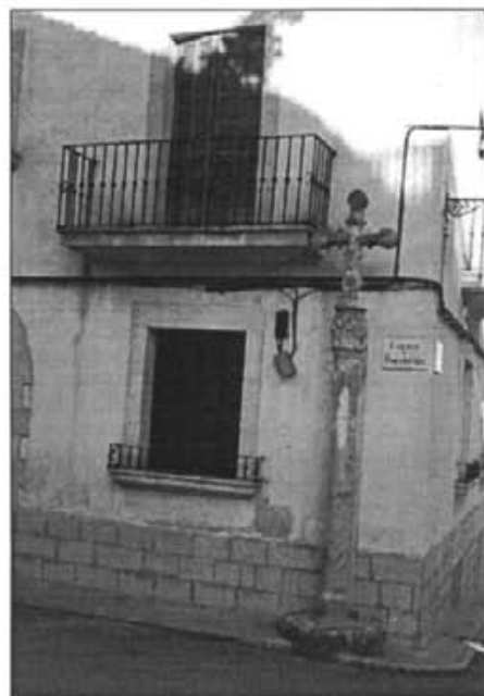
Enguany la benedicció de rams es farà davant la creu de Son Rafel Mas

Seminari. Una jornada dedicada a col·laborar econòmicament i amb pregàries al foment de les vocacions religioses.