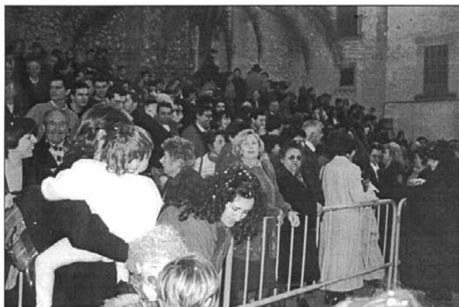
Enguany, com anys anteriors, foren molts el qui presenciaren "Sa Rua"