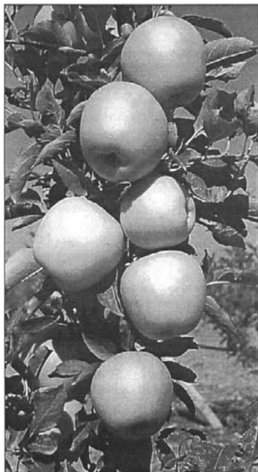
La poma "Golden" de procedència forana, fa més de 30 anys que es cultiva a Mallorca

També passa el mateix amb les pereres, albercoquers, cirerers, i més fruiters que antany abundaven. Per tant es fa necessari, si no volem que es per-