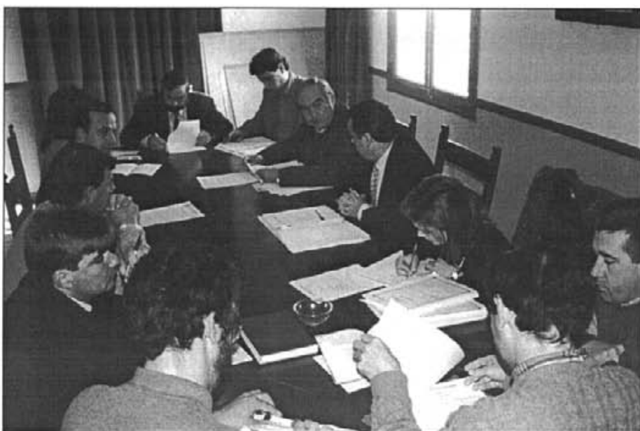
El ple de l'Ajuntament que va aprovar el pressupost més elevat de tota la història

A la primera i per unanimitat s'acordà donar suport amb tots els seu termes a