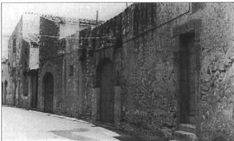
Encara romanen així algunes antigues cases del carrer de Na Quintana