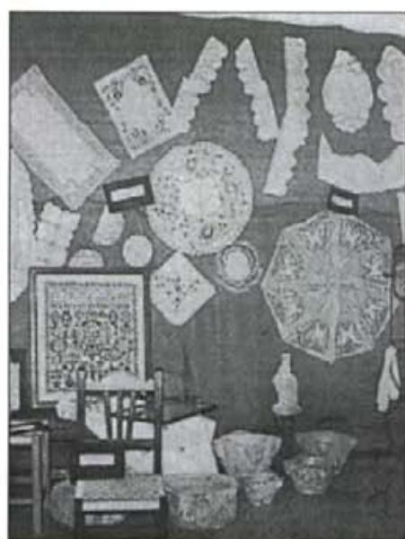
Un detall de l'exposició a la clausura d'oficis antics