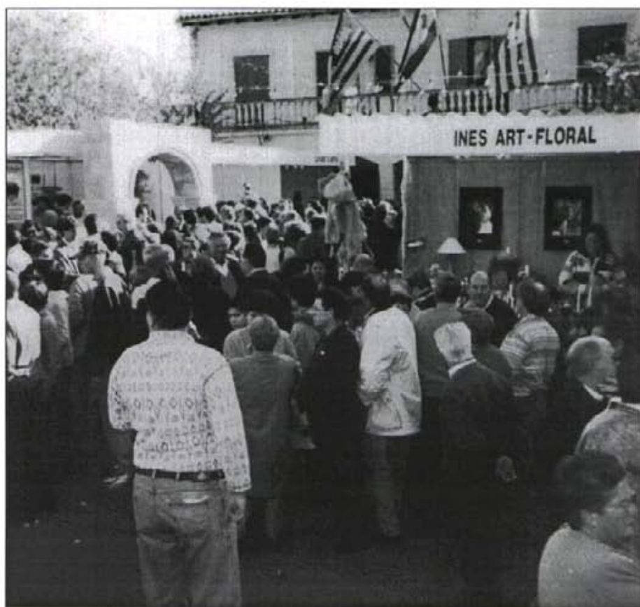
Aspecte que ofería la Plaça Major el dia de la fira d'enguany