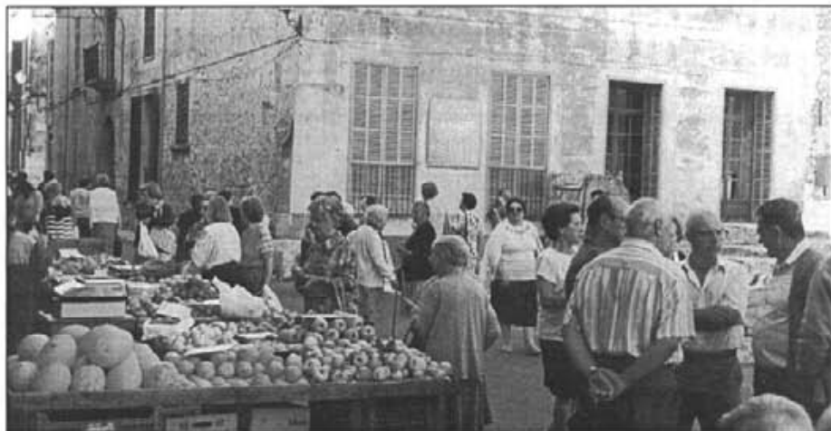
En el mercat dels dilluns, a plaça, hi compareix sobretot gent d'edat