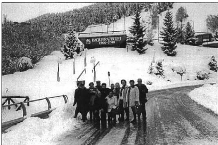
Aquest grup de montuïrers a mitjan novembre feren una excursió pels Pirineus. El dia 17, malgrat el fred i la neu pujaren fins a l'Estació de Baqueira-Beret on encara tengueren humor per fer-se aquesta foto