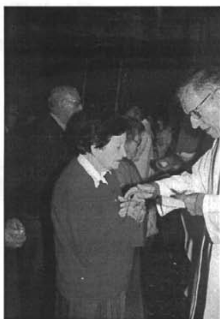
Els nostres majors que ho desitjaren, el diumenge dia 10 de novembre passat, a l'església reberen el sagrament de la unció de malalts