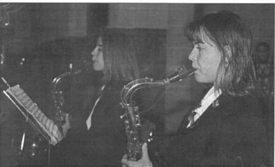
Tres de les diferents interpretacions en els actes de les festes de Santa Cecília