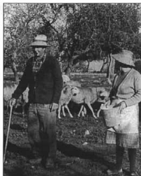
El pastor de Son Moragues (1982)

nies d'aquest blanc líquid sinó que la produeixen els animals lleters com son majoritàriament les vaques i cabres. Ara per la primera de televisió espanyola i amb la finalitat de fomentar el consum de llet, emeten el programa "leche i salud" en el qual lloen i expliquen les seves qualitats. Ens diuen que consumir llet és salut, per tant és bona per tothom, ja que és molt alimentícia, conté proteïnes, vitamines, calcs, fòsfor i més qualitats que fan d'ella un imprescindible aliment. El mal per als pagesos és que ens diuen des de l'UE -Unió Europea- que no provem de produir-ne més de la que ens diguin, que si ho feim ens sancionaran per massa producció. I com que enguany Espanya no ha obeït la normativa europea per haver superat la quota que té assignada, haurà de pagar una multa, la qual el gobierno vol que la paguin els propis productors. Hem pogut veure per la televisió com per Galícia els ramaders fan manifestacions en contra d'aquesta mesura, no estan conformes, es queixen i amb raó. Qui ho hagués dit anys enrera que mancàs aigua i sobràs d'aquest tan important i bàsic aliment! Perquè si important per la vida és l'aigua no ho és manco la llet i aquesta és alimentícia i necessària des que naixem fins que morim i costa produir-la, no en plou com si fos aigua. Antany, quan la gent dels pobles encara no havia fuita a guanyar el jornal fora del conreu, abans d'haver-hi tanta maquinària, el pagès petit