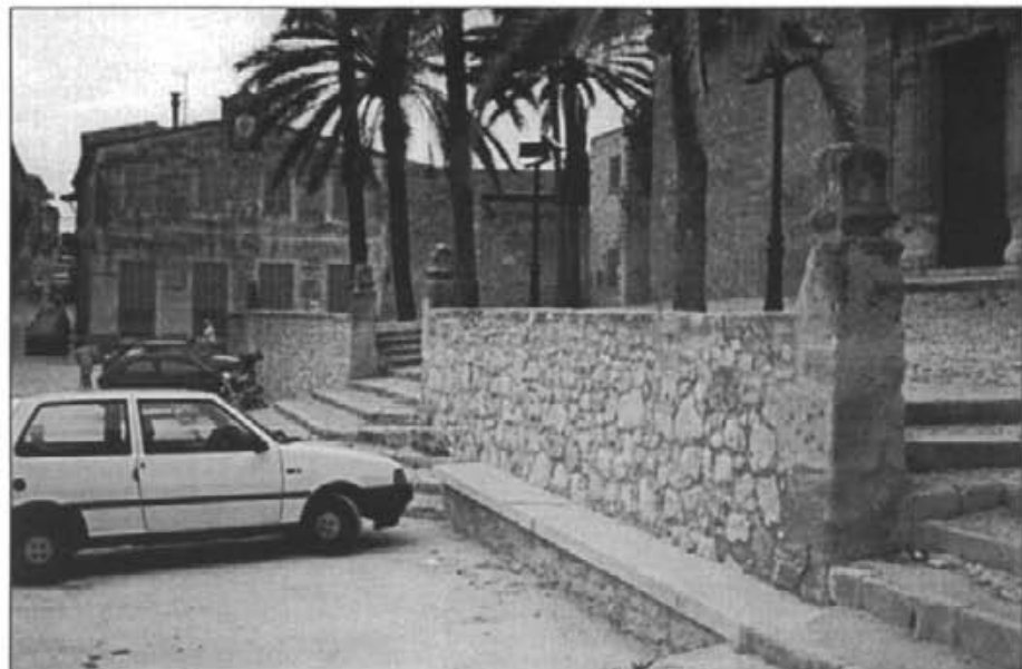
Dins les millores es projecta empedrar la Plaça major

En una segona fase, quan ja hagi desaparegut el transformador i les instal·lacions de Cadagua, s'arreglaria l'edifici