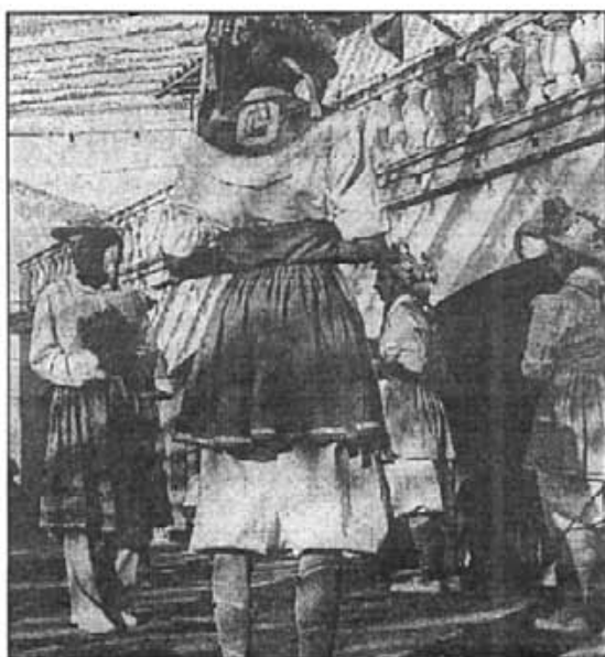
Els ball dels Cossiers a les festes de Sant Bartomeu data de més de 200 anys enrera

Fins el 18 d'agost de 1821, en què es va acordar que els cossiers formassin part de la comitiva que s'ha d'organitzar el dia 24 següent amb motiu de col·locar damunt el portal de la casa de la vila la placa de " Plaza de la Constitució ", no en trobam notícia, d'ells, si bé és creença nostra que la seva antiguitat a