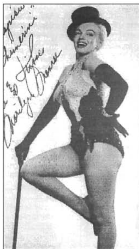
Marilyn Monroe, una cara ben coneguda del cinema els anys quaranta