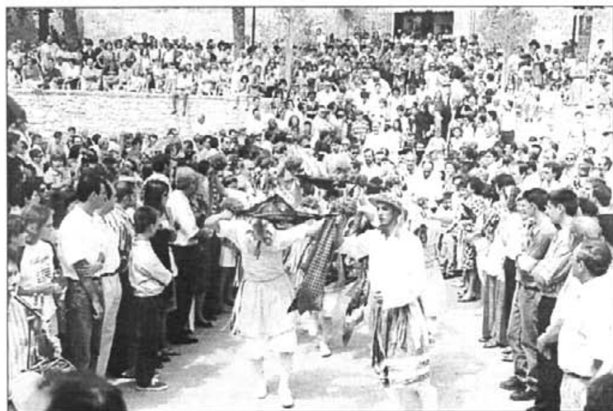
Les festes de Sant Bartomeu oferiren moments entranyables d'especial significació