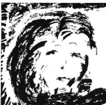
M'apareixia la seva figura espectral...

Al llarg de la sessió, estava sempre assegut a una cadira, mig dissimulada entre les cortines que donaven pas a la sala, aquell espai diminut del qual no en sortia més que quan ensumava el perill. Abillat amb una estrambòtica americana vermella, uns calçons blaus amb tires