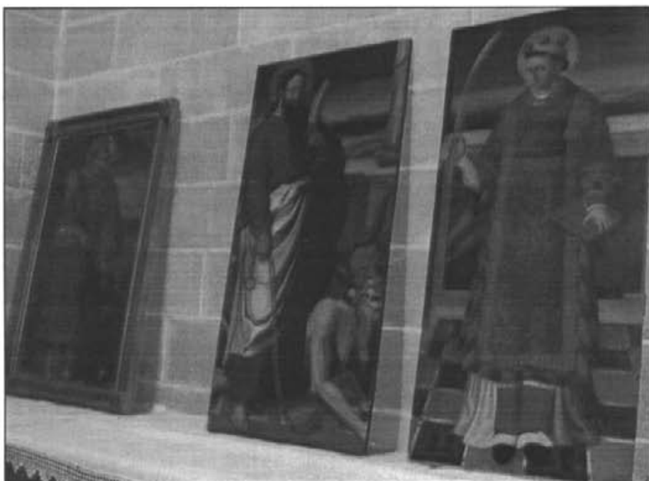
Les dues taules restaurades foren exposades durant les festes de Sant Bartomeu. La de Sant Pere, sense restaurar, es pot veure a l'esquerra.

Esser cristià no és, en primer lloc, l'adhesió personal a un credo de veritats o l'acceptació d'uns criteris de comportament, o el compliment d'un ritual. Esser cristià consisteix, en primer lloc, a pertànyer a una comunitat cristiana i, només com a conseqüència d'aquesta pertinença a la comunitat, compartir una mateixa fe, participar d'uns mateixos sentiments i viure un mateix estil de vida.