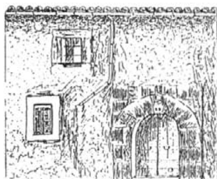
Vivia a la casetona, prop de l'estació...