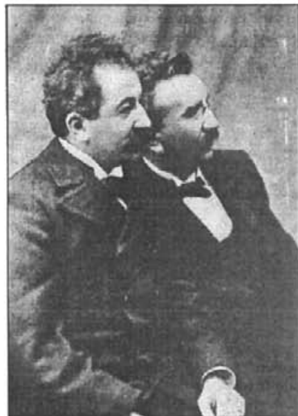
Els germans August i Louis Lumière, inventors del cinema

Però tornem anys enrera. Dins la penombra de la sala encisats absorbíem la vida. Amb D. W. Griffith descobríem el llenguatge del cinema, què anàvem assimilant sense adonar-nos quan ens omplia la pantalla amb films com "El nacimiento de una nació" i "Intolerancia". Eisenstein ens presentava descarnadament, dins altres relats, la història d'"El acorazado Potemkin". Chaplin, entre les meravelloses històries de vagabunds, carregades de gràcia i humanitarisme, on ens mostrava un món miserable, ens feia volar amb "Luces de la ciudad". Max Linder, B. Keaton i La Pandilla escampaven damunt la pantalla el seu humor únic, inimitable. Un avançat de l'escola vienesa, Willi Forst, ens descobria amb una marca de prestigi —UFA— les delicioses operetes dels anys 30. Fruíem de les històries optimistes de F. Capra, de la sàtira i de la ironia fina d'un E. Lubistch. Ens captivava la poesia de René Clair. L'emoció ens dominava amb els drames humans de W. Wiler. L'entusiasme ens invadia amb altres drames de l'Oest, tan ben expressats i presentats per John Ford. Romaníem admirats, impressionats quan en Dreyer ens presentava una espiritualitat profunda i convincent amb un film con "Ordet" ... tants de títols, tants de