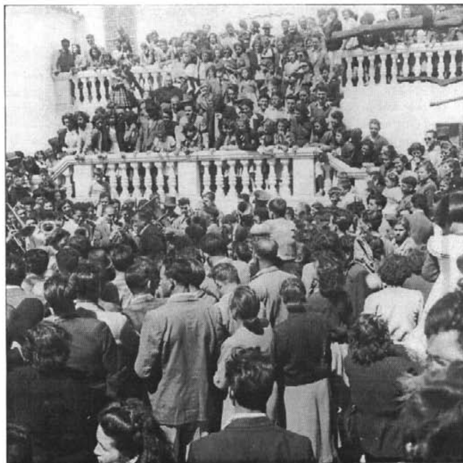
La tradició de fer la festa des Puig el tercer dia de Pasqua a remunta a segles enrera, si bé aquesta valuosa foto suposa una prova de l'animació de fa més de mig segle