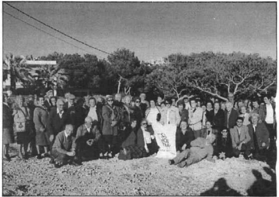
El nodrit grup d'excursionistes de la Tercera Edat visitaren la finca experimental de "Sa Nostra", Sa Canova, i la Fira de Fang de Marratxí

En 20 minuts a peu o qualcant, tots ens trobam a la gran portassa, baix de Can Toni "Canet", on comença la 2 a part de la festa. Es treuen les ensaïmades, es destapa el "cava", se serveix el cafè i el licor... i mentrestant, damunt un escenari improvisat s'està actuant. Les intervencions, al compàs d'un acordió, són espontànies. Allà, desbordant d'alegria, es fan gloses, es transmeten missatges, poesies, acudits, anècdotes, es can-