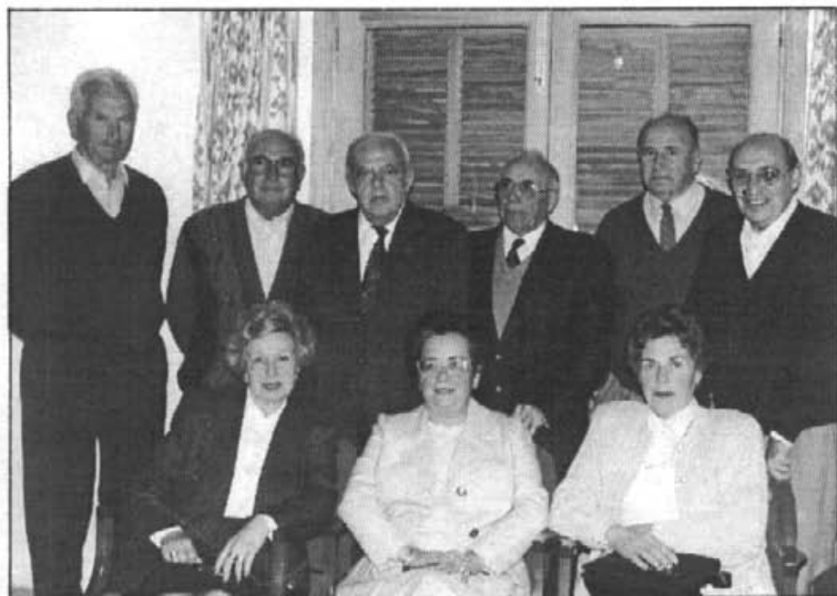
Els components de la nova junta directiva de l'Associació de Persones Majors, presents el dia de l'Assemblea