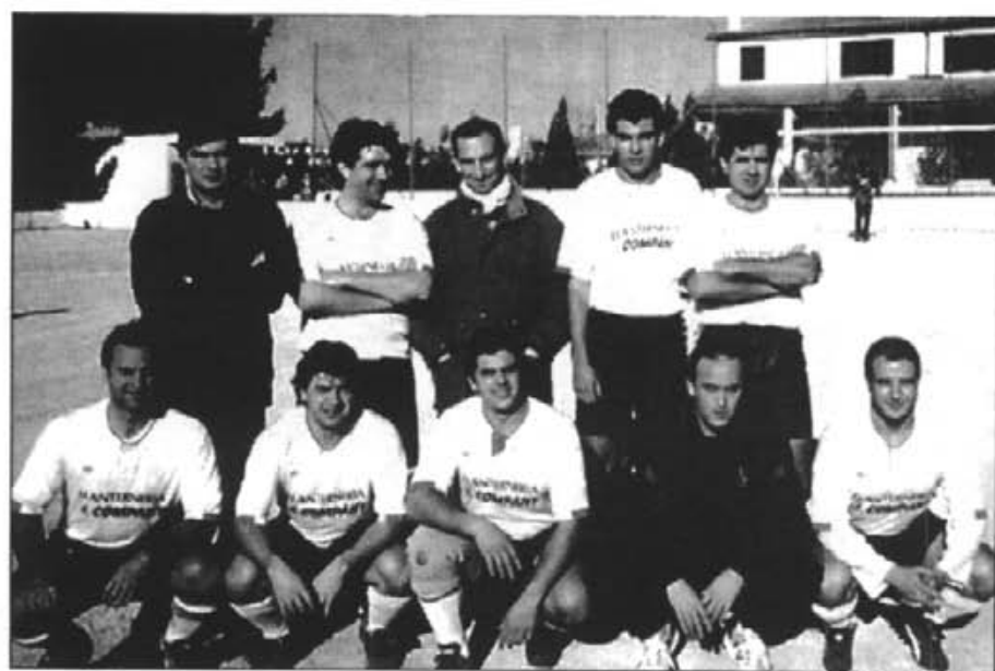
Un grup dels montuïrers que juguen amb el Sant Joan

– No, perquè el Montuïri està jugant a una categoria massa superior per a nosaltres poder-hi jugar. Encara que creim poder donar un rendiment ben alt, més del que molta gent no es pensa.