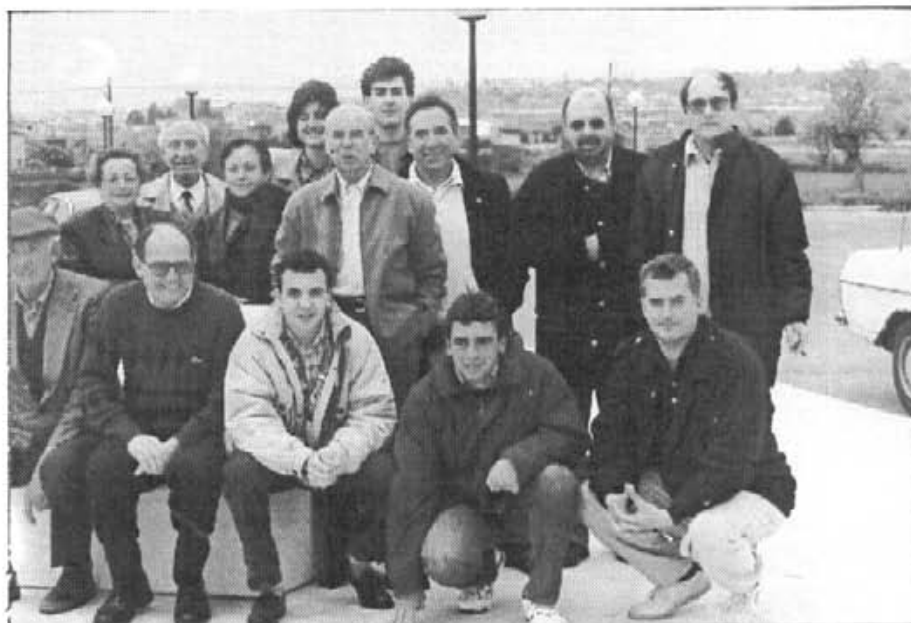
El passat 11 de març en el restaurant "Es Cantó" i per un dinar de feina ens reunirem els redactors de Bona Pau . Traguérem conclusions positives i no hi manca alegria i bon humor