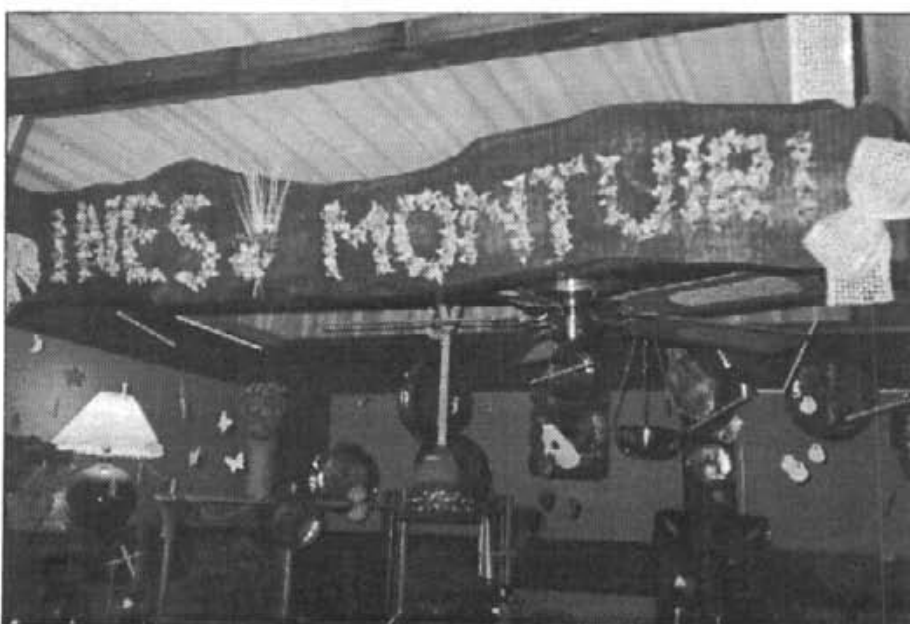
Entrada a l'exposició de n'Inès a la fira de "Balear", pel desembre de 1994

Al col·legi dona classes de manualitats als nins petits dins l'horari extra-escolar. Amb ella els infants es diverteixen molt quan es posen en contacte amb els materials. "No els importa -diu ella- embrutar-se les mans. Quasi sempre se senten satisfets i se'n duen a ca seva collars, joguets, adorns... fets per ells mateixos. Allà gaudeixen tant ells com els seus pares".