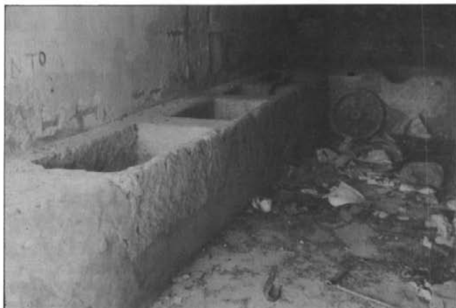
Els rentadors del Pou del Rei que es varen construir, ara en estat d'abandonament

Atendiendo que en las entradas de esta villa hay dos pozos comunes, uno a la parte de Poniente (1) y el otro a la parte del Norte (2) y que en cada uno de ellos hay unos llavadores descubiertos de manera que las mugeres que lavan en ellos diariamente están a la inclemencia del rigor del invierno y al inmenso calor del verano, de donde resultan a estos vecinos unos grandes perjuicios por razón de las grandes enfermedades que se cojan en ellos, ya resfriados, ya calenturas intermitentes y a fin de cortar estos males de una vez, ha acordado este Ayuntamiento el construir en dichos llavadores unos tejados que los cubran del mo-