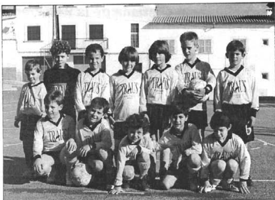
Equip de futbollet iniciació de la present temporada