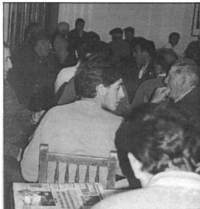
Un moment en què es jugaven les darreres partides del campionat d'enguany

es farà en el transcurs d'un sopar que tindrà lloc dia 4 d'aquest d'abril amb la participació de tots els jugadors.