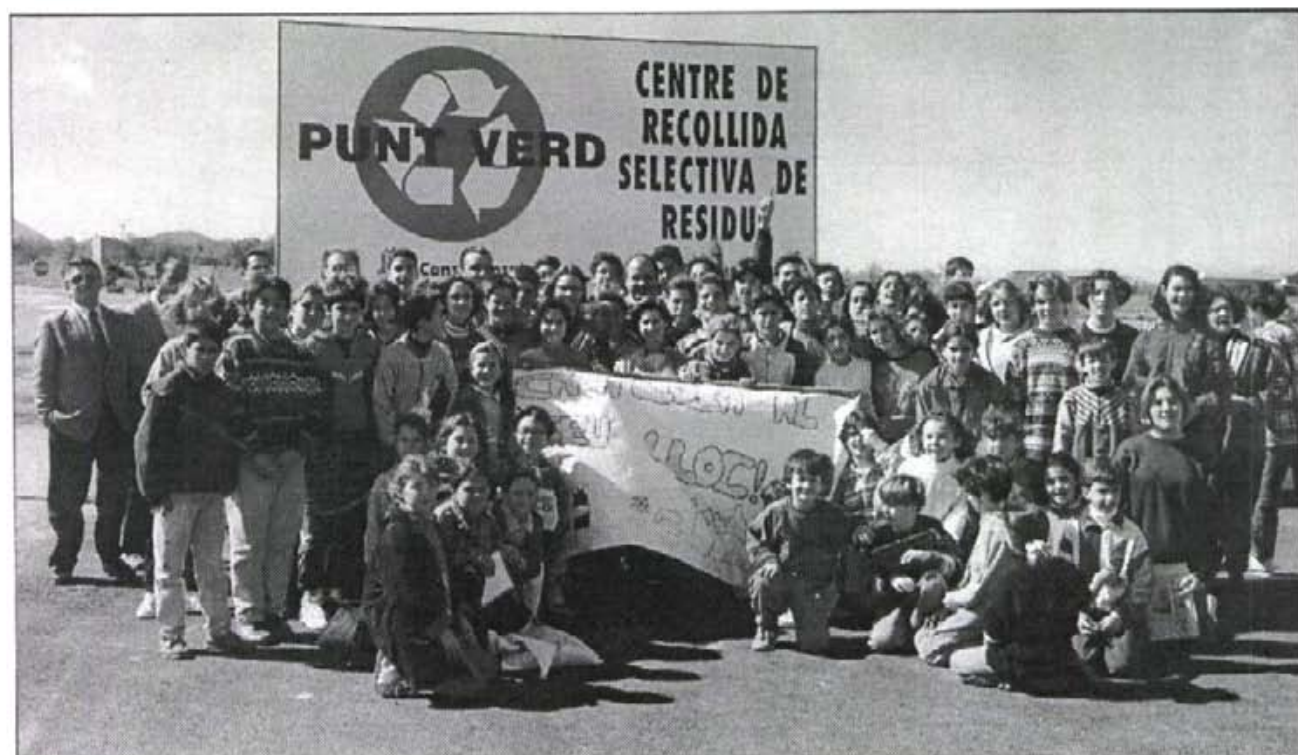
Els al·lots de les escoles acudiren contents i eufòrics a la inauguració del punt verd, dia 3 de març passat.