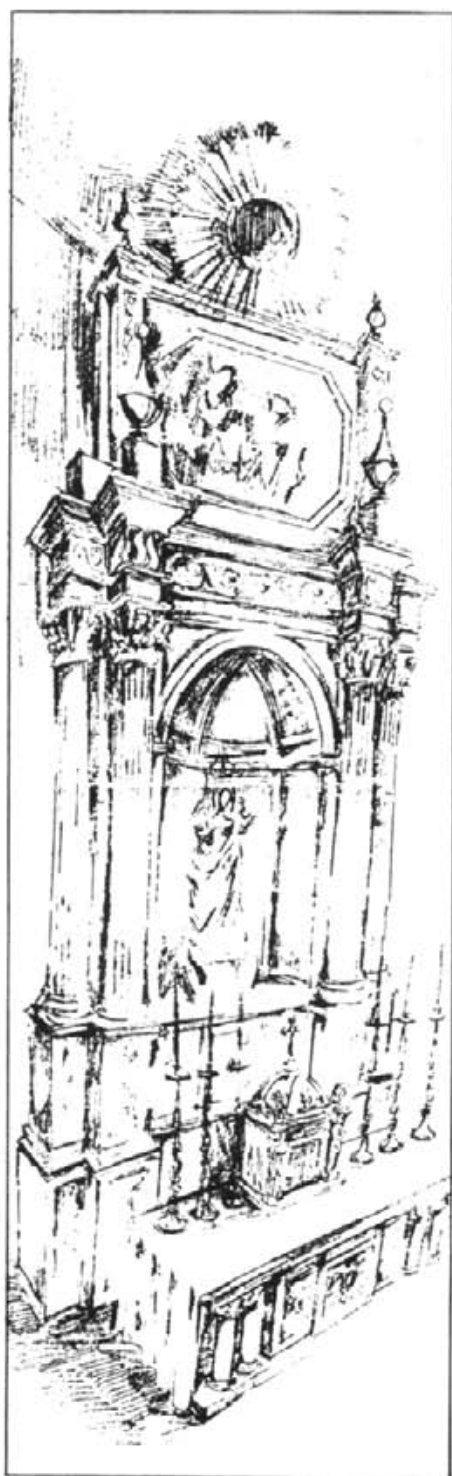
Esbós del retaule de la capella del Roser, on serà instal·lada la "Casa Santa"

nerals continuaran, com de costum, essent a les 9 del vespre, si bé el condol començarà a donar-se un quart d'hora abans.