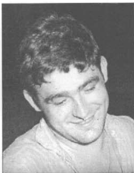
N'Andreu, en un moment de fabricar un objecte de vidre

– Andreu –li dic en un to de confiança–: què és per a tu el vidre, què representa?