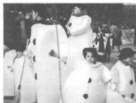
Hi hagué comparses molt extravagants amb petits i grans, magres i grassos, seriosos i eixelebrats... què més voleu!

... hi ha gent que espera que s'Ajuntament o es Consell regali contenidors per fer es punt verd dins ca seva, ja que no saben com han de destriar ses coses per dur-les an es punt verd des futbol.