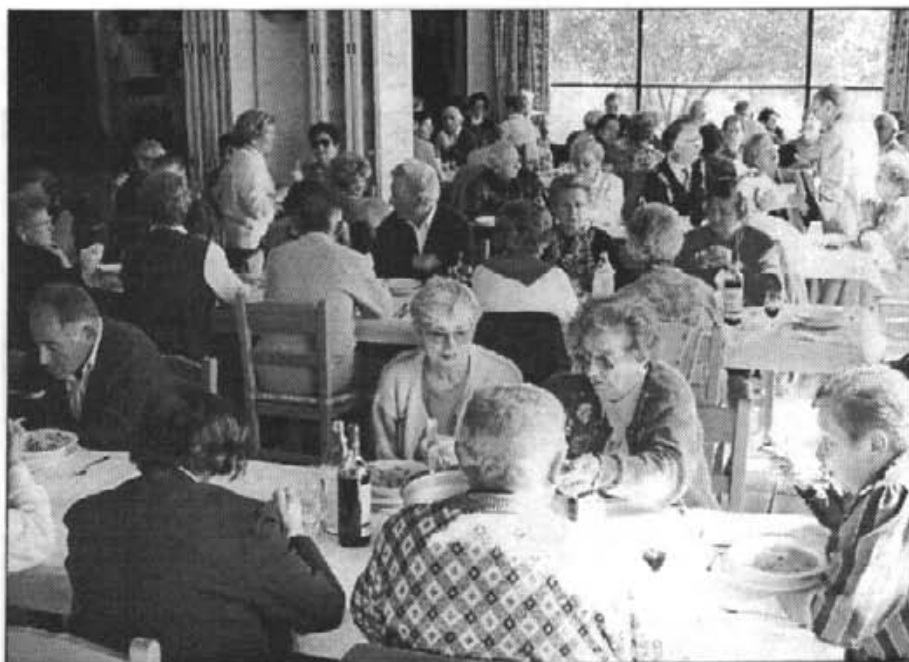
El dinar del dijous llarder, que va organitzar l'Associació de Persones Majors, es va distingir pel gran ambient de germanor

El passat 13 de febrer començà un curs de recuperació d'oficis antics; el qual tindrà continuïtat tots els dilluns a les 4 de la tarda. El primer que es dona és el de cordar cadires.