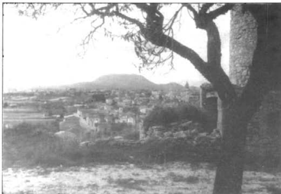
Panoràmica de Montuïri des del Moll des Velar de Sa Torre