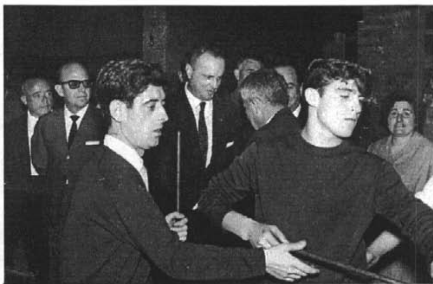
Andreu Mairata (a la dreta) preparant una peça artística al Ministre d'Informació i Turisme, Manuel Fraga Iribarne, quan aquest va visitar Menestralia de Campanet, l'horabaixa del 5 de juny de 1966

Em referesc a la que ens il·lumina durant l'entrevista, just dalt de nosaltres.