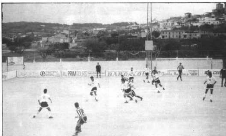
Moment d'un dels partits jugats pel Montuïri de III divisió a principis de temporada