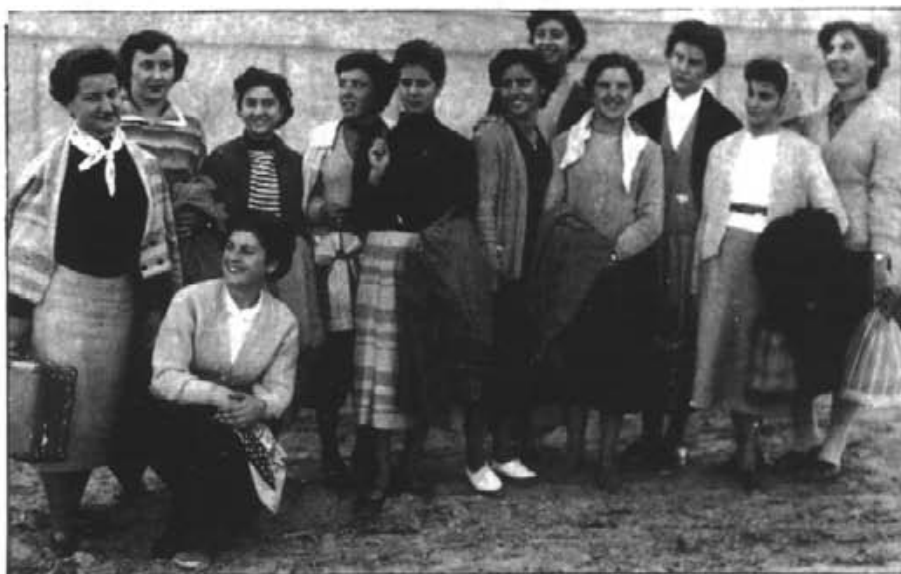
Grup de joves que participaren en uns exercicis espirituals en es Puig l'any 1954