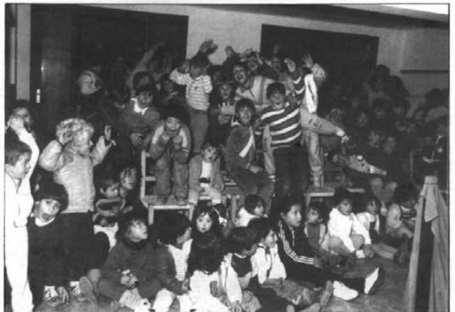
Aleshores eren nins de preescolar i primers cursos. Avui són els adolescents o joves del poble