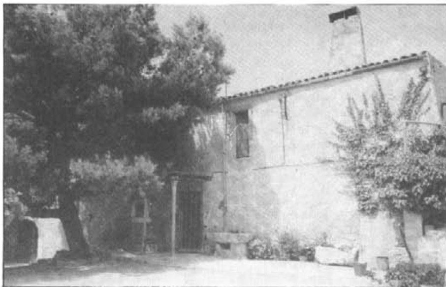
Galiana altre temps pertanyia als dominics i també fue afectada per la llei de Mendizabal

L'escrit que vos presentam és un recull fet per Josep Planas Sagrera i publicat al Bolletí de la Societat Arqueològica