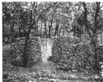
PERN DE CALI