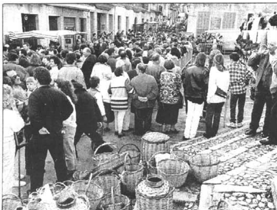
Nombrosa gent es concentrà a plaça i en Es Dau el dia de Sa Fira

Posat a votació donà 6 sí (PP) i 4 no (PSOE, PSM i CB).