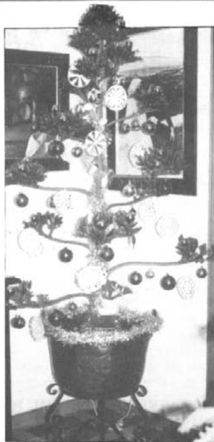
Unes cases han creat ambient nadalenc amb betlems i altres amb arbres de Nadal, com aquest, a una casa del carrer de Sa Trona

... molta gent ben vestida compareix per ses cases des poble per vendre qualsevol cosa. No se sap, però, que algú vengui amortidors pes cotxes,