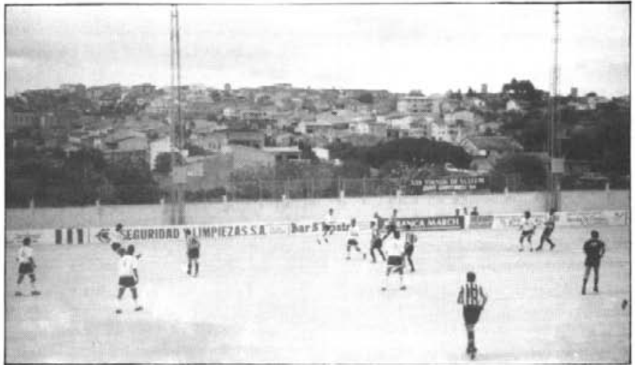
Moment d'un dels partits jugats aquesta temporada en Es Revolt

El mes de febrer començaran els torneigs de ping-pong escolar. Montuïri ha inscrit dos equips benjamins, un aleví masculí, dos infantils masculins i un infantil femení.