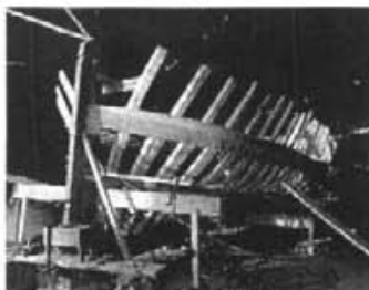
TALLER DE MESTRE D'ASA