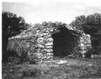
CASA DE ROTI

ANTICS OFICIS DE LES BALEARS ANTIGUOS OFICIOS DE LAS BALEARES