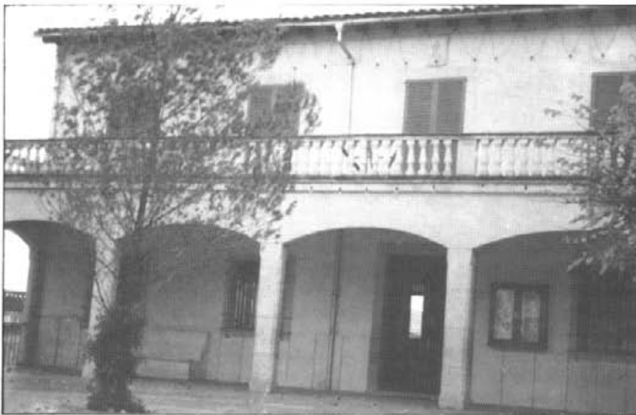
No tou excessiva l'ornamentació ni la il·luminació de Plaça durant les passades festes de Nadal. Altres anys hem gaudit de més lluminària i millor embelliment