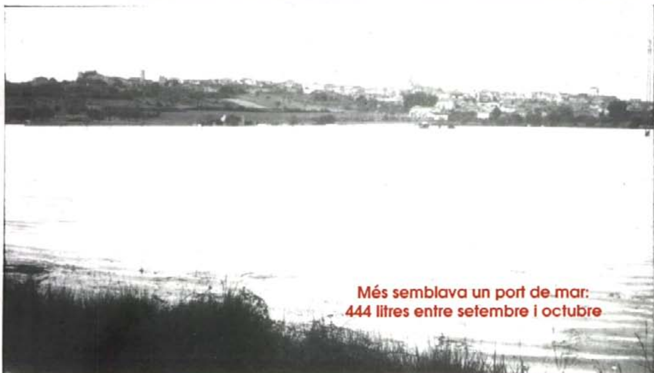
Més semblava un port de mar: 444 litres entre setembre i octubre