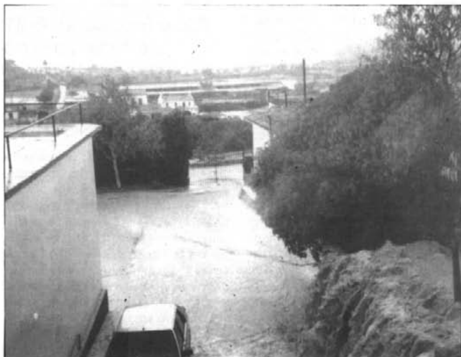
Moments després d'una de les fortes pluges es pogué captar aquesta il·lustrativa fotografia a la qual es refereix l'autor de la carta

Amb la construcció de l'escoleta i adecentat el mur, l'aigua que baixa de la tanca de l'ametlerar de la part superior del molí, l'escorrentia baixa, per una part per la barrera de l'hivernacle, mitjançant una canonada i un safareig que es va construir dintre de la finca de Sa Torre. Fins aquí correcte. El problema és quan cauen 30 ò més litres en un espai curt de temps, ja que aquesta obra, "model d'alta enginyeria alemanya" (veure fotografia) realitzada per l'empresa Melcior Mascaró i que li degué costar uns 3.000.000 de ptes. com a compensació per algun motiu a l'Ajun-