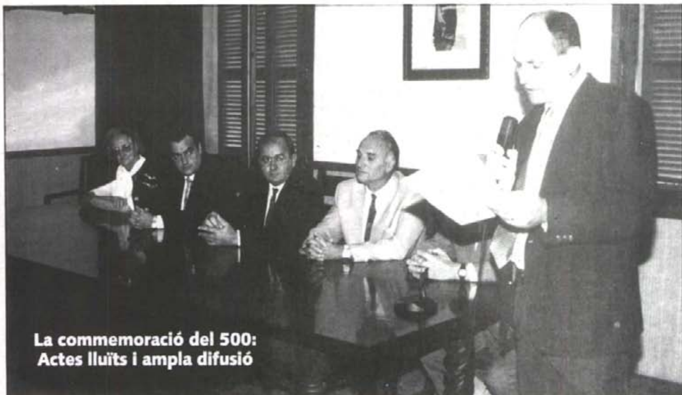
La commemoració del 500: Actes lluits i ampla difusió

Nº. 501 - Any XLII - MONTUÏRI - NOVEMBRE - 1994