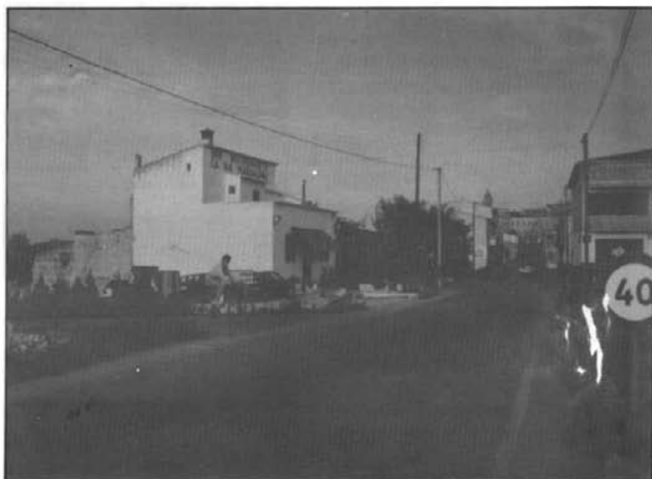
L'avinguda de la Constitució comença o començarà davant el restaurant de Ca na Magdalena i arribarà fins al de Cas Carboner (antiga carretera de Manacor)