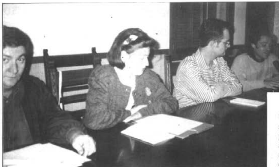
Els quatre poetes en el transcurs de la vetlada del dissabte vespre delitaren els assistents Va constituir una novetat cultural dins Montuïri