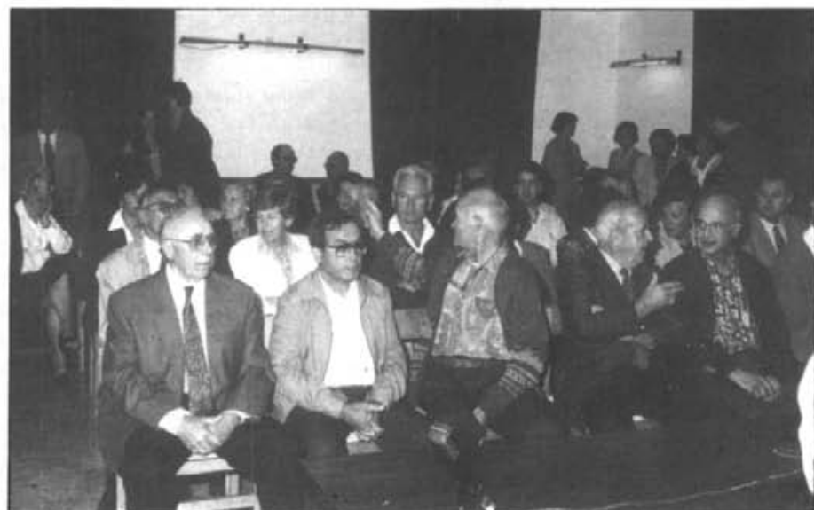
Foren molts els montuïrers que participaren als actes commemoratius del 500. A dalt, un aspecte de la sala d'actes de l'Ajuntament. A baix, alguns dels comensals en el dinar de companyonia