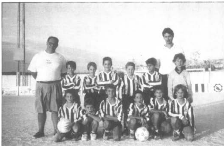
L'equip benjamí de futbol-7 de la temporada 1994-95 amb els seus preparadors

Tal com férem a l'edició del passat setembre amb els equips de futbol, presentam aquest mes els benjamins de futbol-7.