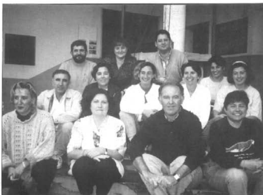
El claustre de professors d'aquest curs