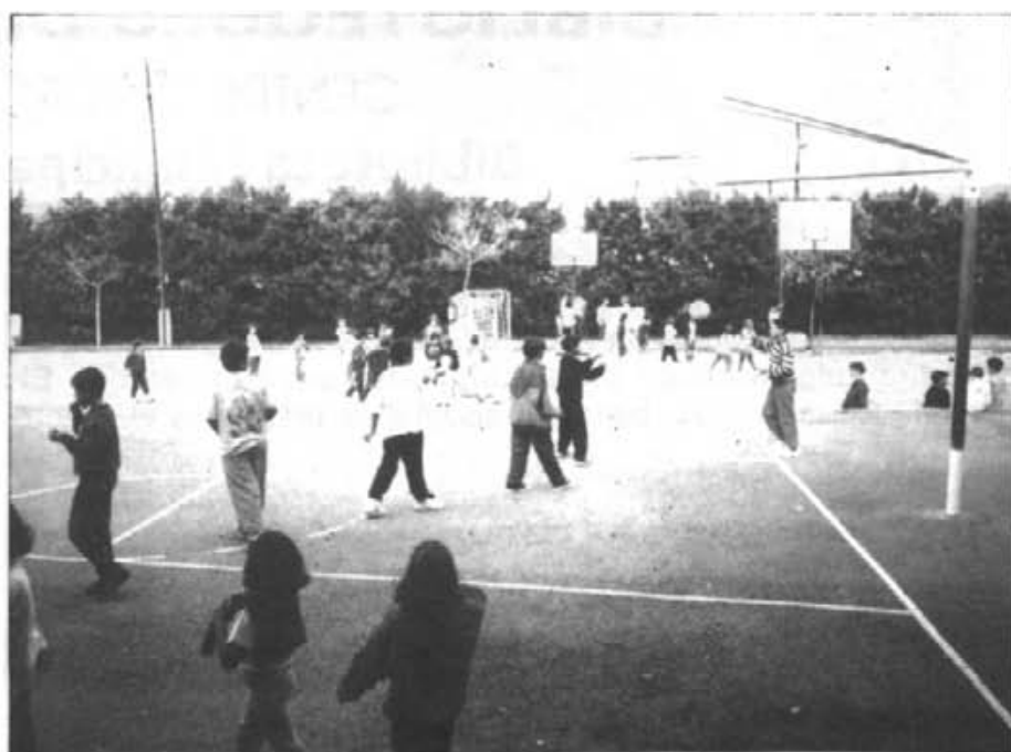
Els alumnes de les escoles, en el pati, en un moment de recreació