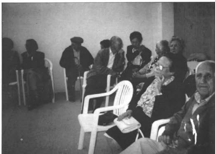
Un grup de persones majors que participaren a la geletada de dia primer d'octubre

Com cada any, el dia de les verges, 21 d'octubre, tengué lloc, l'horabaixa, en el local social una gran bunyolada per a tots els socis que volgueren. Se'n feren