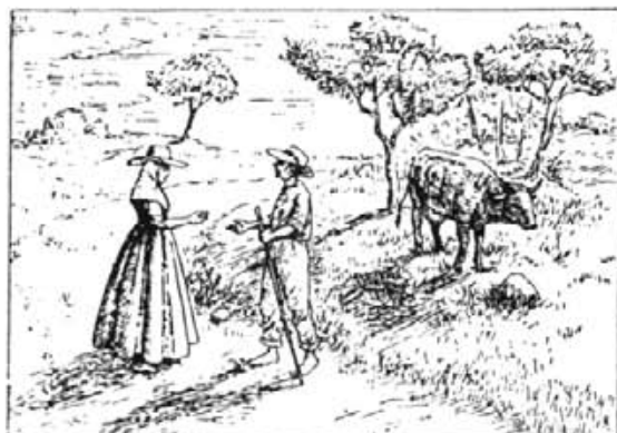
Una estampa que molt bé podria representar una escena de la darrerria del segle passat

10 sous para el mestre y a 48 doblers o 8 sous para cada manobre. Suman a ello tres comidas diarias: con el alb i sopes, al mediodía sopes y judías, y al anocheecer sopes o judías; no se les da pan, y rara vez vino. Los hombres empleados para el pisado de las uvas (trepitjadors) y otras faenas de la elaboración del vino reciben, según localidad, jornal muy variado. En Binissalem, Alaró y Consell, 8 sous además de la manutención; esta consiste de pimientos españoles al horno con grasa de cerdo, por la mañana y al mediodía, y de fideos con caldo de carne y una especie de estofado al anocheecer, recibiendo cada persona una terça (tercera parte de una llima camissera de 1221 gramos) o sea 407 g. de carne. Acompaña cada comida una ración de pan. En Sineu se pagan 7 sous y pimientos asados por la mañana, al mediodía y para cenar, además de pan. En Campos, sólo 4 reales, sin manutención, o 2 con ella, que en este caso consiste de sopes por la mañana y judías u otro tipo de legumbre al mediodía y noche, acompañadas de pan. En Felanitx, Porreres y otras localidades próximas se procede de modo parecido al de Campos. La manutención es pues igual que en ésa, sólo que el jornal es algo más elevado: 8-9 sous sin manutención, y la mitada con ella. Señalemos por último que el jornal de un hombre (pareller) con su parell (yunta) y reja asciende por lo común a 16-24 reales, según localidad.