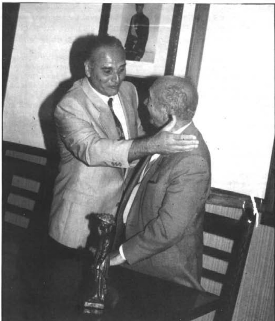
El nostre director reb la felicitació del Director General de Cultura, Educació i Esports del Govern Balear (a dalt). La taula presidencial al començament de l'acte commemoratiu (a baix)

Fa uns anys seia aquí mateix, com ho fa ara, al costat del seu pare, Francesc de Borja Moll; un altre cop pare, un dels pares de la nostra llengua. Eren en aquesta sala amb motiu de la inauguració del nostre arxiu municipal. Ella és la màxima responsable de la normalització lingüística ara a Balears i abans a Catalunya; cada dilluns llegim la seva llinya directa al Diari de Mallorca; professora de francès de les montuïreres de la nostra edat que anaven, amb una miqueta de por a examinar-se a l'institut Joan Alcover; a l'any 1960 feia classe de català (l'anomenaven "mallorquí") a les alumnes oficials de l'institut Joan Alcover de Palma, possiblement l'únic lloc de Catalunya, País Valencià i Balears on s'ensenyàs la nostra llengua; (Continua a la pàgina següent)