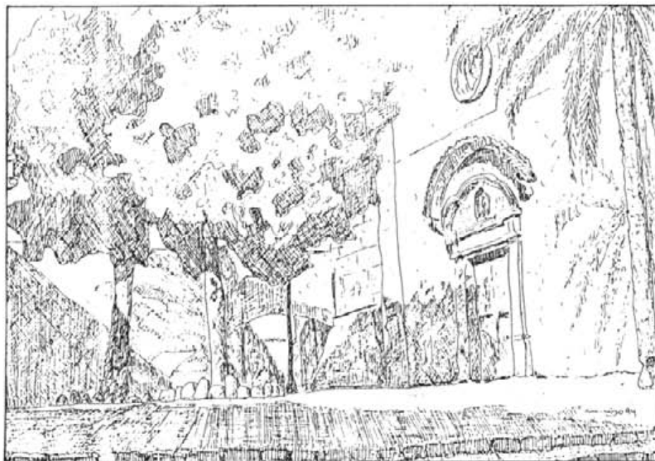
Damunt es graons, entre el local de Persones Majors i l'església. (Dibuix de Mateu Rigo)