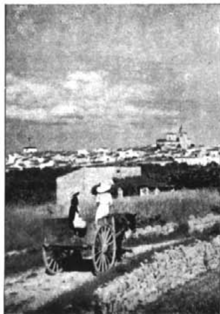
"Partírem cap al poble quan el sol encara era alt". Altra gent ho feia amb el carro i la bística.

Durant la resta de l'horabaixa els cossiers amb les seves danses, les envestides del dimoni i la música alegre i única del flabiol i tamboret, acompanyats de les xeremies, inundà el poble passejant-se pels carrers. Mentre, el so del flabiol,