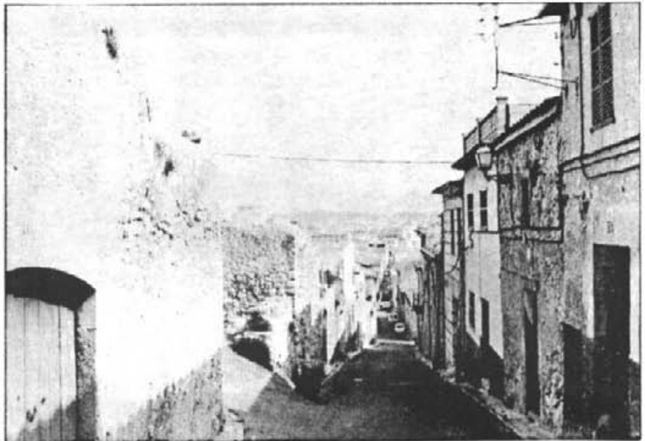
Carrer de Sant Antoni. Un dels que marcaven el límit del quadrat de la primitiva pobla reial per la banda de migjorn

Al padró tanta vegades citat del 1862 el veim com a carrer de Sant Antoni, nom que ha duit fins ara, sense interrupció. Sant Antoni (250-356) va ser un famós anacoreta que visqué retirat al de-