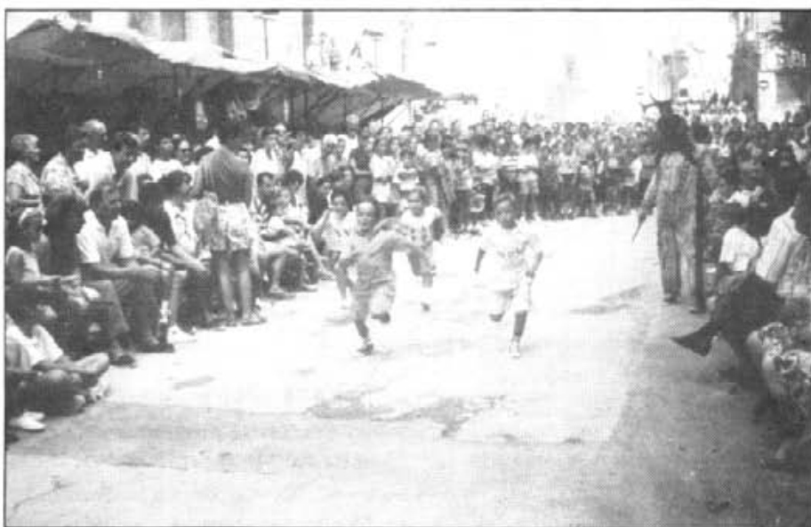
A les corregudes del dia de la segona festa hi participen sobretot els nins, però són la delícia de moltes persones majors que tenen fills o néts que intervenen