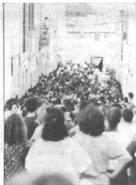
"Un grup apinyat com un aixam tapava el portal de ca l'amo en Joan..."