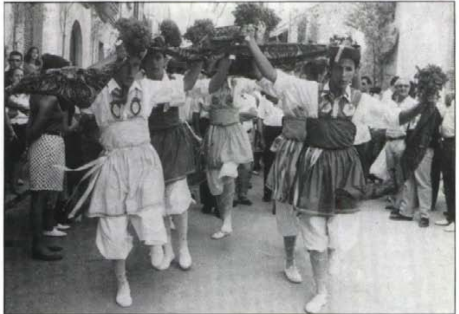
Tot d'una després d'haver sortit i ballat la primera dansa damunt el cadafal, els cossiers amb el ball d'"Els Mocadors", des de la rectoria acompanyaren el clero a l'església

Encara que manqui més d'un mes, per a la celebració de la vetlla a Lluç per als joves, convé tenir present que enguany serà el proper 8 d'Octubre, dissabte. Allà, com ja poguérem veure l'any passat, s'hi concentren mils de joves d'arreu Mallorca. I, naturalment, la joventut montuirira no hi pot faltar. És d'esperar que una bona representació participará als actes que se celebraran aquella nit d'ofici i de pregària.