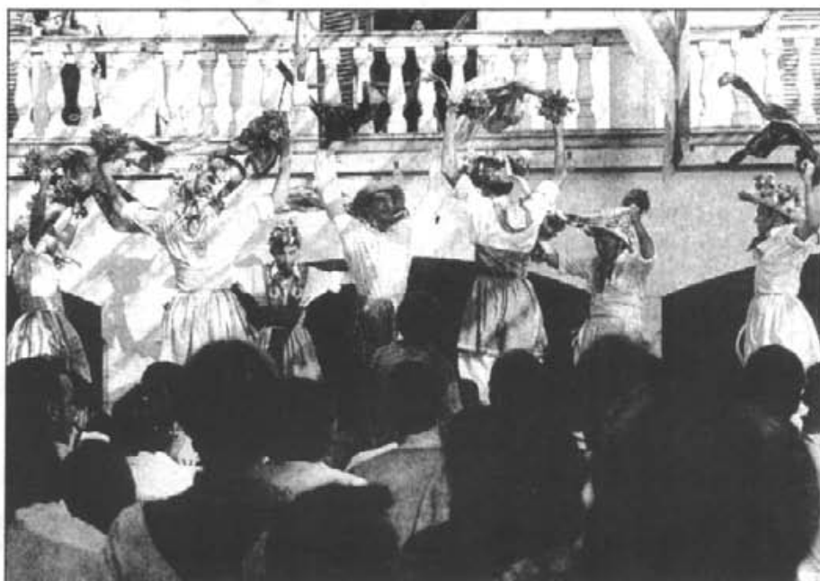
La primera dansa - "Flor de Murta" - que va ballar aquesta nova promoció de cossiers era esperada amb gran expectació per una immensa multitud de gent que l'horabaixa del dissabte de Sant Bartomeu d'enguany omplia de gom a gom la plaça. Els carrers per on després ballaren, també semblaven una onada humana