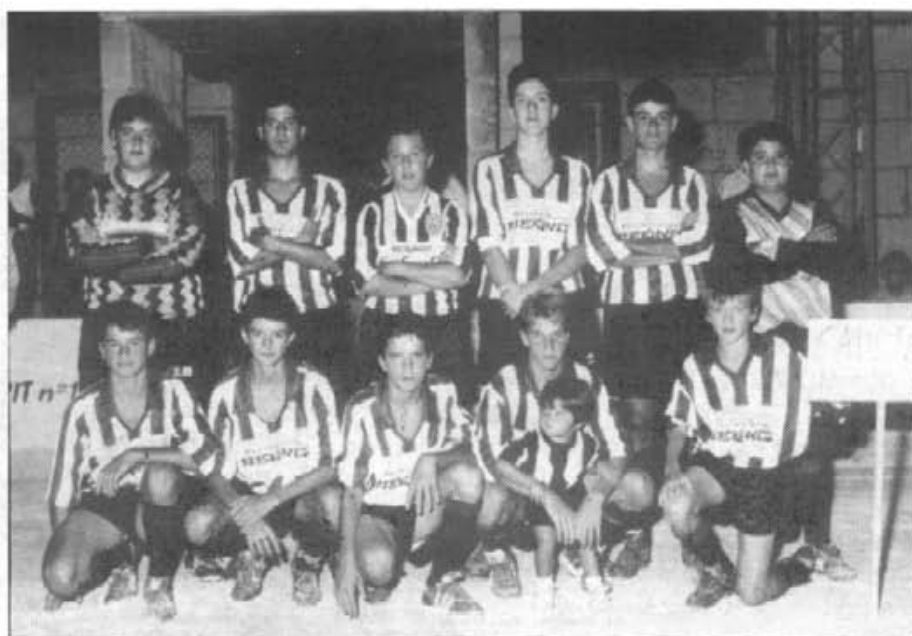
Els Cadets, campions en el Torneig de sa Llum, el dia de la presentació

Segons ens va comentar el quadre tècnic del Club Esportiu Montuïri, "la filosofia del club a III divisió es mantenir-se i consolidar-se en aquesta categoria". Pel que fa als juvenils, cadets i infantils, "formar persones capaces d'assimilar una disciplina i seguir el camí de serietat i constància en el treball -i si encara són bons futbolistes, sensacional-; respectar al màxim i de forma absoluta els seus entrenadors i passar gust en el camp". En relació als alevins i benjamins de futbol-7, es pretén "ensenyar al nin el bonic que és el futbol, que tinguin sempre un baló amb ells i que gaudeixin de l'esport".