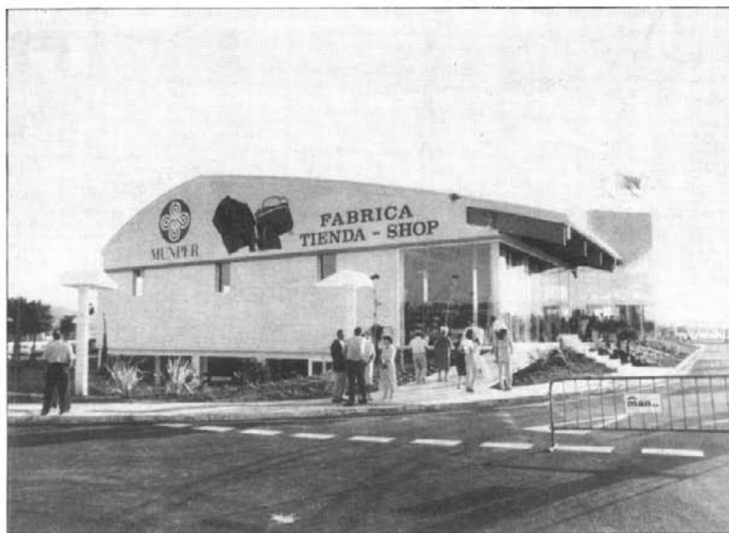
Les instal·lacions de "Munper" a Montuïri ofereixen un agradable aspecte d'amplitud i funcionalitat

Des de principis del passat mes de juny, en el quilòmetre 30 de la carretera Palma-Manacor, aproximadament davant la benzinera "Ses Jardines", s'hi pot trobar instal·lada la firma comercial "Munper", de venda de peces de pell. L'acte d'inauguració tengué lloc el 3 de juny amb assistència de nombrosos personalitats vengudes de Ciutat i també les de Montuïri i molta gent del nostre poble.