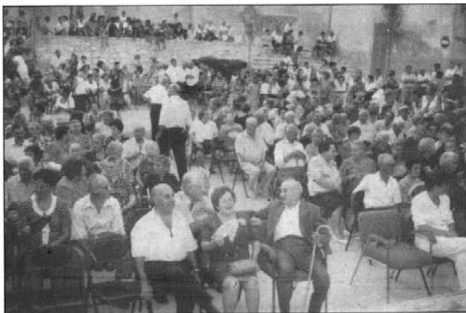
Els majors de 80 anys, les parelles de les noces d'or i d'argent, la joventut i la infància reberen enguany l'homenatge que els tributà l'Associació de Persones Majors, diumenge dia 21, a plaça

Enguany, per esser l'Any Internacional de la Família, l'Associació de Persones Majors també el va tributar a les pesones de totes les edats