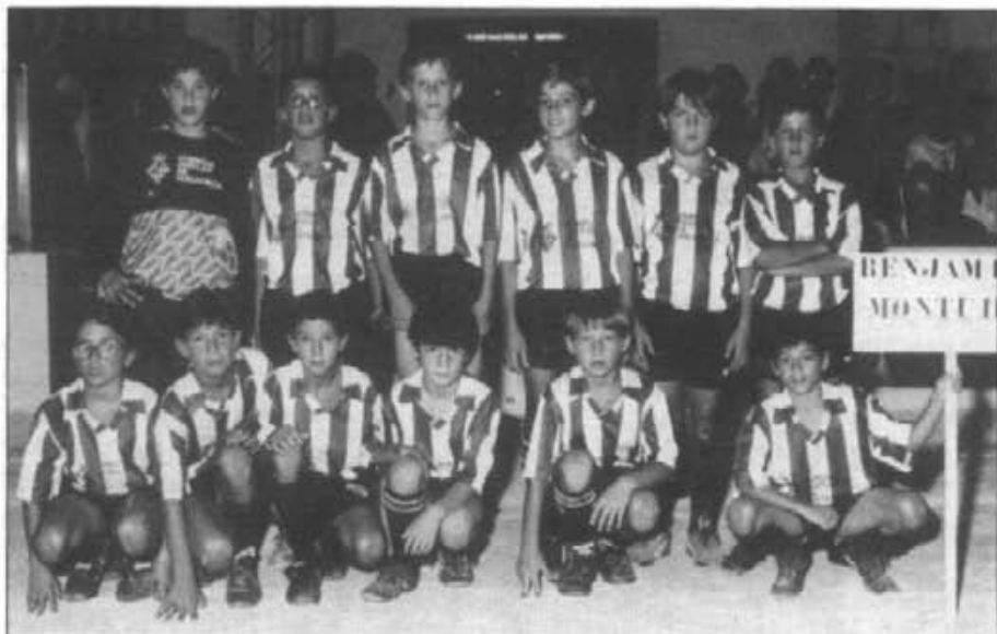
Els benjamins de Montuïri, campions de la seva categoria en el "Torneig de sa Llum"

El juvenils quedaren quarts i els infantils, segons, en els seus respectius grups.