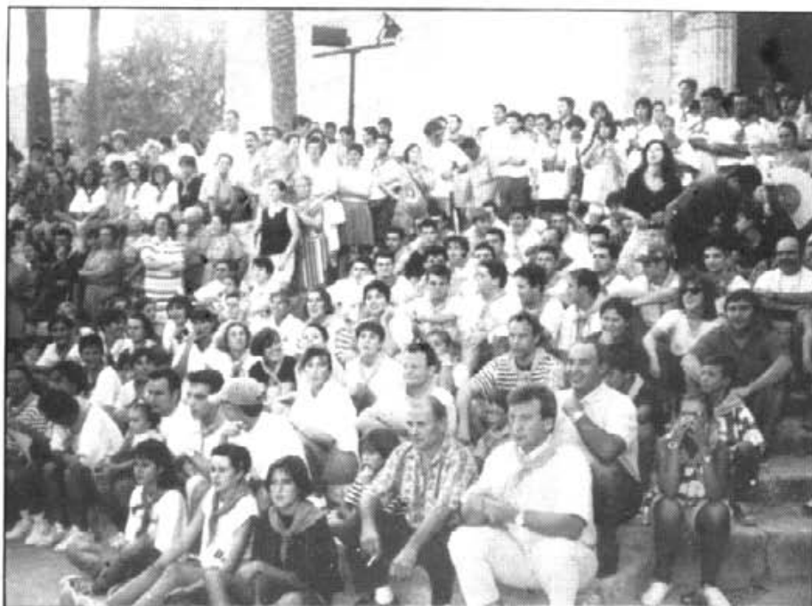
Aspecte que oferien es graons a l'hora de sortir els cossiers, dia 15 d'agost