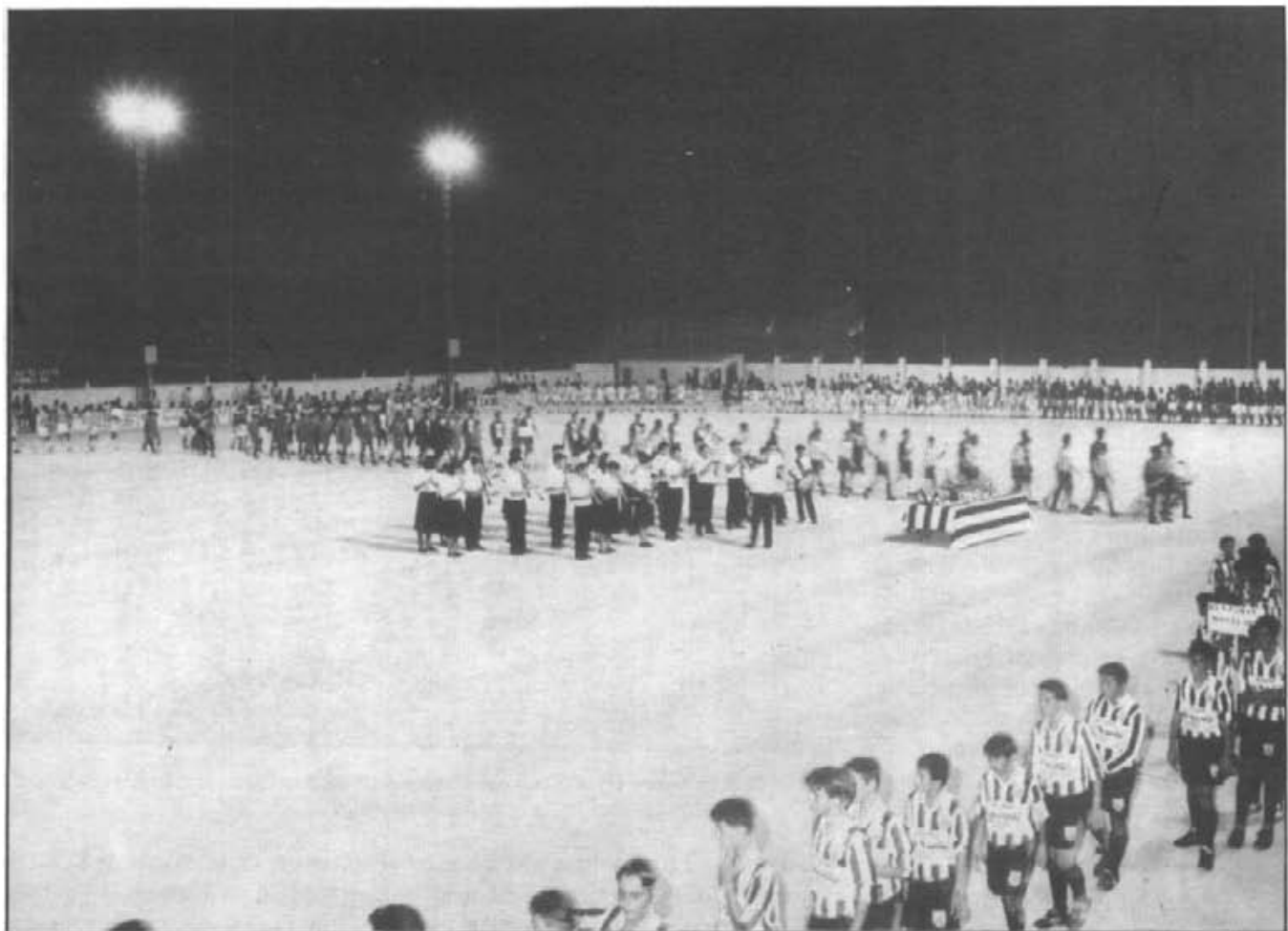
La inauguració del "XXII Torneig de Sa Llum", el 7 d'agost, fou tot un espectacle: 28 equips i més de 500 participants, la banda de música, entrega de tofeus... tot dins un ambient com a preludi de festes