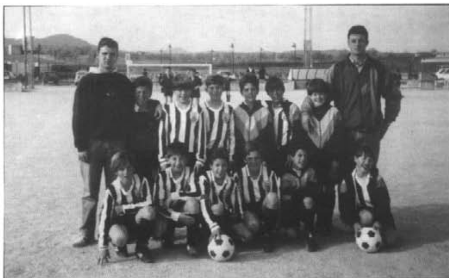
Equip de futbolet iniciació que aquest passat mes ha acabat el torneig comarcal

Els veterans de futbol-7 travessen un gran moment: guanyaren per 0-12 a camp contrari