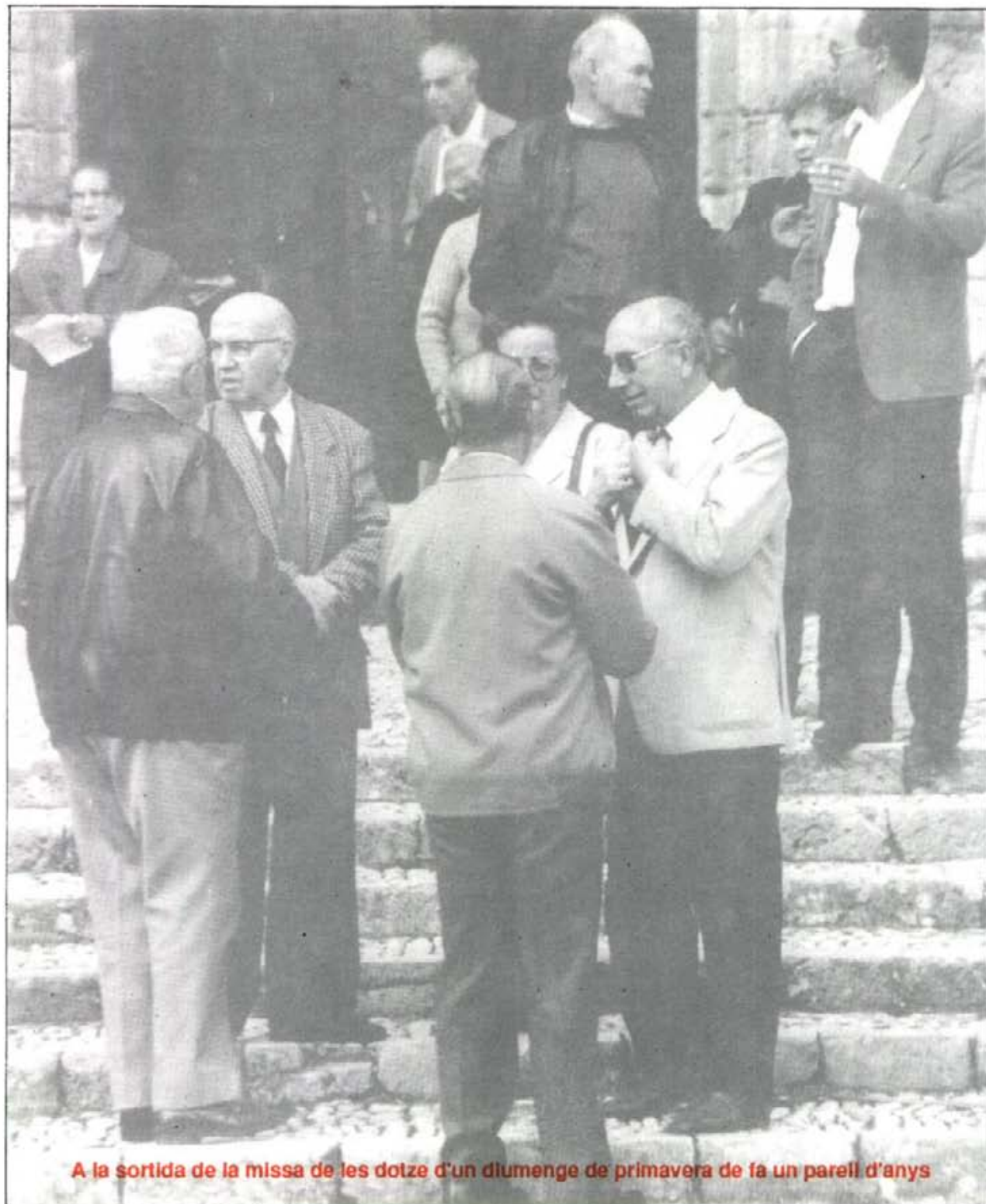
A la sortida de la missa de les dotze d'un diumenge de primavera de fa un parell d'anys

Nº. 494 - Any XLII - MONTUÏRI - ABRIL - 1994