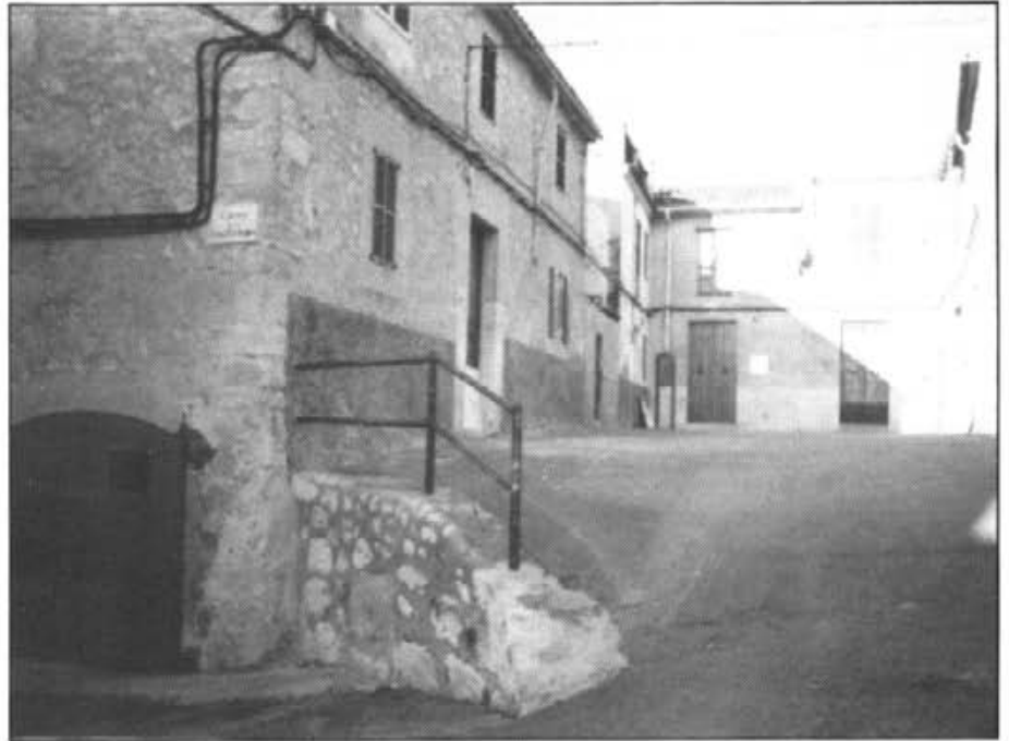
El carrer de sa Posada és un dels més antics de la vila