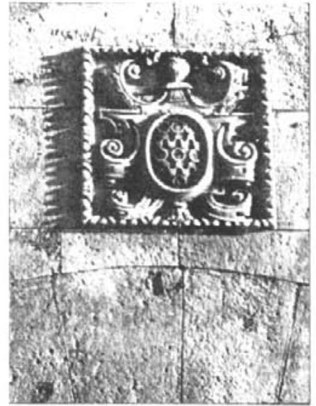
Escudo dels Miralles de Tagamanent (Can Xorri)

Don Miguel Miralles y Axeló, hijo del muy ilustre señor D. Miguel Geronimo, de quien hemos hablado, sirvió de capitán en el ejército de Felipe IV durante las guerras de Cataluña y el referido