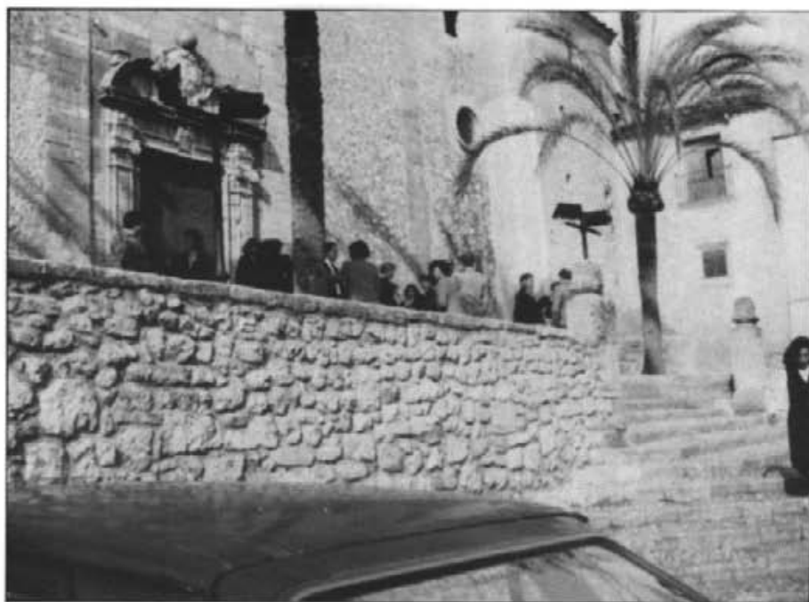
A la sortida de missa, la gent que hi ha anat, gaudeix d'empatar la xerrada i comentar els darrers esdeveniments