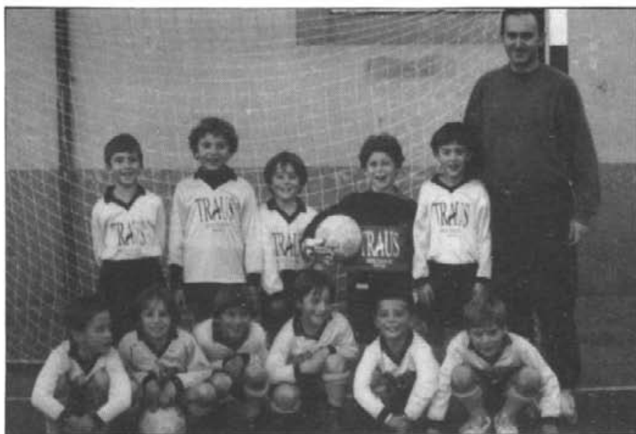
Equip de futbol-7 benjamí que el passat 26 de març va arribar a la final de la lliga