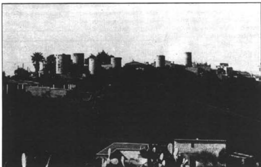
A la zona des Molinar es conserven la major part de molins de la població

Finalment hi ha l'àrea sud-oriental, integrada pels vessants orientals de la serra Llarga, de l'altiplà de Son Mut-Son Manera i del Puig des Figueral Vell, que no té cursos definits i que aboca les seves aigües a afluents del torrent de Son Catlar.