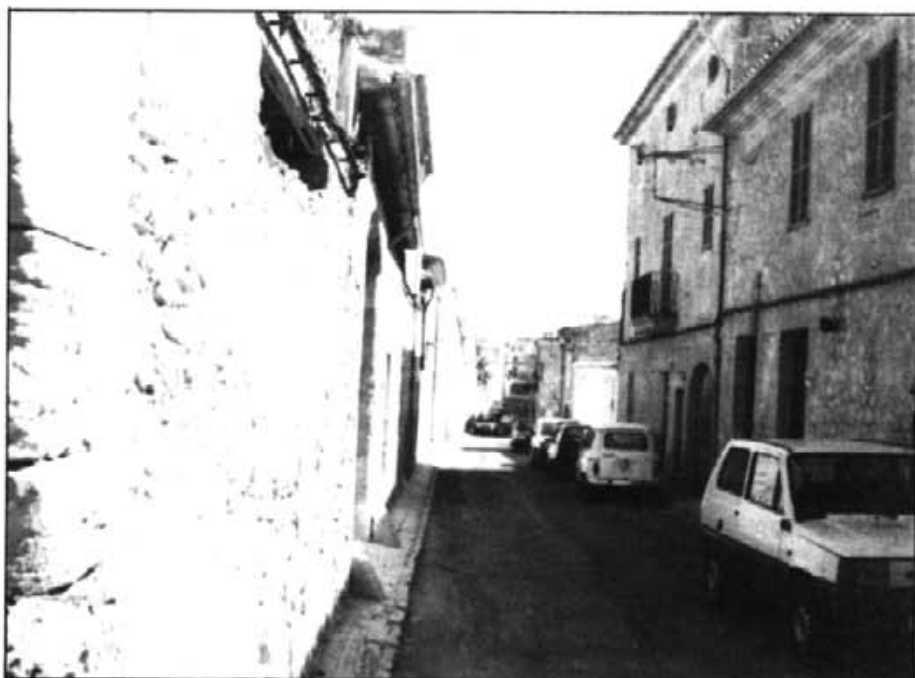
En el carrer de Baix encara resten algunes velles edificacions, ja que és un dels carrers que marcaven el perímetre de l'antiga pobla reial per la part de migjorn

I el quint, des del 1979 fins ara. Aquí cal fer constar que a la sessió del Consistori de 19 de juny de 1979 s'acordà la traducció dels noms dels carrers a la nostra llengua, la substitució del noms o símbols derivats de la guerra civil i la reintegració a la seva primitiva designació dels noms ja populars i tradicionals.