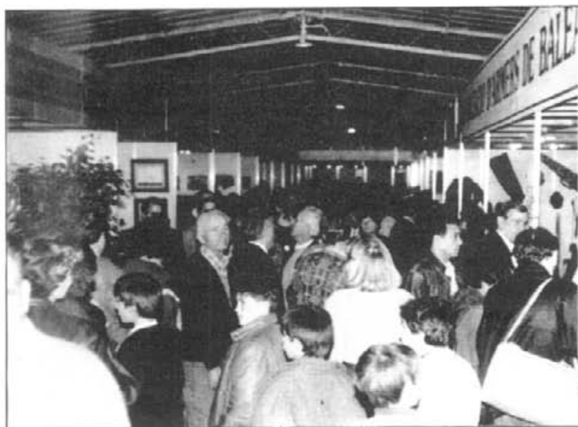
Als estants coberts de la fira de 1988 s'hi instal·laren 25 expositors. Aleshores el seu pressupost fou de sis milions

La Fira Nacional de Caça del Pla de Mallorca que s'havia de celebrar per primera vegada, del passat 16 al 19 de setembre a Montuïri, fou ajornada davant les dificultats de finançació a causa de la poca participació d'expositors interessats en concórrer-hi.