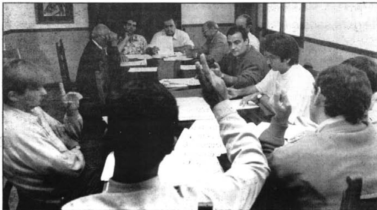
En el ple municipal del 29 de setembre s'aproven els pressuposts municipals de 1993, malgrat els vots desfavorables de l'oposició