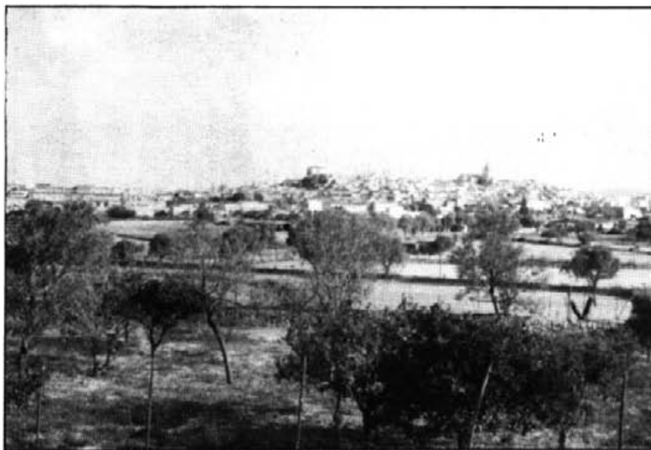
Els nostres camps mereixen més atenció

Arribant a la meva caseta, a la vora del camí, tenc un vell ametler, el qual, des d'anys enrera, el tenia abandonat. Ja no em cuidava d'ell, motiu pel qual les branques de més avall s'havien secades. Aquest ametler tenia tres cimats gruixats que li esmitjaven la soca; s'havien fet molt alts i, com que feia molts d'anys que no l'havia exsecallat, en el cap de dalt tenia molt de ramatge. Entre tan alt com era i moltes branques que tenia, agafava molt de vent. I vet ací que en la passada tardor, ja prop de l'hivern, una d'aquestes ventades fortes, procedent de la part de mestral, li esqueixà un dels tres cimats.