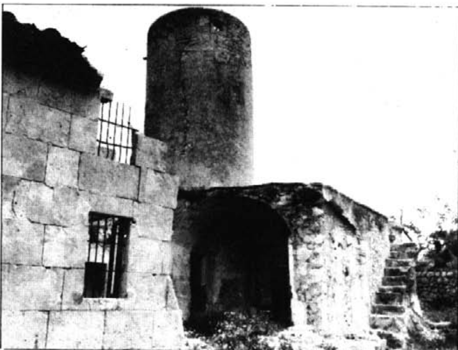
Està previst que la restauració des Molí des Fraret comenci aquest octubre

Es tracta d'un prototipus de molí de base o cistell buit. Aquesta afirmació es fonamenta en l'existència, a l'extrem oriental de la construcció, d'un massís i una escala que puja a l'envelador, que