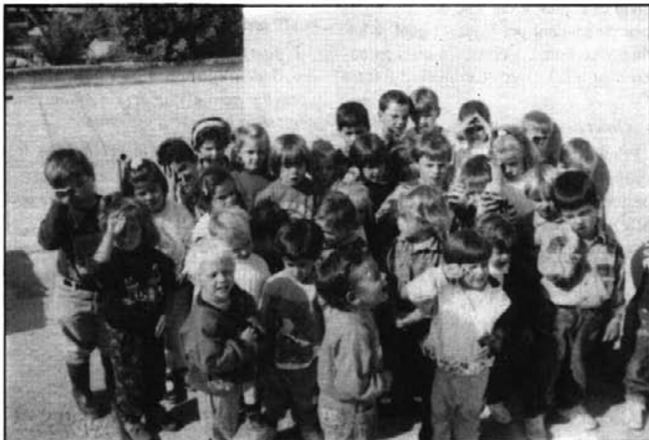
Els alumnes d'Educació Infantil del Col·legi Públic de Montuïri que han començat el curs 93/94