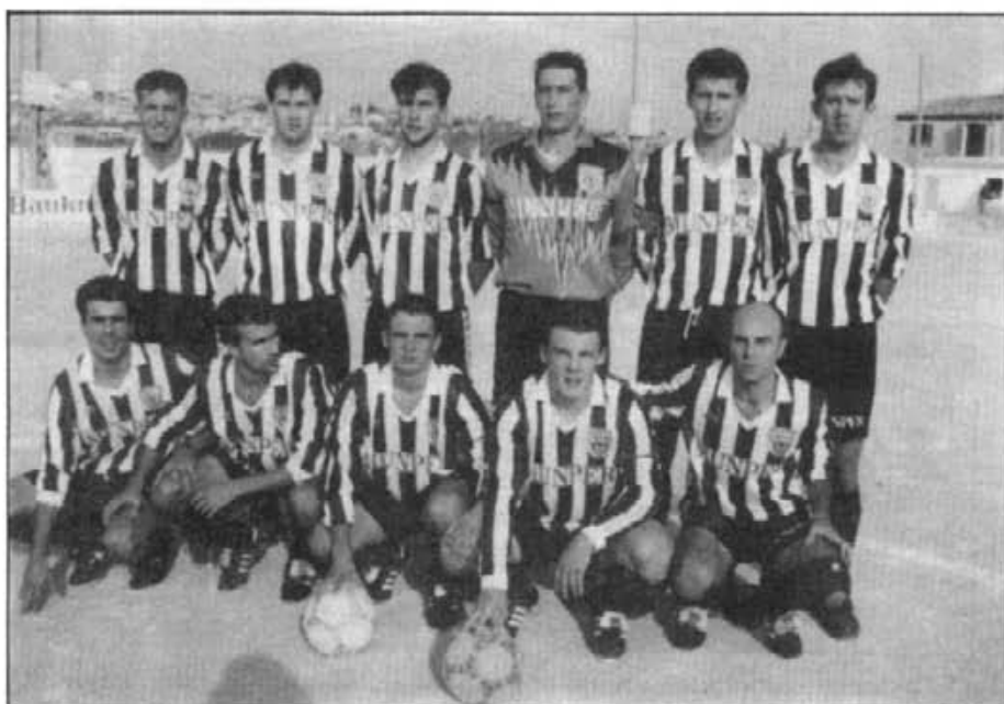
El Montuïri tal com feu la presentació en el primer partit del reingrés a la III Divisió

Extraordinari encontre del Montuïri que, des del primer moment, va impri-