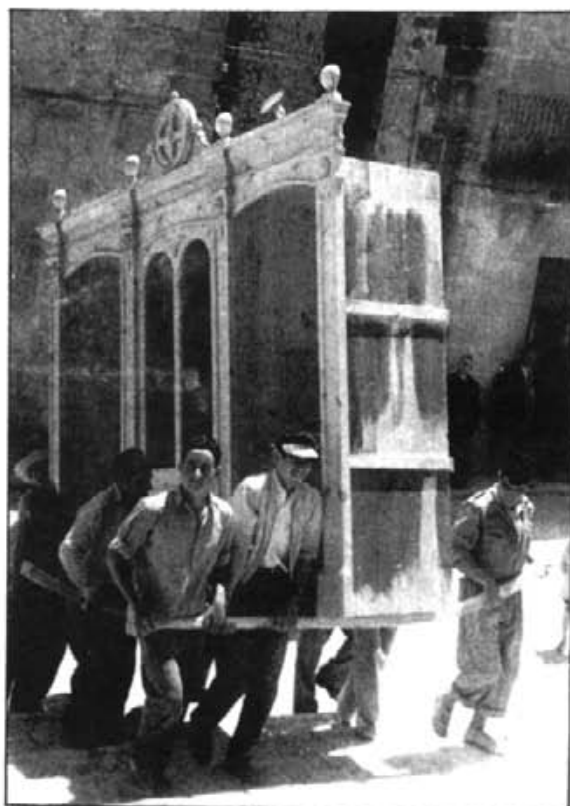
Els confessionaris que hi havia en el nostre temple parroquial havien tornat vells, motiu pel qual a mitjan segle actual foren substituïts pels d'ara, aprofitant la reforma interior de l'església

El 2º testigo, una muger de 25 años, siendo llamada testificó que confesándose con el dicho rector, la había dicho que había mucho tiempo que no la había visto, y respondiéndole ella qué cómo decía aquello pues se confesaba de ordinario con él, él la replicó que tenía ganas de dormir con ella, y que cuando su marido no estuviere en casa le diese hora para ello, y respondiéndole que su marido trabajaba en cierta parte y que no sabía quando vendría, él siempre la porfiaba que le diese lugar, y esto la decía pasándola la mano por la cara y tomándola las manos, y enojada ella de lo que el dicho rector hacía, le dixo que había visto en ella para tractarla de aquella manera, que bien sabía que no era muger mala, y él siempre porfiaba para que le diese lugar y ella le dixo que la acabase de confesar sino que se iría, y así la absolvió. Y ella estaba muy escandalizada y con miedo de que fuese a su casa alguna noche y le allase allí su marido y sucediese algún escándalo y sospechasen della que había tenido culpa, y por esta razón, aunque su marido la persuadía que le diese hora,