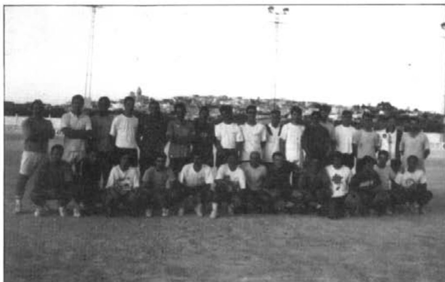
Jugadors i entrenador que es presentaren davant el públic montuïrer el dia de la presentació del C.D. Montuiri de III divisió per a la temporada 1993-94