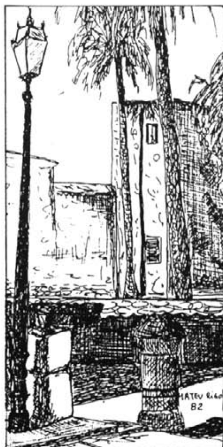
"Del fons de la pedra viva arriba la imatge dels fanals arrencats"

Té el capell abeurat de pluja. Els cafès han tancat, al carrer no s'hi veu ningú més. Pensa en els amics que s'han mort i s'han enduit els records