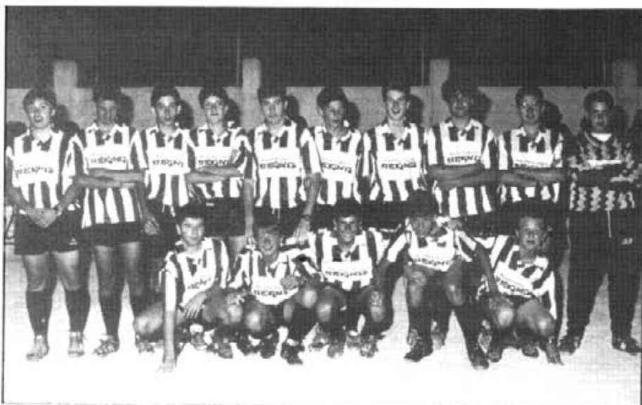
En el Torneig de Sa Llum es presentaren els cadets que disputaran la temporada 1993-94, amb algunes incorporacions