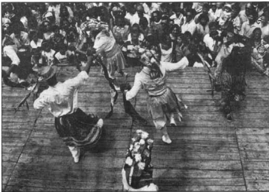
Després de l'ofici del dia de Sant Bartomeu, aquesta promoció de cossiers, damunt el cadafal, ballà una de les darreres danses