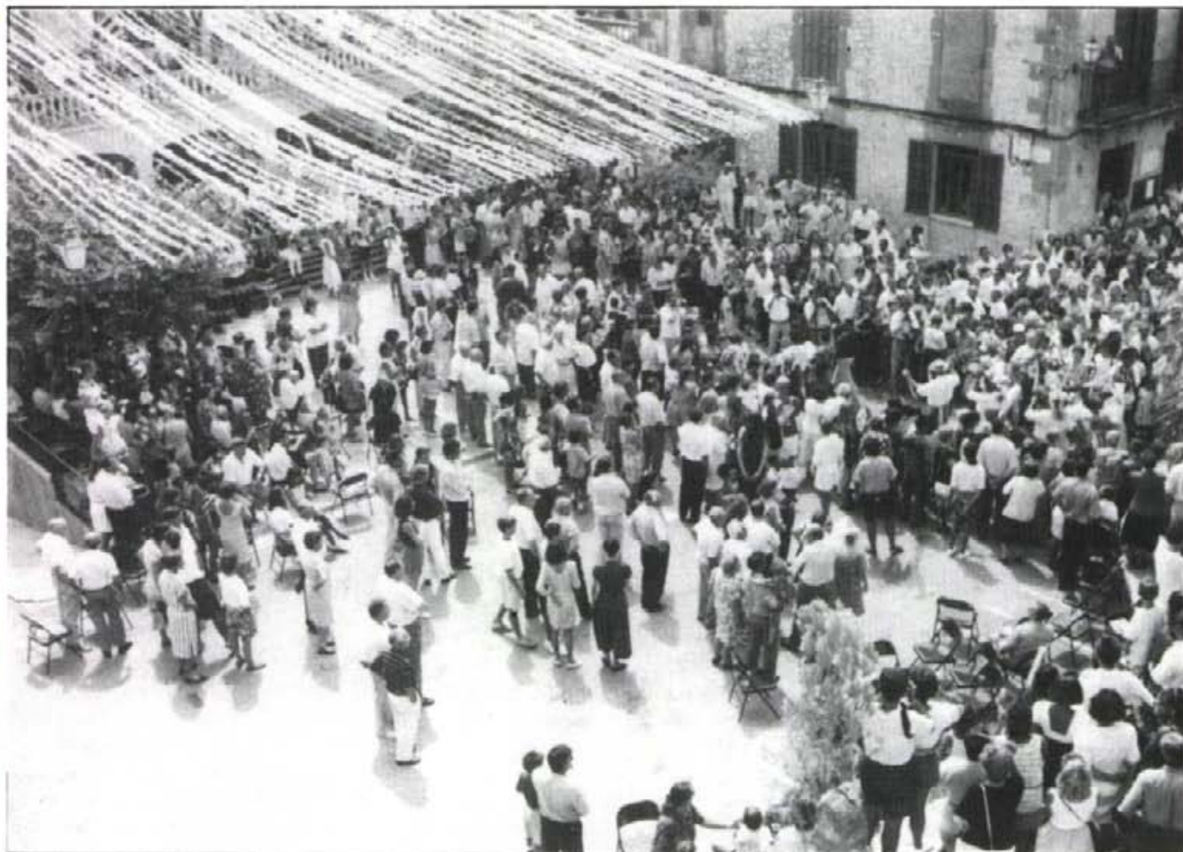
Aspecte que oferia la Plaça Major, enguany, a la sortida de l'ofici de Sant Bartomeu. S'entreveuen els Cossies als qui segueixen les autoritats

Nº. 487 - Any XLI - MONTUÏRI - SETEMBRE 1993