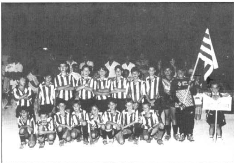
Aquesta fou la presentació dels benjamins per a la temporada 1993-94 el dia de la inauguració del torneig de Sa Llum

Campos Cardassar Cide B Collerense Independent-Camp Rodó Joventut Sallista La Victòria A Manacor Montuïri Parròquia Ramon Llull Patronat Platges Calvià Poblense Pollença