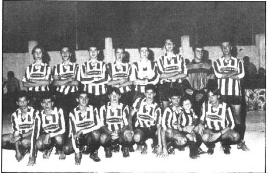
Equip Juvenil del Montuiri per a la temporada 1993-94 el dia de la presentació en el Torneig de Sa Llum