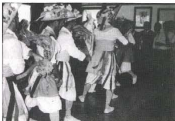
La darrera dansa d'aquesta promoció de cossies: la ballaren a l'Ajuntament en presència de les autoritats, encapçalades pel President de la Comunitat Autònoma