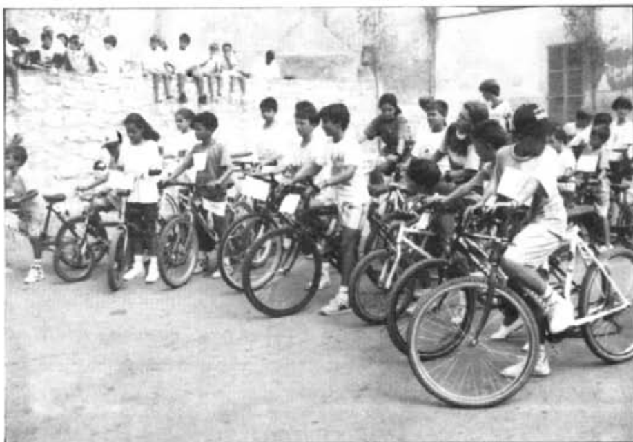
Les corregudes del dia de la segona festa arrepleguen a plaça molta gent. Nombrosos nins i nines participaren enguany a les de cintes