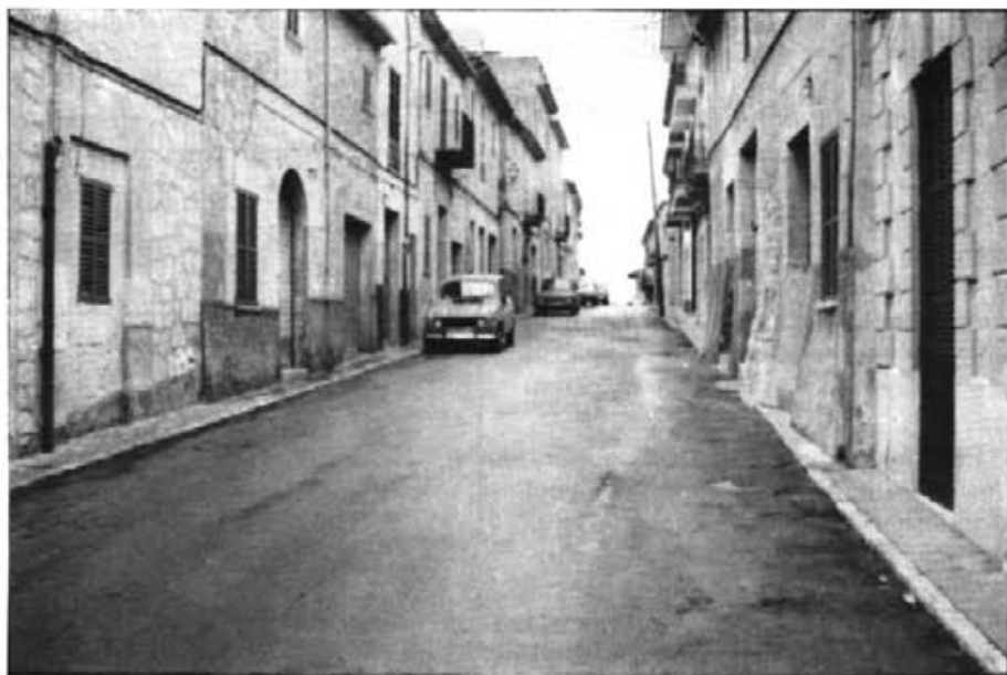
Part de dalt del carrer des Pujol, un dels més antics, en l'actualitat

Cap als anys 1830 Montuïri arribava als 2000 habitants, si bé no fa falta obrir nous carrers ni construir cases noves.