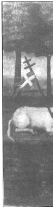
Sis de les obres pictòriques de Mateu Llopis.

Aquests dos darrers anys han sortit publicats a la nostra revista - amb l'ajut de la Conselleria de Cultura, Educació i Esports del Govern Balear - dos articles referents al patrimoni històric i artístic de Montuïri.