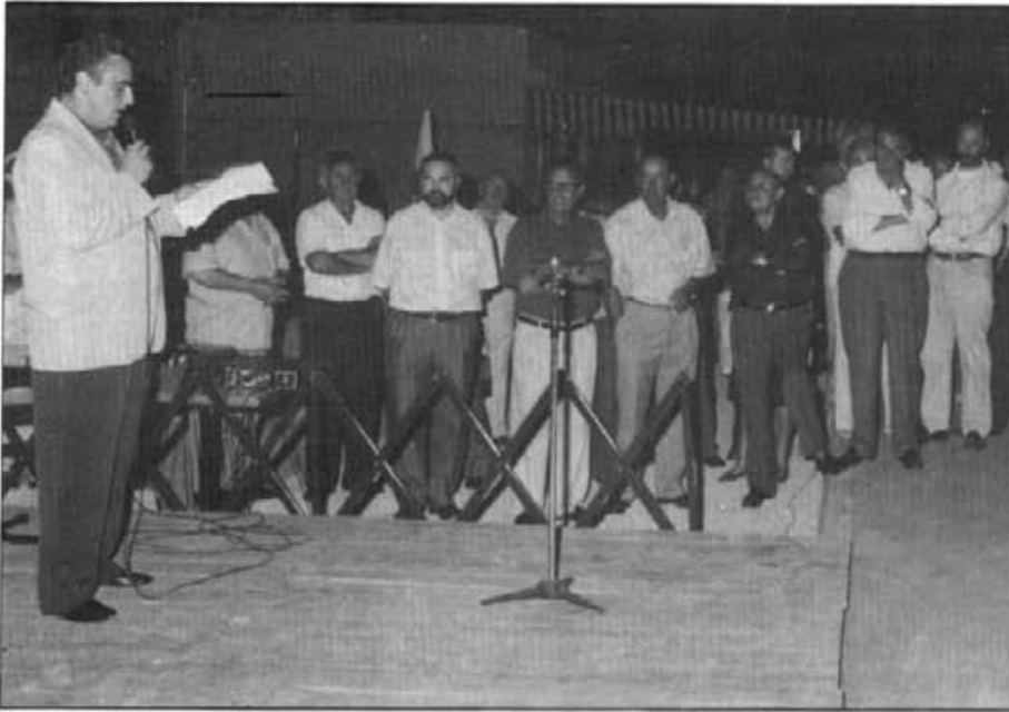
La inauguració de la piscina va reunir molta gent en "Es Revolt". El batlle, en un parlament, va ressaltar el significat de l'acte i el que suposava per Montuïri