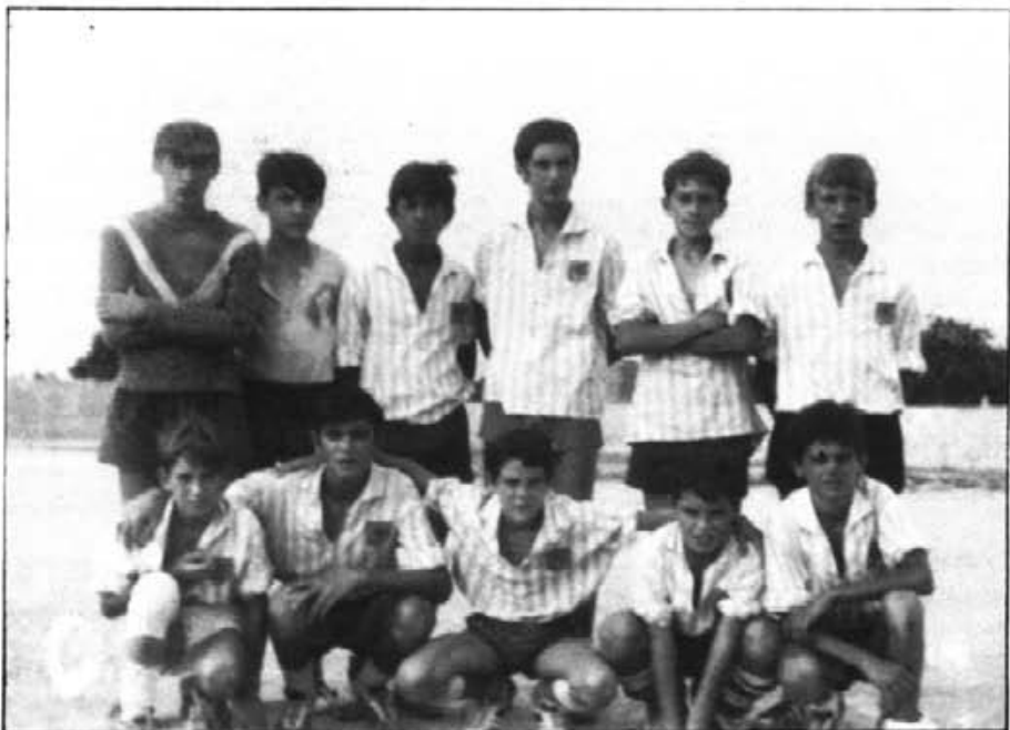
Tots sabem del bon moment que assoleix el futbol-base montuïrer i de la bona tasca que des de fa uns anys es ve desenvolupant.

Aquesta foto, idò, pertany als seus començaments, de l'actual època. Eren temps en què pocs pares col.laboraven, que una, dues o tres persones ho feien tot, que no es disposava d'equipatges com els d'ara, que no existia l'organigrama de club actual... així era l'equip infantil/aleví de Montuïri de devers l'any 70. Uns quants d'aquests jugadors —poc després— fixaren pel Cide.