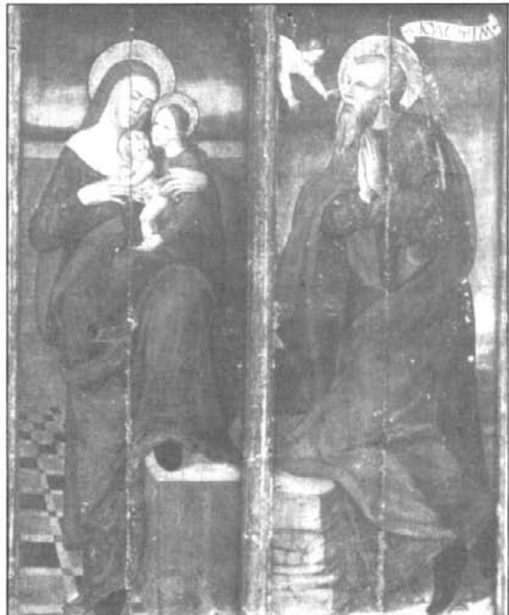
r) del segle XVI que es troben a l'església parroquial o a la rectoria de Montuiri