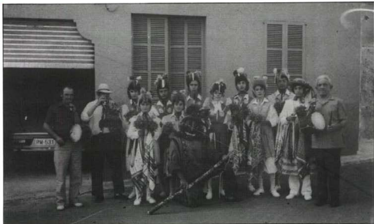
Aquesta promoció de Cossiers, per Sant Bartomeu de 1977, encara nins, començava a actuar. Enguany donen per acabada la seva tasca

Nº. 486 - Any XLI - MONTUÏRI - AGOST 1993