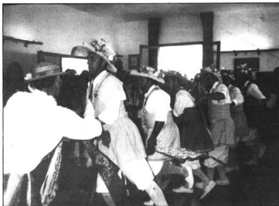
A la Sala d'Actes de la Casa de la Vila, aquesta promoció de cossiers ballarà la darrera dansa

presentades per uns joves, fills de Montuïri, que tenen en gran honor ésser elegits per a tal conjunt. Unes persones representants i representatives de tota la comunitat, les quals ens porten l'alegria de Sant Bartomeu i ens fan reviure la seva festa, com també ens fan sentir més montuïrers al mateix temps que ens fan apreciar el mèrit d'un folklore que brosta de l'interior de nosaltres mateixos mentre, simultàniament, espergeixen pels carrers i per tot arreu aquell perfum d'alfabuguera, característic dels Cossiers.