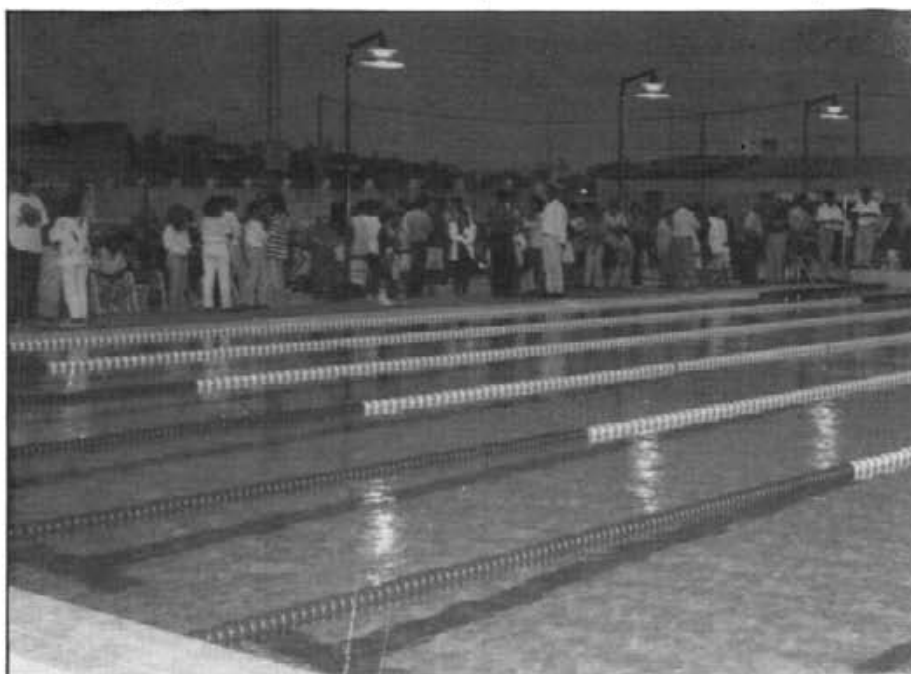
La piscina municipal de Montuïri fou inaugurada el passat 2 de juliol. S'ha construïda amb mides olímpiques perquè s'hi puguin desenvolupar tota classe de proves de natació