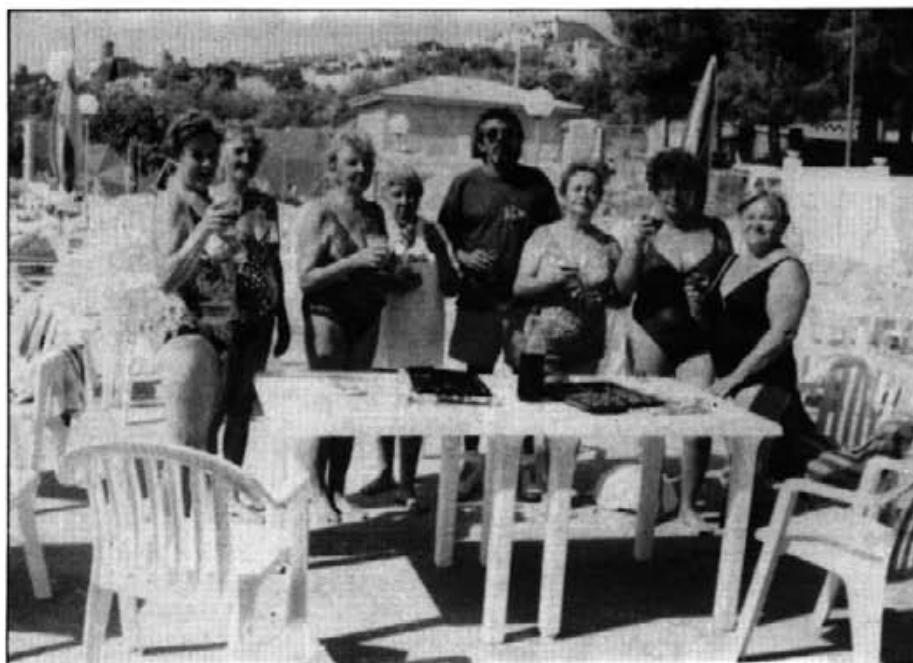
Seguint el costum d'anys anteriors, a la piscina d'Es Dau es fan curssets de natació per a nins i per a persones majors, a les quals veim amb el monitor celebrant un esdeveniment.

L'Ajuntament va acordar a la sessió de dia 15 d'agost de 1893, per unanimitat, en vistes a la gran necessitat, la construcció d'un pou a l'entrada de la vila en el camí de Montuïri a Porreres en el lloc denominat Es Dau, designant Joan Mateu Mas com a perit per avaluar el justipreu dels terrenys.