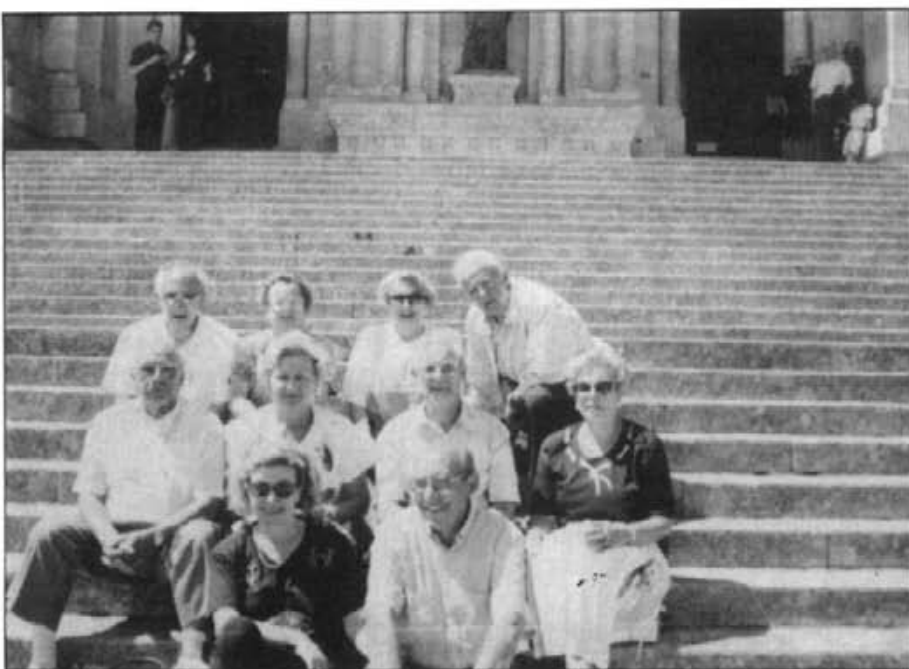
El grup de montuïrers que participaren a Santiago de Compostela a l'encontre generacional

Un grup de 10 montuïrers de Persones Majors participaren a Santiago de Compostela a l'encontre generacional organitzat per la Comunitat Balear, dia 19 de juliol passat.