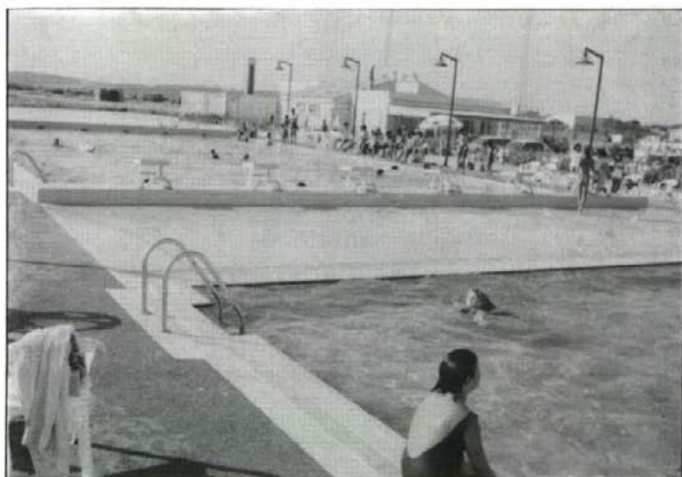
La piscina municipal, el dia després de la inauguració

De l'1 al 21 d'agost, el "XXI Torneig de sa Llum"