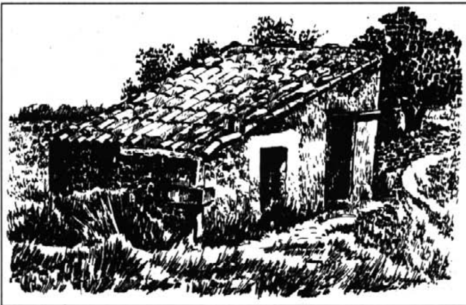
Fins fa poc temps, les casetes de camp quasi no tenien finestres, rebien la claror pel portal i procuraven que sempre donassin l'esquena a tramuntana. Se solen veure amb una cisterna o pou aferrat a la mateixa paret i amb una barra que sosté la corriola. Freqüentment els bandolers hi romanien.

L'any 1666, el virrei de Mallorca, Roderic de Borja i Llançol, establí les mesures que s'havien de dur a terme per acabar amb els bandejats. Nomenà cavallers com a governadors de les viles, organitzà patrulles a peu i a cavall per a reconèixer tots els amagatalls i possessions. La venda de pólvora restà prohibida. Les viles s'havien d'autoabastir, no es podia treure cap queviure sense el visat del governador corresponent. Amb la finalitat d'obtenir informació es posaren unes caixes on la gent hi podia dipositar avisos, si no ho volia fer de paraula. Per últim, el 28 d'agost, es feren paredar tots els forns de pa amb pedra i morter i es