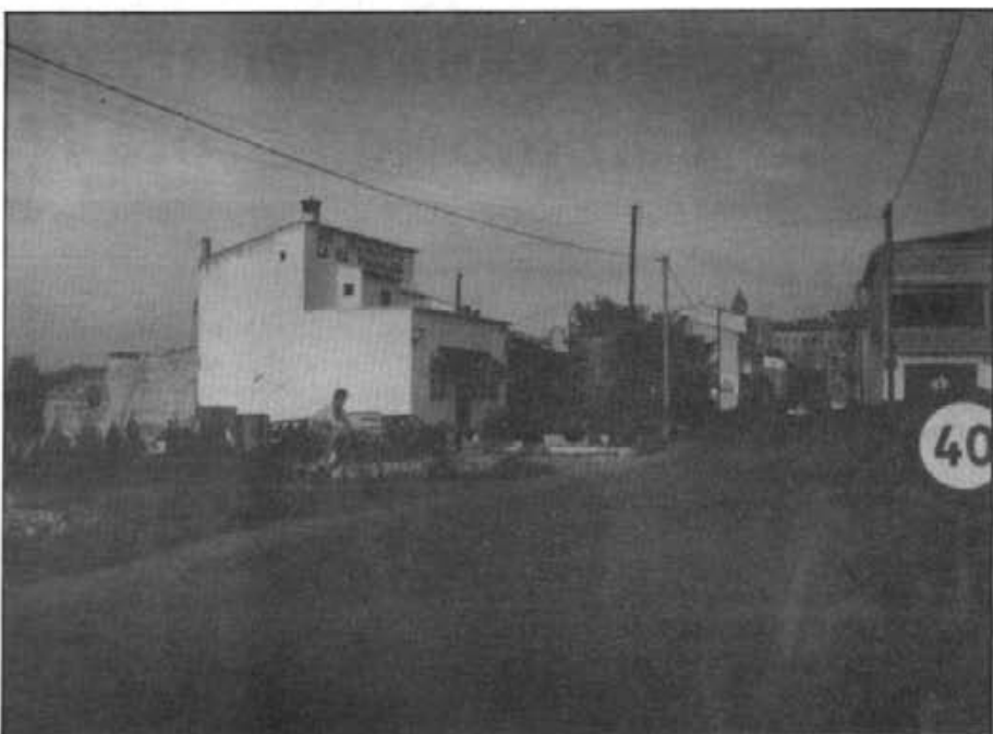
L'avantprojecte per al millorament de l'entrada a Montuïri i que oferirà un aspecte agradós i digne, és molt possible que en el futur sia també objecte de polèmica

Si, per una part, el partit en el govern municipal —el P.P.— ofereix participació als altres, en les tasques de govern i decisió —en un principi al