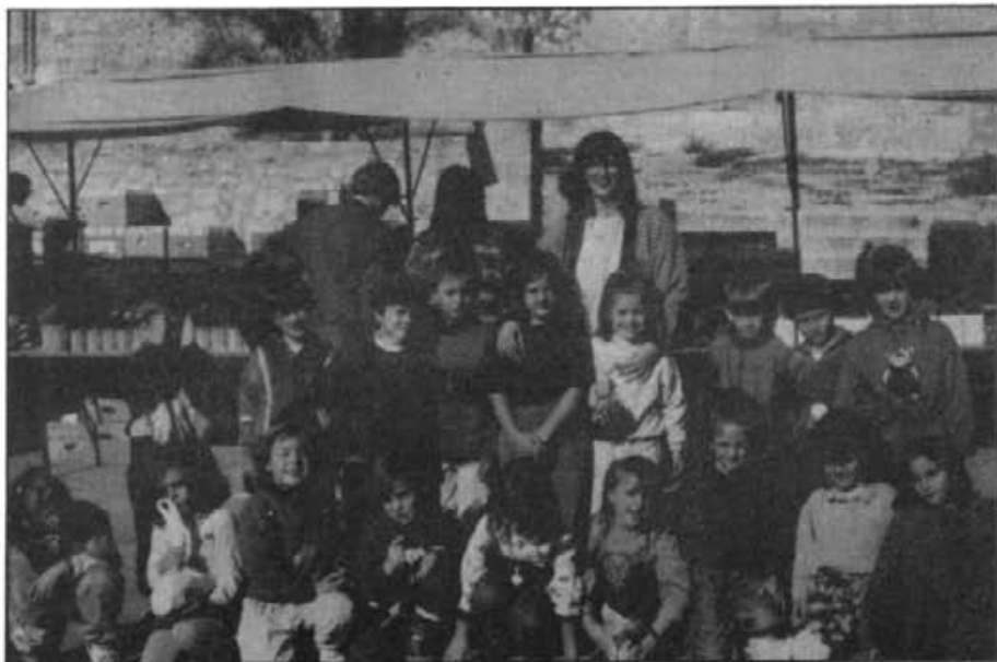
Els alumnes que enguany han començat primer amb la seva tutora, el dilluns dia 26 d'octubre després d'haver fet una visita al mercat. Aquests no pogueren anar a Cabrera, però ja comencen a començar-se amb les necessitats dels majors.

Una vegada haver botat del vaixell i haver contemplat el paisatge i rebut una explicació d'així com era l'illa, ens n'anàrem cap al Castell de