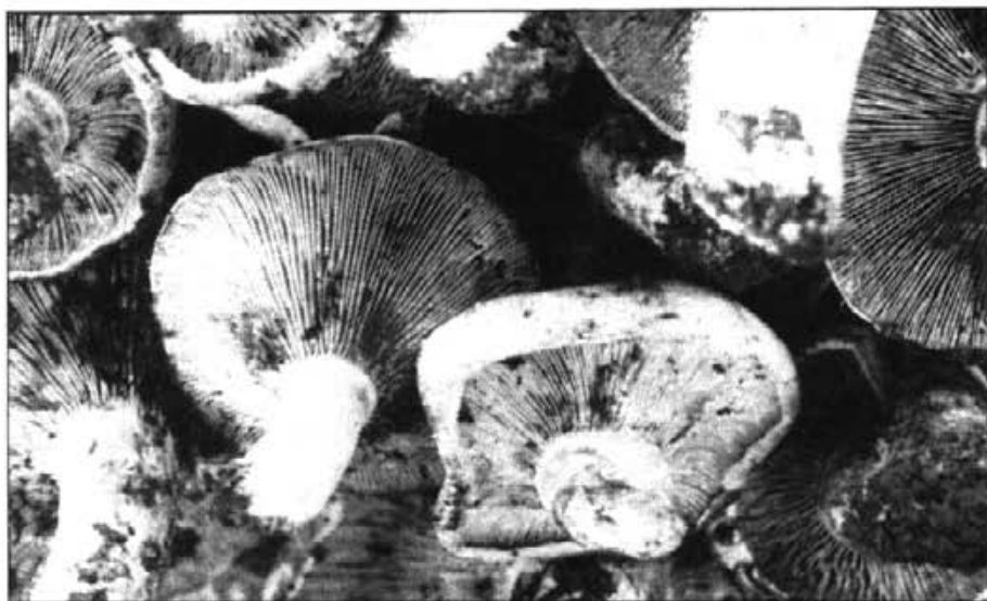
Els esclata-sangs constitueixen un plat exquisit, molt apreciat

Parescuts als esclata-sangs es troben els esclata-sangs bords o peluts, si bé aquests exemplars són fàcils de distin-