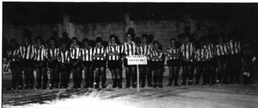
Els benjamins no començaren molt bé, però gràcies al seu esforç milloren poc a poc

I Preferent: Imbatuts a l'octubre Equips de futbol base: Bé els cadets Millorant els benjamins Cercant solucions per als infantils Dia 22 d'aquest mes, inici del torneig comarcal de futbol base escolar