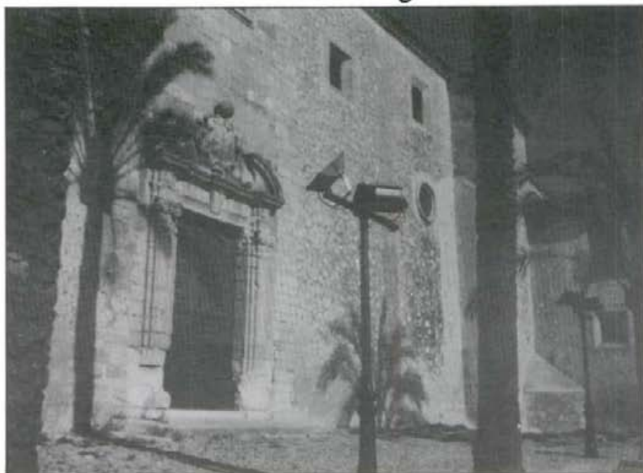
No han afavorit gens la imatge de l'església les faroles que s'hagueren de col·locar per il·luminar la seva façana. Molts consideren que també hagués anat bé un altre sistema