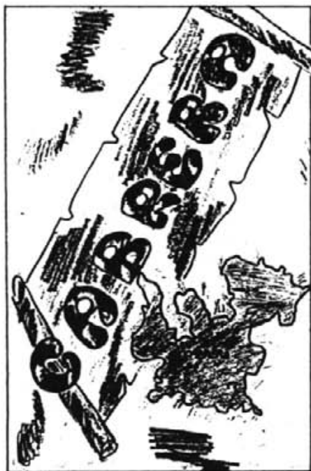
Aquesta era la capçalera d'un dels treballs presentat per un alumne

Nota. - Tots els alumnes que anaren a Cabrera feren unes redaccions, les quals es poden considerar de dignes i, en general, ben presentades. Uns treballs il·lustrats amb gràfics, itineraris, història, natura, vegetació, fauna i altres detalls. D'ells n'hem resumit alguns escrits i tret els gràfics que apareixen en aquesta pàgina. Ometem els noms perquè, en aquest cas, és l'aspecte manco important i en alguns, perquè la firma es il·legible.