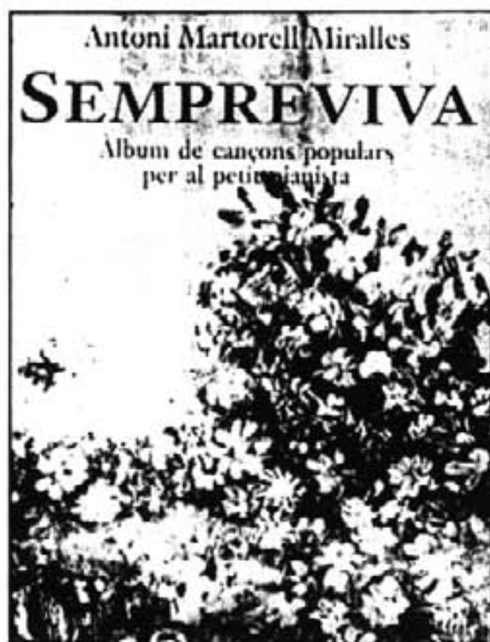
Detall de la portada del llibre

El mateix pare Martorell justifica així aquesta edició: El nostre poble balear és tributari i hereu d'un sistema musical que començà a instal·lar-se dins la conca mediterrània, ara fa dos mil cinc-cents anys, aproximadament. Aquest sistema és el sistema modal grec d'ascendència pitagòrica que, amb les seves variants i transformacions, és la base del nostre llenguatge musical d'avui. I més endavant continua: Dos objectius primordials han estat el mòbil d'aquest aplec de