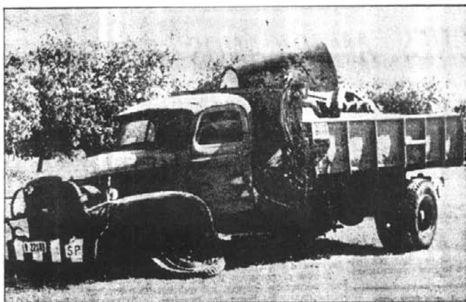
En aquest estat romangueren els dos vehicles involucrats en l'accident dels Creuers, ara ha fet 25 anys, i del que tant se'n parlà a Montuiri

menteri de Montuiri: un destí molt distint el d'aquells infortunats, al que les seves il·lusions havien marcat.