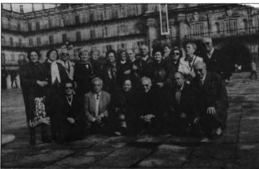
A la plaça Major de Valladolid, el grup de Montuïrers posaven plens de gaubança