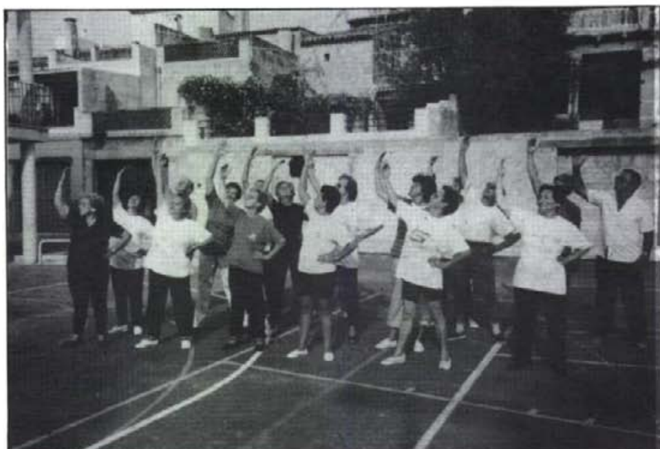
Els montuïrers, abans d'acudir a Barcelona a la demostració de gimnasia de manteniment, volgueren preparar-se en el poliesportiu d'Es Dau

Els polítics montuïrers no foren capaços de superar les dificultats