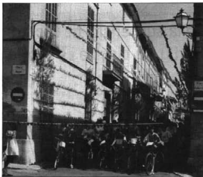
Les corregudes de cintes tenen cada any un extraordinari al·licient per a la gent menuda

—Demandar un canvi de destí d'aquests doblers. Es podria reunir la