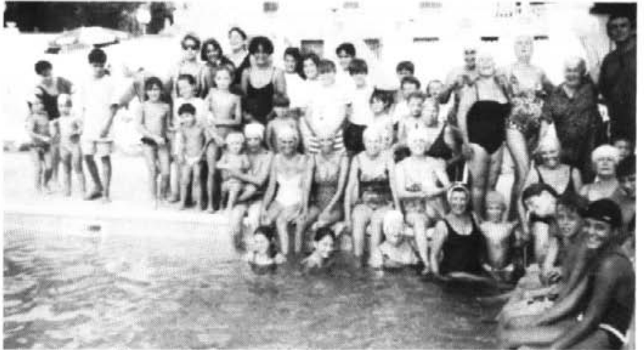
Un grup dels qui enguany participaren en els cursos de natació

-O sia que per acceptar volem saber tot això. Si dins una empresa particular o