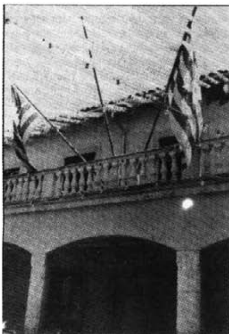
El dia de Sant Bartomeu a la balconada de la Casa de la Vila no hi oneja la bandera nacional fins a darrers hores de l'horabaixa

La matinada del dia de Sant Bartomeu, devers les 6, segons varen