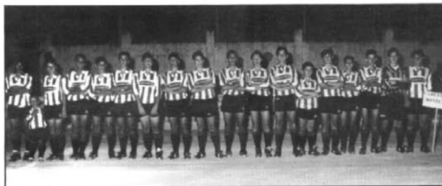
Els equips de benjamins (a dalt) i cadets (abaix) que participaren en el Torneig de sa Llum d'enguany