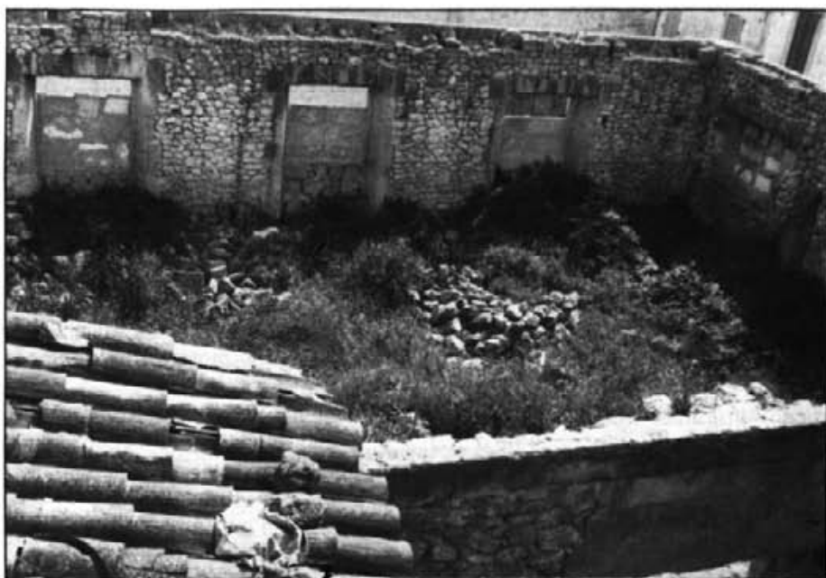
Exactament davall allà on ara està situada la Casa de la Vila s'hi trobava aquest solar que tothom coneixia per Sa Carnisseria. Era el lloc de trobada i de jugar de tots els al.lots del poble fins que s'hi construí l'actual edifici, inaugurat el gener de 1968

El trespol d'aquest solar era de terra forta —no recordam cap roca— i pla, excepte algunes petites síquies o canaletes que havíem fet per als nostres jocs. Tal volta haguessin pogut carregar unes quantes carretades de pedres grosses i petites que nedaven per tot arreu i que nosaltres, inconscientment, retiràvem quan ens feien nosa. El centre estava net de plantes, però les voreres estaven estibades d'herbes altes i espesses que, en l'estiu —que era quan freqüentàvem més aquest lloc— quedaven aplanades, planxades. En el racó, entre el carrer de les Corregudes i l'edifici de l'Ajuntament anterior, hi havia un pou sense coll ni peretat. Les males herbes el feien quasi invisible. Del seu fons hi sortien les branques d'una figuera borda. Una paret no tan sana