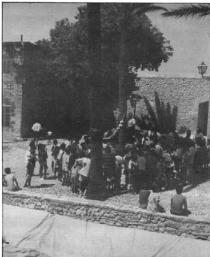
Dues estampes de les passades festes que captivaren els nostres infants: les corregudes de cintes i la rompuda d'olles