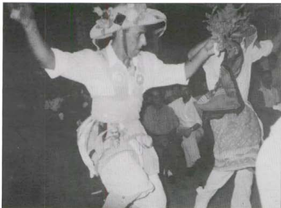
El tradicional ball de l'oferta dels Cossiers del dia de Sant Bartomeu, enguany, com cada any, va atreure l'expectació de montuïrers i externs, àvids de contemplar tan belles danses