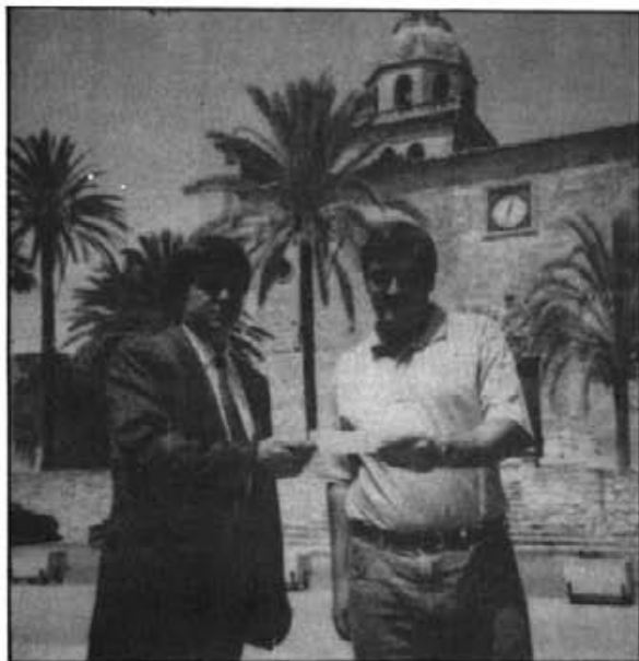
El delegat de "La Caixa" a Montuïri féu entrega al nostre batlle d'un xec de 250.000 pessetes com a col·laboració de l'entitat que representa, a la il·luminació de les façanes de l'església i del campanar

Amb l'ajuda econòmica del Consell Insular i de "La Caixa", i l'aportació del nostre Ajuntament, s'haurà pogut dur a terme una obra de millora i d'embelliment pressupostada al voltant d'un milió i mig de pessetes.