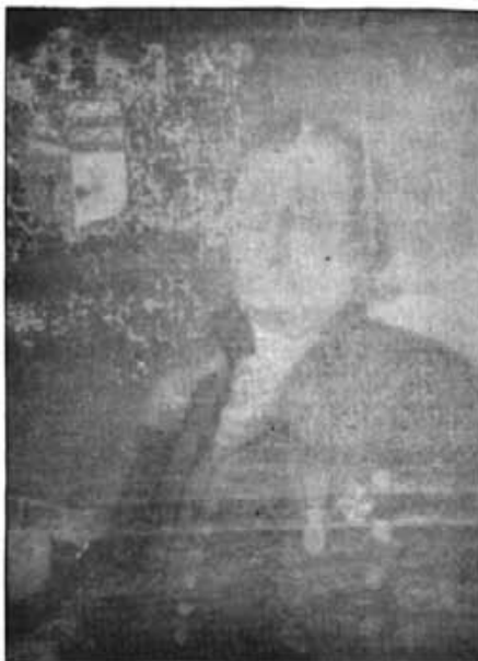
El quadre a l'oli de Miquel Socias de Tagamanent que es conserva a la casa pairal, actualment està en un estat molt deteriorat

No és rar que en dedicàs a la fam, ja que, en aquell segle, Mallorca, per tot arreu, en fou víctima en grau summe.