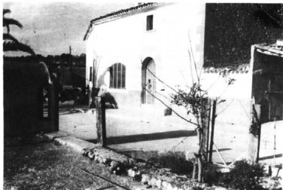
San Palou, una de les zones del terme no degradades