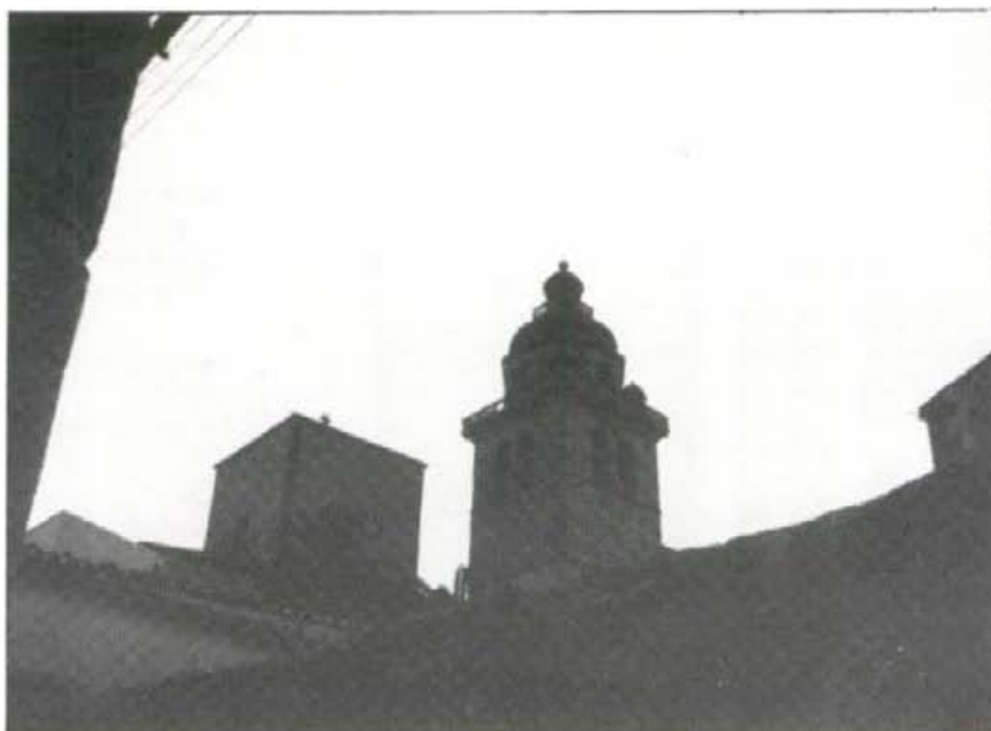
Amb la nova il.luminació el campanar ressaltarà esplendorosament durant els vespres

Aquests dies s'haurà fet realitat la il.luminació de l'església i el campanar. Amb tres línies elèctriques: una amb 8 projectors que il.luminarà la cúpula del campanar, el campanar i el