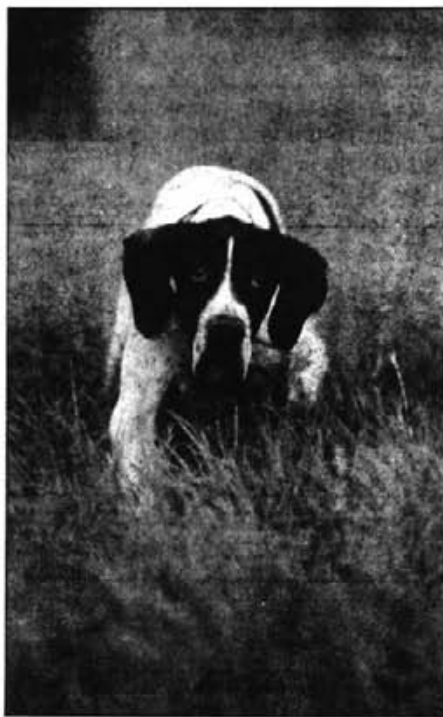
Sempre que es respecti la llei, la caça del conill amb ca es podrà practicar els dimarts i dissabtes

—Clar. Si el caçador no pot caçar conills i desitja caçar guàtleres, almanco que hi hagi guàtleres i perdius i en més quantitat. D'altra manera ens trobarem que hi haurà un nombre de caçadors que faran molta pressió