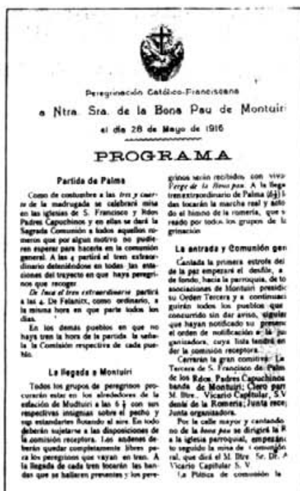
Portada del programa de la peregrinació

Armats del cordó i'l rosari som de la Creu paladins que seguim l'itinerari de la Fé, pels vells camins. ¡Regina de Montuiri estel radiant de l'empiri, conduiu als pelegrins!