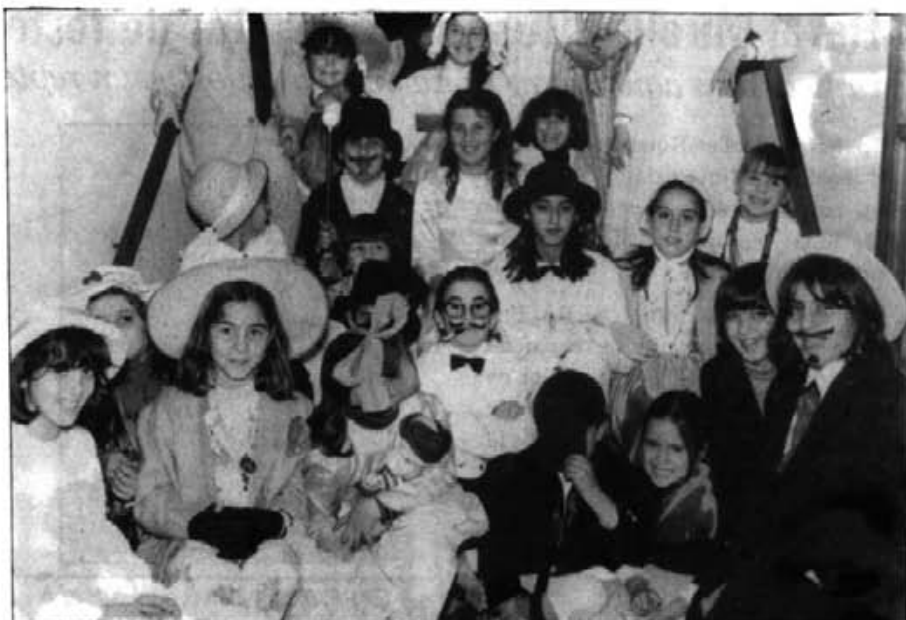
Els nins que es disfressaren pel febrer de 1985 ara ja són majors. I també hi hagué per a ells concurs, com n'hi haurá enguany pels als qui són petits. Com igualment a la Plaça Vella aquell any hi hagué orquestra i fogueró.