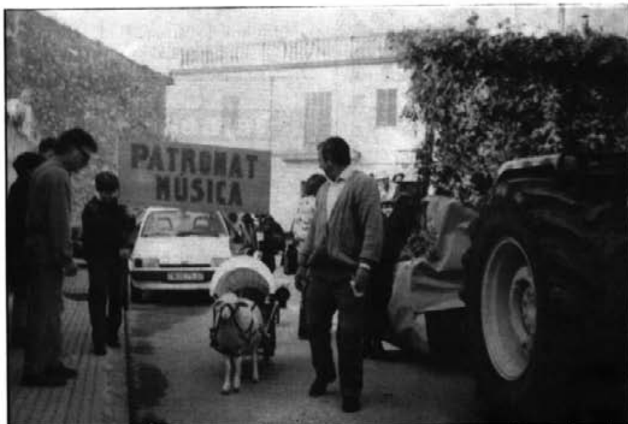
L'original manera de presentar alguns animals a les beneïdes de Sant Antoni, les donà un aire simpàtic i graciós

El qui els darrers anys havia estat director de l'oficina a Montuiri de la