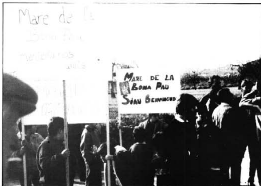
Tant les peregrinacions al Santuari com les davallades de la Mare de Déu de la Bona Pau s'han anat repetint en el transcurs dels temps

Todos los grupos de peregrinos procuraran estar en los alrededores de la estación de Montuïri a las 6'30 con sus respectivas insignias sobre el pecho y sus estandartes flotando al aire. En todo deberán sujetarse a las disposiciones de la comisión receptora. Los andenes deberán quedar completamente libres para los peregrinos que vayan en tren. A la llegada de cada tren tocarán las ban-