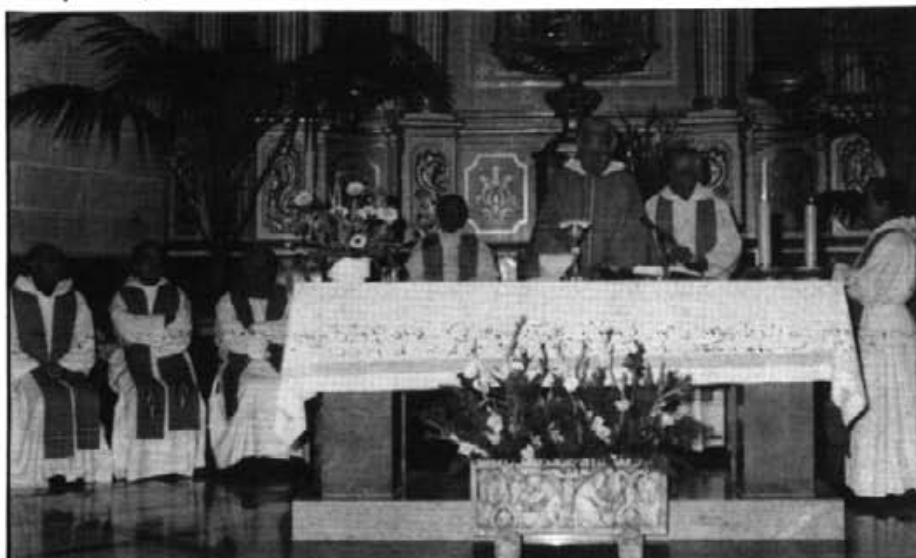
Vuit sacerdots concelebraren l'Eucaristia amb motiu dels 40 anys de Bona Pau

El Consell vol manifestar expressament la seva satisfacció per la celebració dels 40 anys de la revista Bona Pau . També vol donar gràcies per la seva presència i participació activa en la conce-