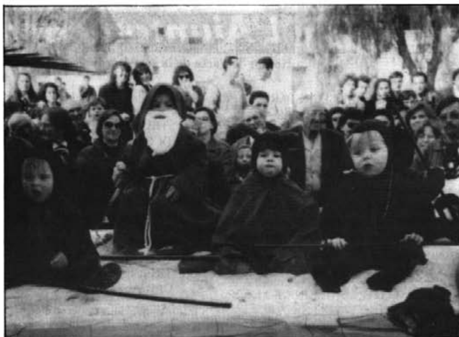
Fins i tot es nins que enguany desfilaren dins ses carrosses a ses beneïdes, oferiren una compostura mai vista. Semblava que s'havien contagiats des majors. Sa correcció i serietat en aquells moments, era sa nota dominant.