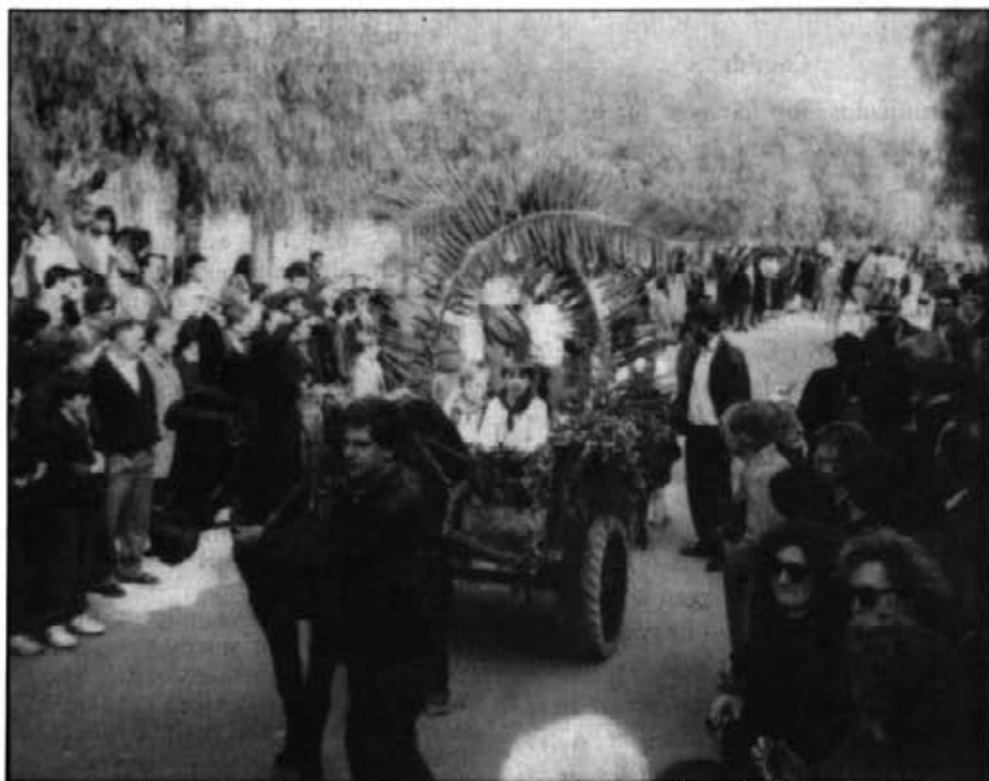
Enguany, amb motiu de les beneïdes de Sant Antoni, tant els quintos com altra gent han demostrat tenir seny