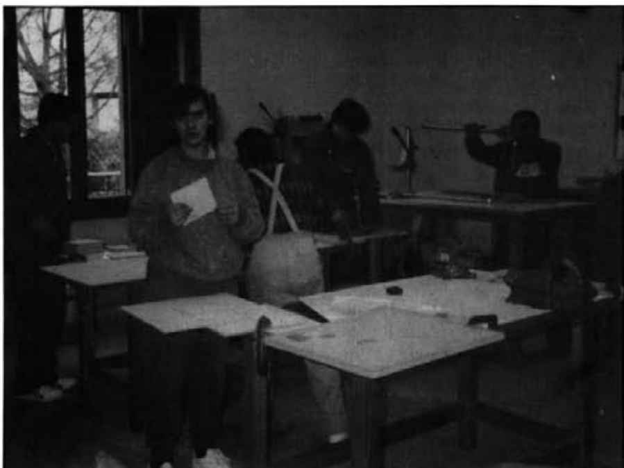
Taller de fusteria amb els joves que aprenen l'ofici

Si bé aquests tallers ensenyen de forma grupal, també s'intenta donar una formació individualitzada de qualsevol