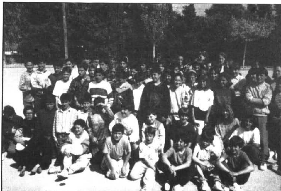
Els participants en el concurs literari mostraren la seva satisfaccio