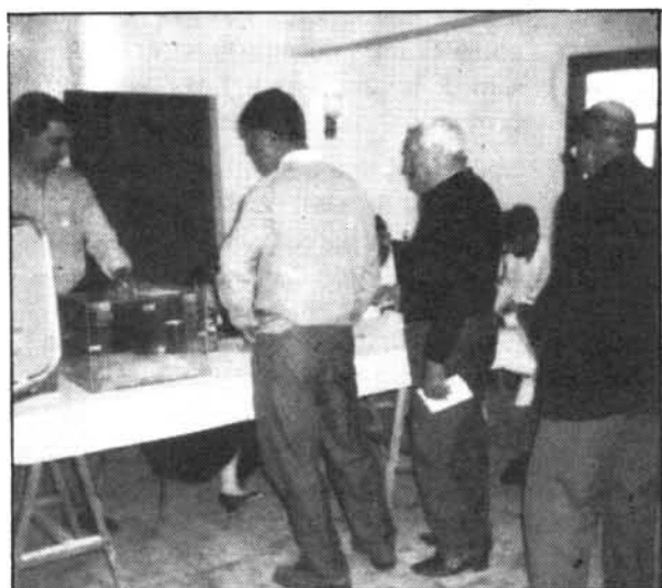
ELS CIUTADANS DE MONTUIRI EMETEN EL VOT Tant a la mesa del Consultori (damunt) com a la de l'Ajuntament (davall) no mancaren electors durant tot el dia.

—La feina que acab de dir és la que intentaré fer des del Consell Insular i des del Parlament de les Illes Balears, per mostrar a Mallorca que a Montuiri encara queden ideals de solidaritat, ecologia i mallorquinisme. I esper no defraudar els qui m'han confiat aquesta tasca.