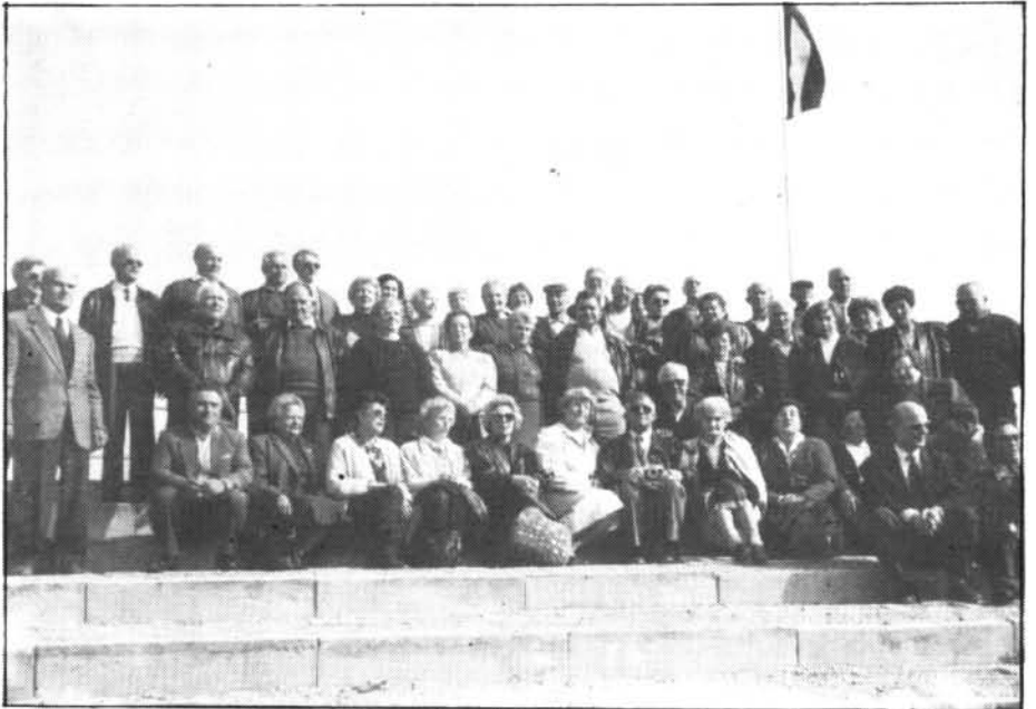
Les excursionistes montuïrers a Austria, des de les nevades grüdes de l'Alpe, d'esquí sobre gel de Innsbruck, poguen contemplar aquell bell panorama

Dia 30 de maig els nostres majors encara realitzaren una excursió a Artà, i visitaren també Capdepera, les Coves, Cala Ratjada i dinaren a Sant Llorenç. Entre tots eren 85.