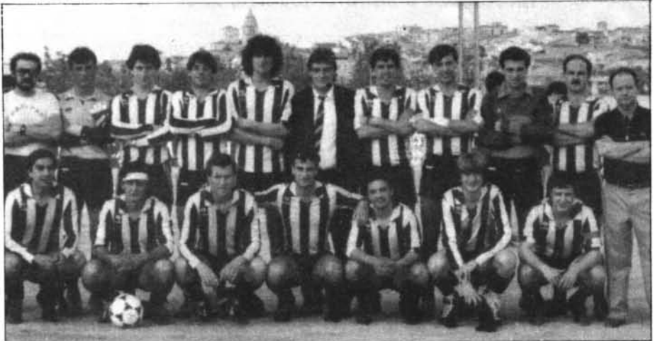
L'equip que el 23 de juny de 1985 aconseguí la gesta d'ascendir a III Divisió Nacional

comprat els equipatges per als infantils i el club hi posà 700 ptes. i la resta, fins a 3.100 fou abonat per un grup d'aficionats.