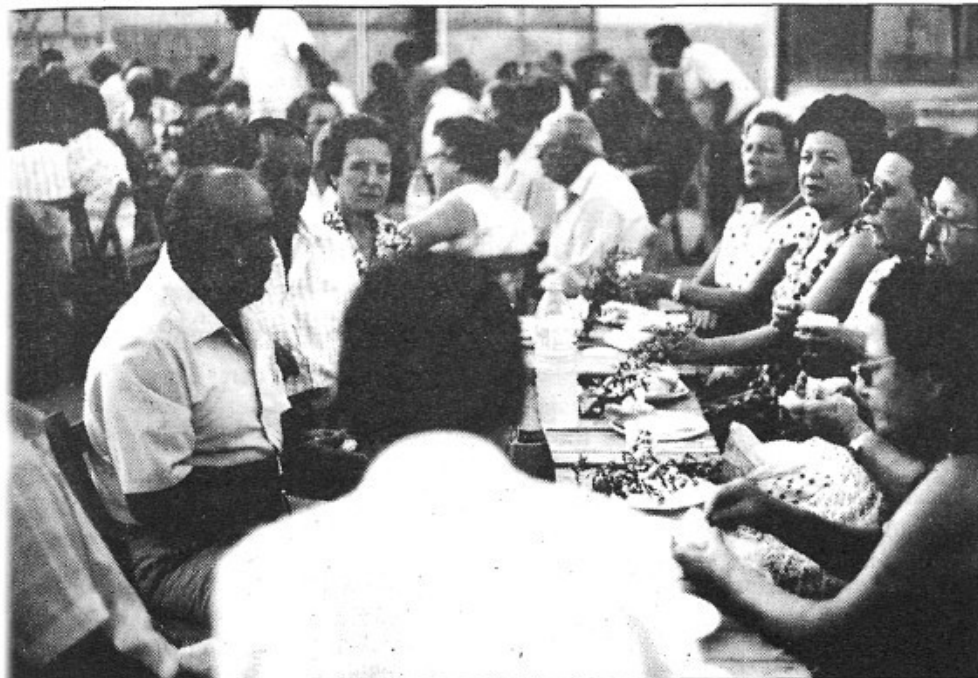
La commemoració del V Aniversari de l'Associació de la 3a. Edat fou extraordinària. La foto correspon a una de les moltes festes i celebracions que freqüentment celebren

grips mortífers, febres malignes i pestes grogues i de tot color. Ara, però, mestre "Badia", serà qüestió de fer el cap viu, sobretot mentre s'usi això d'estirar el potó. Donau guerra a la senyora de la Corbella i seguireu vivint amb il·lusió, amb l'esperança de tenir un Montuiri pròsper i civilitzat, estimador abrandat del que és propi, sigui la llengua, sigui el paisatge natural dels nostres sementers, boscos i garrigues, amb les herbes i plantes que s'hi congrien, sigui també el nostre paisatge urbà, amb les seves places, carrers i cases, amb el nom degut de cada cosa. Feis-ho així, mestre Biel, i noltros també vos prometem que mantindrem la flama ben alta a través dels anys. D'aquesta manera, podeu estar-ne segur, mai no morireu, perquè tots, a la fi, tots serem u" (*).