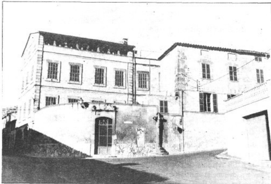
Està projectat començar l'ampliació del menjador de Ca Ses Monges abans d'acabar l'any 1989; però la construcció de la residència per a la 3a. Edat no serà a curt plaç

Sobre el projecte d'enllaçar l'Avinguda Es Dau amb Es Molinar, actualment s'estan redactant unes noves bases per al concurs d'idees, conjuntament amb el Col·legi d'Arquitectes.