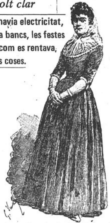
Jove mallorquina de principis de segle

—Ens aixecàvem a les 4 i berenàvem a les 8. Dinàvem devers les 12. L'hora baixa berenàvem i el vespre, sopàvem.