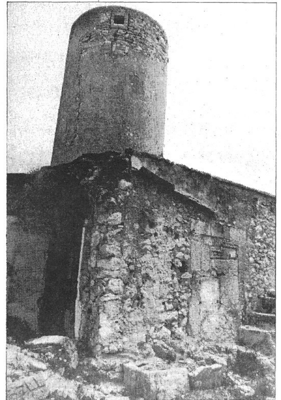
El Molí des Fraret actualment està en un lamentable estat d'abandonament. L'Ajuntament està disposat a reconstruir-lo abans de dedicar-lo a escola-taller

Almanco hauran de passar dos anys perquè es puguin iniciar les activitats docents d'escola-taller d'oficis, i això es farà mitjançant un conveni amb el Ministeri d'Educació i Ciència.