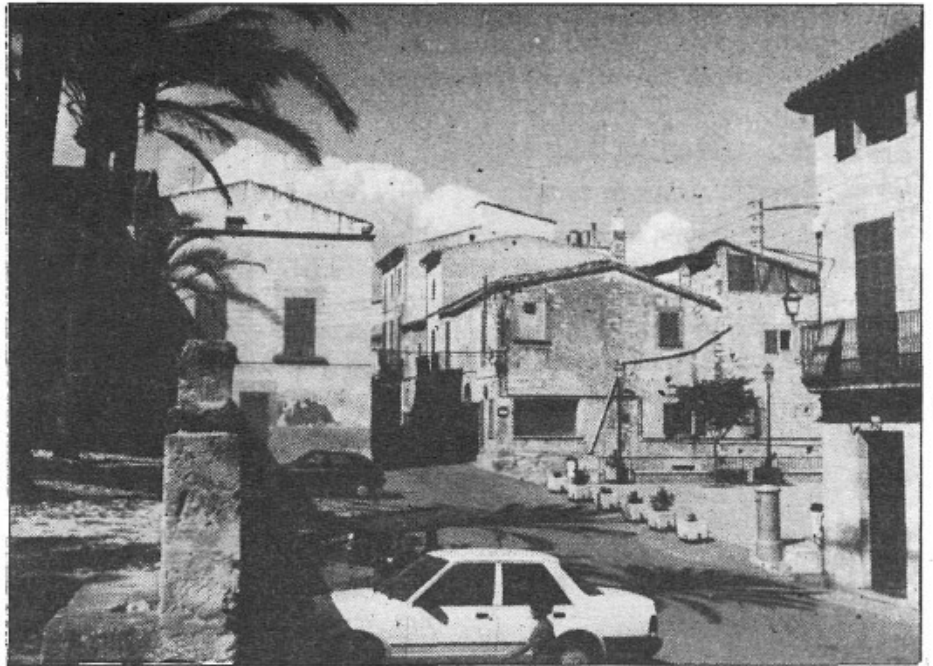
La Plaça Major apareix així, buida, els dies feiners. Però els dissabtes i diumenges és el lloc adequat per trobar-s'hi tant els qui romanen a la vila com els qui hi vénen els fins de setmana

Divendres: Amb motiu de la festa de fi de curs, a les Escoles actuarà el GRUP CUCORBA, a les 20'30 h.