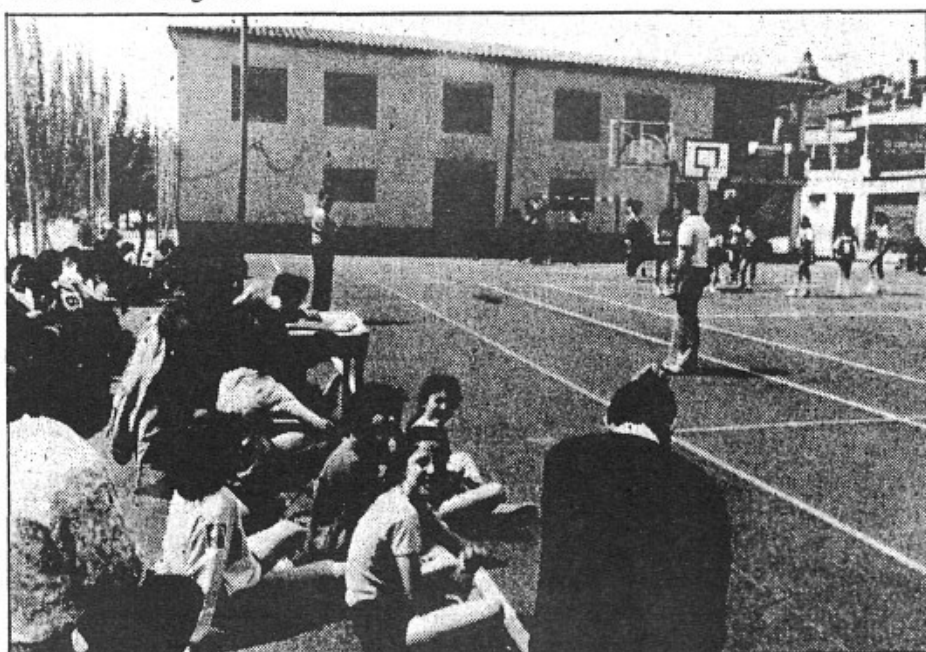
La pista des Dau és utilitzada freqüentment pel equips de futbol base i d'altres esports