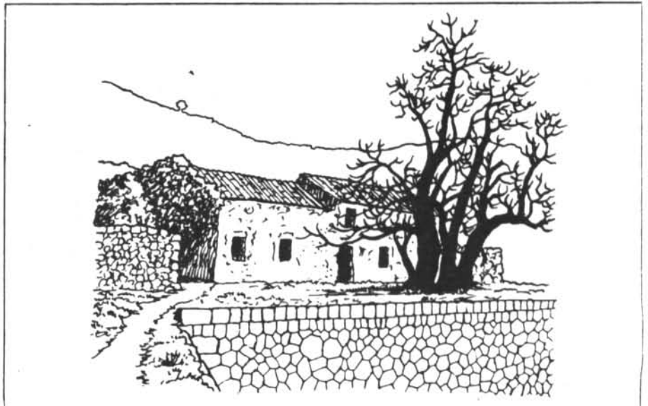
La Trapa: les ruïnes de l'ermita, construïda entre 1810 i 1817 per una comunitat de 40 persones en total (entre frares i llecs), i el magnífic exemplar d'ombú, arbre originari de la pampa sudamericana. (Dibuix: Aina Bonner)