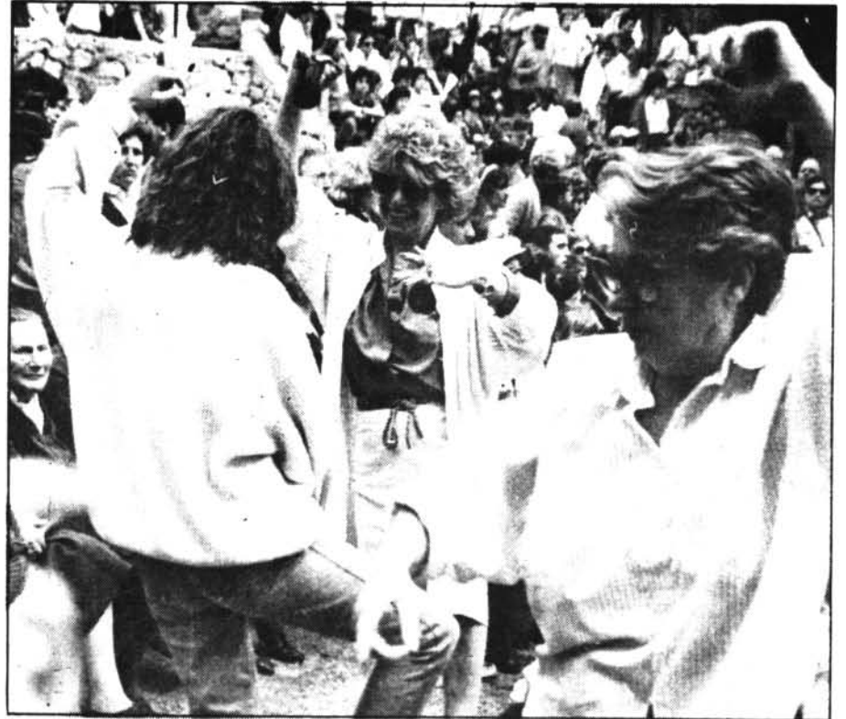
Els balls d'Es Puig, foren la nota més simpàtica de la tercera festa de Pasqua.

I a la nit, a Plaça, tornaren ballar les nostres danses. Pot ser que no hi hagués tanta