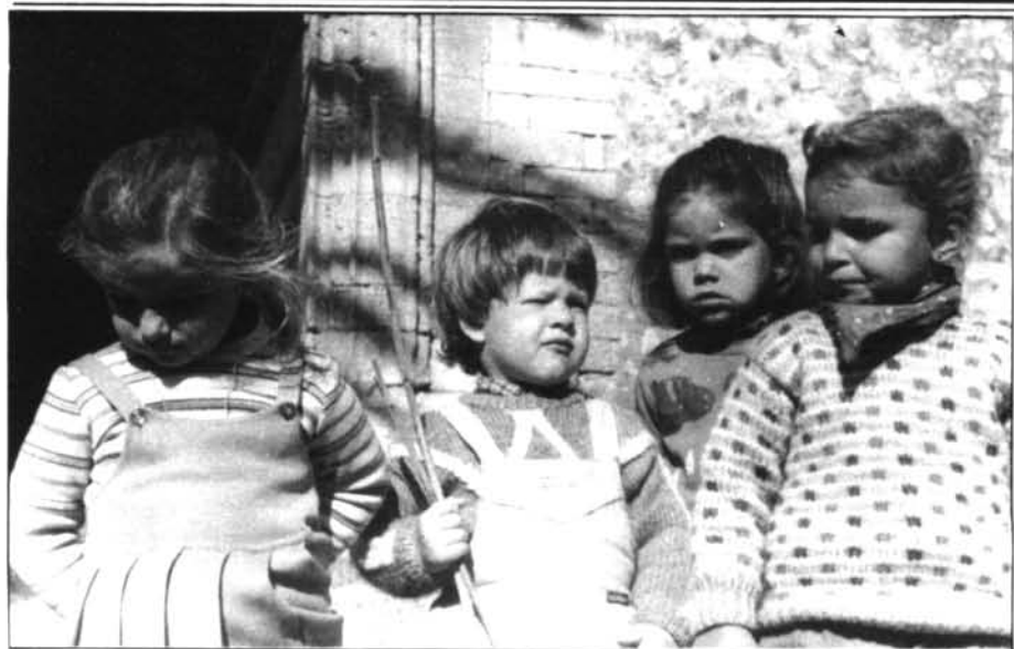
Tan petits i tan decidits

«Les promeses són unes i les realitats, altres»