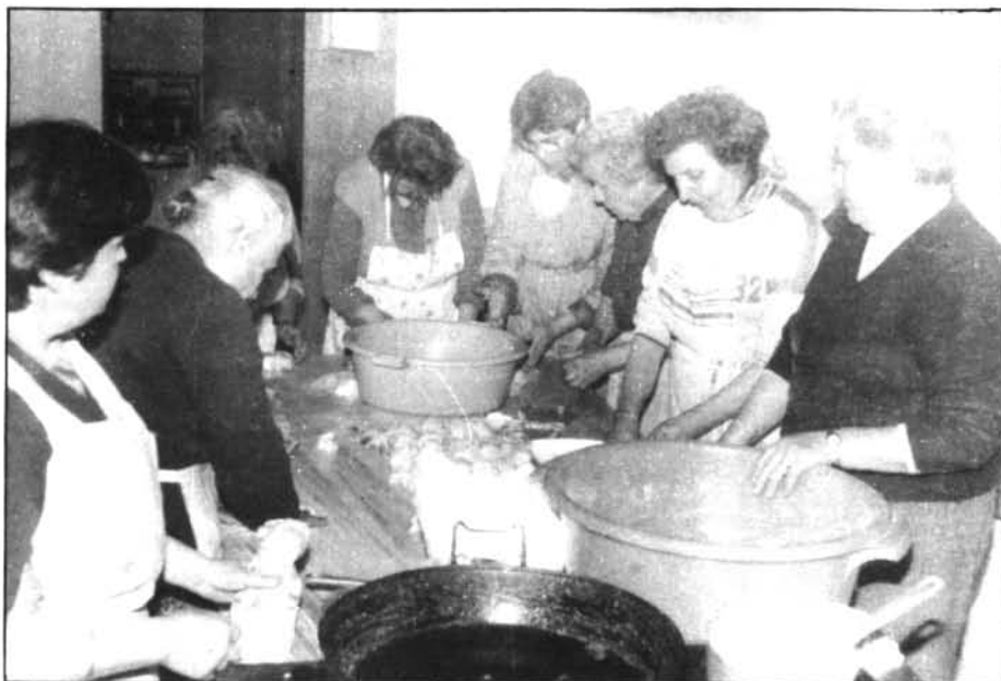
En el menjador de la 3. a Edat la «cosa» anava molt animada preparant les panades de pasqua.