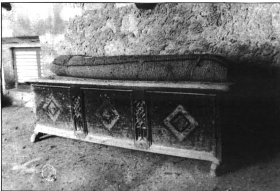
Antiga i vellíssima caixa amb relleus gòtics. (Es trobava en porxo de Ca Ses Monges).