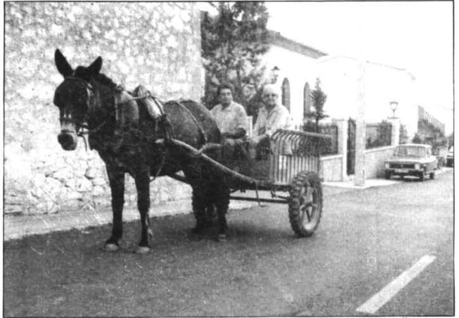
En Biel «Silis» i madò «Xoroia» no deixen les «carreres velles» per les novelles.

Els montuïrers romandran a Catalunya la primera setmana de maig, mentre que els catalans vendran a Montuïri la darrera setmana d'aquest mateix mes.