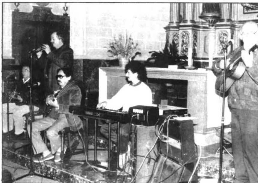
«Els Valldemossa» durant l'actuació de la lliçó musical pels nins de les escoles.