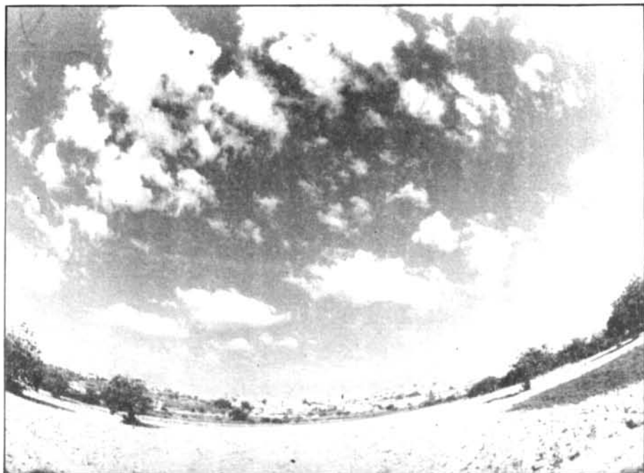
Niguls, conradis, i un Montuiri enfora, d'aquesta manera captat a una foto que no es pot repetir.