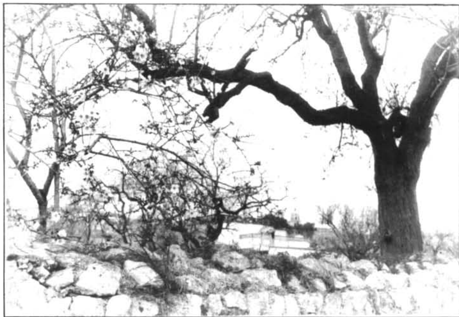
Prop del poble podem veure aquest ametler florit.

També comercialitza productes de les multinacionals