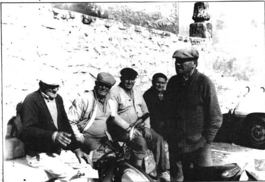
Aquest predis fa bon servei un dia de febrer assolellat.