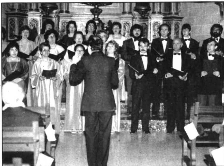
La coral de Sóller «Pro Música Chorus» que vingué a Montuïri el 21 de març amb motiu del «Concert Quaresmal» organitzat per la Federació de Corals de Mallorca.

Sorgí el tema de les aigües brutes, un problema que molts d'Ajuntaments no tenen resolt, ja bé perquè no sabem on s'han de recollir o perquè no disposen de depuradora. Parlarem després de les cooperatives artesanals (del que Montuïri en fou capdavanter), fent-se notar que si es creen sols per aconseguir unes subvencions, a la llarga fracassen: han de tenir una activitat rendable, si volen sobreviure. Respecte al fet de la des població i de l'envelliment dels nostres pobles vérem que és una situació de la qual no se'n fugirà mentre en el poble no hi hagi unes activitats, uns mitjans de guanyar-se la vida i no s'hagi d'anar a fer feina fora de la vila. Si no, els pobles minvaran i sols seran nuclis dormitori i llocs on passar els fins de setmana. I ja a