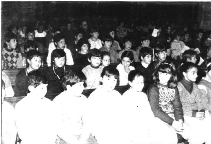
Atents i gojosos els nostres al·lots escoltaven la interpretació d'«Els Valldemossa».