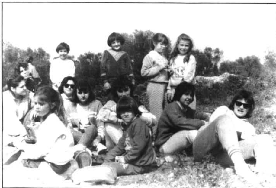
Catequistes i nins a una excursió a Son Fornés.

A les 11,30: Festa Popular a la Plaça des Puig. Tocades de la Banda i ballades animades per les diferents «escoles de balladors».