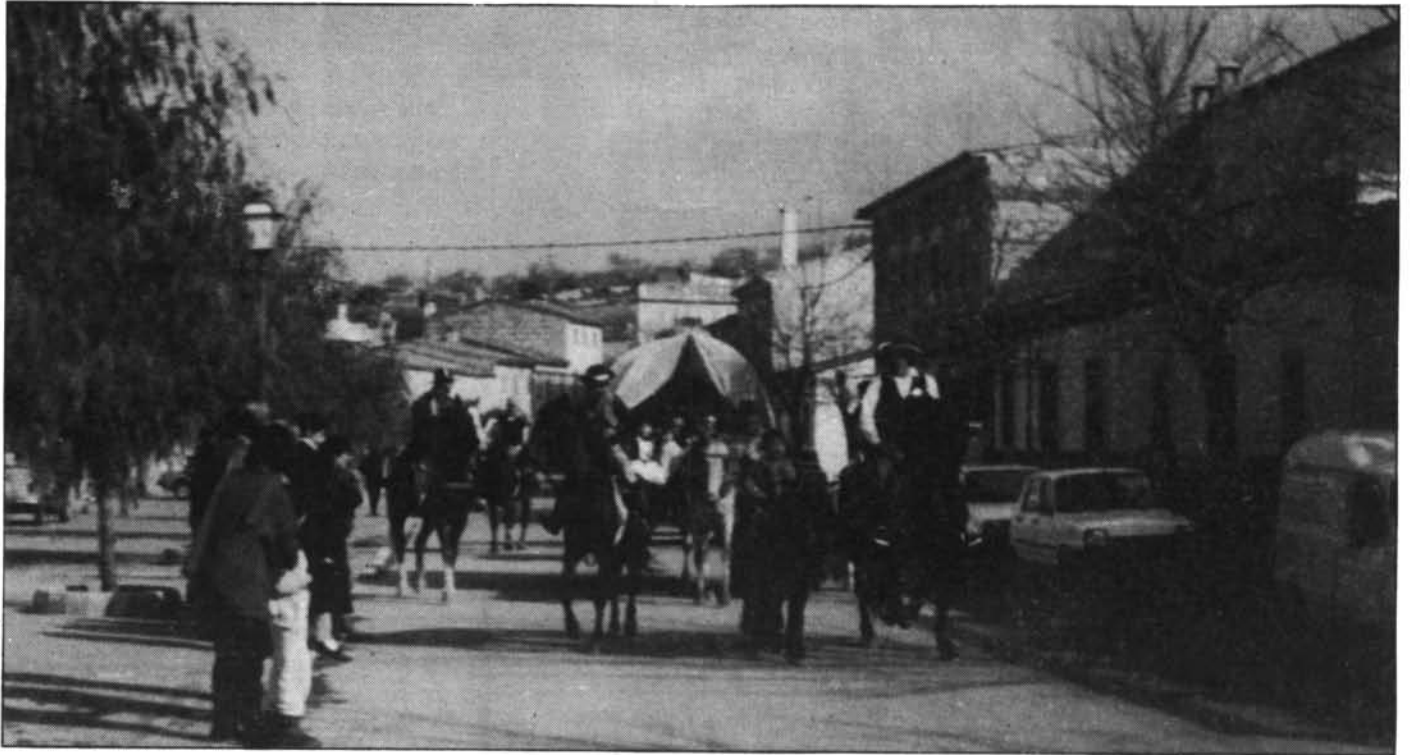
Arribada de la cavalcada. La gent, que esperava espectant, restà dignament acontentada.

És el quart any del que podria dir-se, de la dignificació de les Beneides de Sant Antoni. I han estat quatre ocasions anuals en el transcurs de les quals s'ha anat a més: tant la participació com l'ordre progressivament han millorat i ajudat a que fossin decoroses.