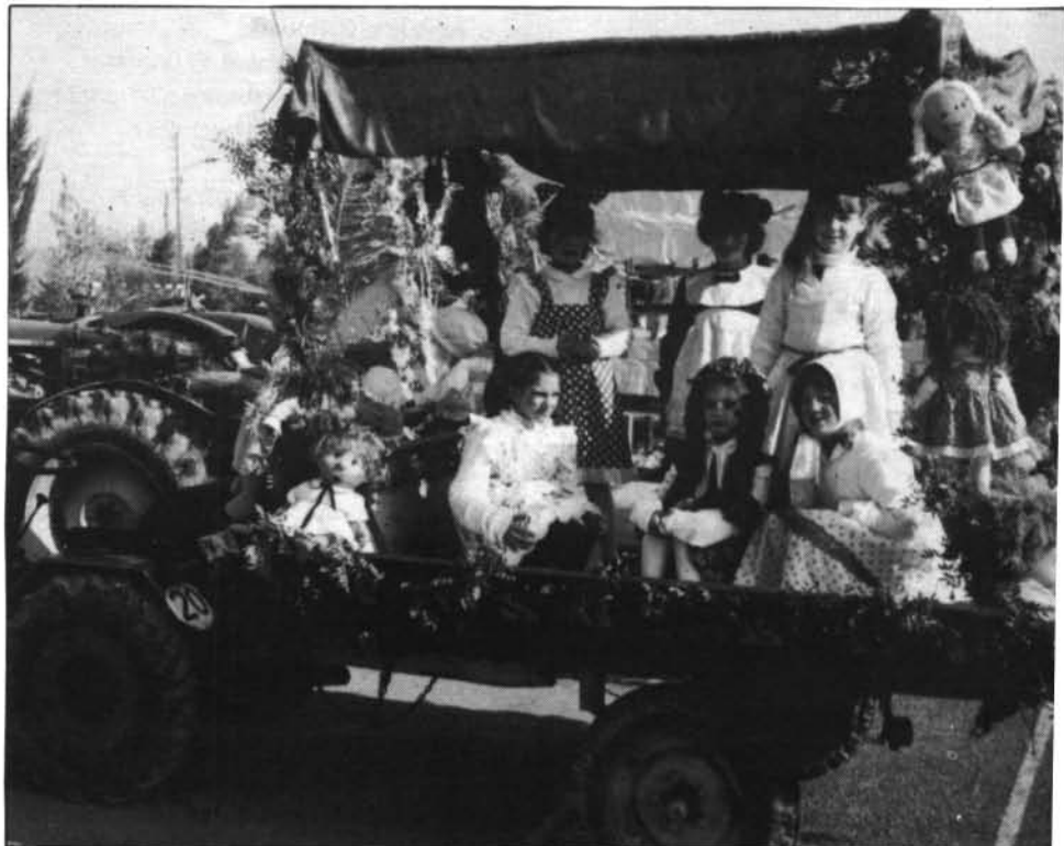
Moltes carrosses, elegantment enllestides, donaren a la festa un aire gojós i simpàtic.

un dia esplèndid, de bon grat la gent en va estar contenta. I els dos foguerons, un a plaça i un altre en Es Dau, serviren per ambientar, des de la nit anterior, la festa de les beneides.