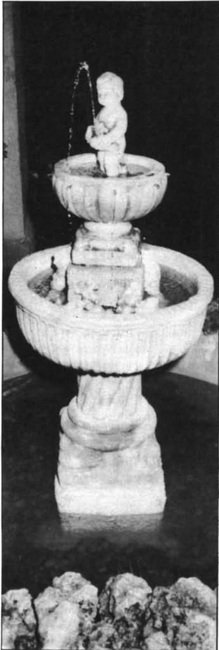
Brollador que es va exposar a la mostra i concurs de cossiols organitzada pel Rellotger a les festes de Sant Bartomeu de 1977, a la qual s'hi presentaren 227 plantes.

—Quines peces són les que més es venen a Montuïri?