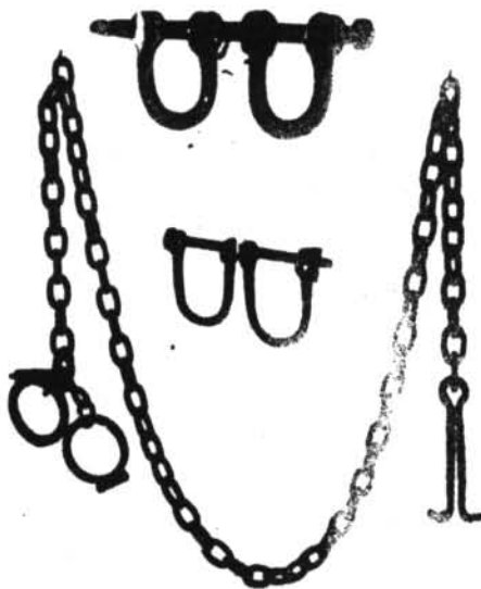
Grillons dels esclaus, exposats a la Societat Arqueològica Lluhiana

(Documents històrics de L'Arxiu Històric — C R III, 80— de la Comunitat Balear) Recollits per Mn. Pere Xamena Fiol