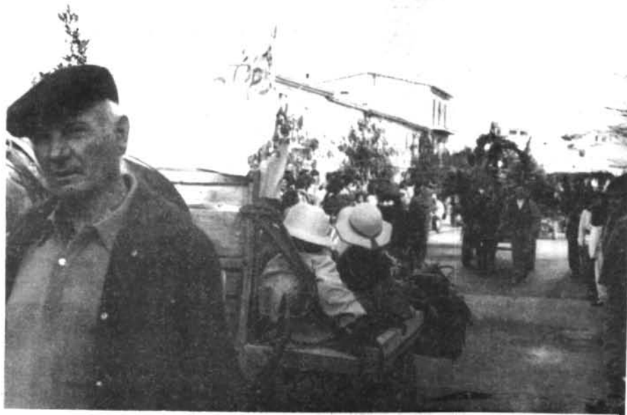
Nins i madurs, joves i vells desfilaren amb les carrosses a les beneïdes de Sant Antoni.

Feu bon temps i tant els participants com els espectadors gaudiren, el diumenge 19 de gener, dins un ambient festós, agradable i sense estridències.