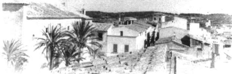
Vista d'oronella de les teulades de la Plaça Major, des del terrat de Ca Ses Apotecàries

Dia 1, dissabte. En la reunió del CONSELL DIOCESA DE PASTORAL es tractà la «Participació en l'Eucaristia dominical», a fi de preparar unes orientacions clares per fer de la Missa una celebració més viscuda. Hi participen tres membres del Consell Parroquial de Montuiri.