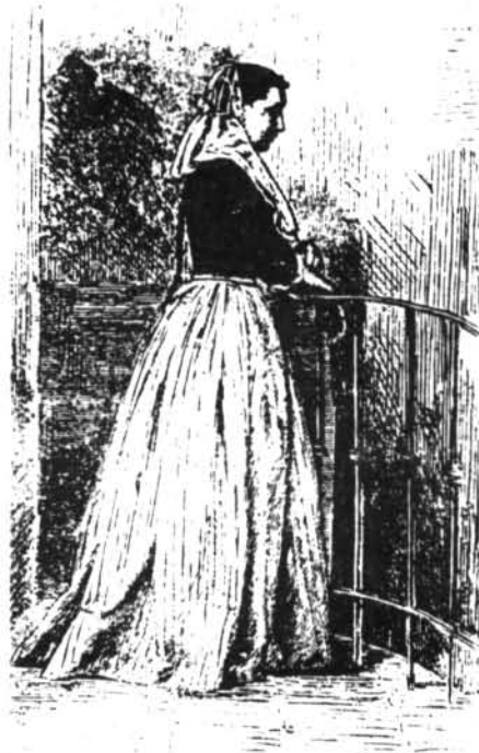
Ai·lota vestida de festa.