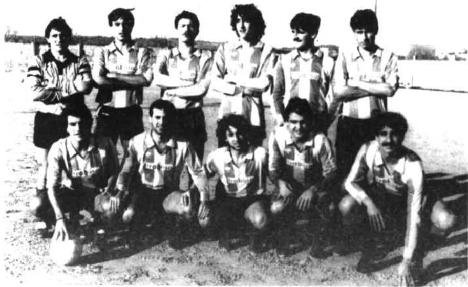
L'equip del C. D. Montuiri el dia que va guanyar al Murense, el passat 19 de gener.