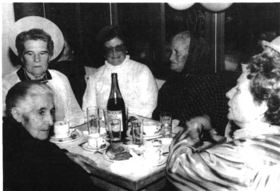
Les nostres «joventes» de la tercera edat no se planyien a l'hora de participar a les festes dels darrers dies de l'any passat.