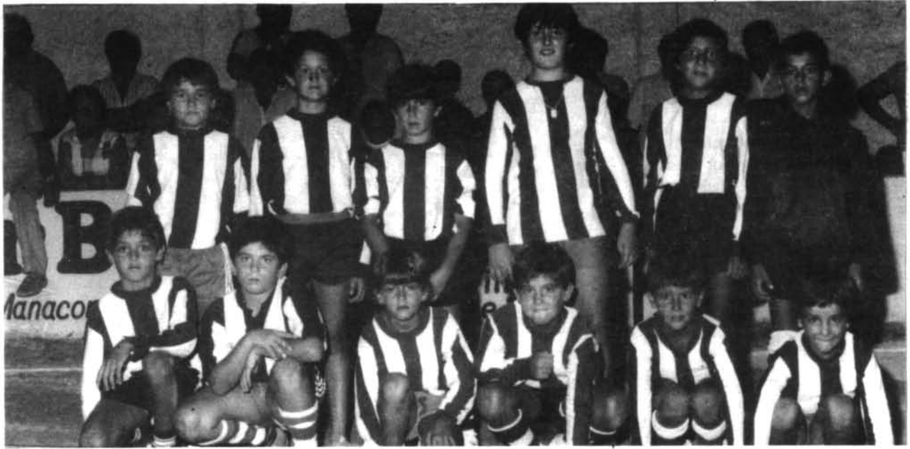
Montuïri benjami i jugadors de futbol base.