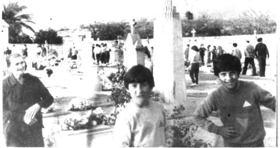
És molta la gent del poble que cada any, l'horabaixa de Tots Sants, acudeix al Cementeri a rendir homenatge als nostres avantpassats difunts.

— La MISSA JOVE se celebrarà els diumenges 3 de novembre i 8 de desembre, a les 11'30.