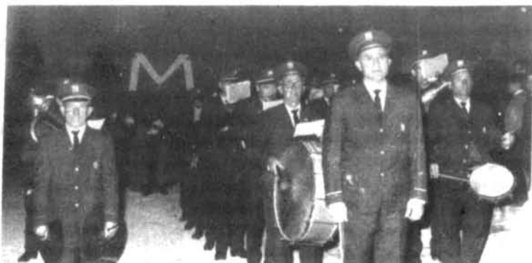
Des de sempre, les processons de l'església es veuen enaltides per la Banda de Música. Vet aquí una de la Setmana Santa de temps enrera.

—Vàrem començar a principis d'hivern a aprendre solfa, i llavors vàrem fer la primera sortida el dia del Còrpus.