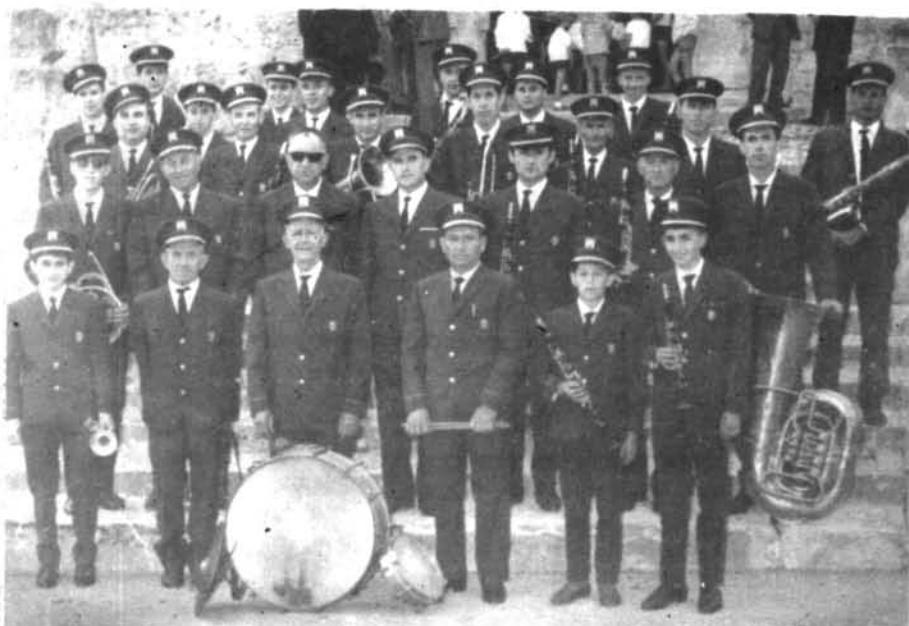
Foto de la Banda de Música de 25 anys enrera.

—Ja hem parlat dels primers directors que vàreu conèixer. ¿Quins directors han anat duent la batuta de la Banda, des de l'any 40?