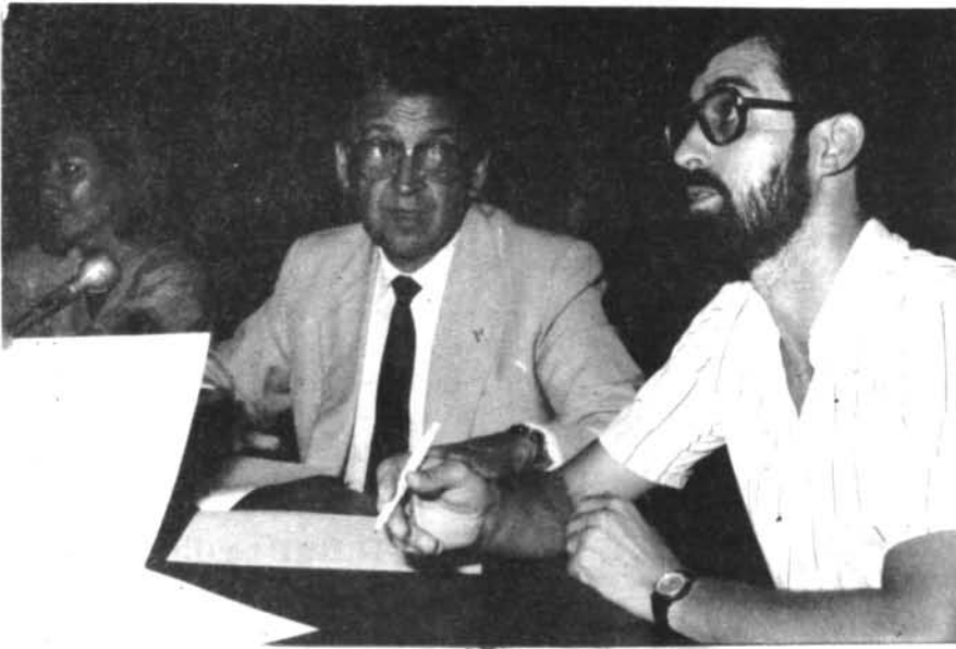
Firma del conveni entre el Centre Coordinador de Biblioteques del Consell Insular de Mallorca i l'Ajuntament de Montuïri.