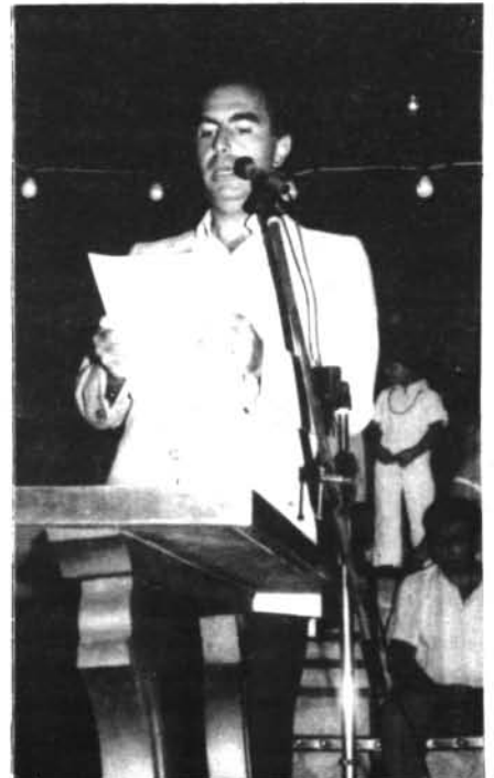
Moment en què el senyor Fèlix Pons, Ministre d'Administració Territorial pronunciava el Pregó de les Festes de Sant Bartomeu el 15 d'Agost.

Va afegir que, a judici seu, «el preu estimat pel Jurat resultava excessiu per a un sòl rústic del terme municipal (de 260 a 300 Pts./m 2 )». Sotmés el tema a consideració del Ple, aquest va concloure «interposar, contra l'acord del Jurat, recurs de reposició, reclamant la fixació de l'apreujament («justiprecio») en la quantitat de 1.078.800 pessetes conforme amb el full d'estim aprovat per la Corporació».