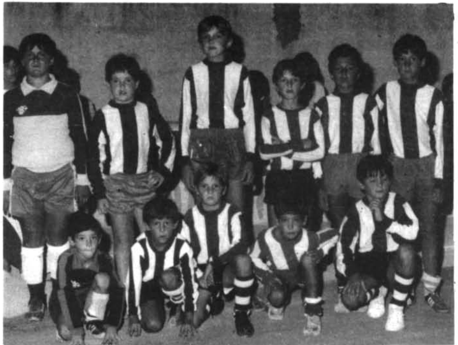
La Cantera futbolística montuïrera en el XIII Torneig de la Llum.