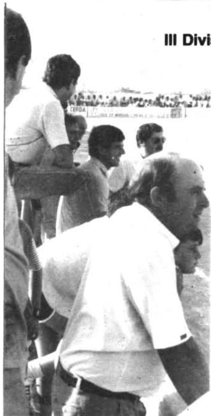
Els espectadors en el camp de futbol no poden negar el seu interès pel desenvolupament del partit.

Feia molt de temps que el C.D. Montuïri no comptava amb tants d'equips federats. Era a la temporada 76-77 en què hi va haver sis equips en competició: Pre-infantils, infantils, pre-juvenils, juvenils, aficionats i regional.