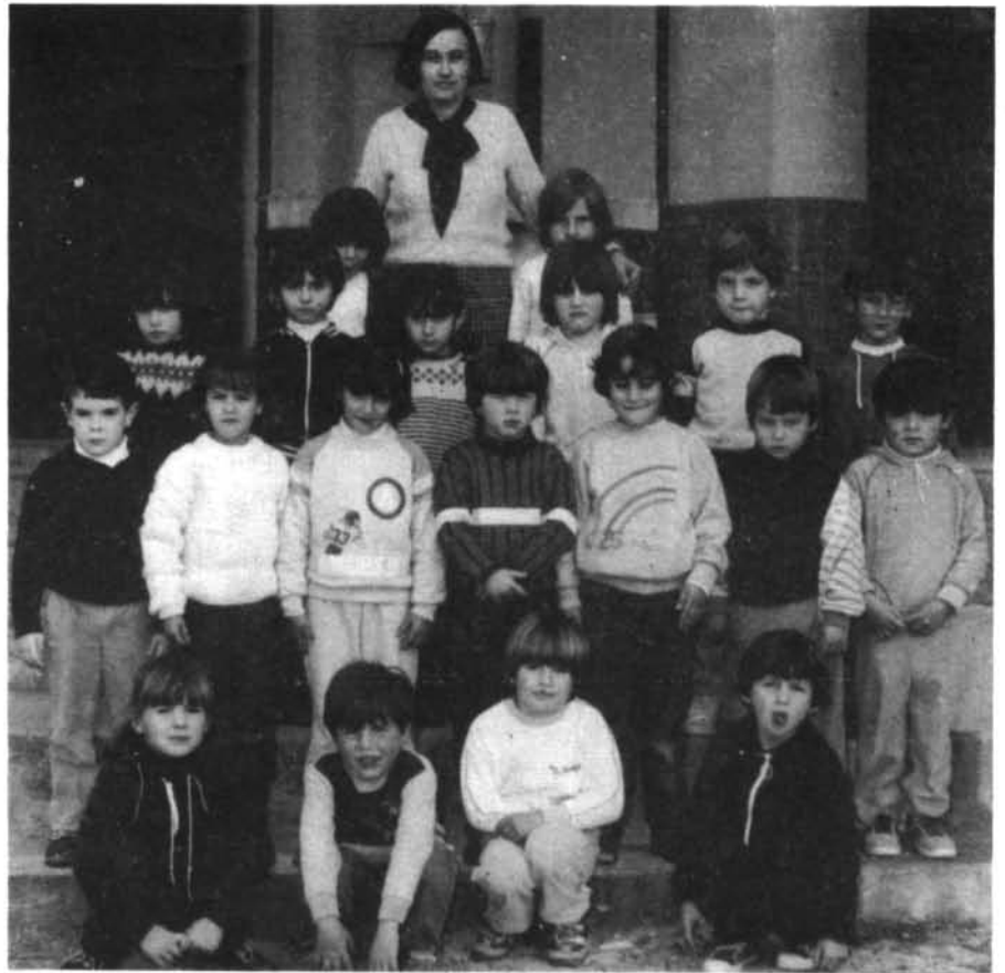
De preescolar ho eren el curs passat, però aquest que ara comença ja aniràn a primer, si no tots, quasi tots: