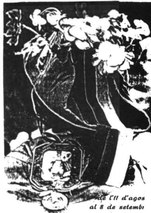
del 11 d'agost al 8 de setembre

tuïri, 4 - Campos, 2 i Montuïri, 0 - Cide B, 6 ( juvenils ); Montuïri, 2 - Constança, 1 (partit únic de III divisió).