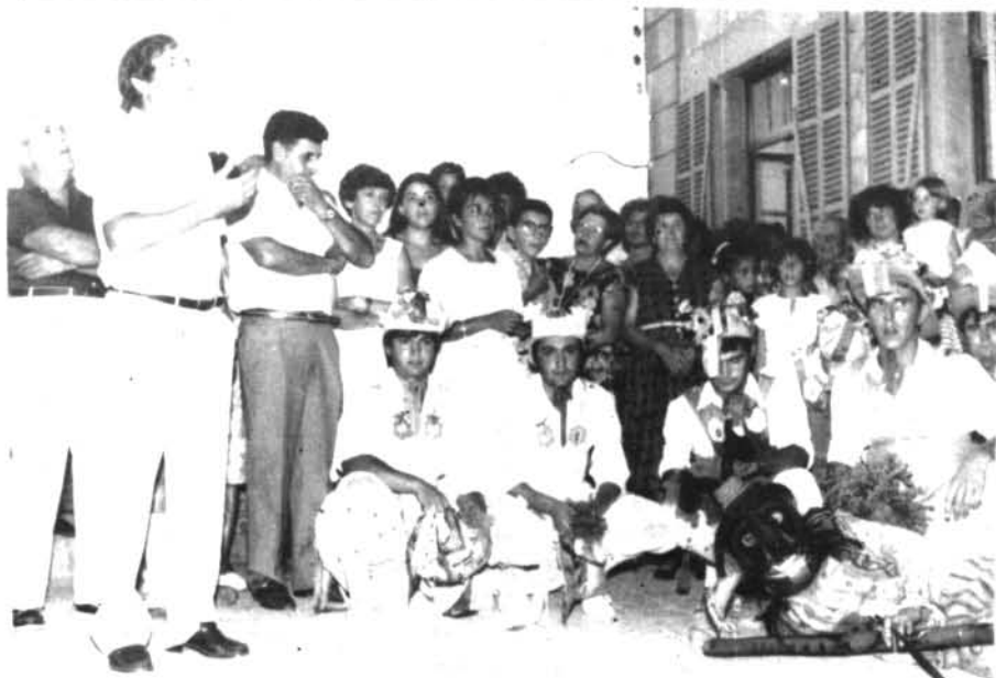
Els «Cossiars i dimoni» volgueren participar a Ca ses Monges a la presentació del projecte d'ampliació del menjador per a la Tercera Edat.

Veient les estadístiques, es comprova que així com passen els dies va augmentant el nombre de persones que s'hi afegeixen.