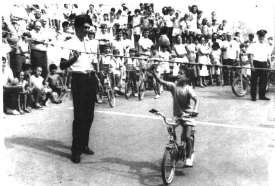
Moment simpàtic de les corregudes de «cintes» pels nins del poble.