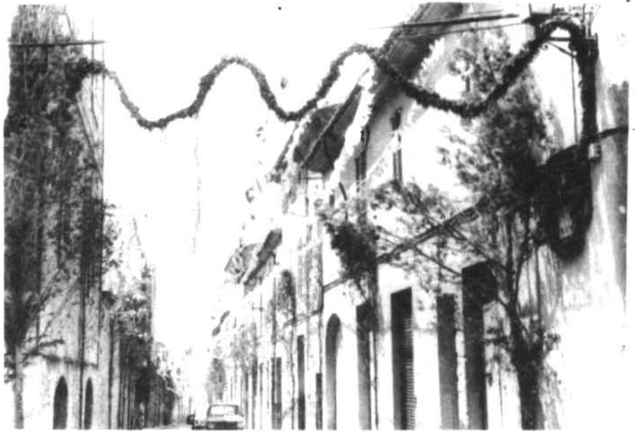
El Carrer de Sant Bartomeu fou així endiuenjat pels mateixos veïnats.