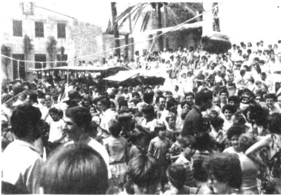
La «gentada» que hi havia a la Plaça a les corregudes de cintes i joies i rompuda d'olles n'es una mostra aquesta foto.