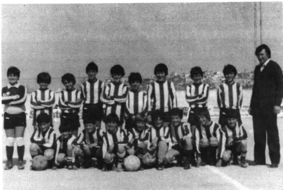
L'equip del «Montuïri» benjamí, campió comarcal de futbol de la temporada 1984-85.

A la sessió del Ple de l'Ajuntament es pren l'acord d'instal·lar el pes públic a la plaça d'Es Dau, al costat dels transformadors.