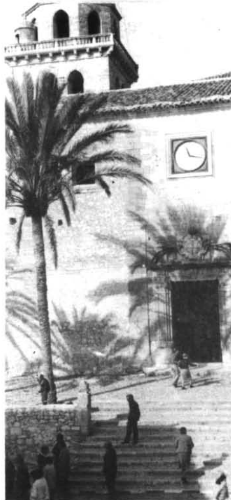
Un diumenge dematí quan manca un quart per a la Missa de les 11,30.

Per Setmana Santa i Pasqua interpretaren peces del Pare Antoni Martorell, Bach, Mozart, Haendel, Arguello, L. T. Victoria i música gregoriana i popular. La Caixa els va editar un programa especial amb motiu d'aquestes actuacions.