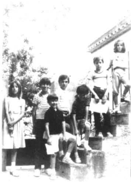
Els al·lots que preparaven la 1.ª Comunió de 1984, en el pati de la Rectoria.

Els dilluns, 6, 13 i 20 de maig, els pares estan convidats a celebrar junts la Penitència, una preparació immediata a l'Eucaristia i una pregària juntament