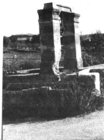
Pou de sa Cova devora sa farinera vella de la carretera de Manacor.

El Consistori va acordar parlar-ne amb Obres Públiques per tal de trobar una solució que podria ser la desviació cap a la carretera de Pina per davant s'Hostal.